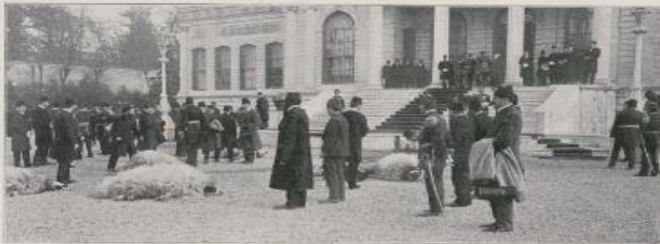
Les sacrifices effectués devant le portail de Dolma Haghena.