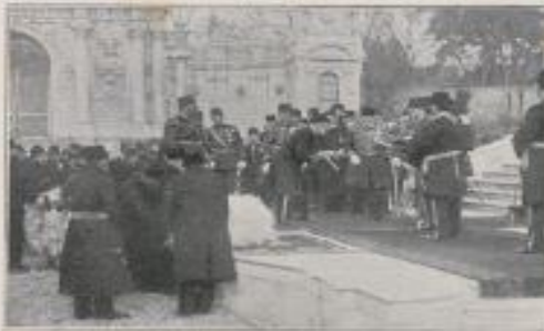
Le salin verse le contenu du sacrifice.