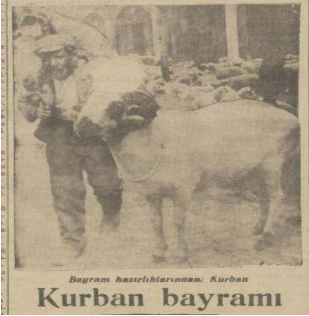
EK – 4: 9 Mayıs 1930 “Milliyet”