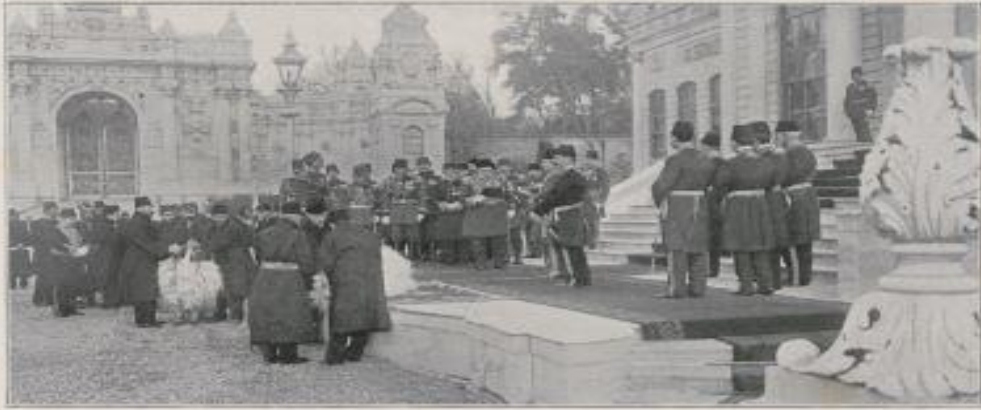
Le maître de la prière officielle pendant que les victimes sont préparées pour le sacrifice.