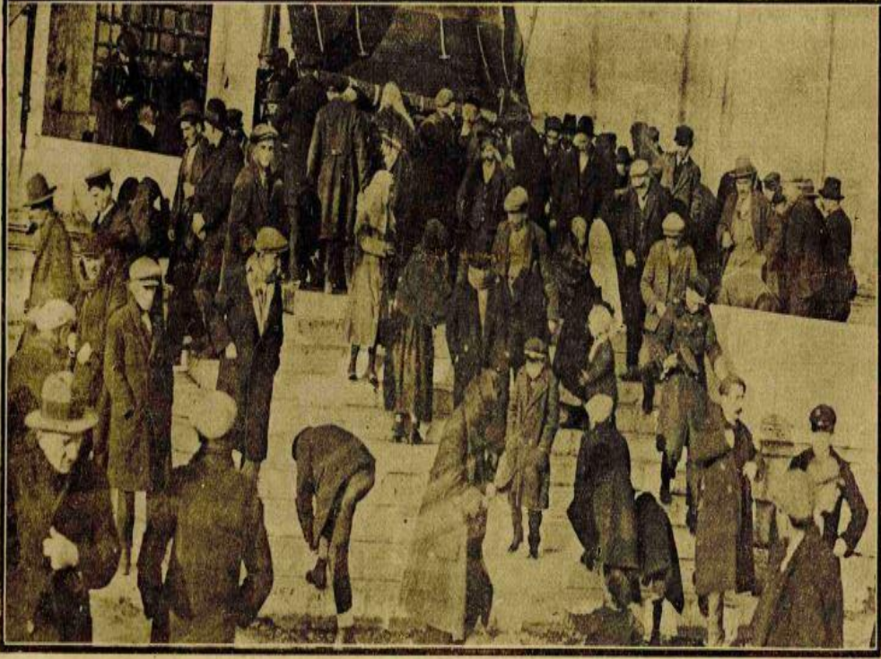
Geçen Bayram sabahı Fatih camii kapısında cemaat Husasi Foto muhabirimizin çektiği bu resim Bayram namazından çıkan kalkı ne iyi gösteriyor