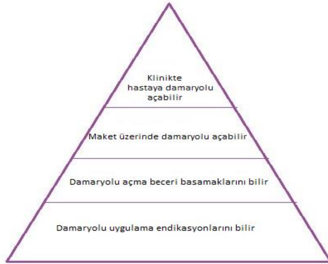
Şekil 2.2. Damar yolu açma becerisinin Miller Piramidi ile örneklendirilmesi

Klinik becerilerin değerlendirilmesinde kullanılabilecek önemli ölçme araçlarından biri olan ve Miller piramidinin üçüncü basamağı olan yapar basamağında yer alan Yapılandırılmış Objektif Klinik Sınav-Objective Structured Clinical Exam (YOKS-OSCE), 1975 yılında ilk olarak Harden tarafından yeni bir değerlendirme aracı olarak tanımlanmıştır. Bu sınav ile öğrencilerin problem çözme yeteneğini, klinik beceri ve tutumlarını tek sınavda değerlendirilmesi amaçlanmıştır (Harden ve ark., 1975). Önceden belirlenmiş klinik yeterlikler kümesinin değerlendirilmesini sağlamaktadır (Gupta ve ark., 2010). Başka bir tanımla anlatmak gerekirse; YOKS, birçok beceri istasyonundan oluşan, simüle edilmiş ortamlarda yetkinlik bazlı performans değerlendirme sınavıdır (Khan & Ramachandran, 2012). Bu nedenle öğrenme çıktıları ya da beklenen yetkinlikler değiştiğinde sınavda yer alan istasyonlar da bu doğrultuda değişir. Literatürde yer verilen çeşitli YOKS tanımlarını baz alarak şu tanımlı önerebiliriz: Öğrencilerin, alan uzmanları tarafından standardize edilmiş ölçekler yardımıyla mesleki beceri düzeylerinin ölçüldüğü istasyon sınavlarıdır.