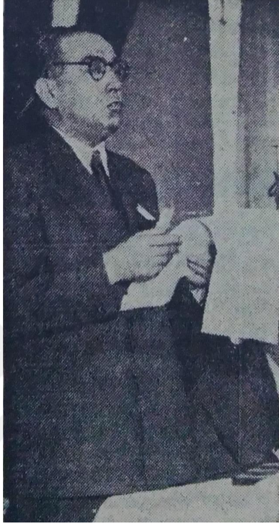
Ahmet Hamdi Bařar Kongre aılıř konuřması yaparken (Hürriyet, 23 Kasım 1948)