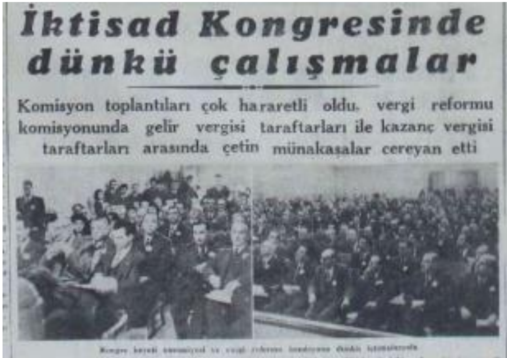
Vergi Reformu Komisyonunun 23 Kasım 1948 tarihli çalışmalarından bir görünüm