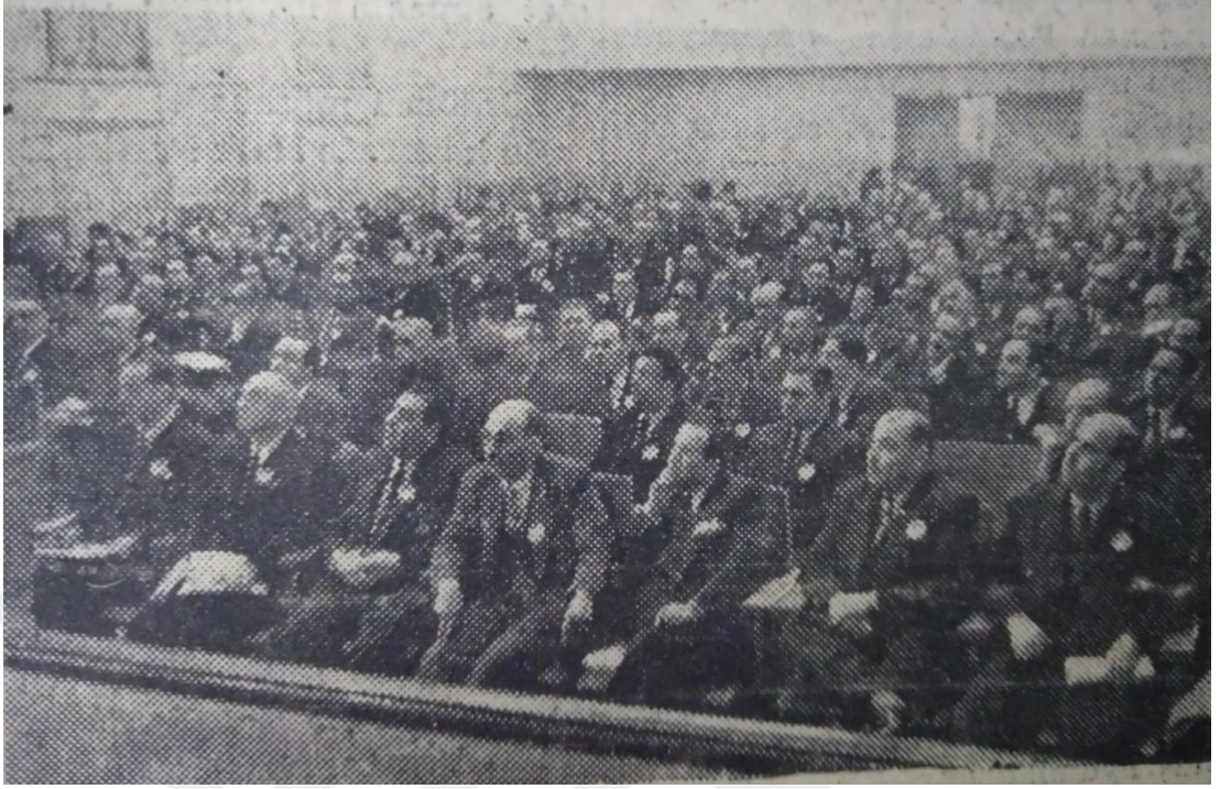
İktisat Kongresi genel kurulunun 23 Kasım 1948'de Eminönü Halkevi salonundaki toplantısından bir görünüm (Vatan, 24 Kasım 1948)