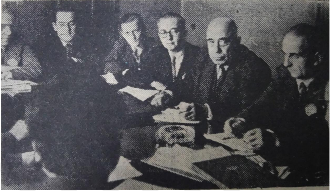
Vergi reformu Komisyonunun 26 Kasım 1948 tarihli toplantısından bir görünüm (Vatan 27 Kasım 1948)