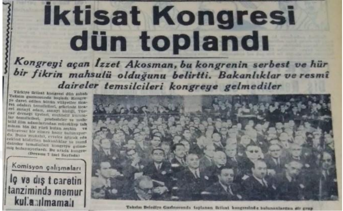
Şekil 2.1. Bakanlıklar ve resmi daire temsilcileri kongreye gelmediler (İktisat Kongresi Dün Toplandı, 1948)

sayfadan 27 görmesi daha başlangıçta bile hükümetin kongreye soğuk baktığını ima etmektedir.