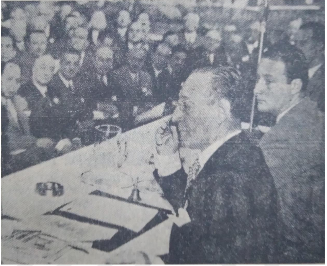
Kongre Başkanı İzzet Akosman 22 Kasım 1948'de Kongre çalışmalarını yönetirken (Hürriyet, 23 Kasım 1948)