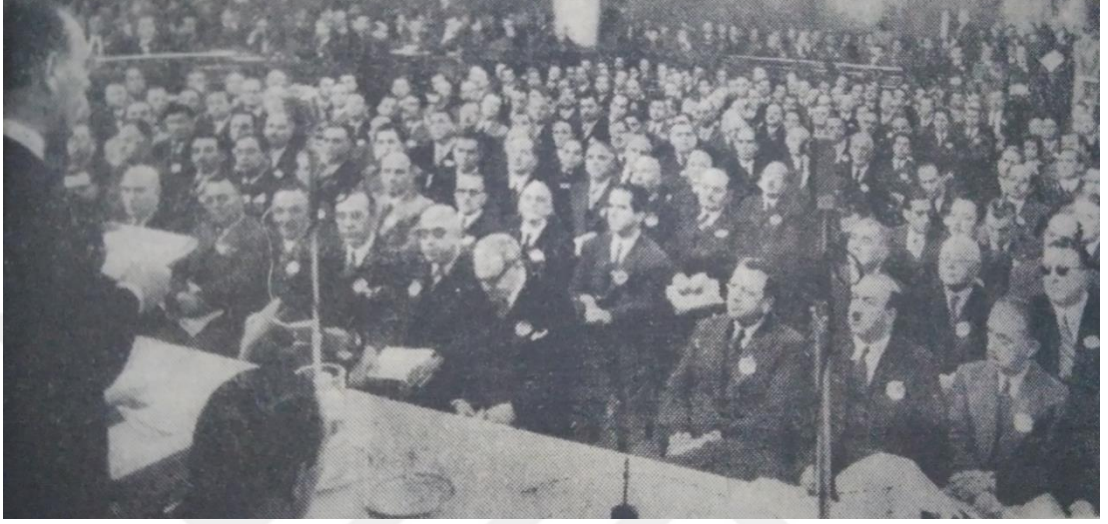
Şekil 3.2. İktisat Kongresinin 22 Kasım 1948 tarihli ilk toplantısından bir görünüm (Toplantılar Başladı, 1948)

(Gürültü İçinde, 1948). Muhtemelen kongreden vergi konusunda istediği neticeyi elde edemeyen İstanbul Tüccar Derneği, tutanakları gizlemiş ya da ortadan kaldırmıştır. Bununla birlikte kongrede meydana gelen gelişmeler gazetelerin çoğuna günü gününe yansıdığı için, kongrede yaşananları buralardan takip etmek mümkündür.