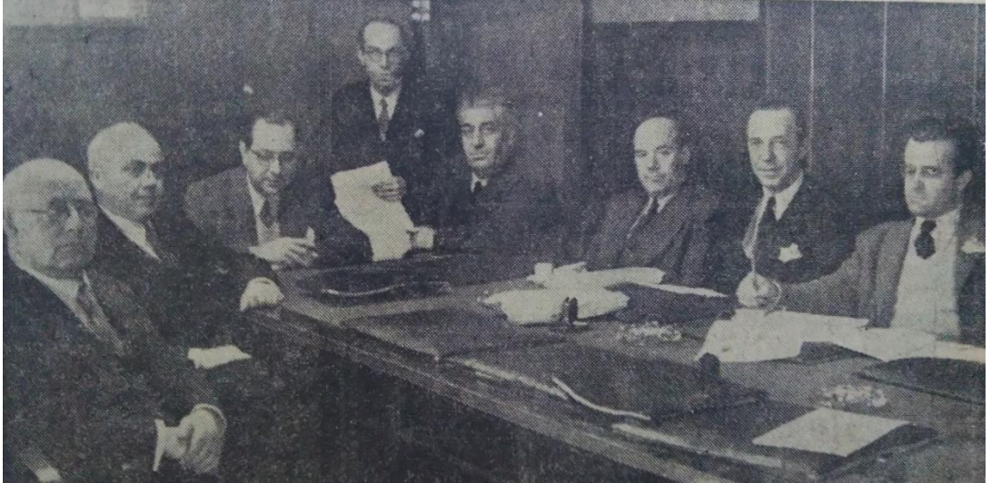
Dış Ticaret Komisyonunun 26 Kasım 1948 tarihli toplantısından bir görünüm. (Hürriyet, 27 kasım 1948)