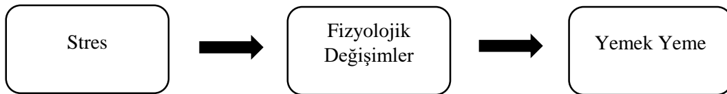
Şekil 1. : Stres ve Yeme İlişkisi (Greeno ve Wing, 1994)

Greeno ve Wing (1994) hayvanların yeme davranışını açıklayan ve yeme davranışında bireysel farklılıklara değindiği iki model ortaya koymuştur. Hayvanların yeme davranışına yönelik oluşturulan ilk modelde stresin önemini vurgulamış ve yeme davranışını etkileyen temel unsurun stres olduğunu ifade etmiştir. Stresin fizyolojik değişimler sağlaması sebebiyle yeme davranışını arttırdığını ortaya koyarak yeme davranışının strese karşı genel bir tepki olduğunu açıklamıştır. Stres, genel olarak organizmanın iyilik halini bozan bir unsur olarak bilinmektedir (Lazarus ve Folkman, 1984; akt. Greeno ve Wing, 1994). Bu model ile stres kaynaklı yeme davranışı için fizyolojik bir açıklama sağlanmaktadır. Şekil 1.’de bu açıklamaya ait modele yer verilmiştir.