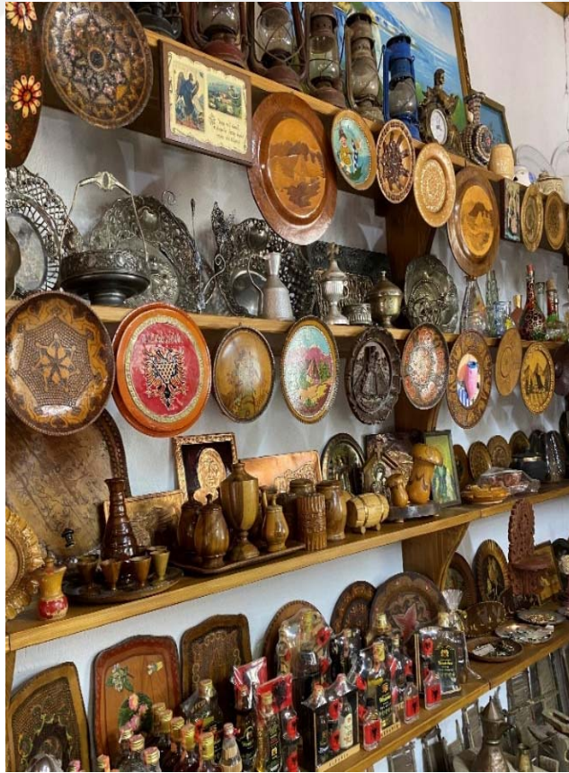
Fotođraf- 8: Çeşitli el sanatlarından yapılmış hediyeelik ürünler. (Bu fotođraf 19.02.2022 tarihinde Kruye ilinde tarafımızca çekilmiştir)