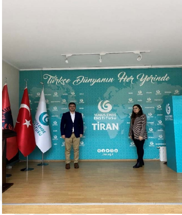
Fotoğraf- 5: Yunus Emre Enstitüsü Tiran Şubesi Ziyareti. (Bu fotoğraf 16.02.2022 tarihinde tarafımızca çekilmiştir.)