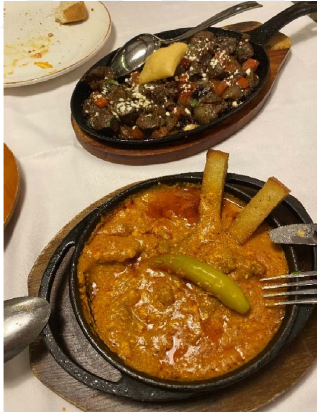
Fotoğraf- 6: Arnavut Çiğeri ve Fergese Yemeği (18.02.2022 tarihinde Tiran'da tarafımızca çekilmiştir.)