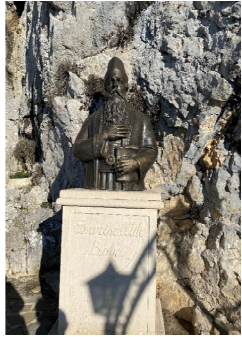
Fotoğraf-3/4: Kruje'de Saru Saltuk'un makamı. (Kruje'de 18.02.2023'te tarafımızca çekilmiştir.)