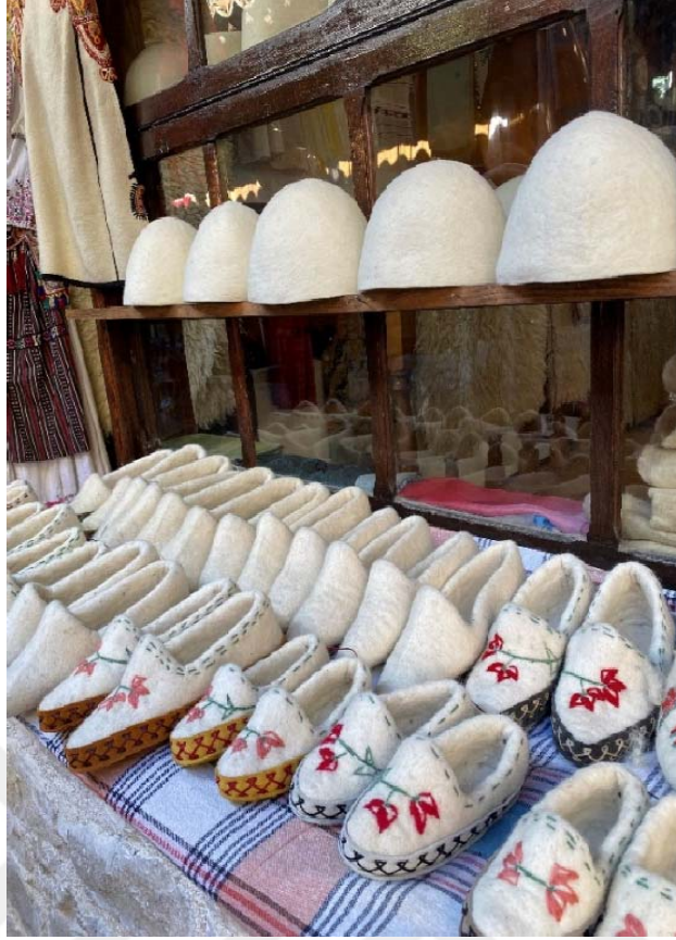
Fotoğraf- 9: Yerel halkın atölyelerde yaptığı el yapımı keçe ürünler. (Bu fotoğraf 19.02.2022 tarihinde Kruye ilinde tarafımızca çekilmiştir.)