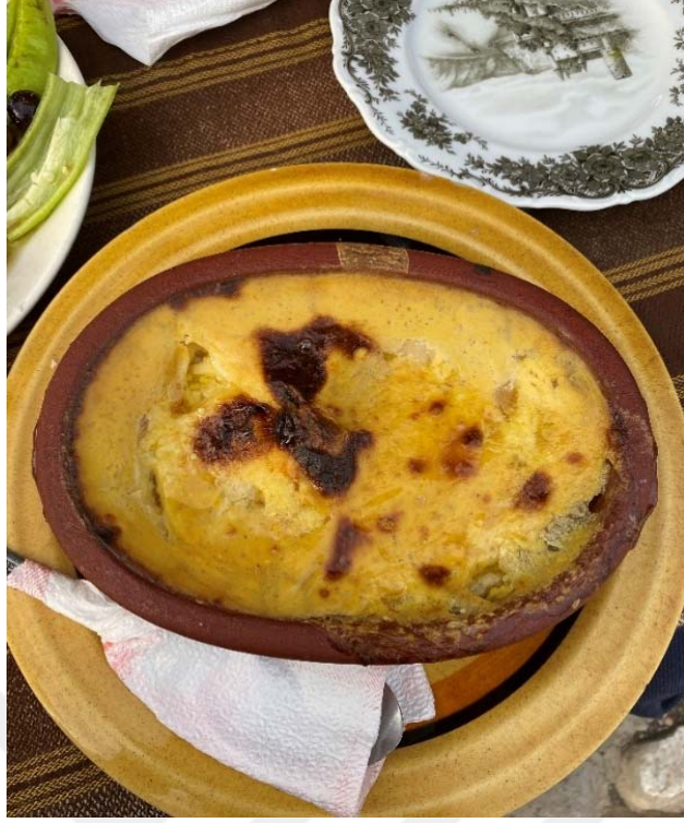
Fotoğraf- 7: Elbasan Tava yemeđi (Bu fotođraf 19.02.2022 tarihinde Elbasan ilinde tarafımızca çekilmiştir.)