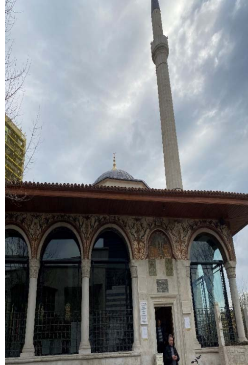
Fotoğraf- 10/11 : TİKA tarafından restore edilen Ethem Bey Camii. (Bu fotoğraf 17.02.2022 tarihinde Tiran'da tarafımızca çekilmiştir.)