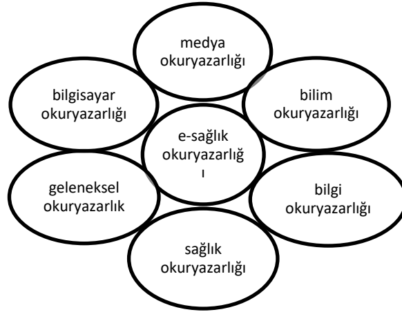
Şekil 2.8.1.1: e-Sağlık Okuryazarlığı Zambak modeli (Norman ve Skinner 2006).

e-Sağlık okuryazarlığının 6 okuryazarlık bileşeni; analitik (geleneksel, medya, bilgi) ve duruma özgü (bilgisayar, bilimsel, sağlık) olmak üzere iki gruba ayrılmıştır (Korku 2021).