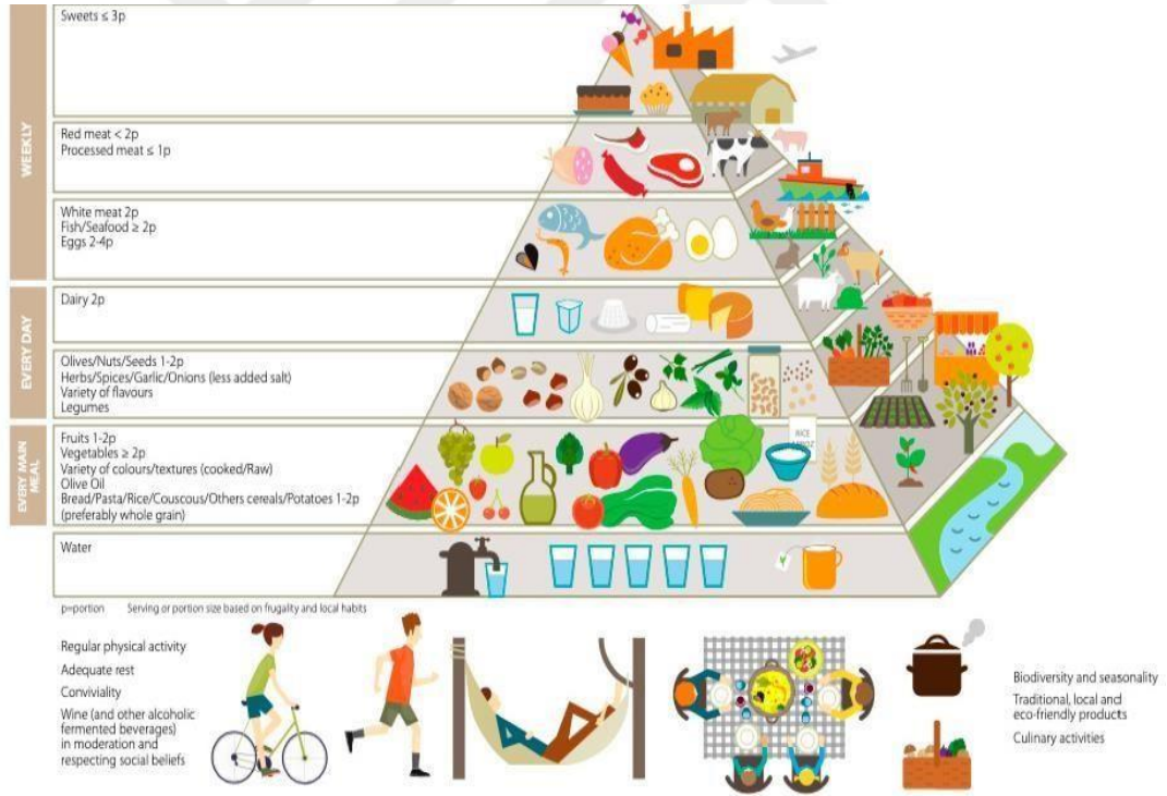
Şekil 2: Akdeniz diyet piramidi (Serra-Majem ve ark., 2020).

Serra-Majem ve ark. (2020), Akdeniz diyet piramidini güncelleyerek revize bir yeni piramit geliştirmişlerdir. Bu yeni piramit de yaşanan Akdeniz bölgesini yansıtan özgü kültürel özellikleri yansıtmamakta, genel öneriler sunmaktadır (Şekil 2) bu piramidi göstermektedir.