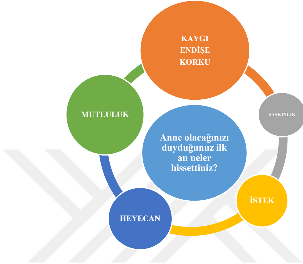
Şekil 4.1: Görme engelli annelerin anne olacağını duyduğu ilk an ki hislerinin şeması

Aşağıda görme engelli annelerin anne olacaklarını duyduğu ilk andaki hislerine kendi ifadeleriyle yer verilmiştir.