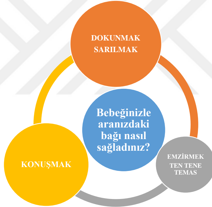
Şekil 4.3: Görme engelli annelerin bebekleri ile kurdukları bağın etkenleri şeması

Görme engelli anneler bebekleri ile aralarında bağ kurarken daha çok fiziksel temasta bulduklarını onlara bol bol sarılıp dokunduklarını ifade etmektedirler. Göz teması kuramadıkları için bunun eksikliğini daha çok konuşarak, bebeği/çocuğu sözel uyarılara daha çok maruz bırakarak bağlılığın sağlandığını ifade etmektedirler. Emzirmek ve ten tene temasın aradaki bağın kuvvetlenmesi noktasında çok faydasının olduğunu ifade eden anneler mevcuttur. Aşağıda bu annelerin kendi ifadelerine yer verilmiştir.