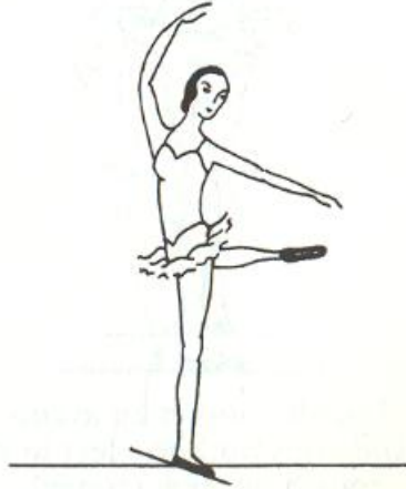
Attitude crois e derri re (Russian).

Hareket destek bacak tam taban, demi point/sur le point üzerindeyken ve plié ile gerçekleştirilebilir. Attitude derrière pozu bar, orta, allegro (zıplama) ve büyük dönüş kombinasyonlarının içinde développ  den a ılarak veya relev   lent ile kaldırılarak yapılabilmektedir. (VAGANOVA, 1969, s. 52),