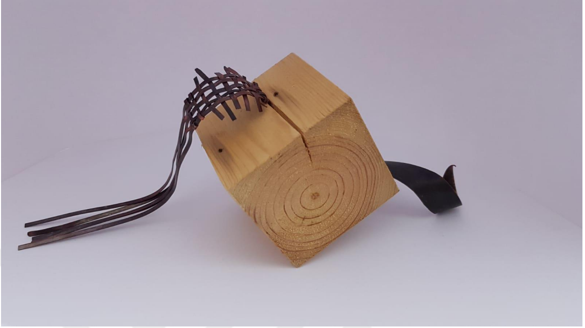
Görsel 2.13. Dönüşüm Adlı Çalışmanın Soldan Görünüşü

(Görsel 2.13) Çalışmanın boyutları 30x11x11 cm'dir. Kompozisyonda çam ağacından oluşturulmuş küp formu, bakır plaka ve teller kullanılmıştır. Çalışmada bakır plaka, küpün alt kısmından geçerek küpün üst yüzeyinden teller halinde çıkış yapmaktadır. Çıkış yapan teller kendi içerisinde bir düzene sahiptir. Teller sepet örgüye dönüşmüş olarak karşımıza çıkmaktadır.