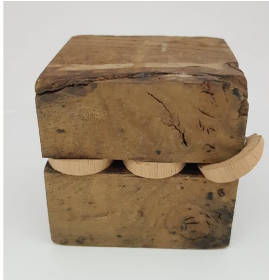
Görsel 2.16. Olgu Adlı Çalışmanın Önden Görünüşü