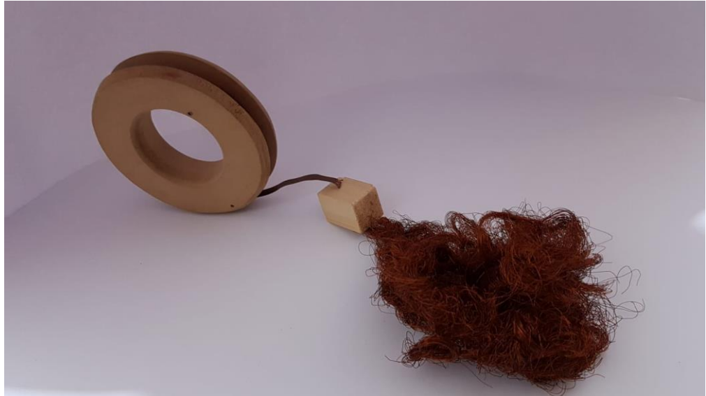
Görsel 2.21. Dönüřüm Adlı alıřmanın Soldan Görünüřü