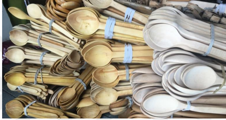
Görsel 1.14. Trabzon da El Sanatları Oyma Tahta Kaşıklar

Günlük hayatta kaşıklar çeşitli alanlarda kullanılmıştır. Kullanım alanlarına göre, çorba kaşığı, bal kaşığı, hoşaf kaşığı, pilav kaşığı, kazan kaşığı, süs kaşığı, kavurma kaşığı, tatlı kaşığı, dağıtma kaşığı, oyun kaşığı, kahve kaşığı ve tencere kaşığı gibi farklı adlandırmalar almıştır (Görsel 1.14). Tüm bu adlandırmalar, kaşıkların farklı alanlarda ihtiyaç duyulmasından dolayı kaşık kullanımının önemli olmasını doğurur. Hatta bu durumda kaşıklar, kullanım amacına göre çeşitli şekil ve ebatlarda olmak üzere farklılık gösterir (Özbel, 1949: 3).