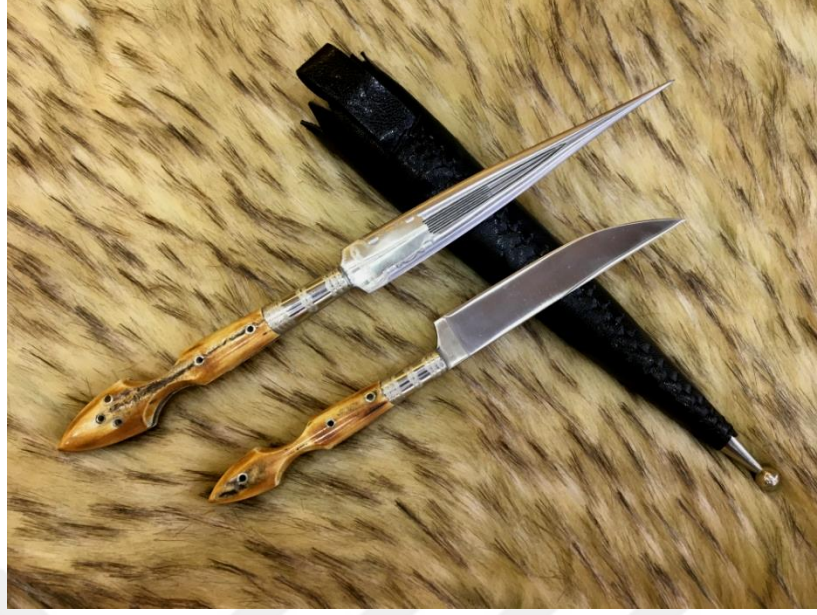
Görsel 1.5. Trabzon'da El Sanatları Sürmene Bıçağı

Trabzon'un Sürmene ilçesiyle özdeşleşmiş bıçakçılık sanatı Türkiye'deki diğer illere göre imalathanelerin yerine bıçakçılık sanatları için bıçak evlerine sahiptir. Bıçakçılık sanatında kullanılan araç gereçler ile aletleri de kendileri üretirlerdi (Bıçakçı, 1963: 114). Sürmene'de üretilen bıçaklar sanatın ince işçiliklerine ve kullanılan ham maddenin kaliteli olarak kullanılması göz önünde olarak, bıçağa ait sap kısmının düzgün olma, ucunun ince ve sivri olma özelliği ile özgün özelliklere sahiptir (Akbulut, 2004: 142-153).