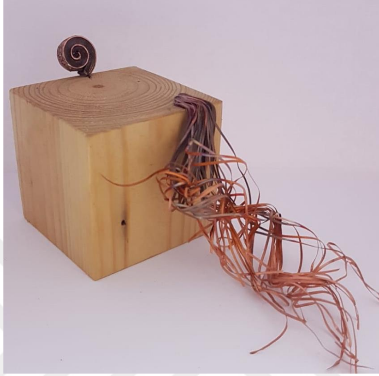
Görsel 2.3. Çatı Adlı Çalışmanın önden Görünüşü

(Görsel 2.3) Çalışmada oluşturulan kompozisyon da 8x8x8 cm boyutlarında çam ağacından oluşturulan form zeminde sabit bir adet küptür. Küpün üst yüzeyinin sağ alt köşesinde; bakır tellerden oluşturulmuş, hareketli, karmaşık gözükmese de içinde belli bir düzen taşıyan birçok teller mevcuttur. Bu teller kendi içinde, devamlılık ve çok yönlü özellikli hareketler taşıırken aynı zamanda küp formu ile etkileşim içindedir. Küpün üst yüzeyinde birçok teller ile oluşturulmuş formu karşılayan küpün üst yüzeyinin köşesinde, tellere paralel yine başka bakır teller ile oluşturulmuş form spiral etkisinde tek parçadan oluşan form bulunmaktadır. Kullanılan malzemeler yöresel sanatlarında kullanılan malzemeler ile oluşturulmuş küp durağanlığı, telleri ile oluşturulan iki ayrı formda hareketliliği anlatması hedeflenmiştir. Kompozisyon bölgeye ait olan; aynı zamanda devamlı gelişen ve bölge ekonomisine katkılar sunan bölge sanatlarını ifade etmektedir.