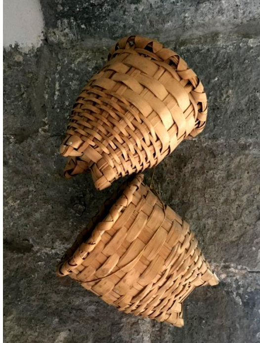
Görsel 1.18. Trabzon da Yöre Sanatları Fındık Sepeti örneđi

Türkiye de bitkisel örücülük yoluyla mutfakta kullanılmak üzere eşyalar, mobilyalar, sepetler, dekorasyonda kullanılan aksesuarlar üretilmektedir (Görsel 1.17). Sepet örme işlemi halen Trabzon'da yapılmaya devam edilmektedir.