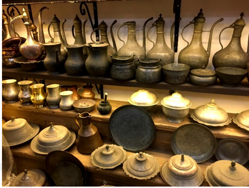
Görsel 1.6. Yörede Kullanılan Bakır Araç Gereç Örnekleri

Trabzon kültüründe olduğu gibi Anadolu kültüründe de bakırcılık önemli bir yer tutmaktadır. Anadolu’da kap kaçak üretiminde, takılarda, miğfer yapımında, kapılarda ve bunun gibi yapı malzemelerinde kullanılan bakır şekillendirilmeye ve süslemeye çok uygun bir madendir (Karadeniz, 2009: 21).