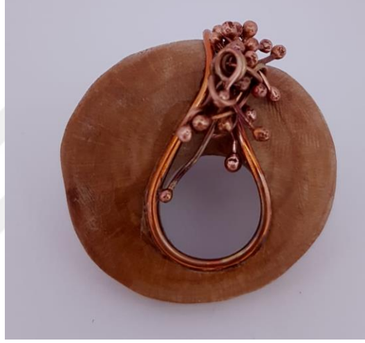
Görsel 2.10. Maden Yatağı Adlı Çalışmanın Üstten Görünüşü

(Görsel 2.10) Çalışmada bakır ve fındık ağacı malzemelerinden yararlanılmıştır. Ölçüleri 6x5x4cm olan incir ağacının kesinti alınarak oluşturulan bir formdur. Oluşturulan formun kesitinde bir boşluk bulunmaktadır. Oluşturulan boşluğun üst kısmı bakır telle çevrelenmiştir. Çevrelenen telin birleşme noktasında, her iki ucu yan yana gelecek şekilde birleşerek oymanın kenarlarından aşağıya doğru devam etmektedir. Devam eden bakır telin son bulduğu noktalara damla formu verilmiştir. Telin etrafını saran aynı zamanda telin birleşme noktasında benzer forumlarda oluşturulmuş uçları damla şeklinde olan birden fazla metaller bulunmaktadır.