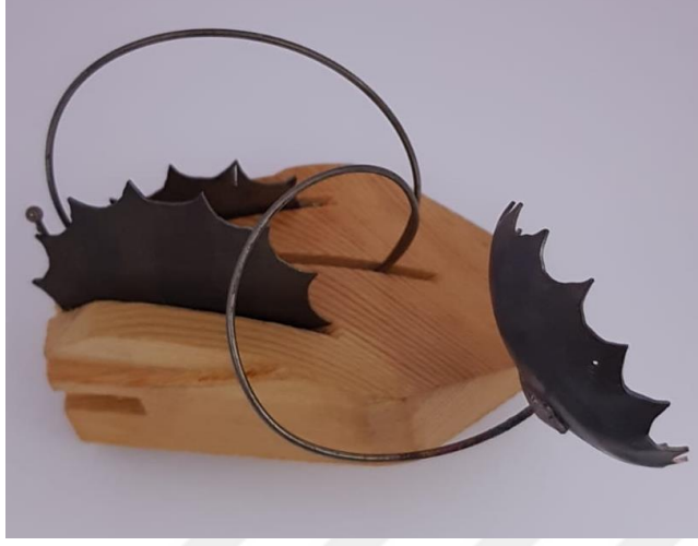
Görsel 2.5. Etkileşim Adlı Çalışmanın Soldan Görünüşü

(Görsel 2.5) Çalışmada kullanılan malzemeler yörede en çok bulunan ağaç türü olan çam ağacı ve metal olarak Alpaka kullanılmıştır. Ölçüleri 10x10x9 cm'den oluşmaktadır. Çam ağacından oluşturulan forum bilgisayar mouse formundadır. Mouse formundaki ağaç üzerinde yaklaşık olarak 1 cm kalınlığında, 2 mm genişliğinde farklı uzunluklarda üç ayrı oluk oluşturulmuştur. Oluklarda; iki yanında kalan boşluktan çıkan plakadan oluşturulan stilize edilmiş güneş formu bulunurken, orta kısımda hareket etkisi veren alpaka tel kullanılmıştır. Kullanılan alpaka telin ucunda stilize edilmiş güneş kullanılmıştır. Telin ucunda kullanılan form çanak şeklindedir. Çalışmada oluşturulan formlar ile teknoloji ve sanatın ilişkisi vurgulanmak istenmiştir.