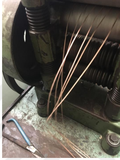
Görsel 1.12. Telkari Teli Hazırlanma Aşaması

dolayı kalitede artmaktadır. Gümüş ile üretilen ürünler her kitle tarafından alınabildiğinden günümüzde kazaz işiyle yapılan ürünlere arz ve talebi artırmıştır. Kazaz işini meslek olarak yapan ustalarla birlikte çalışan ara elemanlar içerisinde güvene yönelik ekip işlerinin olduğu, üretilen siparişin pazarlaması yapılırken ücretin en kısa sürede alınması ekipler içerisinde güven olduğunu kanıtlar niteliktedir (Okyay, 2008: 33).