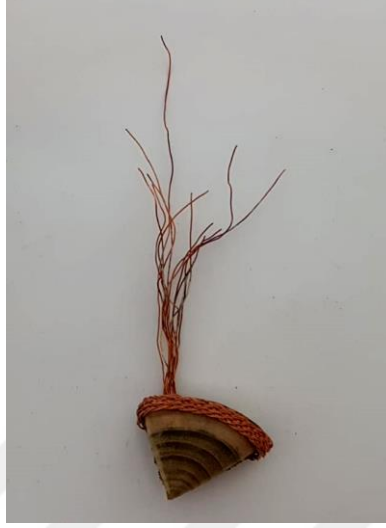
Görsel 2.18. Döngü Adlı Çalışmanın Üstten Görünüşü

(Görsel 2.18) Kompozisyonda ağacın kesintindeki renk ve ton geçişleri özelliğinden faydalanılmıştır. Sepet örgü tekniğinin metal tel ile örülerek kullanılması yöre sanatlarının birbirleriyle etkileşimde olduğu vurgulanmıştır.