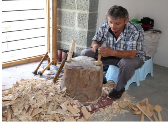
Görsel 1.15. Trabzon da El Sanatları Oyma Tahta Kaşık Ustası

Teknik olarak bakıldığında kaşık ağız ve sap olmakla birlikte iki ayrı kısımdan oluşmaktadır. Kaşıklar üretilirken bazılarının sap ve ağız kısımları ayrı ayrı yapılırken bazı kaşıklarda ise sapları ve ağız kısımları aynı malzemeden üretilmiştir (Kunduracı, 1997: 109).