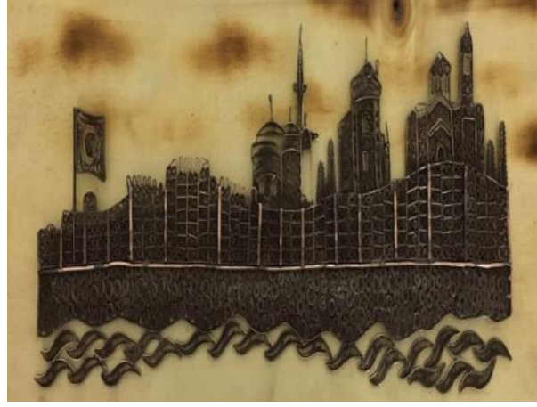
Görsel 1.13. Trabzon Siluet Telkâri Pano

Trabzon el sanatları arasında telkari tekniği de yer almaktadır (Görsel 1.13). Altın ve gümüş metaller ile kullanıldığı gibi bakır ve bakır üzeri gümüş kaplamayla süs eşyaları yapılmaktadır. Aynı zamanda sadece telkari tekniği tek başına yapılmasının yanında kuyumculuğa ait diğer teknikler ile de birleştirilerek ürünler yapılmaktadır. Trabzon'a özgü hasır örme tekniği ile yapılan takı detaylarında; örneğin kemerlerin tokalarında, hasır bilezik ve gerdanlıklarında bulunan kilit sistemlerinin modellenmesinde telkâri teknikleri de kullanılmaktadır (Büyükyazıcı, 2008: 35).