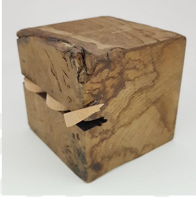
Görsel 2.15. Olgu Adlı Çalışmanın Önden Görünüşü