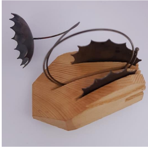
Görsel 2.6. Etkileşim Adlı Çalışmanın Sağdan Görünüşü

(Görsel 2.5) Çalışmada kullanılan malzemeler yörede en çok bulunan ağaç türü olan çam ağacı ve metal olarak Alpaka kullanılmıştır. Ölçüleri 10x10x9 cm'den oluşmaktadır. Çam ağacından oluşturulan forum bilgisayar mouse formundadır. Mouse formundaki ağaç üzerinde yaklaşık olarak 1 cm kalınlığında, 2 mm genişliğinde farklı uzunluklarda üç ayrı oluk oluşturulmuştur. Oluklarda; iki yanında kalan boşluktan çıkan plakadan oluşturulan stilize edilmiş güneş formu bulunurken, orta kısımda hareket etkisi veren alpaka tel kullanılmıştır. Kullanılan alpaka telin ucunda stilize edilmiş güneş kullanılmıştır. Telin ucunda kullanılan form çanak şeklindedir. Çalışmada oluşturulan formlar ile teknoloji ve sanatın ilişkisi vurgulanmak istenmiştir.