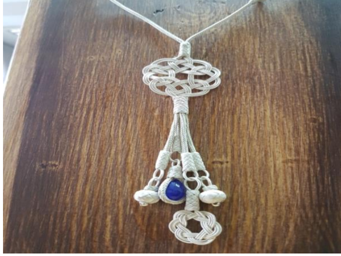
Görsel 1.11. Trabzon Kazaz Örme Kolye

Trabzon'da kazazlık ya da kazaziye adları ile ifade edilmektedir. Kazazlık el sanatı, ipek tel üzerine saç teli inceliğinde altın ve gümüş telin sarılmasıyla oluşturulan tellere metal özellik kazandırılarak oluşan iplikler ile üretilen örgüden oluşan bir sanattır. Kazazlık sanatının tarihi ile ilgili 16. Yüzyıla ait tarihi eserlerdeki ürünlerde kazazlık örgü teknikleri kullanıldığı görülmüştür. Geçmişe bakıldığında kazazlık örme tekniği tespih kamçılarında, şal kenarında, feslerde, eldiven ve çeşitli ürünlerde, giysilerin düğmelerinde, atların koşum takımlarından, deri ürünlerdeki işlevsel aksesuarlarda kullanılmıştır. Kazazlık örgü tekniklerini kuyumculuğun dışında farklı alanlarda farklı malzemelerden oluşan alanlarda da tekstil ve deriden oluşan ürünlerde de kullanıldığını görmek mümkün olup farklı alanlarda da görülmektedir (Büyükyazıcı, 2008: 36-37).