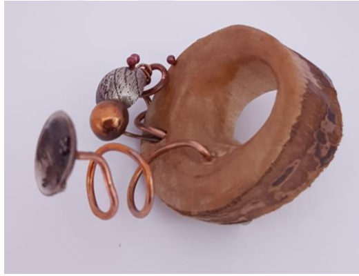
Görsel 2.8. Gölge Adlı Çalışmanın Sağdan Görünüşü

(Görsel 2.7) Oluşturulan kompozisyonda fındık ağacı ve bakır formlar kullanmıştır. Çalışmanın ölçüleri 5,5x6x6 cm 'dir. Kullanılan ağaç kesitinin kalınlığı açılı ve eğimlidir. Kalınlığına süzme verilmiştir. Eğimli parçanın ortasında oluşturulan oyğun ön yüzüne oyma işlemi ile form verilmiştir.