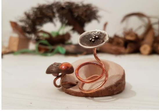
Görsel 2.7. Gölge Adlı Çalışmanın Önden Görünüşü

(Görsel 2.7) Oluşturulan kompozisyonda fındık ağacı ve bakır formlar kullanmıştır. Çalışmanın ölçüleri 5,5x6x6 cm 'dir. Kullanılan ağaç kesitinin kalınlığı açılı ve eğimlidir. Kalınlığına süzme verilmiştir. Eğimli parçanın ortasında oluşturulan oyğun ön yüzüne oyma işlemi ile form verilmiştir.