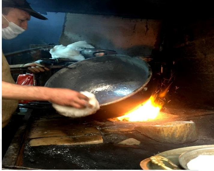
Görsel 1.9. Trabzon'da El Sanatları Kalaycılık Ustası

kullanıma getirilmiştir. (Görsel1.8.) Bundan dolayıdır ki günlük yaşam alanlarında mutfakta kullanılan bakırlarda kesinlikle kalaylama işlemi yapılmalıdır. Kalay görünüş olarak gümüş rengine benzemektedir. Yiyeceklerdeki asitler oda sıcaklığından etkilenmediğinden dolayı genellikle konserve kutuları yapımında kullanılmıştır (Yukarıkozan, 2009: 21).