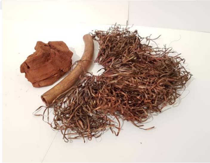
Görsel 2.19. Dokunuş Adlı Çalışmanın Soldan Görünüşü

(Görsel 2.19) Boyutları 22x20x5 cm olan çalışmada metal bakır ve ardıç ağacı kullanılmıştır. Amorf doğal hali ile kullanılmış ağaç parçanın alt tarafında; ön yüzüne dönük olacak şekilde yerleştirilmiş bakırdan içi boş boru şeklinde form yer almaktadır. Metal boru yarım ay şeklindedir. Yöre kuyumculuğunda telkari tekniğinde kullanılan