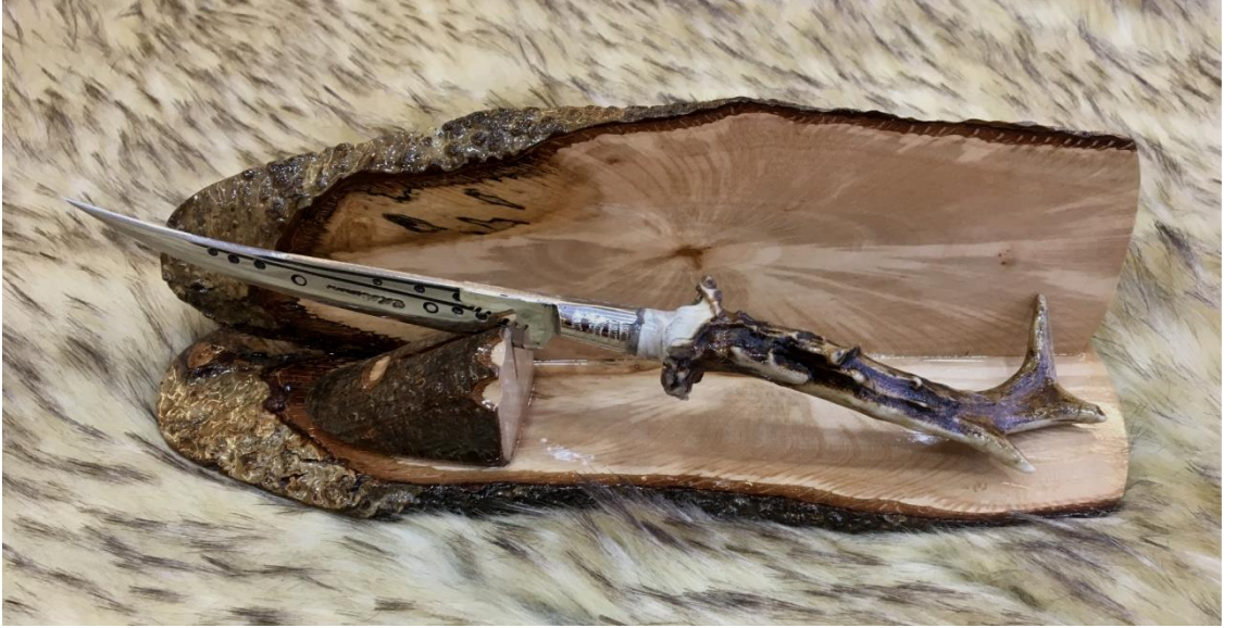
Görsel 1.4. Trabzon'da El Sanatları Boynuzlu Sürmene Bıçağı

Eski zamanlardan beri kullanılan bıçağın hammaddesi çelik, kurtuluş savaşından kalma Rus vagonlarındaki çelik malzemelerden, Erzurum'daki vagon ve faytonlarda bulunan fayton yaylarından elde edilirdi. Günümüzde ise Avrupa'dan ve yerli çelik olarak levhalar halinde satın alınarak temin edilmektedir.