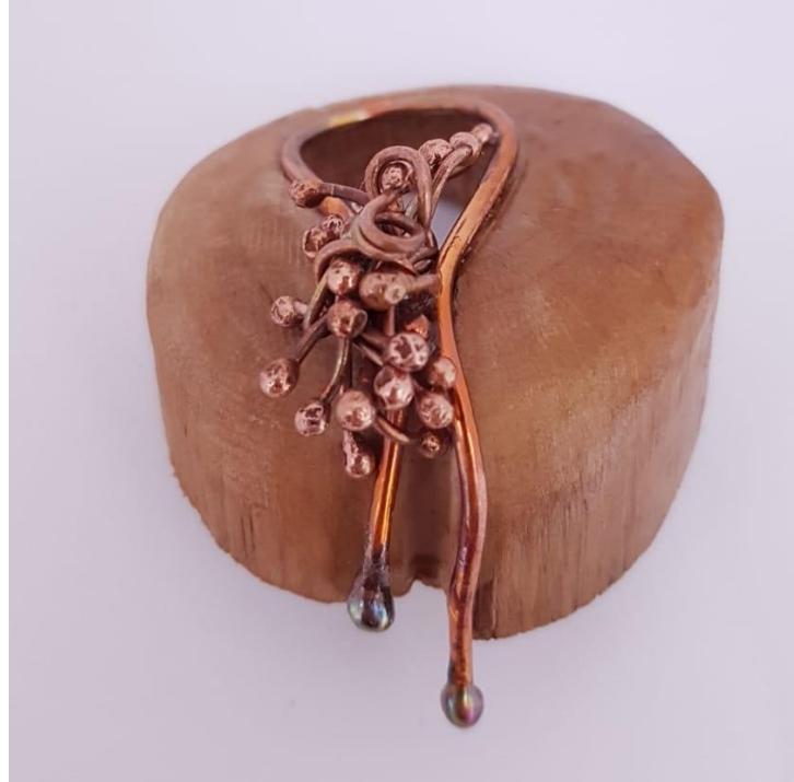
Görsel 2.12. Maden Yatađı Adlı Çalışmanın Önden Görünüşü