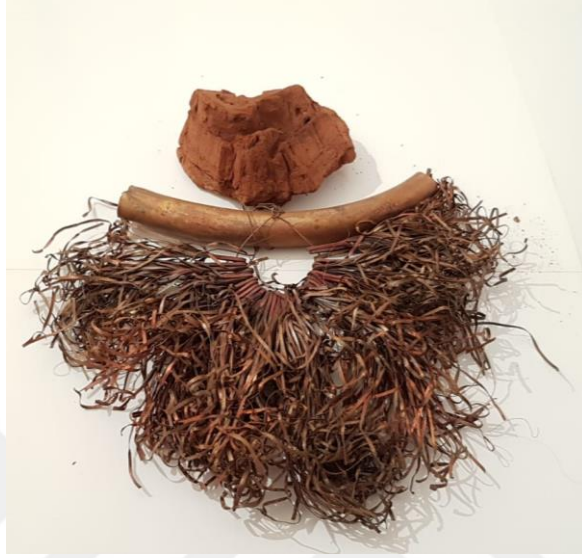
Görsel 2.20. Dokunuř Adlı alıřmanın Önden Görünüřü

(Görsel 2.20) Kullanılan malzemenin kendi özgünlüğü ile kullanılmıř olup aralarındaki iliřkide orantılı olarak kendine has para bütün iliřkisi kurulmuřtur.