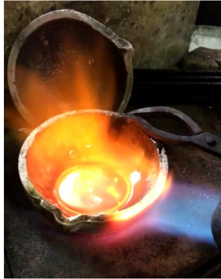
Görsel 1.3. Maden Eritme İşlemi

Eski çağlarda Türkler ilk önce demircilik ve madencilikle uğraşmışlardır. Metal işlemeciliğinde geçmişten günümüze ilerlemiş oldukları görülmektedir.( Görsel 1.3.) Maden eritilerek dökülmeye ya da eritilip istenilen formda eğerek, bükerek ve keserek şekillendirilebilir hale getirmeye başlanmıştır. Altın, platin ve gümüş en önemli madenlerdir. Bunların yanında, kalay, demir, kurşun, bakır madenleri de kullanılmaktadır (Arseven, 1950: 1255).