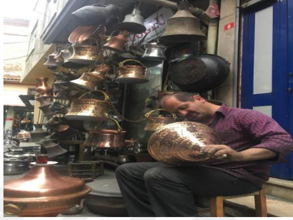
Görsel 1.2. Trabzon'da El Sanatları Bakırcılık Ustası

yaklaşıldığında uzun vadede yerel sanatların gelişiminde dört temel etkenin büyük rolü vardır. İkincisi sahip olunan hammaddelerden yararlanma bilgisi, yeteneği ve becerisidir. Üçüncüsü toplumun kendi dışında farklı toplumlardan etkilenecek kültür alışverişi içerisinde olmasıdır. Dördüncü etken ise teknolojik olarak alet geliştirilmesidir (Sümerkan, 2008: 10-11).