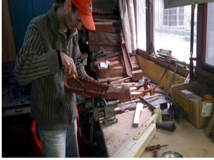
Görsel 1.16. Trabzon da El Sanatları Kemeçe Ustası

Karadeniz de kemeçelerin yapımında standart bir ölçü oluşturulmamasına rağmen ölçüleri birbirine yakın şekilde yapılmaktadır. Fakat ustadan ustaya farklılık gösteren estetik beğeniler görülmektedir (Görsel 1.16). Tirebolu, Görele, Beşikdüzü, Vakfıkebir, Akçaabat ve Dereli Anadolu'da kemeçe yapımını sürdüren bölgelerdir (Karadeniz, 1999: 614).