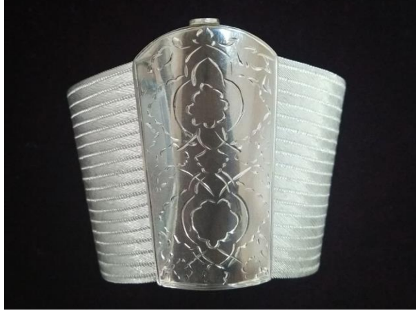
Görsel 1.10. Trabzon Hasır Örmeye Bilezik

kuyumculuk olduğunu belirtmektedir. Kubaçi'lilerin yaptığı kuyumculuk ürünlerinin bir çoğu sanatsal eser olarak bugün Paris, Moskova ve Londra müzelerinde sergilenmektedir. Rus ihtilali esnasında Kafkaslardan Türkiye'ye geçerek gelen telkari ustaları sanatlarını Trabzon'da da yapmaya devam ettirmişler (Sümerkan, 2008: 38).