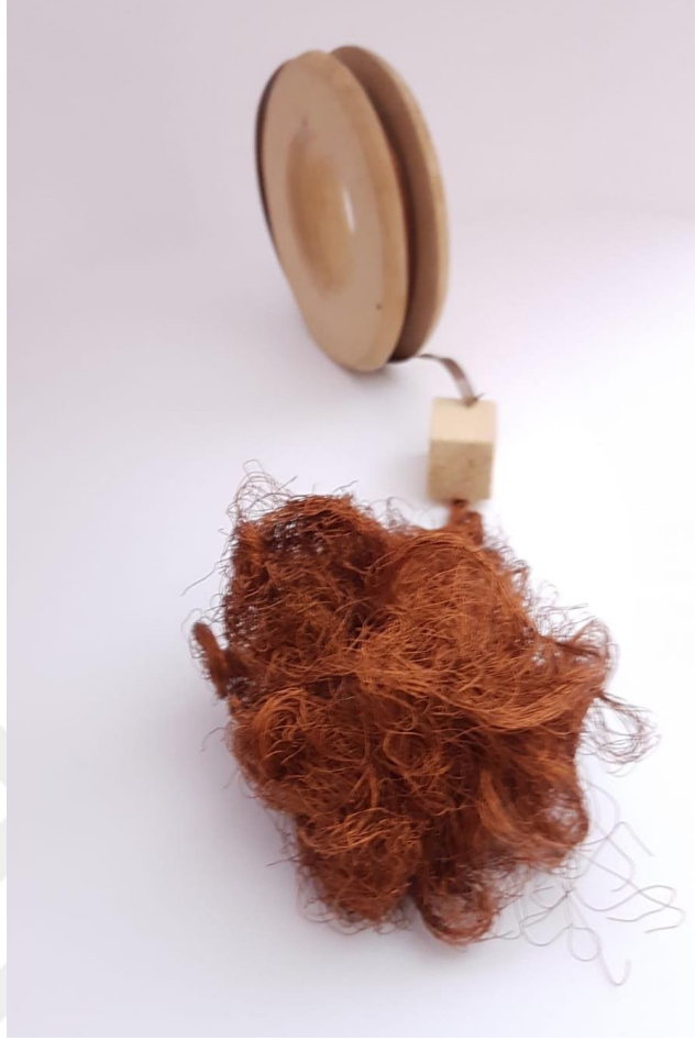
Görsel 2.22. Dönüşüm Adlı Çalışmanın Önden Görünüşü

(Görsel 2.21) Ebatları 30x11x12cm olan çalışmada ahşap, bakır tel ve plaka kullanılmıştır. Ahşap çam ağacından oluşturulan küp ve daire formunda makara şeklindedir. Makaraya sarılı plaka tel bulunmaktadır.