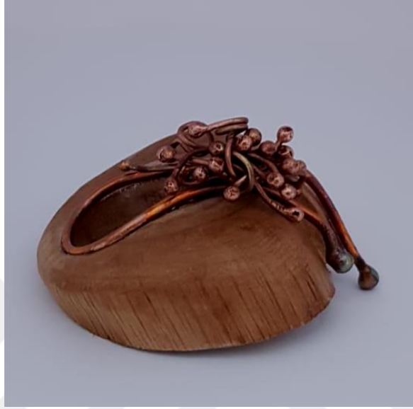
Görsel 2.11. Maden Yatađı Adlı Çalışmanın Soldan Görünüşü

malzeme özelliđi taşımaktadır. Renk ilişkilerine baktığımızda ise tersini görmek mümkündür. Renk olarak Metal ağaca göre daha sıcaktır. Kompozisyonunda kullanılan metalin kendi içinde hareketlilik özelliđi taşımaktadır. Ağaç metale göre daha sert duruş sergilemektedir. Ağaç durađan olup metallerin hareketliliđi ile aralarındaki bütünlükte denge oluşturulmuştur.