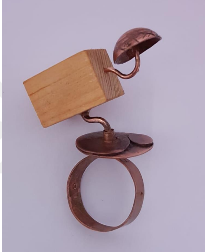
Görsel 2.9. Kambur Adlı Çalışmanın Önden Görünüşü

Çalışmanın boyutları 6,5x7x3 cm'dir. Çapı 3,3 cm, eni 0,9 mm kalınlığı 1mm olan bakır tele halka formu verilerek oluşturulmuştur. Halkanın üzerinde daire formunda plaka bulunmaktadır. Bakır plaka üzerinde farklı ölçülerde yan yana oval iki plaka yerleştirilmiştir.