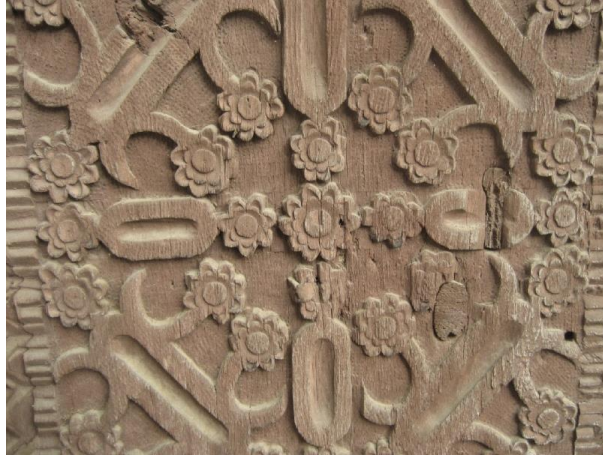
Görsel 1.20. Trabzon da Sanatları Ahşap Oyma Trabzon Dernekpazarı Taşçılar Köyü Camii Kapı Detayı

Mobilyacılık sektörünün etkisi ile canlılık kazanan oymacılık sanatı, Trabzon'da uygulanan sanatlar arasında önemli bir yere sahip olmuştur. Mobilyacılıkta üretilen masalar, sandalye, çerçeve, kapı, ayna, gazetelik, biblolar, şemsiyelik gibi, ev eşyaları oymacılık sanatı ile süslenerek üretilmiştir. Trabzon'da, ahşap oyma ustalarında ki sayının az olması sebebiyle iş yüklerinin çok olması ile birlikte kazançları yüksek olup geçimlerini çok rahat sağlamaktadırlar (Yıldırım, 2014: 385-387).