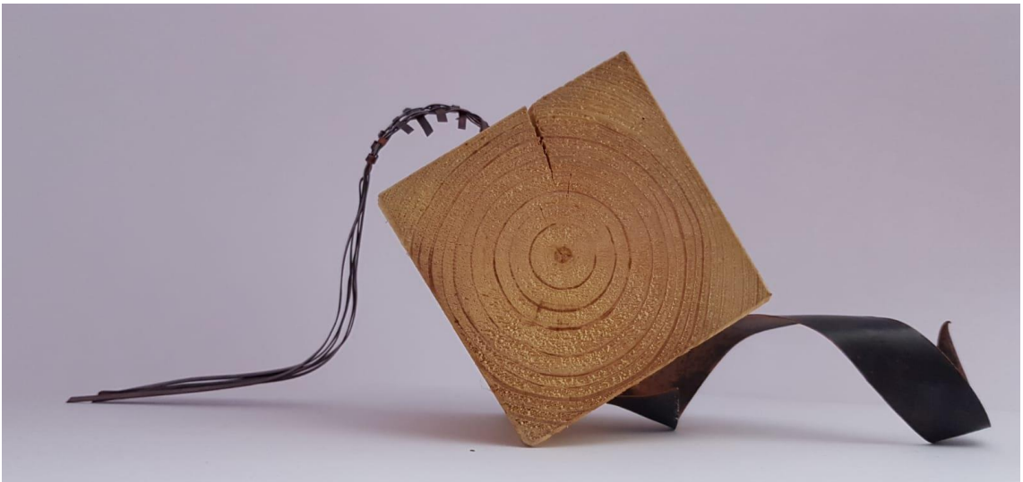
Görsel 2.14. Dönüşüm Adlı Çalışmanın Önden Görünüşü

(Görsel 2.13) Çalışmanın boyutları 30x11x11 cm'dir. Kompozisyonda çam ağacından oluşturulmuş küp formu, bakır plaka ve teller kullanılmıştır. Çalışmada bakır plaka, küpün alt kısmından geçerek küpün üst yüzeyinden teller halinde çıkış yapmaktadır. Çıkış yapan teller kendi içerisinde bir düzene sahiptir. Teller sepet örgüye dönüşmüş olarak karşımıza çıkmaktadır.