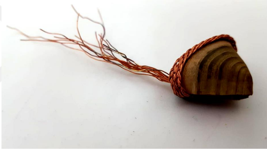
Görsel 2.17. Döngü Adlı Çalışmanın Soldan Görünüşü

(Görsel 2.17) Çalışma 13x4x2cm boyutlarındadır. Çalışmada bakır tel ve akasya ağacı kullanılmıştır. Yöre sanatı olan sepet örme tekniği bakır teller ile örülerek kullanılmıştır. Akasya ağacının kesitinden üçgen form oluşturulmuştur. Üçgen formun bir kenarı yontularak yay şekli verilmiş olup tüm köşeleri de yumuşatılmıştır. Yay formunda olan köşeye bakır tellerle örülen sepet örgü yerleştirilmiştir. Oluşturulan kompozisyon da yer alan üçgen ahşabın arka kenar köşesinden çıkan birden fazla teller mevcuttur.