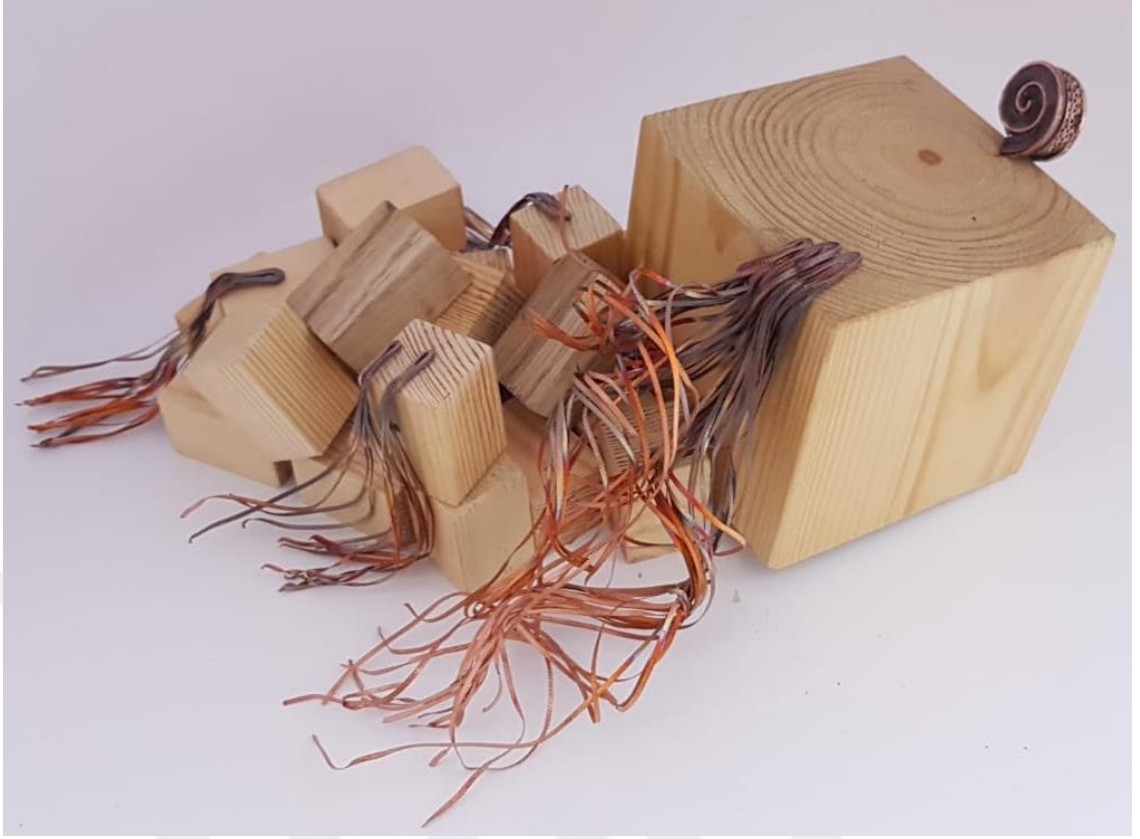
Görsel 2.4. Çatı Adlı Çalışmanın Sağdan Görünüşü

(Görsel 2.4) Çalışmada bir önceki kompozisyonda kullanılan telkari dolgu telleri ve 3.5x3x3 cm boyutları olan birden fazla çam ağacından oluşturulmuş ahşap küpler kullanılmıştır.