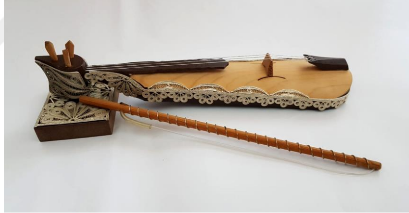
Görsel 1.1. Trabzon Telkarisi Süslemeli Kemeçe

Değişim ve gelişim sürecinde yerel sanatlar, ilk çağlarda çok yavaş değişim ve gelişim göstermesine rağmen 18.yüzyılın sonlarında endüstrinin gelişmesi ile bu gelişim daha da hızlanmıştır. Yerel sanatların tarihi olarak gelişimine baktığımızda; toplumların dünden bugüne sanatsal uygulamaların aktarılmasında insan olgusunun önemli bir unsur olduğu görülmektedir. Kuşaktan kuşağa aktarılan yöre sanatları; üretilen ve üretilenin bir sonraki kuşaklara aktarılmasında gösterilen gerekli duyarlılık ve kurumsallaşma konusunda büyük yenilikçi anlayış getirmişlerdir. Üretim biçimi ayrıca aile içinde gerçekleşirken zamanla küçük çaplı işletme örneklemelerine geçerek değişiklik göstermiştir (Öztürk, 1982: 228).