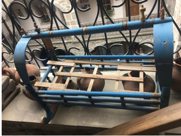
Görsel 1.19. Trabzon da Yöre Sanatları Beşik örneği

Beşik yapımında kullanılan ağacı, yapılış biçimi ve içeriği bakımından göçebe olarak yaşayan toplumun yerleşik bir hayata geçmesine kadar geçen sürelerde farklılık göstermiştir. Türklere ait beşiklere şekil ve de içerik bakımından bakıldığında Türk milletinin yaratıcı fikirlerini göstermesi açısından çok önemlidir(Arseven, 1950: 214).