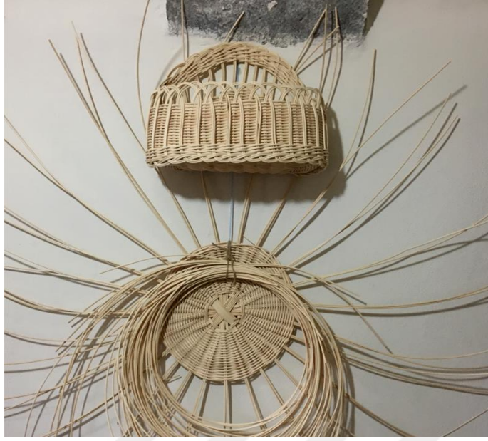
Görsel 1.17. Trabzon da Yöre Sanatları Sepet örneđi

Türkiye de bitkisel örücülük yoluyla mutfakta kullanılmak üzere eşyalar, mobilyalar, sepetler, dekorasyonda kullanılan aksesuarlar üretilmektedir (Görsel 1.17). Sepet örme işlemi halen Trabzon'da yapılmaya devam edilmektedir.