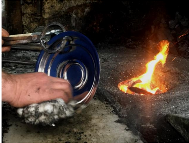
Görsel 1.8. Trabzon'da El Sanatları Kalaycılık Ustası

1900'lü yıllardan sonra standart ölçü ve kalınlık ta bakır plakalar İstanbul'dan Trabzon'a gelmiştir. Bu da Trabzon'da bakırcılık sanatının gelişmesinde büyük rol oynamıştır. Bakır atölyesi olarak ilk atölye Trabzon'da 1944 yılında kurulmuş olup Nazım Ofluoğlu tarafından çalışmalar yapılmıştır (Sümerken, 1986: 10).