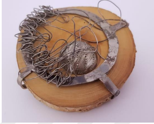
Görsel 2.1. Tellerin İzi Adlı Broş Çalışmasının Önden Görünüşü

‘Tellerin İzi’ adlı çalışmada özellikle tekniğin tamamen el emeği göz nuru olması, yetenek, ilgi, büyük bir özveri ve sabır gerektirmesi dünden bugüne yaşatılmış ve halen yaşatılması konusunda oluşabilecek engelleri konusuna vurgu yapılmak istenmiştir.