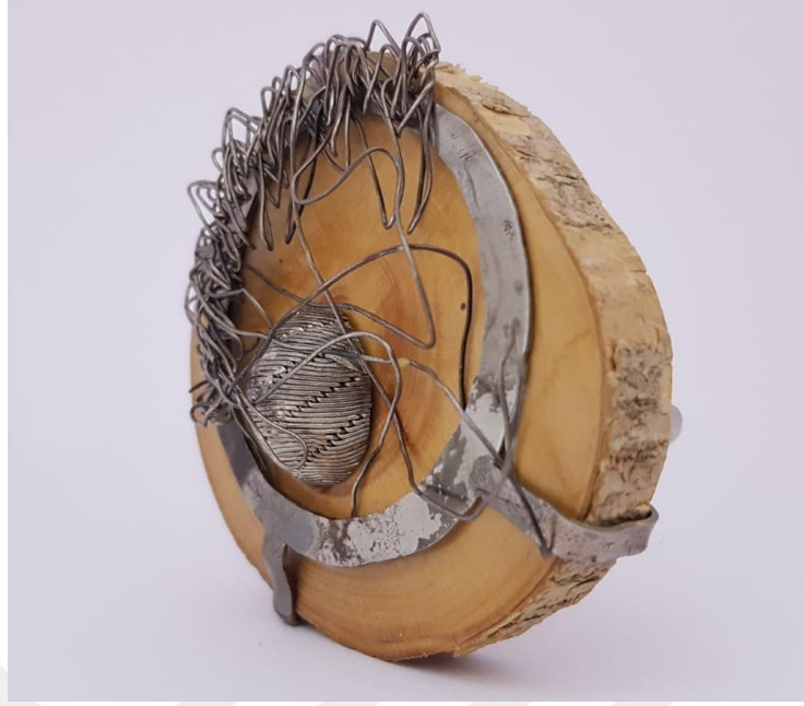
Görsel 2.2. Tellerin İzi Adlı Çalışmanın Soldan Görünüşü

(Görsel 2.2) Örgü işlemi başlangıcı ile örgünün iççiliği uygun örgü oluşturabilmenin güçlüğü, oluşturulan örgüden oluşan yarım bombe ile ulaştığı ulusal uluslar arası tüm değerleri barındırması yansıtılmak istenmiştir. Bütün bu işlerin yapıldığı örgünün muhteşem iççilikle bu coğrafyaya aitlik kazanması, coğrafyayı diğer yöre sanatlarında da temsil eden şimşir ağacıyla tamamlanmıştır.