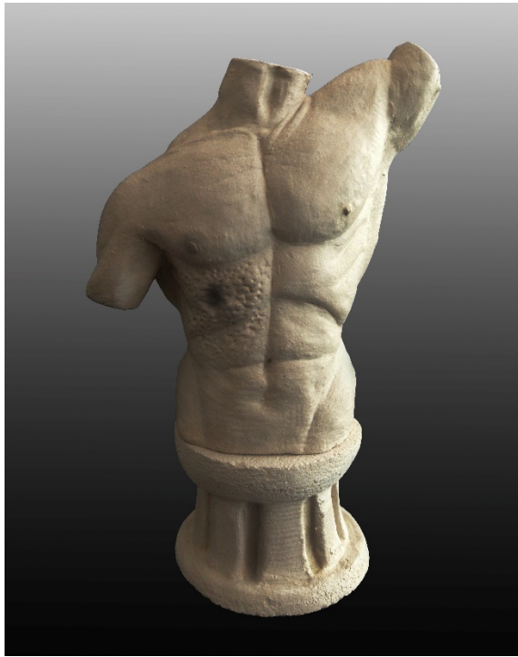
Resim 20: Dövmе, 7 x 11 x 15 cm, 1050 °C, İnce Şamotlu Çamur