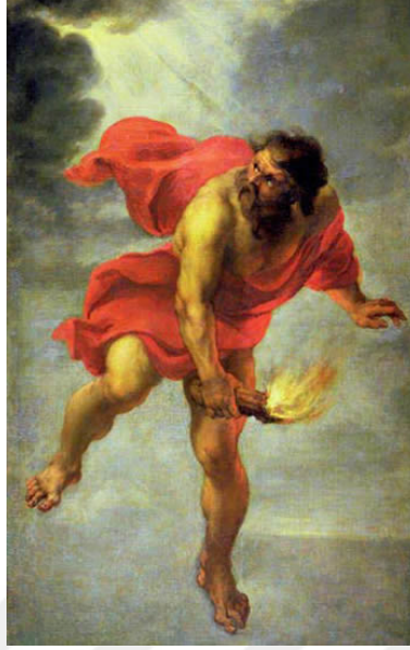
Resim 1. Jan Cossiers (1600 – 1671), Prometheus Ateşi Çalıyor

www.greekmyths-greekmythology.com/prometheus-fire-myth/ : 2019