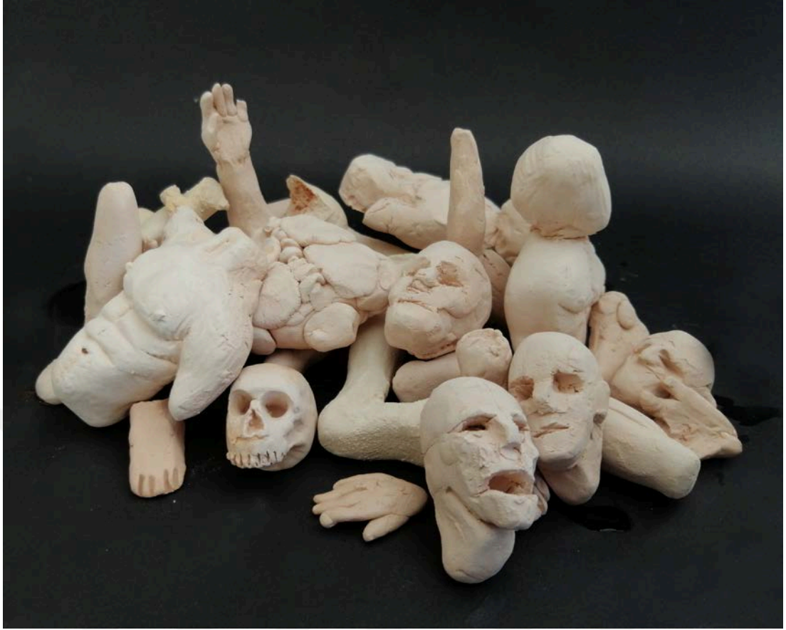
Resim 19: Yığın, 8 x 5 x 19 cm, 1050 °C, İnce Şamotlu Çamur