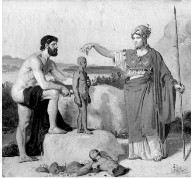
Resim 3. Constantin Hansen (1845), Prometheus Kilden İnsanı Yaratıyor (Sağ tarafta Athena yer almakta)

arkadaşlarına kin beslediği belirtilir ve sonradan Tanrıları inkâr edip kötülüklerde sınır tanımayacak ve dünyaya bela getirecek insanı yaratarak Tanrıların atalarına yaptıklarının öcünü almak istediği ifade edilir (Hacımüftüoğlu, 2018: 511).