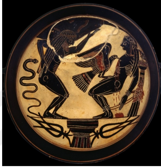
Resim 8. Gregorian Etruscan Müzesi, Vatikan, (M.Ö. 560-550)

Doğa bilgisinin ilerlemesinde büyük bir yeri olan dört element kavramı ve bu dört elementi kullanarak Prometheus'un ilk insanı yaratma öyküsü, aynı zamanda bu maddelerin seramiğin oluşumunda büyük öneme sahip oluşu, bu mitolojik öykü ile seramik malzeme arasında bağ kurulmasına neden olmuştur.