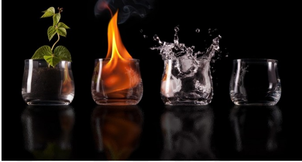
Resim 7. Dört Element