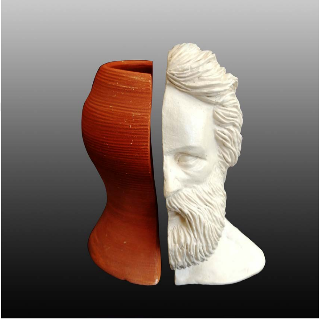
Resim 17: Seramik ve Prometheus, 11 x 14 x 13 cm, 1050 °C, İnce Şamotlu Çamur