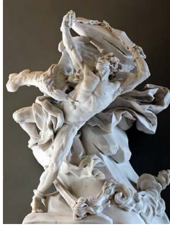
Resim 5. Nicolas-Sébastien Adam, (1762), Prometheus'un Cezalandırılması

https://commons.wikimedia.org/wiki/File:Heinrich_fueger_1817_prometheus_brings_fire_to_mankind.jpg : 2019