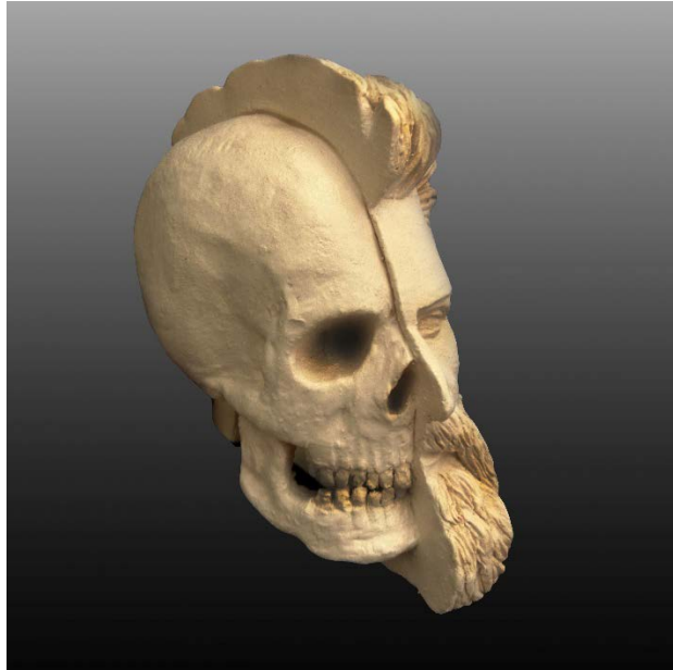
Resim 15: İimdeki zincirler, 10 x 7 x 13 cm, 1050  C, İnce Őamotlu amur