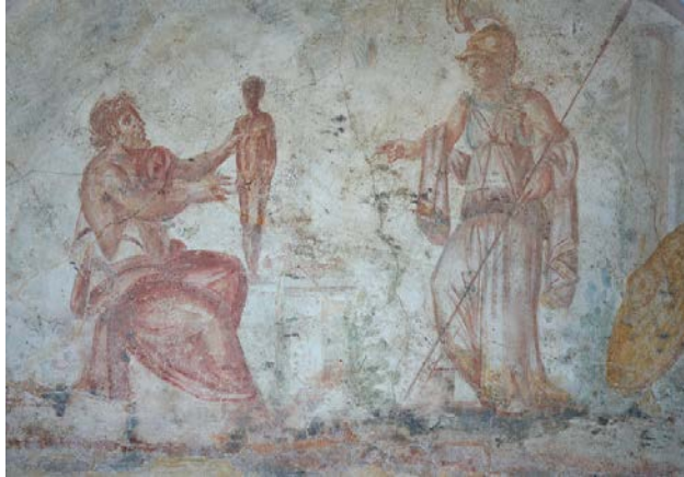
Resim 11. Prometheus'un Athena'nın huzurunda yarattığı adamı betimleyen Roma freski, M.S. 3. Yüzyıl, (Museo della Via Ostiense, Roma)