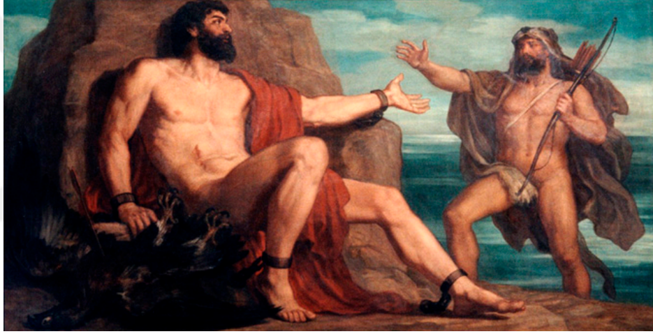
Resim 6. Christian Griepenkerl (1878), Prometheus ve Herkül

Prometheus dięer kardeřlerinden farklı olarak insanları yaratarak ve onlara yaratıcılıęın, bilimin, uygarlıęın sembolü olan ateři vererek tanrıların düzenini deęiřtirebilmiřtir. Zeus, ateřin yeryüzünde yeniden alevlendięini gördüęünde deliye dönmüřtür. Hem insanlara hem de Prometheus'a bir ders verme amacındadır. Zeus görevlendirdięi bir kartal, her gün Prometheus'un yeniden oluřan, karacięerini yemiřtir. Prometheus'u Kafkas daęının zirvesinden zulümden, Herakles (Herkül) kurtarır. Prometheus Zeus yerinden olmadıkça benim acılarımın bir sonu olmayacak der .Prometheus böylelikle insanlıęa özgürlüęün kapısını açmıřtır (Saękol, 2005: 68).