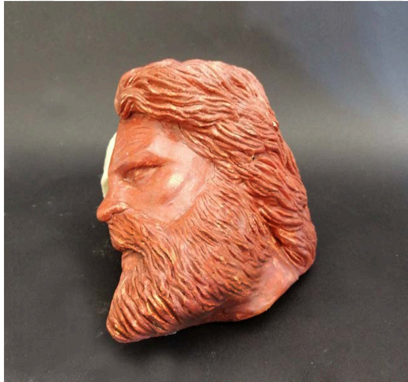
Resim 16: Dört madde, 9 x 8 x 12 cm, 1050 °C, İnce Şamotlu Çamur