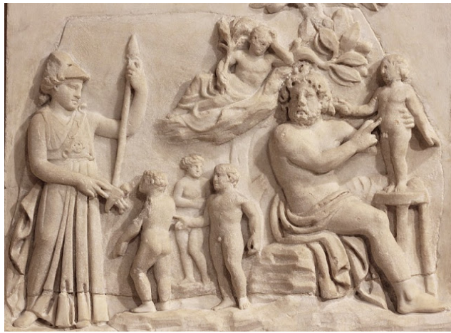
Resim 9. Louvre Müzesi, (M.S. 3. Yüzyıl), Prometheus İnsanlar Yaratırken Athena Onu İzliyor

www.museivaticani.va/content/museivaticani/en/collezioni/musei/museo-gregoriano-etrusco/sale-xvii-e-xviii--collezione-dei-vasi--ceramica-corinzia--lacon/kylix-laconica-con-prometeo-e-atlante.html : 2019