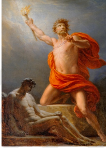
Resim 4. Heinrich von Füger (1817) Prometheus tarafından insanın yaratılışı

sağlayabilmek, vahşi hayvanlara karşı güçlü silahlarla korunmalarını sağlamak, toprağı sürmek için gereken aletleri elde edebilmek, madenleri işlemeyi öğretebilmek adına insanlara ateşi getirmeye karar verdi. Prometheus Şeytancersi ağacından kopardığı bir dalı alıp Lemnos'a gitti. Ateş tanrısı Hephaistos'un ocağının yanına gidip bir parça kıvılcım aldı. Dalın içine yerleştirdiği kıvılcımı yarattığı insanlara armağan etti.