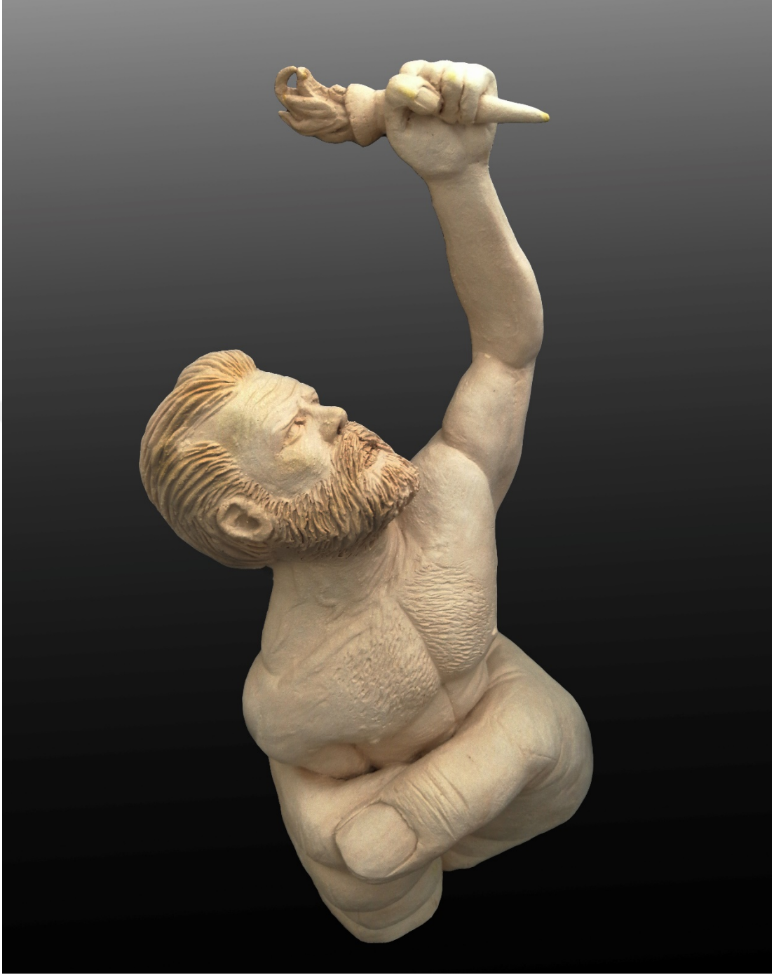
Resim 14: Ateşi yakalamak, 13 x 23 x 10 cm, İnce Şamotlu Çamuru