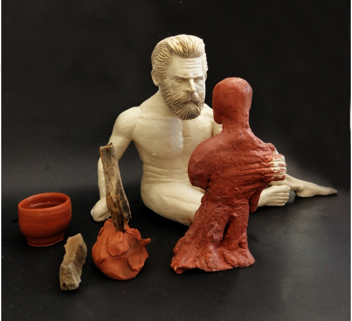
Resim 13: Toprak ve Gözyaşı, 18 x 23,2 x 14 cm, 1050 °C, İnce Şamotlu Çamur