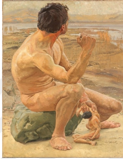
Resim 10. Otto Greiner, (1909), Kayanın Üzerinde Oturan Prometheus Düşünceli Bir Şekilde Kilden Yeni Biçimlendirdiği İnsanın Bedenini Düşünüyor Ve Ona Hayat Verecek Ruhun Gelişini Bekliyor

Günümüzde hızla gelişen teknolojiyle beraber seramik; sanatsal değerinin, kullanım eşyası olarak yararlanılmasının yanı sıra bilimsel yenilikler için çokça tercih edilip, teknolojiye önemli katkılar sağlayarak gelişimine devam etmektedir. Bu süreç içinde; toprağın şekillendirilmesinin ardından ölümsüz olmasını sağlayan yegâne olgu ateş olmuştur.