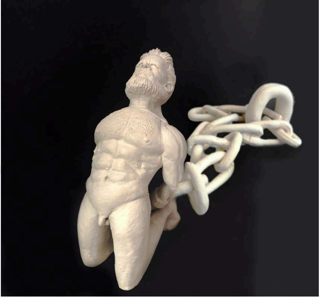
Resim 18: Prometheus'un Cezası, 12 x 8 x 18 cm, 1050 °C, İnce Şamotlu Çamur