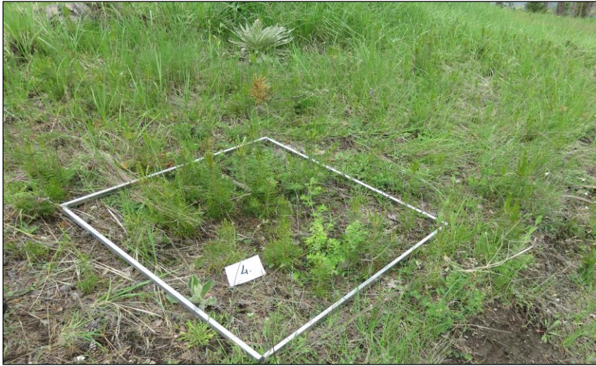
Şekil 2.7: Metrekaredeki gençlik sayısının belirlenmesi

Araştırmada, faktör analizine ilişkin veri tablosu hazırlandıktan sonra, varyansı en iyi şekilde açıklayan faktörleri saptamak amacıyla, yaygın bir şekilde kullanılan faktör türetme yöntemlerinden, Temel Bileşenler Modelinden yararlanılmıştır. Böylelikle