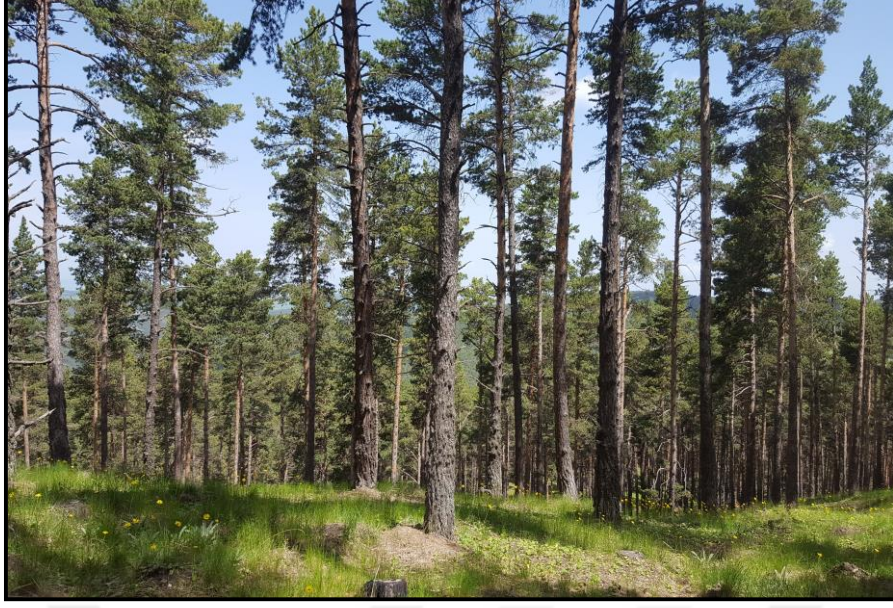
Şekil 2.1: Akçakışla 214 nolu bölmedeki gençleştirme alanı