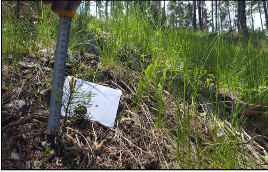
Şekil 2.2: Akçakışla 214 nolu bölmedeki gençleştirme alanı (Fotoğraf: Halil Barış ÖZEL)