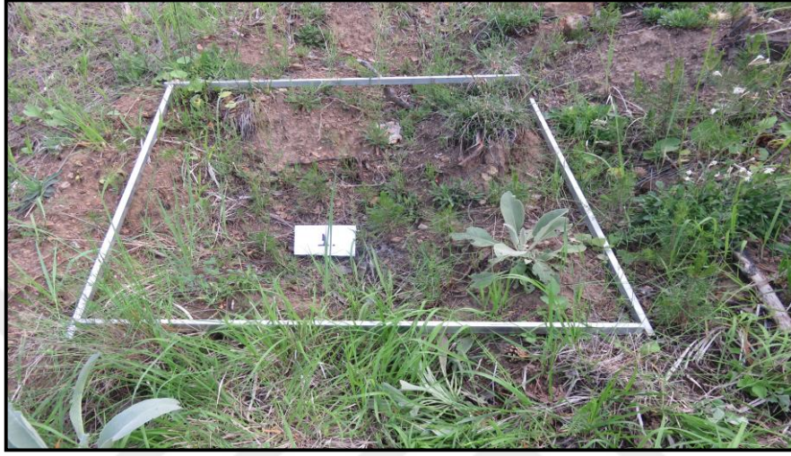
Şekil 2.6: Metrekaredeki gençlik sayısının belirlenmesi

üzerinde etkili olan faktörler belirlenmeye çalışılmıştır. Bu analizin gerçekleştirilmesinde SPSS paket istatistik programından yararlanılmıştır (SPSS, 2002). Faktör analizinin gerçekleştirilmesinde bağılı değişken olarak en önemli başarı kriteri olarak kullanılan sarıçam doğal gençliklerinin metrekaresindeki sayısı tespit edilmiş (Şekil 2.6, Şekil 2.7) ve kullanılmıştır.