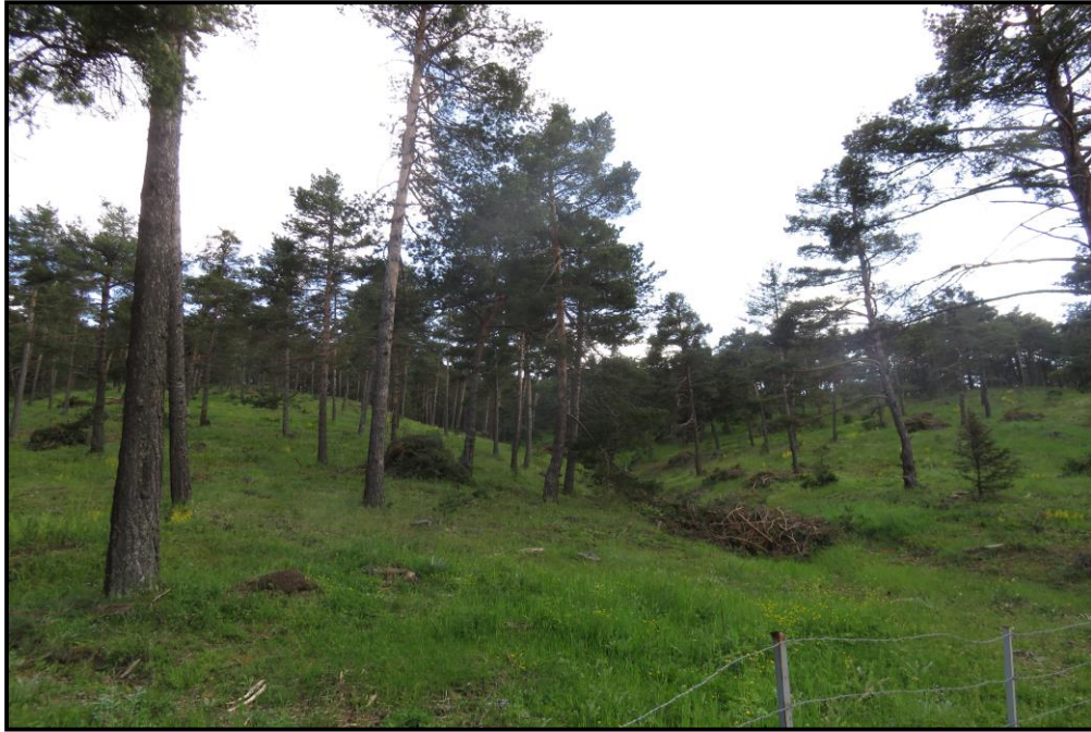
Şekil 2.3: Kadıncı 48 nolu bölmedeki gençleştirme alanı

Araştırma alanını oluşturan 48 nolu bölme Çsd 1 meşçere tipinde olup toplam alanı 6,8 ha'dır. Alan kuzeydoğu bakılı, 1350m yükseltide, orta yamaç ve eğimin %25-30 arasında değiştiği tek tabakalı ve aynı yaşlı bir meşçeredir. Alanda gençleştirme çalışmalarına 2014 yılında başlanmıştır ve bu itibarla alandan bir adet tohumlama kesimi ve bir adet ışıklandırma kesimi yapılmıştır (Şekil 2.3, Şekil 2.4, Şekil 2.5) (OGM, 2013).