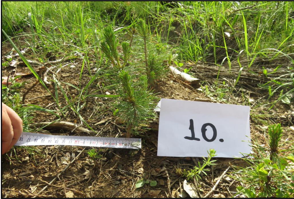
Şekil 2.5: Kadıpınarı 48 nolu bölmedeki gençleştirme alanı