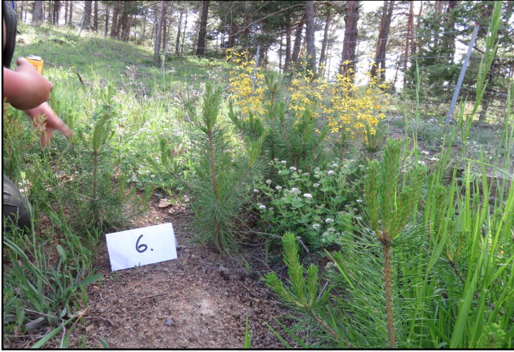
Şekil 2.4: Kadıpınarı 48 nolu bölmedeki gençleştirme alanı