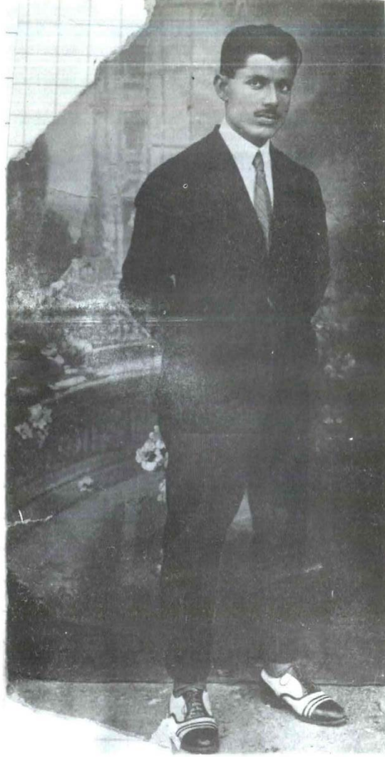
صورة نادرة للشيخ الحَيِّير - تنشر لأول مرة - وكان في الـ (٢٦) من عمره