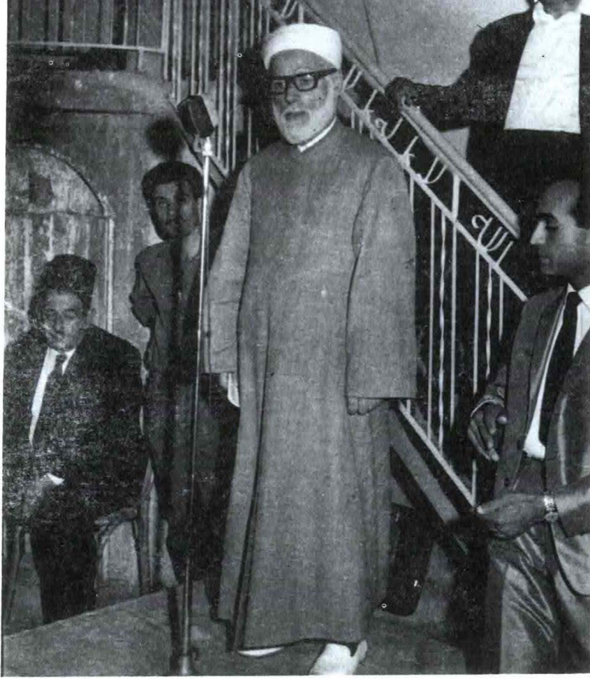
يلقي كلمة دينية في أحد مساجد طرابلس - لبنان