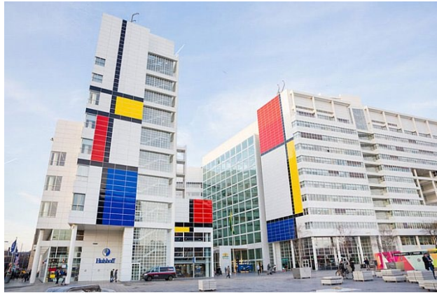
Görsel 23: De Stijl, Mimari cephe uygulaması.

Mimari büyük ölçüde, sanata yüzyıllardır ev sahipliği yapmış sanat açısından önemli bir unsurdur. Kimi zaman da sanat için önemli bir eleman durumuna gelmiştir. Sanatın ilk ürünlerini gördüğümüz Prehistorik çağlarda, insanların kullanmış olduğu mağaralar, her ne kadar estetik kaygıdan yoksun, kayaların izin verdiği ölçüde, gelişigüzel şekillendirilerek yapılsalar bile, mağaraların duvarları üzerine betimlenmiş resimlere tablo ve sanat galerisi olma görevini üstlenmiştir. Bazen de çok disiplinli bir sanat topluluğunu bir arada görmemiz mümkün. Özellikle arkaik dönemden itibaren tarih bunun güzel örnekleriyle doludur. Günümüze yaklaştıkça; Rönesansla başlayan Gotik mimarisinin en güzel örneklerinden biri olan Fransa'nın Reims şehrinde yer alan Reims Katedrali, İspanya'nın Barcelona kentinde yer alan Sagrada Familia , Türkiye'nin İstanbul kentinde yer alan Dolmabahçe Sarayı gibi yapılar birçok sanat bileşeninden oluşurken tek başlarına birer sanat eseri olma özelliği taşır. Bunların yanında; Görsel:25'te yer alan ünlü De Stijl kompozisyonlarının bina cephelerine yapılan uygulamalarda görüldüğü gibi mimarın sanatla buluşması da mümkün. Ya da duvar resimlerinin bir binanın tamamının ya da bir bölümünün yüzeyine uygulanmasında olduğu gibi.