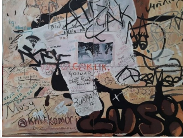
Görsel 28: Hatice Dilek Çokova, Varoluş Terapisi III, 2022, Tuval Üzerine Karışık 80x120 cm.

Kamusal alanda (Görsel 29) bir araya gelen insanların buluştuğu meydanları bağlayan ana yollar ve sokaklarda binaların duvarlarında yer alan bu resmi oluşturan kitlenin dünyasıyla, benzer toplumda yaşayan biri olarak, kurduğum içsel yolculuktaki özdeşlikte açığa çıkan, dışavurumlardan oluşturduğu bu resimler insana dair her çeşit duygu durumunu ve düşünceyi içerir.