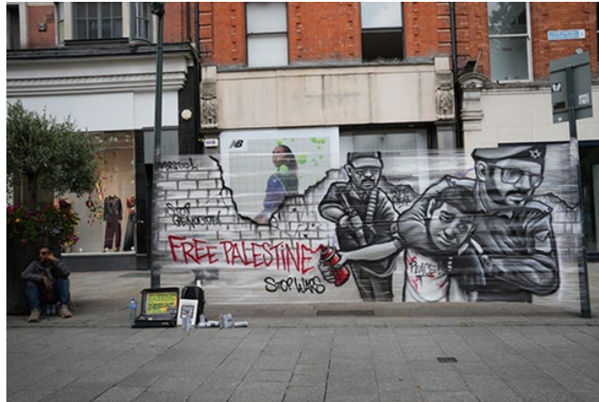
Görsel 18: Duvar Resmi, Adnet, Dublin, 2024.

Grafitinin bilindik duvar resminden farkı kentin yaralarını daha fazla imgelemeye çalışmasıdır. Yasaklardan dolayı çoğunlukla gece ve hızlıca sprey boyalar ve şablonlarla siyasi slogan yazılmaya çalışılırken bir yandan da sanatın dinamikleriyle uyumlamaya çalışılarak oluştururlar. Konuları bulunduğu ülkeye göre gündelik yaşamdaki siyasi gündemlerden oluşur. Savaş ortamında ve zor şartlarda yapılan grafitiler olasılıkla gönüllüler ve amatör sanatçılar tarafından yapıldığı için naiftirler.