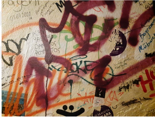
Görsel 24: 2021 Ankara.

Dönüşüm kavramı bir şeyin olduğundan farklı bir şekle bürünmesi, başkalaşması hali için kullanılır. Dönüşüm, içerisinde değişimin gerekli olması halini barındırır. Yani; entropinin kaçınılmaz enerji dönüşümünde olanlar ya da olması gerekenler gibi. Kültürel anlamda dönüşüm ise; var olanın zaman içerisinde eskiyip bozularak geçerliliğini yitirmesi, farklı bir boyuta geçmesi durumunu anlatır. Hayatımızda birçok alanda varlığını hissettiğimiz dönüşüm kavramına bu kez günümüzde adını sıkça duyduğumuz kentsel dönüşüm kavramında rastlıyoruz.