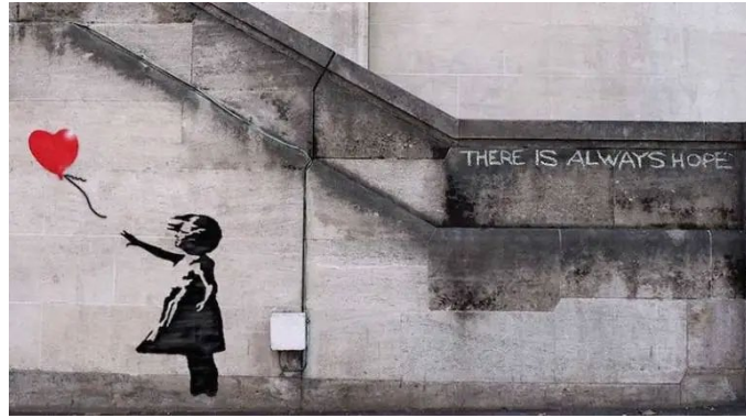
Görsel 15: Duvar Resmi, Banksy, Londra.

Banksy'nin gerçek adı hâlâ bir muammadır. Sanatçı, kimliğini gizlemeyi sürdürerek eserlerine daha fazla vurgu yapmayı tercih eder. Bristol, İngiltere doğumlu olduğu tahmin edilen Banksy, sokak sanatıyla genç yaşlarda tanıştı. Adını en öne çıkaran niteliklerinden biri, karmaşık sosyal ve politik konuları, mizah ve ironiyle birleştirerek sokaklara taşımıştır.