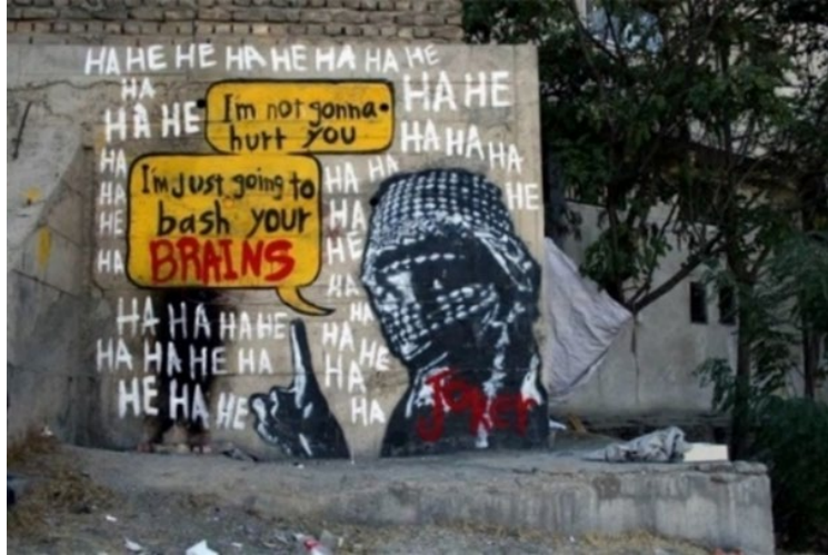
Görsel 19: Duvar Resmi, Joker.

Sanatçı Adnet sanatın eleştirel gücünü kullanarak Filistin halkına yaptığı grafitlerle destek vererek savaş mağduru insanlara yaşadıkları savaş ortamını sorguluyor. Resimde, duvar resmi yapan halktan bir çocuğun elindeki spreyle boyanmış özgür Filistin anlamına gelen "Free Palestine yazdığını ve bu nedenle İsrail askerleri tarafından yaka paça götürüldüğünü görüyoruz. Free Palestine genellikle Filistin halkının çektiği sıkıntılarda insan haklarının savunucularına gönderme yaparak insan hakları ihlallerini hatırlatırken onlara yaptıklarını doğruluğunu sorguluyor. Adnet bir insan olarak Filistin halkının yaşadığı acılar karşısında duyduğu derin üzüntüsünü dile getiren grafitleriyle savaş karşıtı bir tutum sergileyerek Filistin halkı öncülüğünde savaş mağdurlarına destek veriyor.