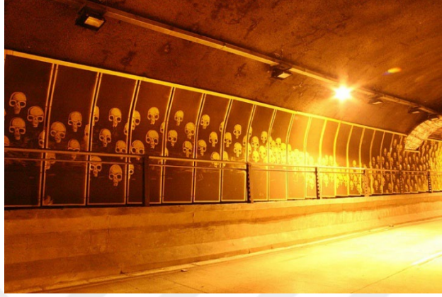
Görsel 20: Duvar Resmi, Alexandre Orion, Sao Paulo.

The Joker olarak bilinen bir diğer sanatçı, varolan graffiti görüntüsünü bozuyor ve Joker'in korkunç gülümsemesini bir imza şeklinde stencil tekniği ile üzerine uyguluyor (Görsel 20). – evet, Heath Ledger olanı –ve bir kararmış imza... Bu kurnaz sanatçı, nasıl o kadar çabuk hareket ettiği konusunda da çoklarını şaşkınlığa uğrattıyor. 70