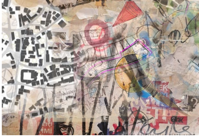
Görsel 36: Hatice Dilek Çokova, Kentsel Devinim VI, 2024, Dijital Kolaj 80x110 cm.

Kentsel Devinim grubunu oluşturan bu resimler ise; dijital kolaj olarak çalışılmıştır. Bu gruptaki çalışmaların oluşumunda konuya dair araştırmalardan yararlanılarak çekilen fotoğraflardan konuya yönelik kompozisyonlar oluşturulmuştur.