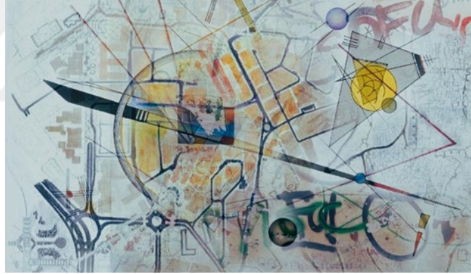
Görsel 37: Hatice Dilek Çokova, Kentsel Devinim VI, 2024, Dijital Kolaj 60x110 cm.

Kentsel Devinim grubunu oluşturan bu resimler ise; dijital kolaj olarak çalışılmıştır. Bu gruptaki çalışmaların oluşumunda konuya dair araştırmalardan yararlanılarak çekilen fotoğraflardan konuya yönelik kompozisyonlar oluşturulmuştur.