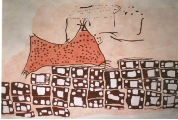
Görsel 4: Çatalhöyük yerleşiminden kutsal binanın 14 numaralı odanın duvarından bir bölüme çizilmiş, Çatalhöyük yerleşimine ait olduğu düşünülen bir harita.

Dünyanın En Eski Yerleşim Yeri Çatalhöyük'te İlginç Keşifler , Kaşifiz, 2022, https://kasifiz.com/dunyanin-en-eski-yerlesim-yeri-catalhoyukte-iliginc-kesifler/ .