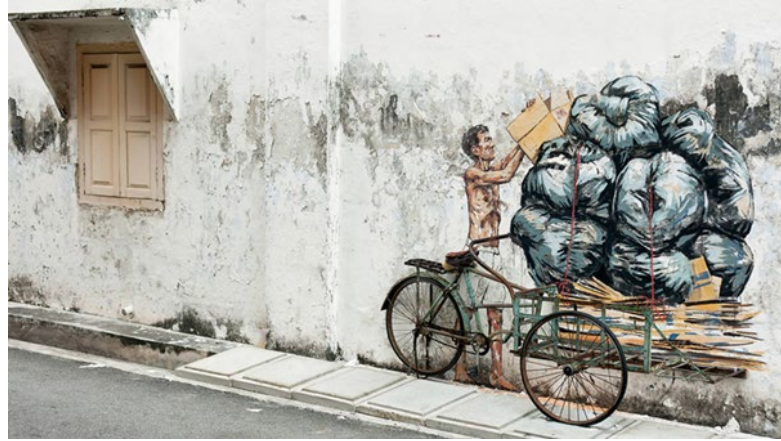
Görsel 25: Trishaw. Ernest Zacharevic. Ipoh, Malezya, Omar.

Günümüzde yaşadığımız özellikle metropol şehirlerde sıkça rastladığımız kamusal alanda duvar resimlerinin bir amacı da kent estetiği ve sanatçı inisiyatifi gruplarının oluşturduğu çalışmalarda toplumun sanata karşı dikkatini çekme ve sanatsal duyarlılığını artırmak için halktan insanların katılımıyla oluşturulan duvar resimleri yapmak. Halkında katılımıyla oluşan bu resimler kolektif kent belleğinin yansıdığı en iyi örneklerdendir.