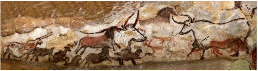
Görsel 3: Lascaux Mağarası Duvar Resmi, Fransa.

Üst Paleolitik dönemde resim tekniği olarak kazıma boyama püskürtme çizme gibi tekniklerle pozitif ve negatif baskı yöntemleri kullanılmış. El tasvirlerine örnek olarak Görsel 2'deki Eller Mağarası olarak geçen Arjantin'den bir kesitte görülen ellerin çevresine püskürtülen kırmızı renkli bir boya ile negatif baskı tekniğinin kullanıldığını görüyoruz. “El resimlerine İspanya Atamira ve Fuente del Salin Mağarası ve Endonezya mağaralarında da rastlamak mümkün. Endonezya'nın Sulawesi Adası'nda bir mağarada keşfedilen el resimleri günümüzden 40.000 yıl öncesine tarihlenirken İspanya-Fuente del Salin Mağarasındaki el resimleri yaklaşık 20.000 yıl öncesine tarihlenen el resimlerinin genelinde negatif baskı tekniğiyle yapıldığı anlaşılmaktadır.