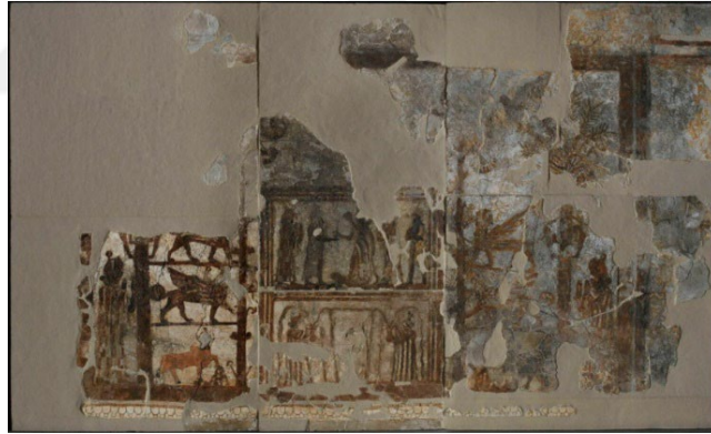
Görsel 7: Zimri-Lim'in Görevlendirilmesi, M.Ö. I.yy..

Mezopotamya uygarlığında sanatın bir propaganda aracı olarak kullanıldığını Sümer Akad, Asur, Babil ve Persler çivi yazılı metinlerinden anlamak mümkün. Bunun yanında Mezopotamya krallarının kahramanlıklarını göstermek için yaptırmış oldukları stellerde rastlarız. Bu stellerde kralların kazandıkları başarıları yüceltmek düşmana korku salıp göz dağı vermek gövde gösterisi yaparak ve saygı kazanmak gibi kahramanlık öyküleri yer alır. Örneğin Akbabalar Steli, Naram-Sin Steli gibi. Aynı zamanda buna benzer sahneleri Asur döneminde krallar tarafından yaptırılan kabartmalar sarayların iç ve dış duvarlarında karşımıza çıkar. Özellikle kabul salonlarında sanatın görsel gününün kullanıldığı katliam görüntüleri acımasız bir politika izleyen kralın gücünü göstermeye yöneliktir. Toplumdaki hiyerarşik yapı resme yansımış önemli kabul edilen kişilerin figürlerini, diğerlerine göre daha büyük çizmişler. Resimlerde genellikle krallar soyluluğunu ve gücünü göstermek için diğer figürlere göre daha sakin duruşlu ve özenle resmedilmiş. Diğer figürlerin hareketlerinde bir ritim duygusundan söz etmek mümkün.