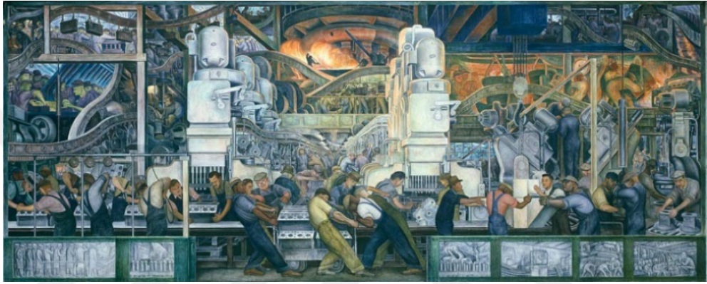
Görsel 12: Detroit Savaşı, Diego Rivera.

Meksika Duvar Resim Sanatında Üç Büyükler olarak anılan sanatçılar: Diego Rivera, Jose Clemente Orozco ve David Alfaro Siqueiros’dur.