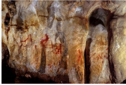
Görsel 1: La Pasiega Mağarası Duvar Resimi, İspanya.

üzerinde kazıma çizgilerle oluşturulmuş baklava motifleri olan okra parçası aynı zamanda, dünyadaki en eski sanat ürünü olarak da değerlendirilmektedir” 43 İnsanlık tarihinin uzun soluklu zaman dilimini düşündüğümüzde insanın resim sanatıyla ilgili ürün vermesi; ilk sanat ürünü olarak bilinen okra parçası incelendiğinde, sanat üretiminin günümüze yakın bir dönemde başladığı; insanın yonga yüzeyinden hemen sonra resim yüzeyi olarak duvarı kullandığını görürüz. O dönemde resimlerini, sığınak olarak kullandıkları mağara duvarlarını ve kaya oyuklarının duvarlarına olasılıkla günlük yaşamın bir parçası olan olayları resmetmişlerdir. Görsel:1’deki İspanya’daki La Pasiega mağara duvarında yer alan bu resim Paleolitik dönemde ele geçen en erken duvar resim sanatı ürünü olarak nitelendirilmektedir. Üzerinde olasılıkla merdiven olabileceği düşünülen bir nesne ve etrafında stilize hayvan, insan figürlerinin yer aldığı bu resmi incelediğimizde bir olay örgüsünden söz edebiliriz.