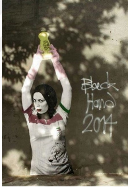
Görsel 17: Duvar Resmi, Black Hand, Tahran, 2014.

İran’da kurulan yeni rejim propagandanın önemini kavramış olması gerekir ki Meksika örneğinde olduğu gibi sanatın etkileme gücünden faydalanmak için duvar resimlerini propaganda amacıyla kullanmak istemiş, Meksika duvar resimlerinin konusu üzerine; İran tarihinin dini motiflerini, iş birliğini kabul eden sanatçılarla montajlamayı hedeflemiştir. Ancak bir ironi gerçekleşir ve “O kadar ki, devrimin sonucunda krallığın devrilmesinden sonraki süreçte, yeni doğan otoritenin ilk kararlarından biri, kentlerin duvarlarını her tür yazı ve çizimden temizlemek olur.” 67 Böylece sanata vurulan darbeyeyle yönetimin hayalini kurduğu propaganda mekanizmasına bağlı proje çökmüş, devrimden hemen sonra başlayan İran-İrak savaşı da sanatçıların gündeminde farklı konuların yer almasına yol açmıştır. Çağdaş Sanat Bağlamında Dünyadan verebileceğimiz en güzel örneklerden biri İran’da görülen duvar resimleridir.