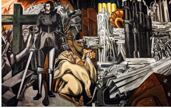
Görsel 13: Jose Clemente, Orozco.

Epic Orozco Murals at Dartmouth College, Side of Culture, https://sideofculture.com/2020/10/epic-orozco-murals-at-dartmouth-college/ , Erişim Tarihi:26.10.2024