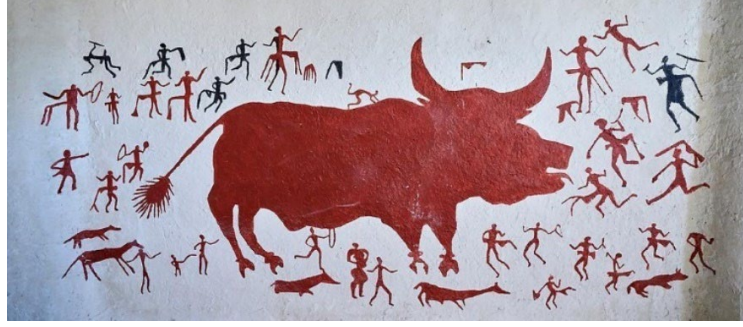
Görsel 5: Çatalhöyük, Ev içerisinde bir duvar resmi, Konya.

avlanma sahnelerine benzer nitelikte olan; leopar, aslan, domuz geyik gibi avlanan insanlarla, av hayvanların yanında Görsel 4’te görüldüğü gibi ev planlarına da yer verilmiştir. İnsanlık tarihinin ilk yerleşim planı olarak geçen bu planda evler birbirine bitişik olarak betimlenmiştir. Evlerin hemen arkasında Çatalhöyük’ün kuzey doğusunda yer alan volkanik bir dağ olan Hasan dağı tasvir edilmiştir.