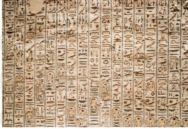
Görsel 22: Hiyeroglif yazısı örneği.

Baykuş mitolojilerde haberci kuş olarak geçer ve sezgiyi sembolize eder. Mısır Firavunların giydiği başlık kraliyet statülerini sembolize eder. Yukarı Mısır'ın firavunu beyaz başlığı ve Aşağı Mısır'ın kırmızı başlığı kullanır. Fırtına tanrısı Teşhub bir elinde balta ya da başka bir silah diğer elinde ise üç kollu yıldırımla sembolize edilir. Yazının bulunmasıyla birlikte yazıda kullanılan harfler ve işaretler başlı başına bir sembol olarak kullanılmıştır. Örneğin yan yana çizilen 3 adet çizginin 3 sayısını oluşturması gibi. Bu noktadan bakılınca sembollerin kültürün kısa ve öz anlatımından oluştuğu ve kültürel sembollerin sözel, yazınsal ya da görsel olarak ifade edilebildiğini söyleyebiliriz.