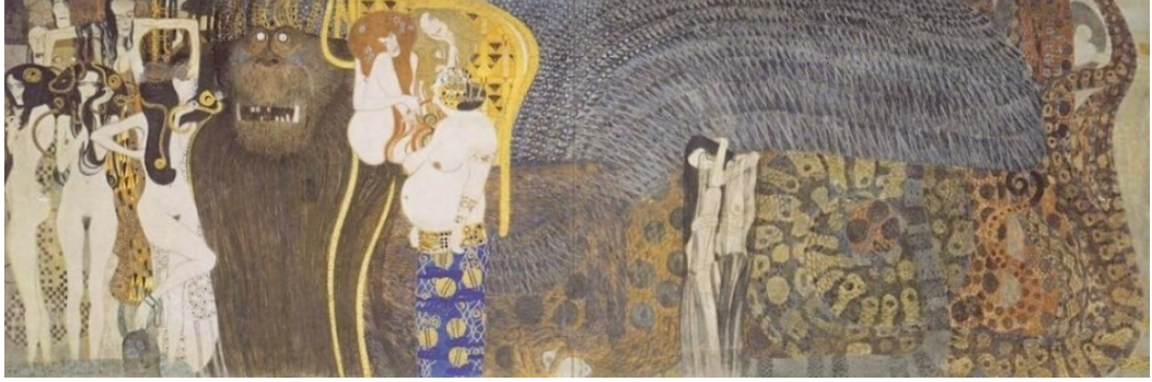
Görsel 11: Beethoven Frizi, Gustav Klimt.

üzerinde mavi ve sarı renkli bir etek var ve kadın hamile resmedilmiş. Hamile kadın ise yeni oluşumları ve umudu temsil ediyor.