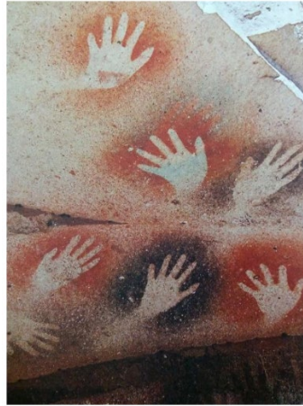
Görsel 2 : Eller Mağarasından bir kesit, 11.000 M.Ö. Arjantin. (Çetin, H.T.2018:3)

Kırmızı aşıboyası demir içerir ve demir molekülleri pusula iğnesi gibi hareket eder. Kırmızı aşıboyasının ıslak çamura sıvanması ve kuruması arasındaki birkaç dakika içinde, moleküllerin manyetik kuzeyi gösterecek biçimde yeniden dizildikleri tespit edilmiştir. O halde yanıt toprağın içinde ona rengini veren demirdir. Hint yogasında da sürdürülen aynı inanıştır. Bedenin kırmızı olan kökü dünyanın merkezi olan demir elementine bağlanmıştır. Tıpta vücuttaki demir eksikliğinin kansızlık olarak tanınması da buna eklenebilir. 46