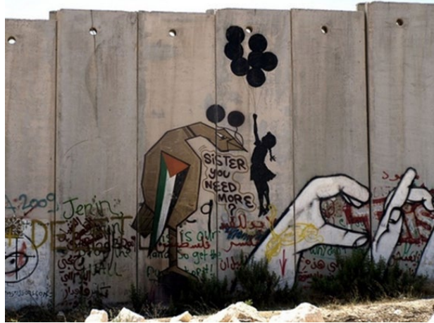
Görsel 16: Duvar Resmi, Banksy, Filistin

Dünya'dan örnekler için İran duvar resimleri önemlidir. İran duvar resimlerinin konuları anlamak için İran'ın yakın tarihine bir göz atmak gerekir. 1979 yılında İran'ın Muhammed Rıza Pehlevi liderliğindeki yönetim devrilmiş Ayetullah Ruhullah Humeyni yönetimindeki temeli İslam hukukuna dayalı Şii mezhebi görüşlerinin hâkim olduğu İslam Cumhuriyeti rejimi kurulması hedeflenen bir devrim gerçekleşmiştir. Devrim sonunda dışardan bakıldığında göze çarpan en büyük değişiklik İran'ın sembolü olan bayrağındaki tarihi öneme sahip 2.500 yıllık İran/Pers İmparatorluğu'nun simgesi Aslan ve Güneş gitmiş yerine, logo şeklinde Allah yazısı ve İran takvimine göre İslam devriminin olduğu gün olan 22. Bahman'ı yani 11 Şubat'ı simgeleyen 22 kez "Allah-u Ekber" yazısı bayrağa ilave edilmiştir. İslam Devrimi bir hükûmet değişikliğinden çok bir rejim değişikliği şeklinde gerçekleşmiştir. Devrimden sonra gelen rejim yöneticileri, devrim öncesi için, İran'ı Amerika'nın kölesi bir ülke olarak görürken devrimden sonra İran'ın bağımsızlaştığını düşündüler.