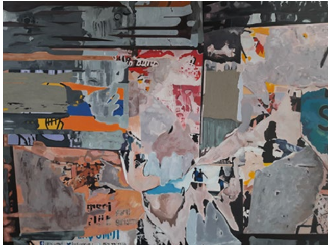
Görsel 29: Hatice Dilek Çokova, Varoluş Terapisi IV, 2022, Tuval Üzerine Karışık Teknik 100x120 cm.

Kimi zaman (Görsel 30) resimlerin oluşturulduğu bölgede, uzaktan yaptığım gözlemlerde tanık olduğum şey, özellikle gündüzleri; gençlerin elinde yanında getirdikleri çeşitli yazıcı nesnelere, kendisini ifade etmek için bir telaş içinde duvarda boş bir alan bulup hızlıca kimseye yakalanmadan kendi resmini duvara aktarmak için yoğun bir çaba içinde olmalarıydı.