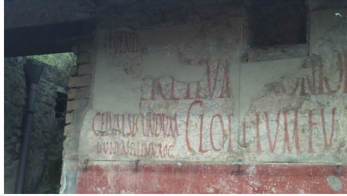
Görsel 10: Pompeii’de antik fast-food restoranı olarak da adlandırabileceğimiz thermopolium’un duvarından politik içerikli duvar yazısı.

Emir,B., Yelp ve Twitter’in Antik Roma Versiyonu: Müstehcen Duvar Yazıları , Arkeofoli İnternet Dergisi, 2017, https://arkeofoli.com/yelp-twitterin-antik-roma-versiyonu-mustehcen-duvar-yazilari/ .