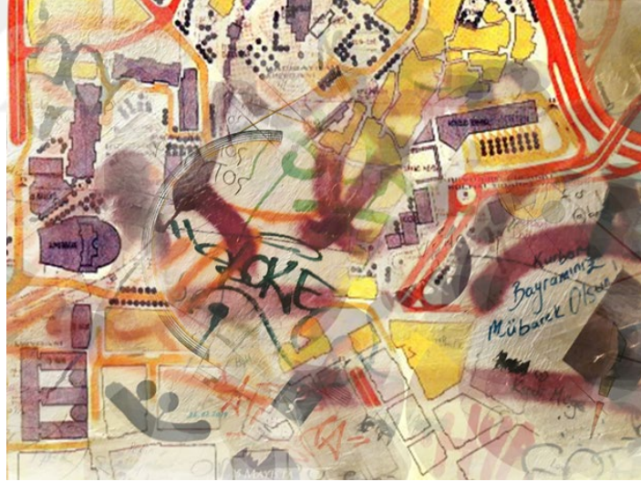
Görsel 31: Hatice Dilek Çokova, Kentsel Devinim I, 2024, Dijital Kolaj 90x120cm.

Kent yaşamının zorlukları arasında sıkışıp kalan insanın; yaşamı ve ortaya koyduğu kültürüyle arasında oluşturduğu derin bağın, toplumdaki entropinin etkisiyle gerçekleşen sosyolojik çöküşün ya da yükselişinde ortaya çıkan yok oluş veya dönüşümlerle yeni oluşumların kültür entropisi üzerinde etkilerini anlatır bu resimler. Entropinin etkisiyle yeni oluşan kentlerdeki değişimlerin yükselişinde; kentlerin yükselişi, çöküşünde çöküşü gibi entropinin yarattığı sonuçlar görsel anlatımla sanatsal bir dil ve ifade biçimi oluşturularak anlatılmaya çalışılmıştır.