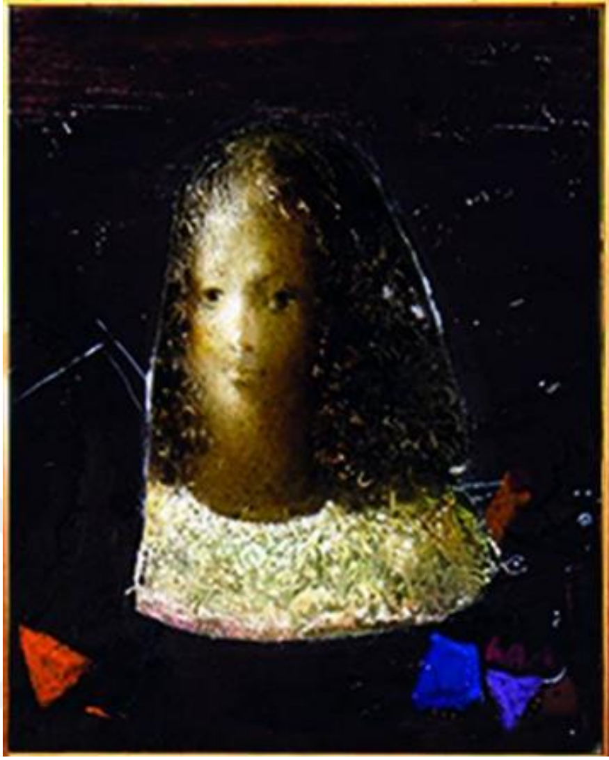
Şekil 6.Portre, Tuval Üzerine Yağlı Boya

Portre,hem modelin hem de ressamın kişiliğini ve karakterini vurgular. Resim geleneksel portrelerin ötesinde bir samimiyet ve ruhsal derinlik sunar. Portredeki bakışlar, izleyiciyle doğrudan iletişim kurar ve bir hikâye anlatır gibi hissettirir. Ayrıca, portredeki adeta kırık görünen yerler ruhsal parçalanmışlıkları keskin geçişler durağanlığı önler. Bakışlar düşünceli ve hüzünlü bir ifade taşır. Portredeki en dikkat çekici özelliklerden biri, farklı yüz ifadesi ve stilize edilmiş insan betimlemesidir. İnsan psikolojisini ve duygusal çeşitliliği yakalama yeteneğini göstermektedir.