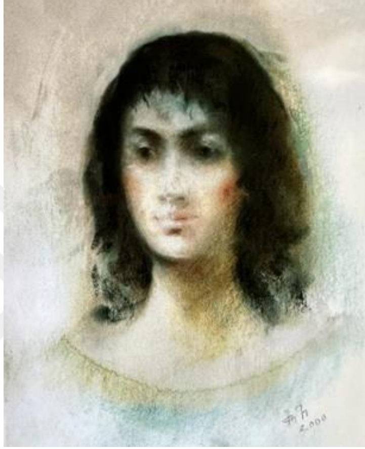
Şekil 4. Portre, Kağıt Üzerine Kuru Pastel, 2000

Sanatçı, resminde geleneksel portrelerin aksine ruhsal derinlik ve duyguyu ön plana çıkarmaktadır. Portredeki bakışlar izleyiciyle bağ oluşturup, hikaye anlatır gibi hissettirir. İnsan ruhundaki karmaşıklığı, hüznü ve derin duyguları bu portrede olduğu gibi diğerlerinde de görmekteyiz. Arka planda soğuk renkler kullanılması ve diğer detaylara önem vermemesi portrenin ruh halinin altını çizdiğini göstermektedir.