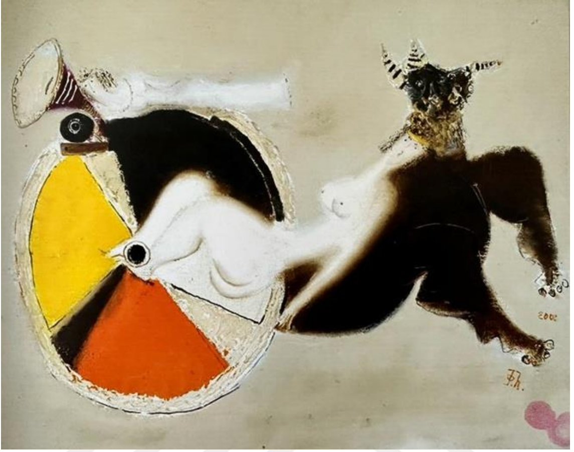
Şekil 8.Sabah Şarkısı, T.Ü.Y.B., 2002

Yine sanatçının vazgeçilmez unsuru olan kadın ve enstrüman bu eserde de yer bulmuştur. Koyu renkli insansı figüre rağmen iyiliği güzelliği ve sadeliği zıtlaştırmış ve beyaz tonlardaki kadın figürleriyle eseri desteklemiştir. Kadın figürlerini araba üzerinde uzanmış vaziyette ruhsal dinginliği adeta izleyiciye hissettirmektedir. Tekerlek üzerindeki sarı, kırmızı ve siyah, beyaz renk döngüsü resme hareket katmıştır. Koyu tonlu, canlı ve tekerlekli araba görünümü adeta mitolojik bir hikâyenin resmedilmiş halini sunmaktadır. Sanatçının müzik ve kadın duygusallığı diğer eserlerinde olduğu gibi bu eserinde de izleyiciye masalsı bir etkiyle sunulmuştur.