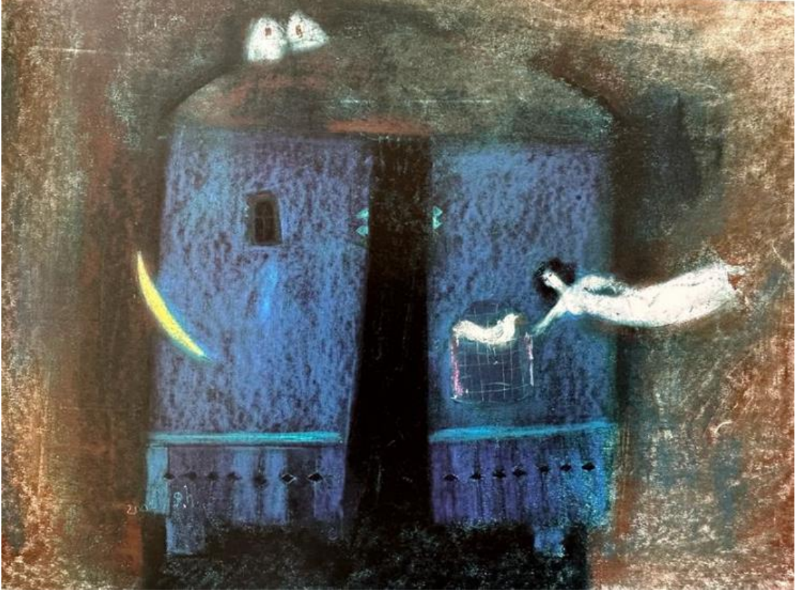
Şekil 2.Baba Ocağı, Kağıt Üzerine Kuru Pastel, 2001

Sanatçı burada eve olan özlemini yansıtmıştır. Koyu tonda oluşturulan renk karmaşası özlemi ve hasreti izleyiciye vurgulayan duygusallığı ifâde etmektedir. Eşine ve kızlarına olan hasretini kadın ve kuş figürüyle dışavurmuştur. Temizliği, sağlığı ve özlemi açık renk figürlerle zıtlık içinde sunmayı yeğlemiştir. Ana temaya evdekilere olan kavuşma ümidi ve yine saflığı temsil eden kadın figürü ekspresyonist tarzda ele alınmıştır.