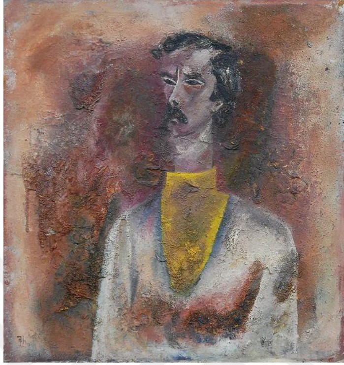
Şekil 5.İnsan Portresi

Önemli sanatçılarından biri olarak kabul edilen Fikret Haşimov'un özellikle portreleri önemlidir. Portrelerinin özgünlüğü, estetiği ve insan figürünün ruhunu yansıtmaktadır. Onun tarzı ve özgünlüğü, sanatseverlerin ve resim tutkunlarının ilgisini çekmiştir. Haşimov, İnsan figürünün güzellik ve karmaşıklığını yakalamadaki becerisi ile öne çıkar. Onun sanatının temel taşlarından biridir ve onun sanatçı kişiliği, özgün tarzı ve insan figürüne getirdiği benzersiz bakış açısı önemlidir.