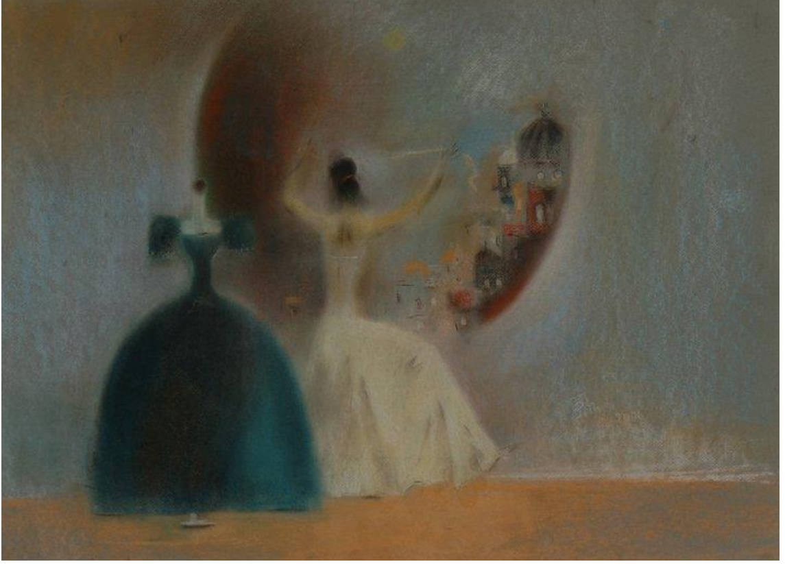
Şekil 1.Ayna Karşısında, Kağıt Üzerine Kuru Pastel, 2001

Sanatçı, bu resminde fon olarak koyu ve kontrast tonlar kullanarak odağı kadına yöneltmiştir. Figürün kıyafetlerindeki renk geçişleri boyama tadındadır. Sanatçı, mekan figür ve nesne ilişkisini beraber kullanmıştır. Resimlerinde melankolik ve gizemli taraf bu resimde de vardır. Duvardaki soğuk ve sıcak renk geçişlerini parmaklarıyla adeta eritmiş resme bütünlük vermiştir.