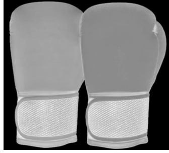
Şekil 1: Eldiven

sporcuların güvenliğini sağlamak, rekabetin adil bir şekilde gerekleşmesini temin etmek ve boks sporunun standartlarını oluşturmak amacıyla geliştirilmiştir.