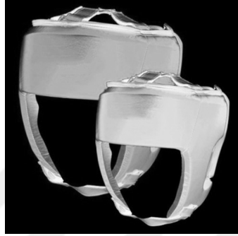
Şekil 2: Kask