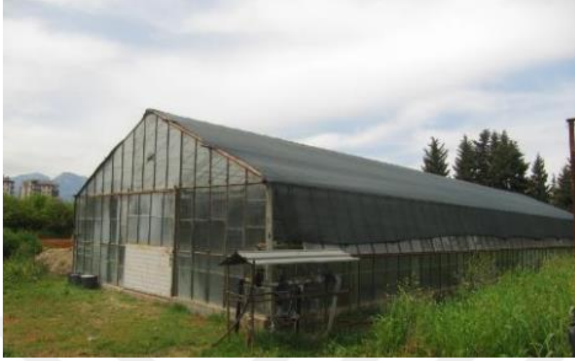
Şekil 3.3. Çalışmanın yapıldığı sisleme serasından bir görünüm

Çalışma Akdeniz Üniversitesi Ziraat Fakültesi Araştırma ve Uygulama alanında bulunan sisleme serasında (Şekil 3.3) yürütülmüştür.