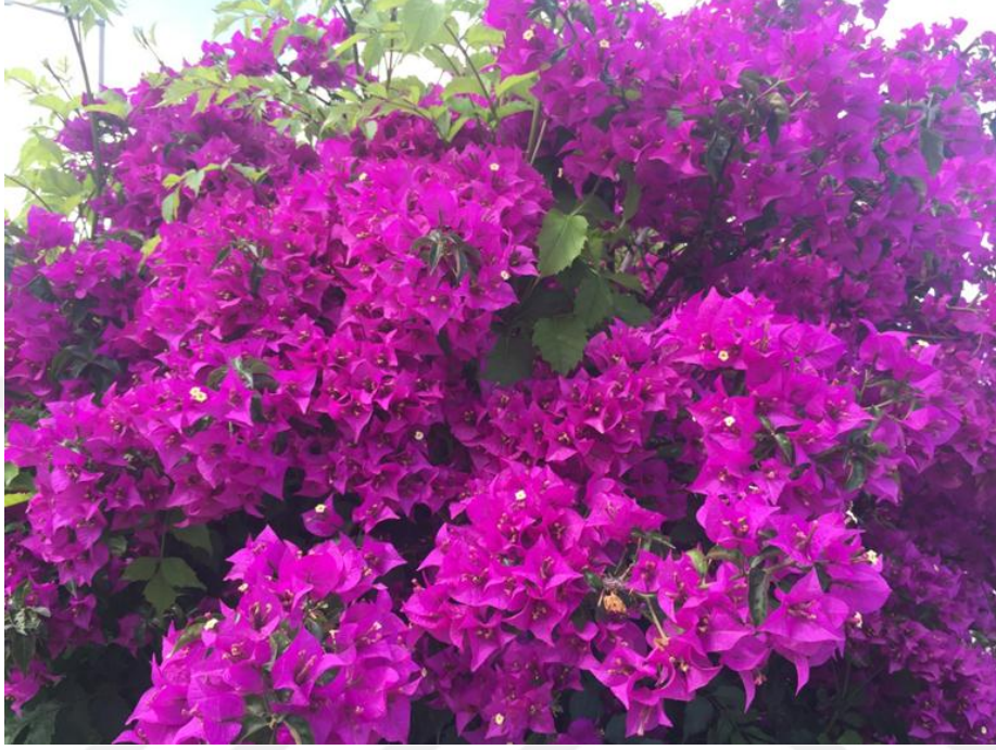
Şekil 3.1. Gelin Duvağı ( Bougainvillea glabra ) türünden bir görünüm

Bougainvillea cinsi içerisinde yer alan Bougainvillea glabra Choisy türü bu çalışmanın materyalini oluşturmuştur.( Şekil 3.1)