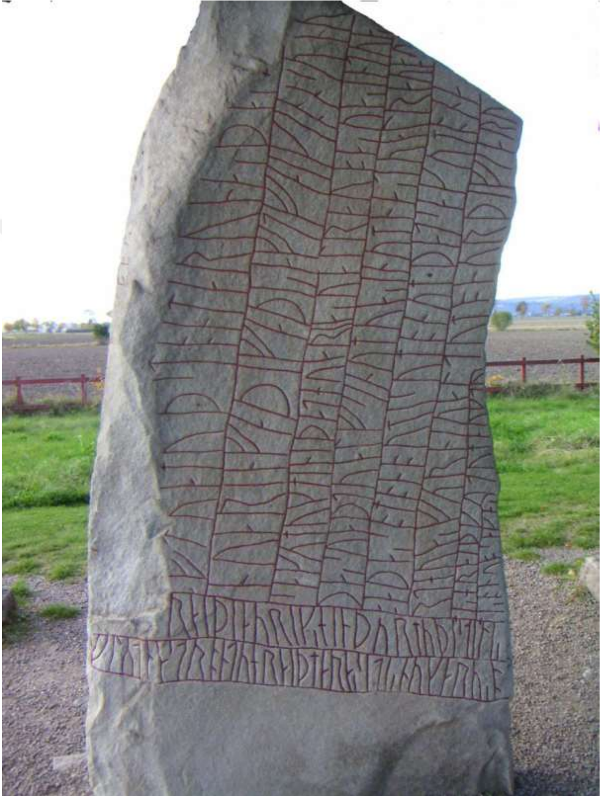
Runik Taş Anıt Örneği