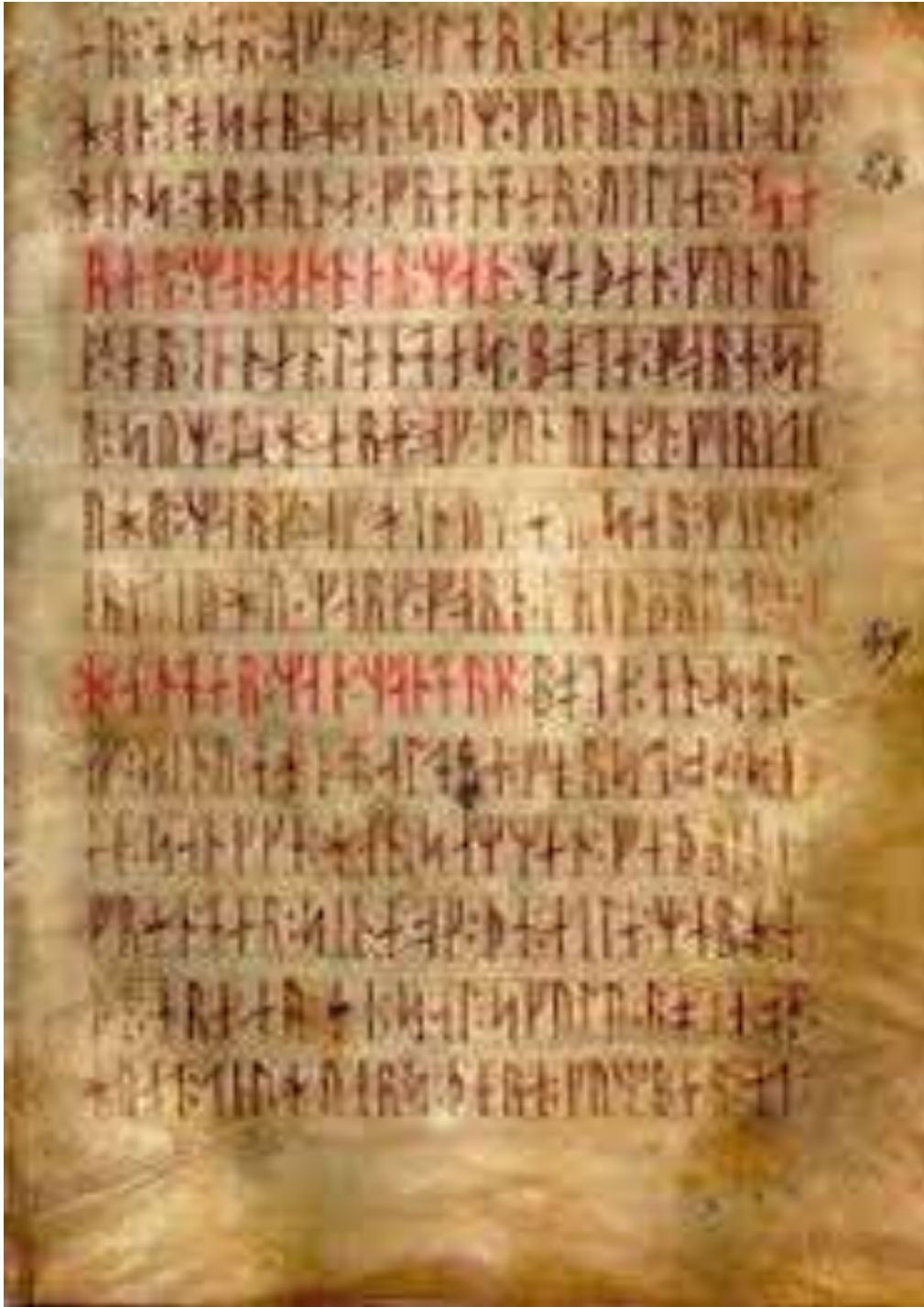
Runik Yazı Örneği