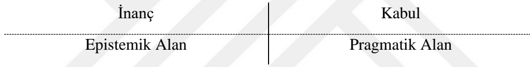
Şekil 1: Laydman’e Göre Yapıcı Empirizmin İki Alanı

James Ladyman, Fraassen yapıcı empirizmi tanımlarken kullandığı bu iki alana, kabul ve inanca dikkat çekmektedir; “İnanç sebepleri ile kabul sebepleri arasında bir ayrım vardır: İlki epistemik alandır ve ikincisi pragmatik alandır. Teorilerin tek epistemik erdemleri mantıksal tutarlılık ve fenomen ile dayanıklılık için yeterliliğin empirik erdemleridir; sadelik, açıklayıcı güç, vb. gibi tüm diğer erdemler yalnızca pragmatiktir.” 87