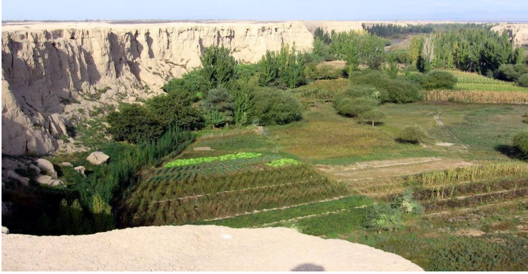
Şekil 3.11. Seleksiyon çalışması yapılan Ayrancı ilçesi Divle Mahallesi (Orjinal)

Ayrancı ilçesinde en düşük sıcaklığın yaşandığı aylar Ocak ve Şubat olup ( -13.58^{\circ}\text{C} / -11.52^{\circ}\text{C} ), ceviz ağaçlarının yapraklanma ve çiçeklenme dönemi olan Mart ve Nisan aylarında sıcaklık değerleri 0^{\circ}\text{C} ve altında seyretmektedir. (Çizelge3.7).