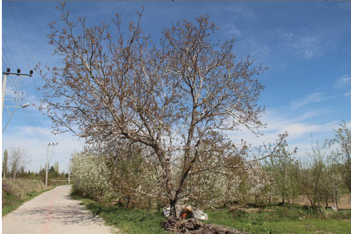
Şekil 4.3. 42-ER-01 genotipinde ağaç (Orjinal)