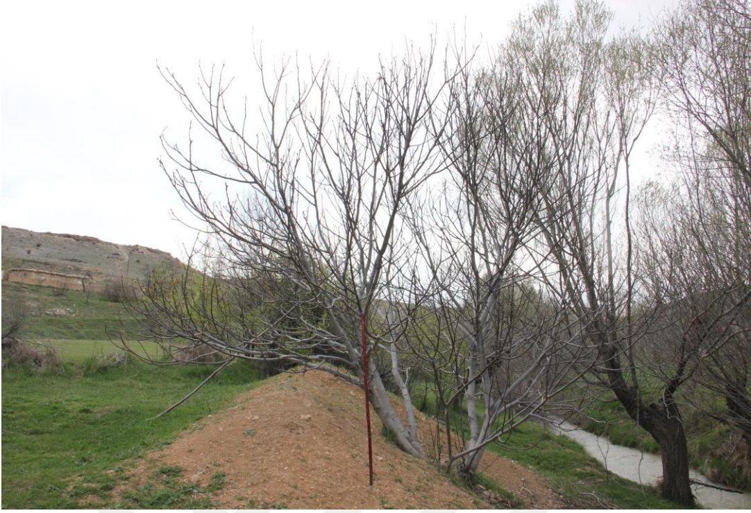
Şekil 4.9. 70-AY-01 genotipinde ağaç (Orjinal)