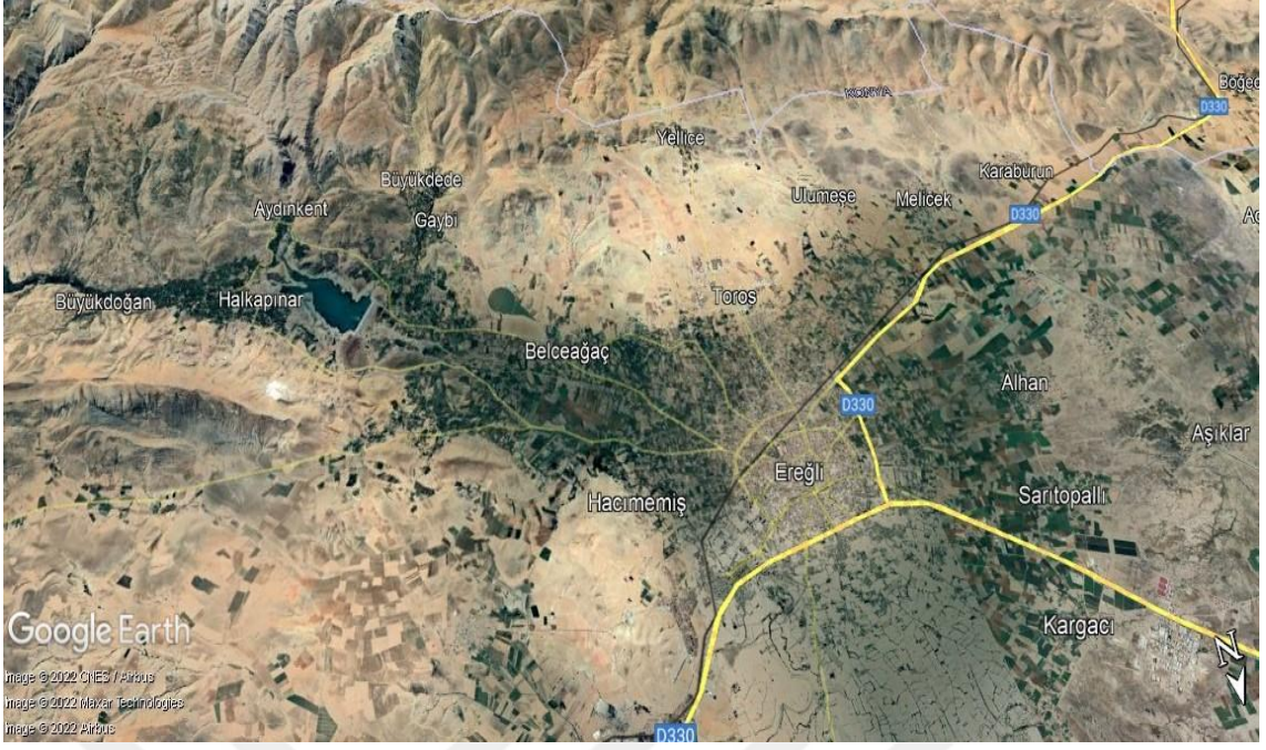
Şekil 3.1. Seleksiyon çalışması yapılan Ereğli ilçesi fiziki durum (Google, 2023)