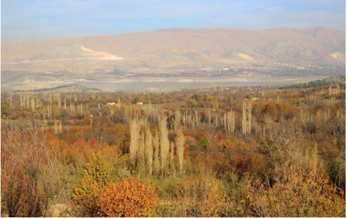
Şekil 3.2. Ereğli Büyükdedeköy Mahallesi bahçe alanları (Canpolat, 2022).