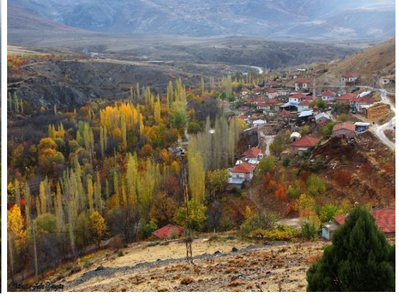
Şekil 3.8. Halkapınar ilçesi bahçeleri (Orjinal)

Yörede M.Ö. 1,200 ile M.Ö.742 yılları arasında Anadolu’da kurulan şehir devletlerinden birisi olan Hititler Tuvana Krallığı’nı kurmuşlardır. Bu krallıktan günümüze halen İvriz mahallesinde bulunan Kral Warpalavas tarafından yaptırılan bereket tanrısı Tarhundas ve Kral Warpalavas’ın tasvir edildiği dünyanın en eski tarım anıtı bulunmaktadır. Anıtta krala göre daha büyük ölçülerde tasvir edilen Tarhundas, ellerinde başaklar ve üzüm salkımı tutmaktadır. Böylece Tarhundas’ın aynı zamanda bolluk ve bereket tanrısı olduğu da anlaşılmaktadır. Tanrı Tarhundas’ın elinde buğday başağı ve üzüm salkımı bulunması bölgede tarımın çok eskilere dayandığını gösteren bir işarettir. Tanrının yüz kısmının önünde ve kralın arkasındaki Hitit hiyeroglif yazısında “Ben hakim ve kahraman Tuvana Kralı Warpalavas, sarayda bir prens iken bu asmaları diktim, Tarhundas onlara bereket ve bolluk versin” denilmektedir (İKMT, 2022). Halkapınar ilçesi toplam 7,500 ha tarım alanına sahip olup, 3,243 hektarlık alanını tahıllar ve diğer bitkisel ürünlerin alanı oluşturmaktadır. Ardından 1,255 hektarlık nadas alanı gelmektedir.