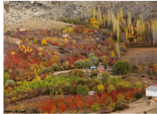
Şekil 3.6. Halkapınar ilçesi bahçeleri (Orjinal)