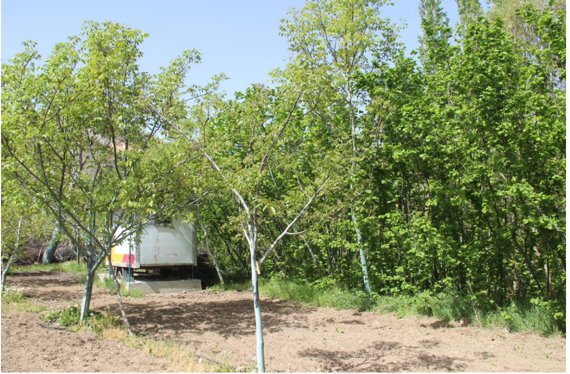
Şekil 4.13. 42-HA-04 genotipinde ağaç (Orjinal)