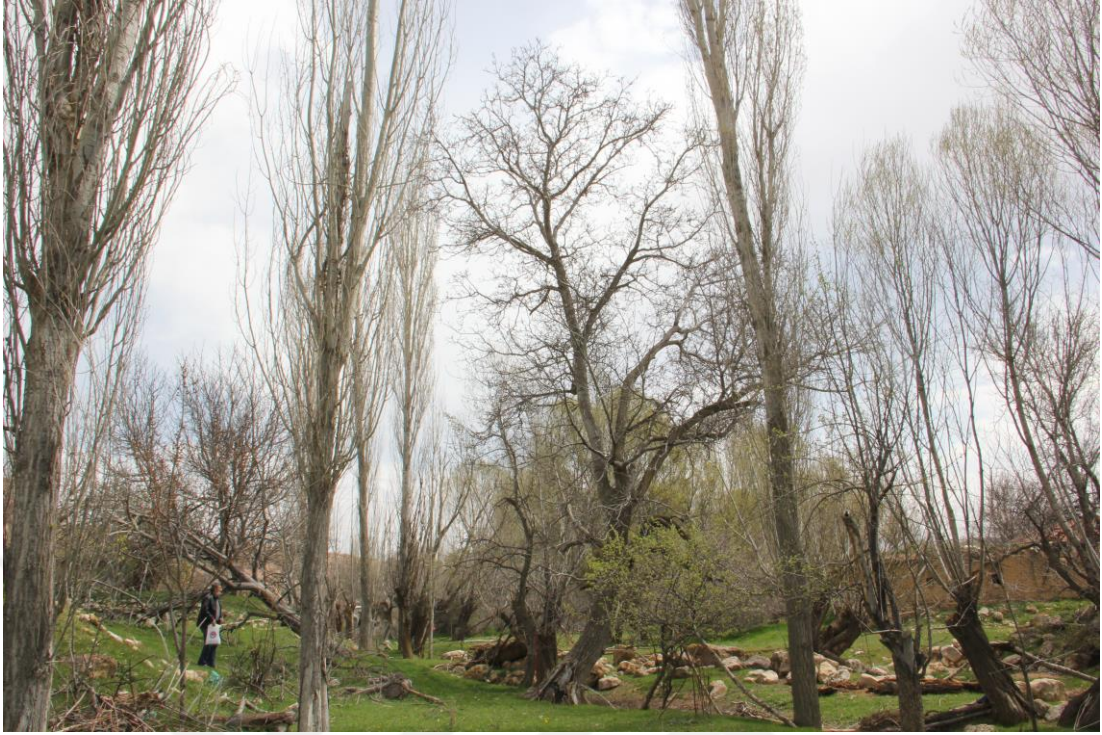
Şekil 4.5. 70-AY-06 genotipinde ağaç (Orjinal)