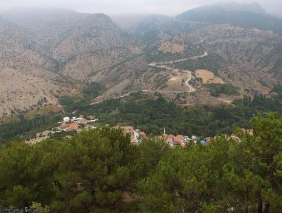
Şekil 3.7. Halkapınar ilçesi bahçeleri (Orjinal)