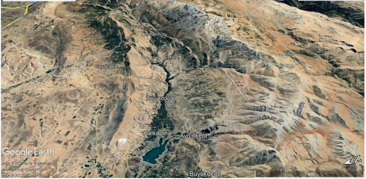
Şekil 3.4. Seleksiyon çalışması yapılan Halkapınar ilçesi fiziki durum (Google, 2023)

İlçe, güneyinde bulunan ve Toros Dağları'nın bir parçası olan Bolkar Dağları ile kuzeyindeki Güney Dağı arasında bir vadi içerisinde yer almaktadır. İlçenin tarla tarımı yapılan arazisi 1985 yılında faaliyete geçen İvriz Baraj Gölet alanı içerisinde kaldığından ilçede meyvecilik ön plana çıkmıştır. (Şekil 3.5;3.6;3.7;3.8). Ancak meyvecilik yapılabilen tarım parselleri topografya nedeniyle küçük ölçekli olup ve makinalı tarımdan ziyade insan işçiliğine dayalı küçük bahçecilik şeklindedir. Bölgede kiraz başta olmak üzere vişne, ceviz, elma, armut, erik yetiştiriciliği yapılmaktadır. Bolkar Dağları'ndan gelen İvriz ve Delimahmutlu Çayları meyve bahçelerini sulamakta ve sonrasında İvriz Baraj Göleti'nde Ereğli Ovası'nı sulamak için biriktirilmektedir. Bu kaynak suları aynı zamanda Halkapınar ve Ereğli ilçesinin içme suyu ihtiyacını karşılamaktadır (İKMT, 2022).