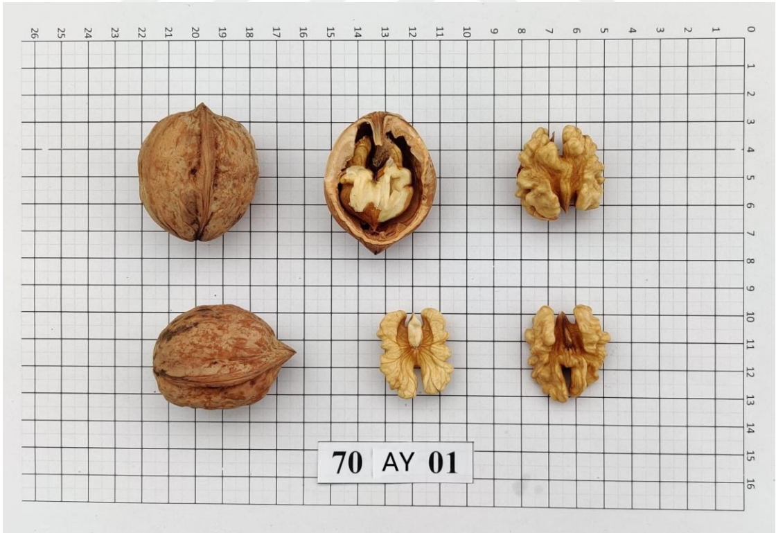
Şekil 4.10. 70-AY-01 genotipinde meyve (Orjinal)