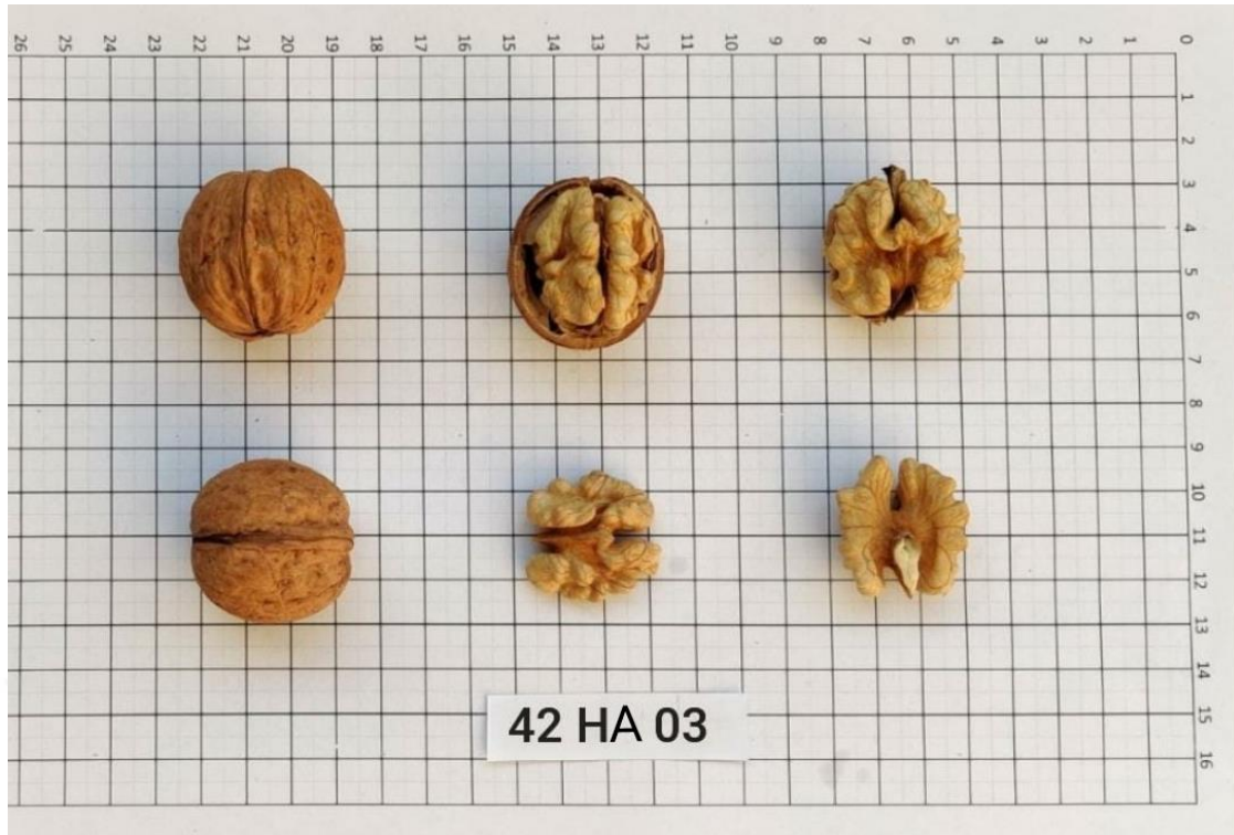
Şekil 4.12. 42-HA-03 genotipinde meyve (Orjinal)