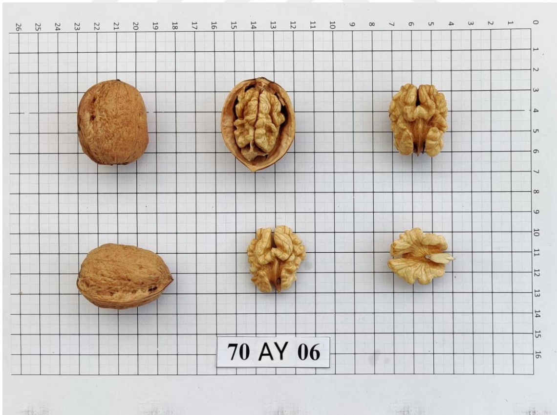
Şekil 4.6. 70-AY-06 genotipinde meyve (Orjinal)