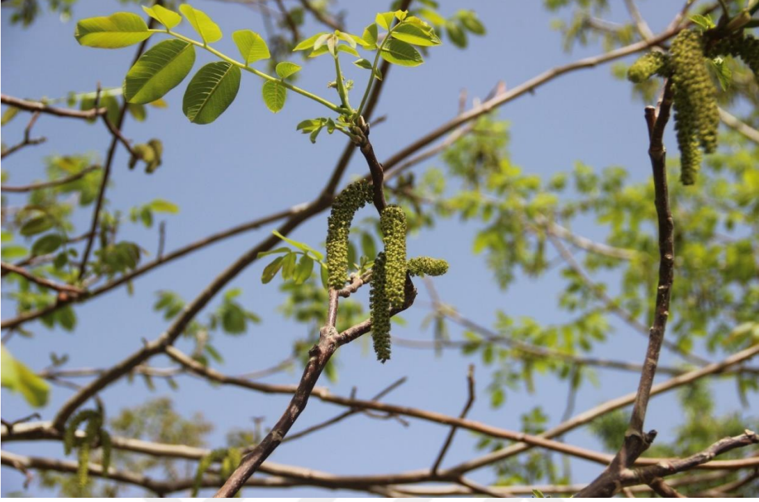
Şekil 3.14. Ceviz tiplerinde erkek çiçeklerin aktif dönemi (Orjinal)