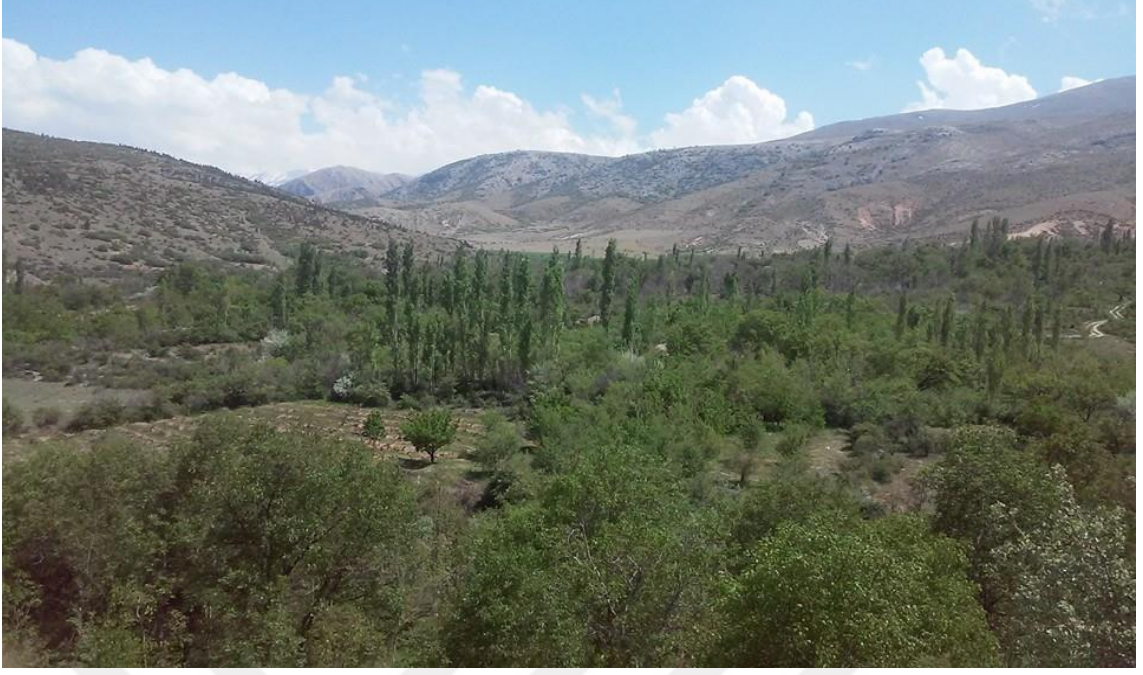
Şekil 3.3. Ereğli Gaybi mahallesi bahçe alanları (Canpolat, 2022)

Ereğli ilçesinin de içinde bulunduğu Konya Kapalı Havzası yaklaşık 3,5 milyon hektar tarımsal alana sahip olmasından ötürü, ülkemizin tahıl ambarı olarak anılmaktadır. Yarı kurak iklime sahip olan havzanın büyük bir bölümünde yıllık ortalama yağış miktarı 300-350 mm civarında seyretmektedir ve yeterli akışa sahip akarsuların oluşumuna gerekli koşulları sağlayamamaktadır. Bu durum 1980'lerin başından beri hüküm sürmekte olan kurak dönem nedeniyle azalan yıllık yağış miktarı sebebiyle daha da kritik olmakta ve böylece havza yarı kurak iklimden kurak iklim özelliklerine doğru yönelmektedir (Yılmaz, 2017).