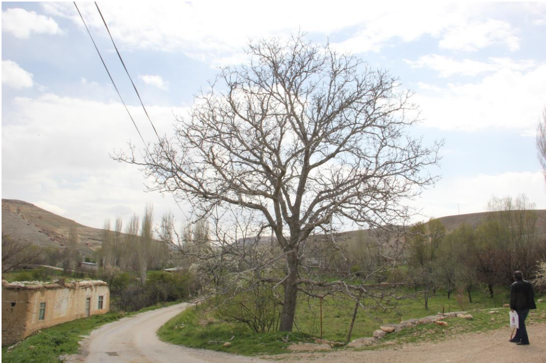
Şekil 4.7. 70-AY-05 genotipinde ağaç (Orjinal)