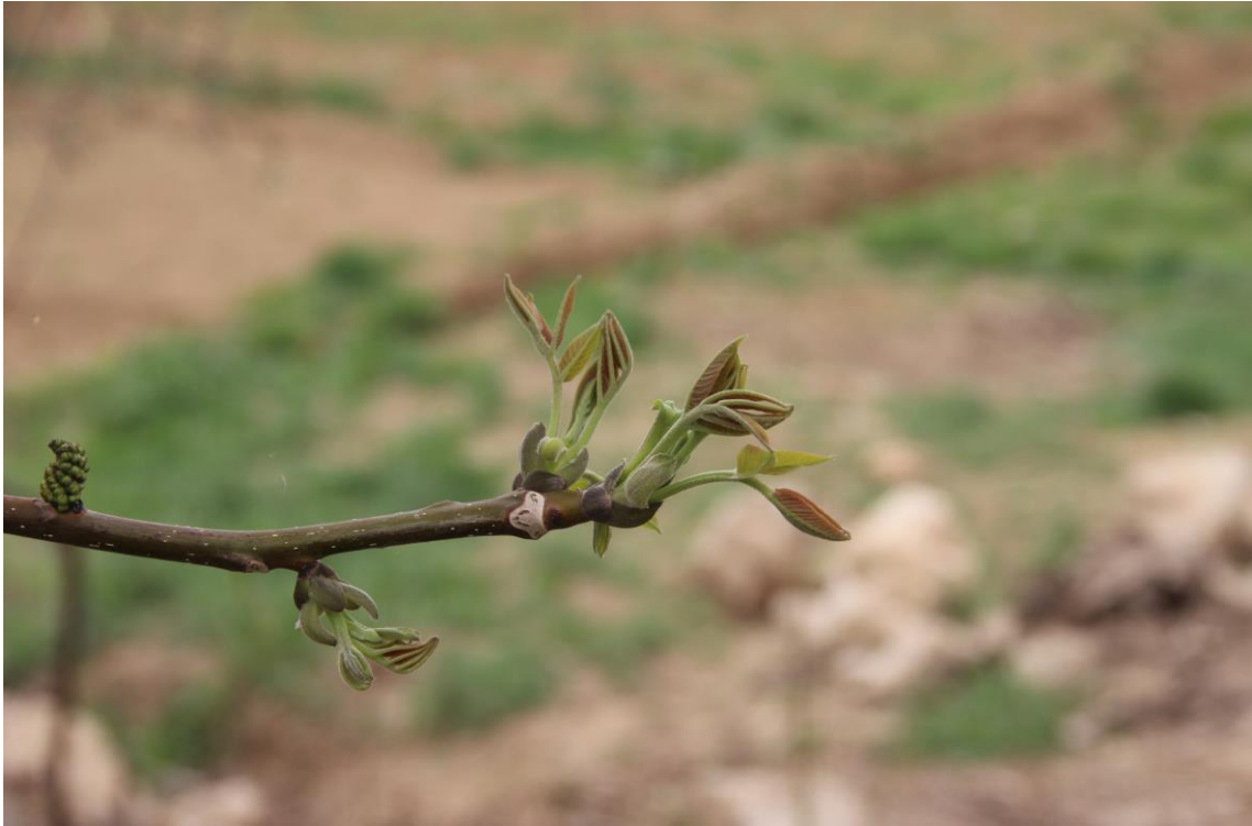
Şekil 3.13. Ceviz tiplerinde yapraklanma başlangıcı (Orjinal)

Yapraklanma başlangıcı dönemi şekil 3.13 te gösterilmiştir.