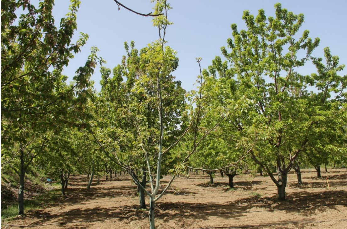
Şekil 4.11. 42-HA-03 genotipinde ağaç (Orjinal)