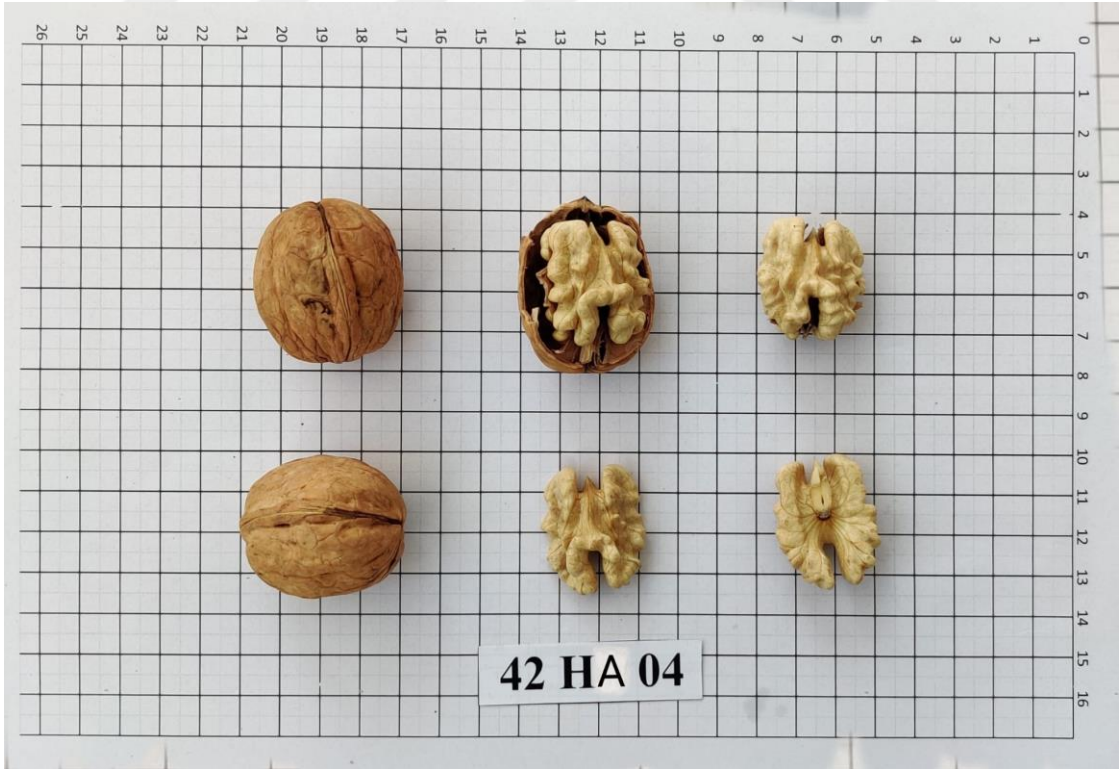
Şekil 4.14. 42-HA-04 genotipinde meyve (Orjinal)