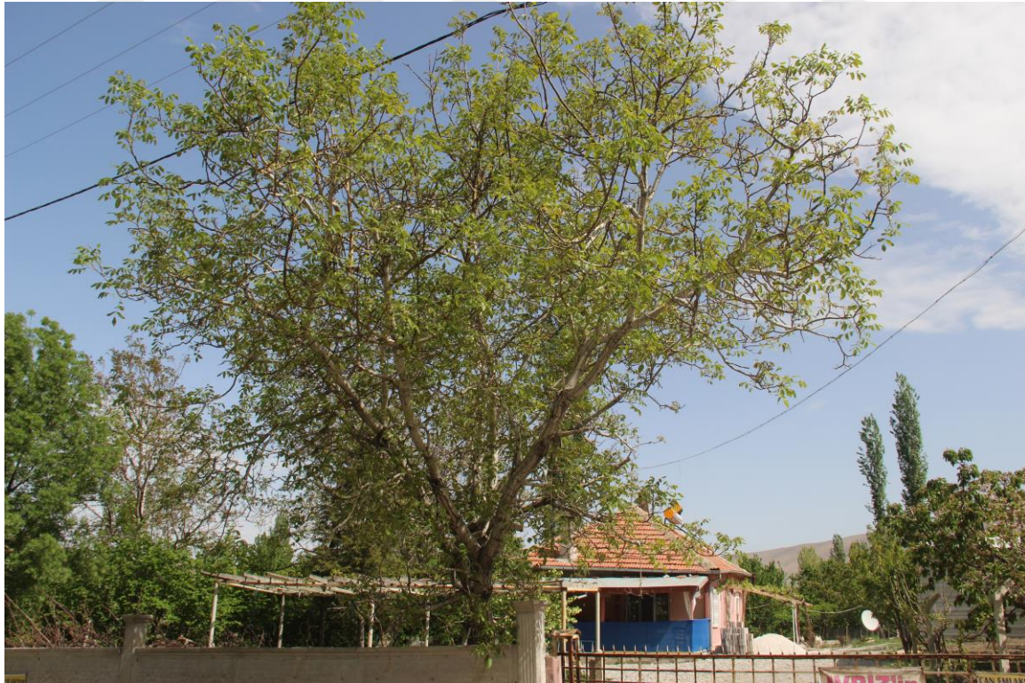
Şekil 4.15. 42-HA-06 genotipinde ağaç (Orjinal)