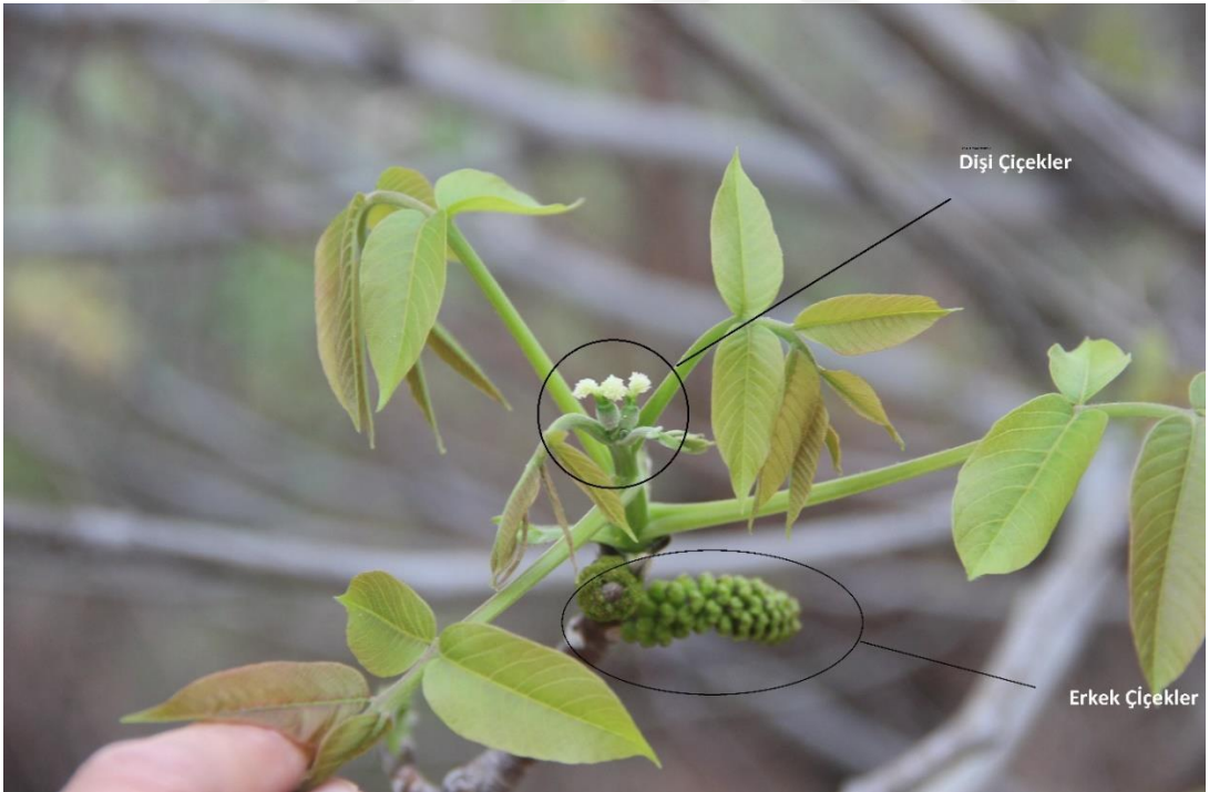
Şekil 3.15. Ceviz tiplerinde erkek çiçeklerin aktif dönemi (Orjinal)