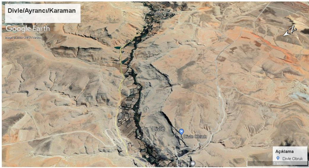
Şekil 3.9. Seleksiyon çalışması yapılan Ayrancı ilçesi Divle mahallesi fiziki durum (Google, 2023)

Ayrancı ilçesinde ceviz ağaçlarının büyük kısmı Toros dağlarından gelen Divle Çayı'nın geçtiği dere kenarlarında ve Divle Mahallesi'nde bulunmaktadır (Şekil 3.9; 3.10;3.11) Ağaçların hemen hemen tamamı tohumdan yetişmiş yaşlı ağaçlardır. Çalışmaya Ayrancı ilçe merkezinden başlanmış ve Divle baraj bölgesi taranarak devam edilmiştir (Şekil 3.9). Daha sonra Divle Suyu'nun yatağı boyunca devam edilerek Divle mahallesine kadar olan dere yatağında bulunan tohumdan çıkmış yaşlı ceviz ağaçları incelenmiştir (Şekil 3.10;3.11). Çalışmada ilçe ceviz sahasının tamamına yakını taranmıştır. Ayrancı ilçe merkezinde rakım 1,145 metre olup, Divle mahallesinde 1,317 metreye kadar yükselmiştir.