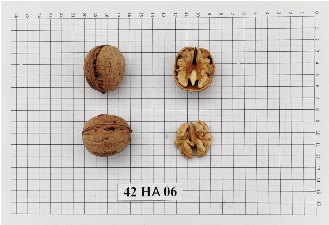
Şekil 4.16. 42-HA-06 genotipinde meyve (Orjinal)