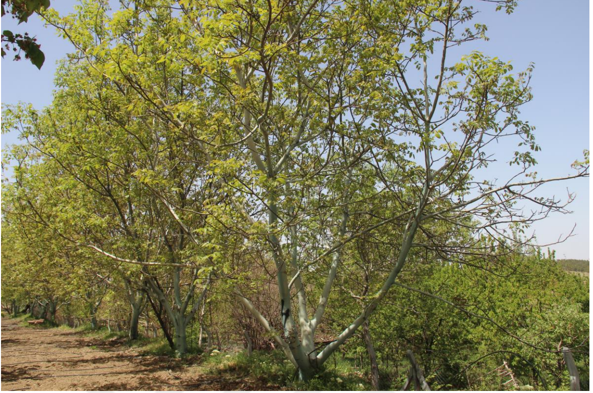
Şekil 4.1. 42-HA-07 ceviz genotipinde ağaç (Orjinal)