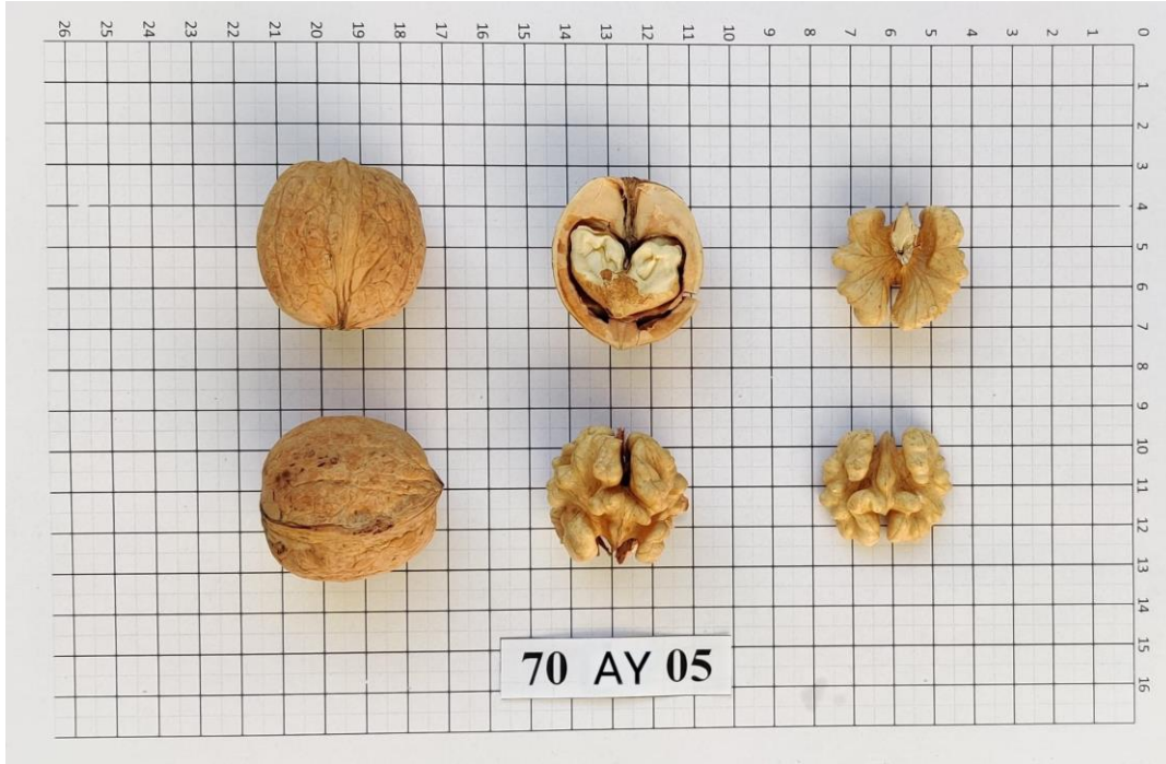
Şekil 4.8. 70-AY-05 genotipinde meyve (Orjinal)