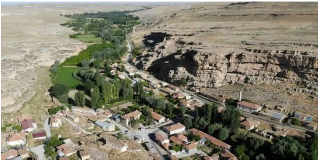
Şekil 3.10. Seleksiyon çalışması yapılan Ayrancı ilçesi Divle mahallesi (Orijinal)