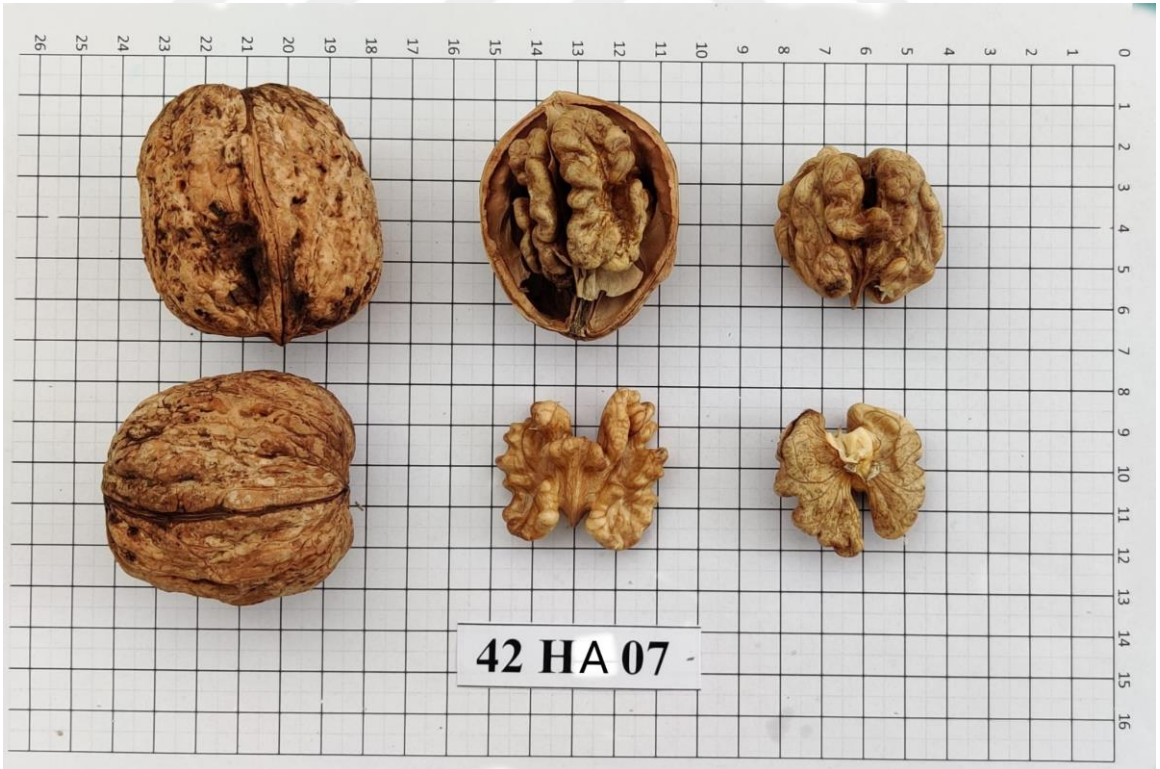
Şekil 4.2. 42-HA-07 ceviz genotipinde meyve (Orjinal)