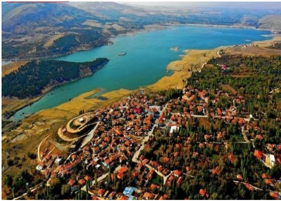
Şekil 3.5. Halkapınar ilçesi göleti (Orjinal)

İlçe, güneyinde bulunan ve Toros Dağları'nın bir parçası olan Bolkar Dağları ile kuzeyindeki Güney Dağı arasında bir vadi içerisinde yer almaktadır. İlçenin tarla tarımı yapılan arazisi 1985 yılında faaliyete geçen İvriz Baraj Gölet alanı içerisinde kaldığından ilçede meyvecilik ön plana çıkmıştır. (Şekil 3.5;3.6;3.7;3.8). Ancak meyvecilik yapılabilen tarım parselleri topografya nedeniyle küçük ölçekli olup ve makinalı tarımdan ziyade insan işçiliğine dayalı küçük bahçecilik şeklindedir. Bölgede kiraz başta olmak üzere vişne, ceviz, elma, armut, erik yetiştiriciliği yapılmaktadır. Bolkar Dağları'ndan gelen İvriz ve Delimahmutlu Çayları meyve bahçelerini sulamakta ve sonrasında İvriz Baraj Göleti'nde Ereğli Ovası'nı sulamak için biriktirilmektedir. Bu kaynak suları aynı zamanda Halkapınar ve Ereğli ilçesinin içme suyu ihtiyacını karşılamaktadır (İKMT, 2022).