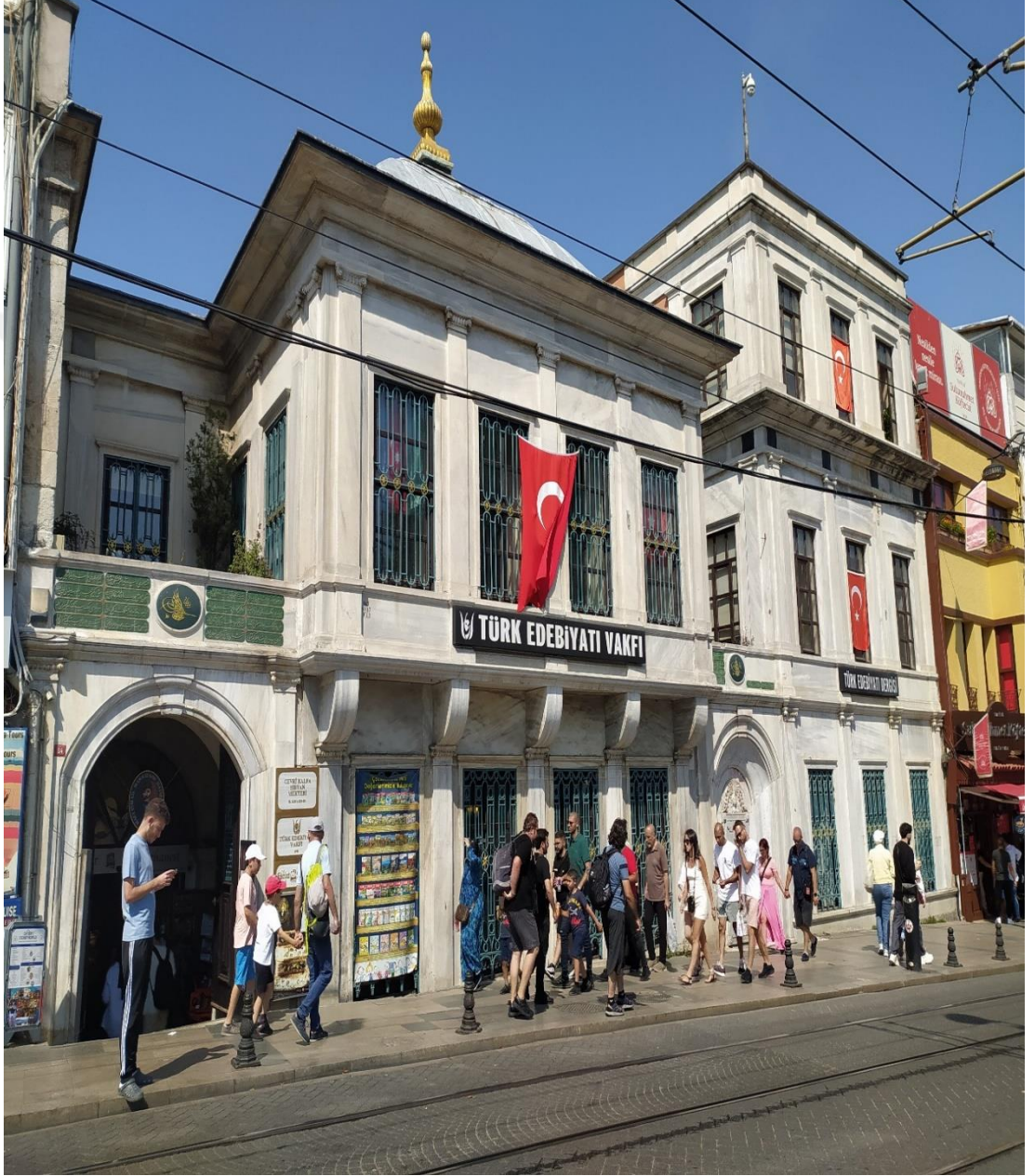
EK- 2.1: Cevri Kalfa Sıbyan Mektebi binası