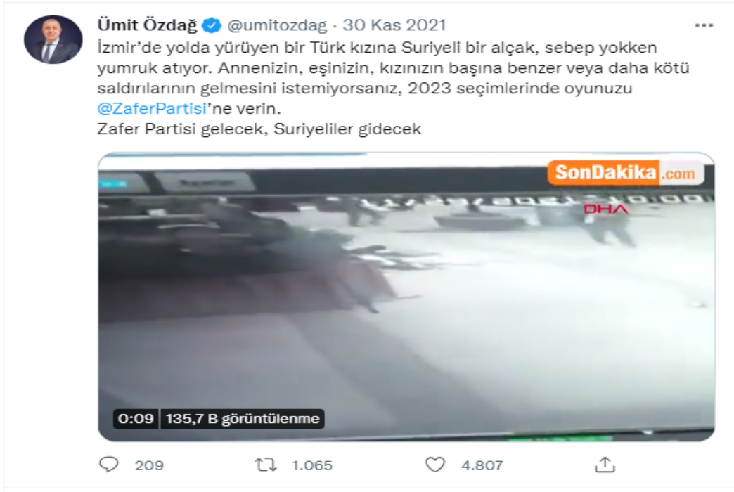
Şekil 3. İzmir’de yolda yürüyen kadına saldırı

öldürülmesine dikkat çekerken, olaydan hem iktidarın hem de muhalefetin sığınmacı politikalarını sorumlu tutmaktadır.