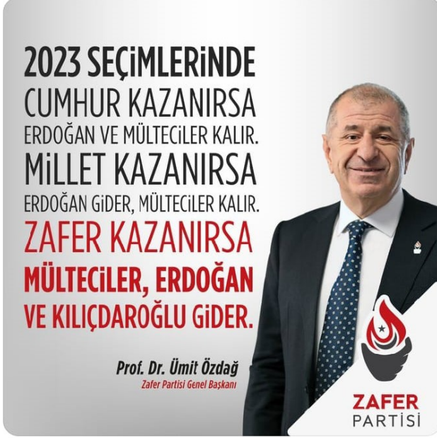
Şekil 14. 2023 seçimleri sığınmacı söylemi

Eğer Erdoğan Millet ittifakının desteği ile aday olursa ve