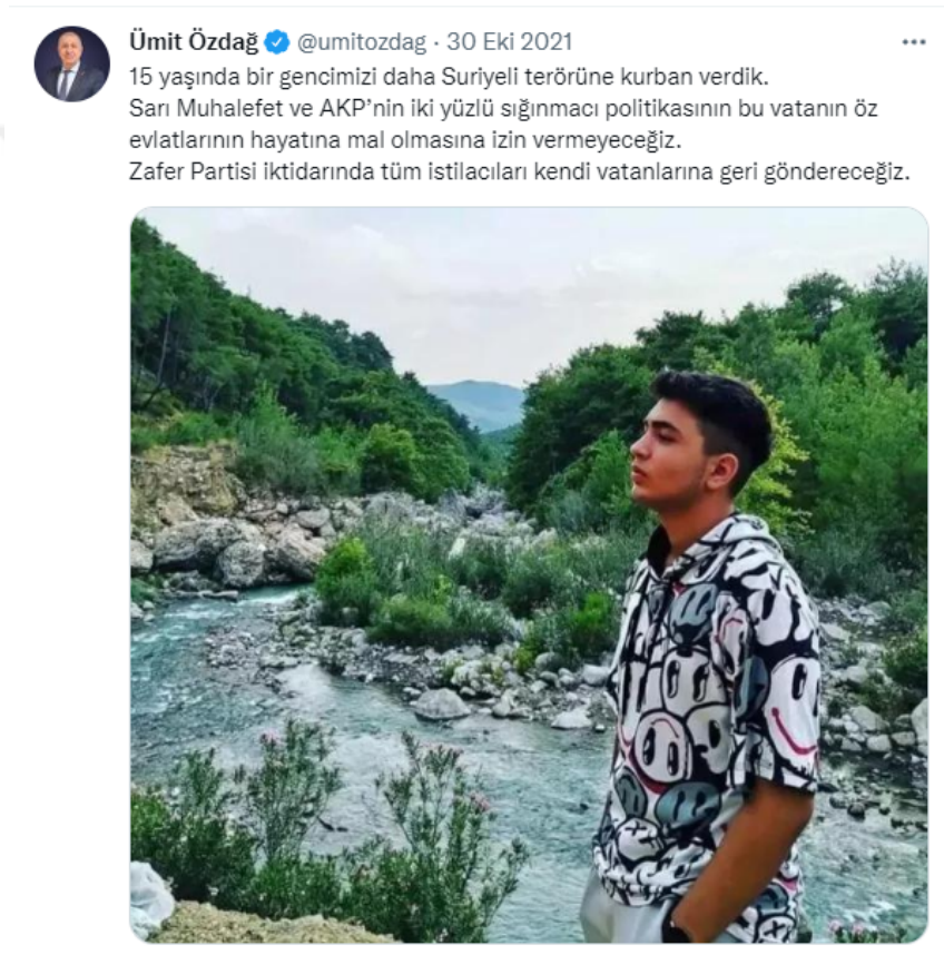
Şekil 2. 15 yaşında Suriyeliler tarafından öldürülen genç

dil bir iktidar aracıdır ve bu noktada dil aracılığıyla kültürel değer ve normlara atıf yapılmaktadır (Kalav, 2012). Özdağ da toplumsal hassasiyet gösterilen bir kavram üzerinden söylem geliştirmekte, algıları bu yönde toplamaya çalışmaktadır. Türk kültür yapısında önemli bir yere sahip olan bu kavramsal hassasiyetle, algıları bu yönde yönetme gayreti içerisindedir.