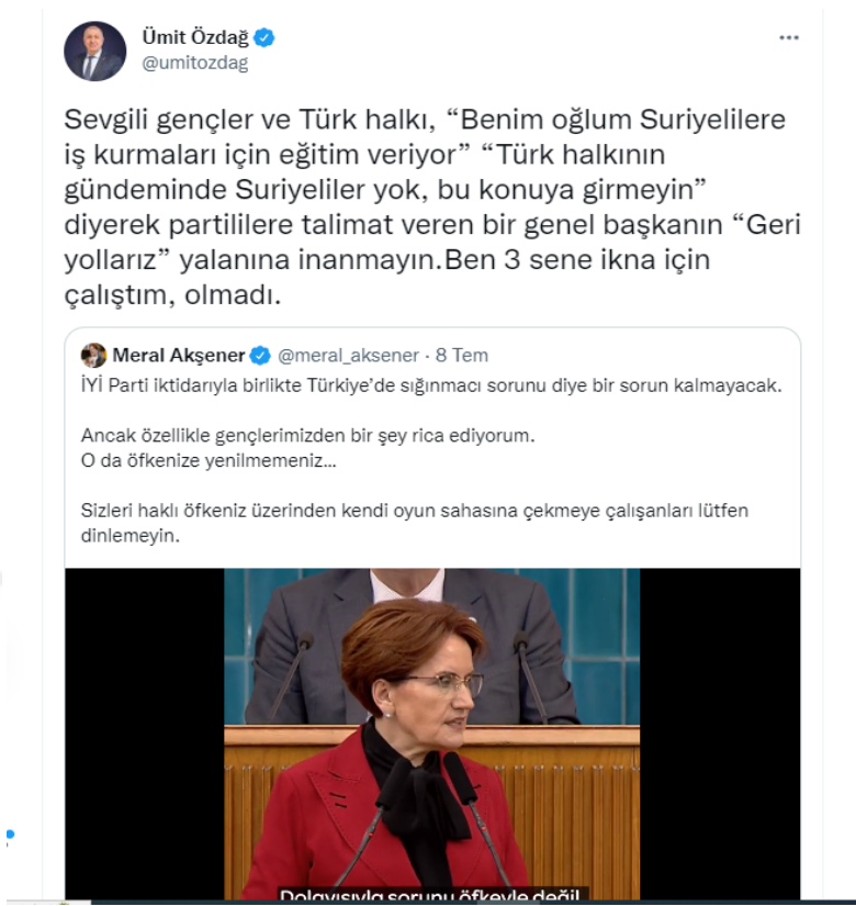
Şekil 11. İYİ Parti sığınmacı politikasına yönelik eleştiri

Özdağ, yine bir diğer rakibi olan İYİ Parti Genel Başkanı Akşener’e yönelik attığı tweette, Akşener’in sığınmacı sorununu çözeceklerine yönelik açıklamasını hedef aldı. Akşener’in oğlunun Suriyelilere iş kurmaları için eğitim verdiğini ve partililere “Türk halkının gündeminde Suriyeliler yok, bu konulara girmeyin” şeklinde talimat verdiğini iddia etti. Rakiplere yönelik bu hamleler, sağlıklı bir algı yönetiminde olması gereken net mesajlar açısından kafa karışıklığı oluşturmaya yöneliktir. Zira İYİ Parti sığınmacı sorununu çözeceğini iddia ederken, iddianın zıttı niteliğinde olan bir durumu ortaya koyan Özdağ, kafaları karıştırmakta ve rakibini karmaşık durum içerisinde zor durumda bırakarak, hedef kitle nezdinde soru işareti oluşturmaya çalışmaktadır.