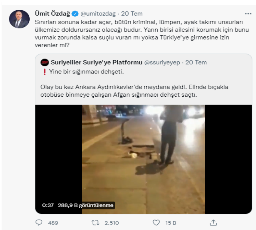
Şekil 4. Ankara’da Afgan saldırgan dehşet saçtı

Paylaşımın sonunda ise birçok paylaşımında sıkça tekrarladığı ve bir slogana dönüştürdüğü “Zafer Partisi gelecek, Suriyeliler gidecek” ifadesine yer vermektedir. Bu ifadeyle hem Türk halkına hem de seçmene Zafer Partisi’nin sığınmacılara yönelik siyasi tutumunu doğrudan aktarmaktadır. Zafer Partisi’nin sığınmacıları istemediğini ve göndereceğini bunun için de iktidara gelmesi gerektiğini söylemeye çalışmaktadır. Bu durum Suriyeli sığınmacıların varlığından rahatsızlık duyan yüksek orandaki seçmenin algısına hitap etme ve yönetme gayretinin bir yansımasıdır. Dolayısıyla bu paylaşımı, algı yönetiminin 11 temel kuralından “düşüncelerden çok duygulara hitap etmek” ilkesiyle de değerlendirmek mümkündür.