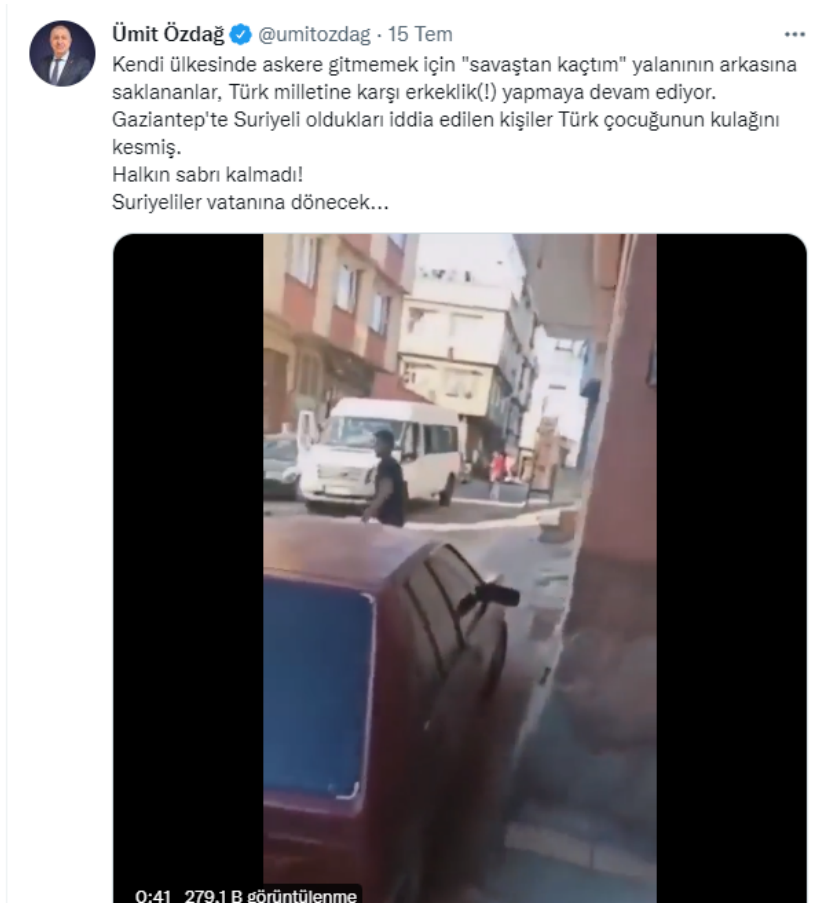
Şekil 5. Gaziantep’te kulağı kesilen çocuk

Zafer Partisi Genel Başkanı, 20 Temmuz 2022’de “Elinde bıçakla otobüse binmeye çalışan Afgan sığınmacı dehşet saçtı” haberini alıntılamaş, bu kez aile kavramına atıf yapmıştır. Özdağ’ın yorumu “Yarın birisi ailesini korumak için bunu vurmak zorunda kalsa vuran mı suçlu, Türkiye’ye girmesine izin verenler mi?” olmuştur. Bu tweette de toplumun kültürel değerleri açısından hassas bir pozisyonda olan aile kavramına atıf yapmaktadır. Aile toplumun en önemli ve mahrem kurumudur. Ona korumak, kollamak, huzur ve güvenliğini sağlamak en başta ebeveynlerin görevidir. Ekmek ve su gibi fizyolojik ihtiyaçlar kadar önemli olan güvenlik ihtiyacı, kişisel güdülenme açısından dikkate alınması gereken bir ihtiyaçtır. Tıpkı sığınmacıların ekonomik sorunlar oluşturduğu vurgusu gibi güvenlik de temel bir ihtiyaca yönelik yapılan bir vurgudur. Özdağ, bu tweetinde hedef kitlenin kültür ve değerleri üzerinden konuyu ele almaktadır.