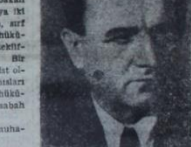
Çekoslovakya'nın Komünistleri tarafından tutulmuş bir gazeteci. Çekoslovakya'nın Komünistleri tarafından tutulmuş bir gazeteci.

Bakanlıklarda hareket komiteleri kurulmuş, komünist olmayan gazetelere el konmuş