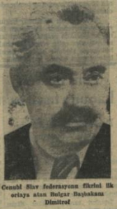
Cenubi Slav Federasyonu Şirketi Başkanı olan Bulgar Başbakan Dimitrov