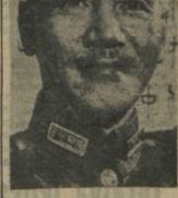
Çang - Kay - Şek

Kadın rekabeti yüzünden birbirini bıçakladılar