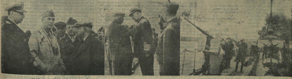
Dünya askeri tatbikatları ve etkinlikleri: İtilaf Amerika yardım heyetli başkanı ve Orantral Meclis Ali Üyesi ile görüşüyor. Yarın hava bataryaları faaliyetleri

Sayı 31 - No. 10773 - Fiyatı her yerde 10 kuruştur. Çarşamba 9 Ekim 1948 Sahibi: Necmeddin Sadak - Yazı İşleri: İtilaf İdare eden: C. Bıldık - Akşam Matbaası