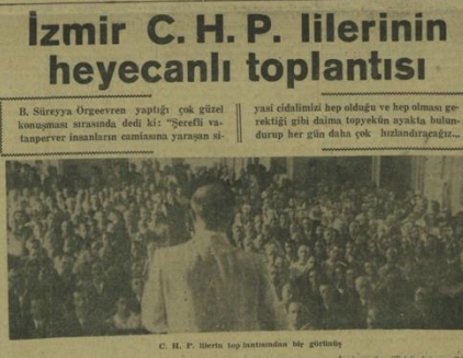
C. H. P. lilerinin toplantısında bir görüntü