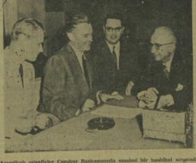
Amerikalı misafirler Cumhuriyetimizin istih...

Eğitim işlerimiz Sadı İRMAK Eğitim ve öğretim işlerinde önemli başarılar sağlandı. Eğitim ve öğretim işlerinde önemli başarılar sağlandı. Eğitim ve öğretim işlerinde önemli başarılar sağlandı.