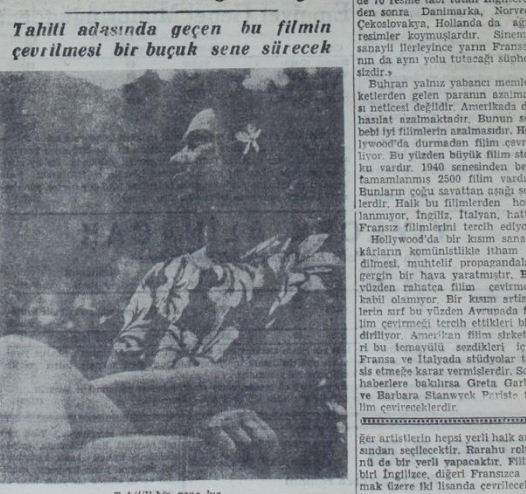
Tahitil'de genç kız

Tahitil adasında geçen bu filmin çevrilmesi bir buçuk sene sürecektir