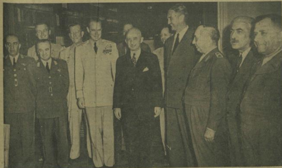
Amerikan Havaçılık Bakanı Mr. Symington ve Amerikan Hava Kurvetleri Genelkurmay Başkanı General Vandenberg Cumhuriyetimizin İstih...

Müjde... Müjde Altın ayın ayın, yeni gümüşün gibi hayran. Kırkhamam kapıları açıldı. Çeşmelerden Çukurluğunda kullandı. Okulu Telefon: 1969, Altın Tel: 1402