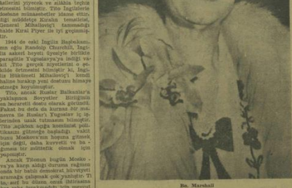
Kocam General G. C. Marshall