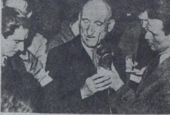
Fransız Başbakanı Schuman gazetecilere beyanatta bulunurken

Fransada altın serbes satılacak, bu tedbirlerle Fransız ihracatı kuvvetlendirilmek isteniyor