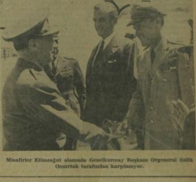
Misafirler Etilimnet alanında Genelkurmay Başkanı Orgeneral İsmet İnönü tarafından karşılanıyor.

Genelkurmay Başkanımız misafirleri ziyaretinde dün gece bir ziyafet verdi