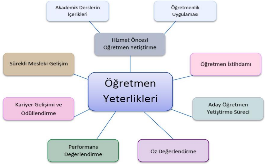
Şekil 1.5: Öğretmen yeterliliklerinin kullanım alanları

Milli Eğitim Bakanlığı tarafından gerçekleştirilen “Ulusal Öğretmen Stratejisi Çalıştayı”nda belirlenen görüşler sonucunda, MEB yetkililerinin yapmış olduğu toplantılar neticesinde “Öğretmen Yeterlilikleri Açısından Öğretmen Strateji Belgesi (2017-2023)” hazırlanmıştır (MEB, 2017). Belge içeriğine bakıldığında hizmet öncesi eğitimler, öğretmen aday seçim kriterleri ve bu adayların çalıştırılması, adaylıklarının eğitimi ile oryantasyon eğitimi, kariyeri belirleme ve ödül verme, öğretmenlik meslek statüsü ve devamlı mesleki gelişim olarak altı bileşen hedeflenmiş ve bunlarla alakalı amaca yönelik hedefler tespit edilmiştir (MEB, 2017). Belirlenen amaç ve hedefler şu şekildedir: