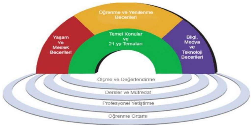
Şekil 1.1: 21. yy. becerileri öğrenme çerçevesi 1. sürümü şeması

21. yy. Becerileri için Ortaklık (P21), 21. yy. becerilerini ifade eden bir öğrenme çerçevesi sunmuş, bunları yaşam ve meslek becerileri, öğrenme ve yenilenme becerileri, bilgi, medya ve teknoloji becerileri şeklinde gruplandırmıştır. Öğrenme çerçevesi şemasının 1. sürümü Şekil 1.1.'deki görselde sunulmuştur (P21, 2008).