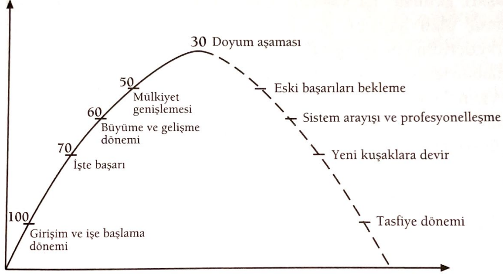
Şekil 1.1. Aile Şirketlerinin Kuruluşu ve Gelişimi (Aile Şirketleri, Fındıkcı 2005, s.41)

evresi, gelecek kuşaklara devir evresi ve tasfiye evresi. Gelişim evreleri verilen tablo eşliğinde şu şekildedir;