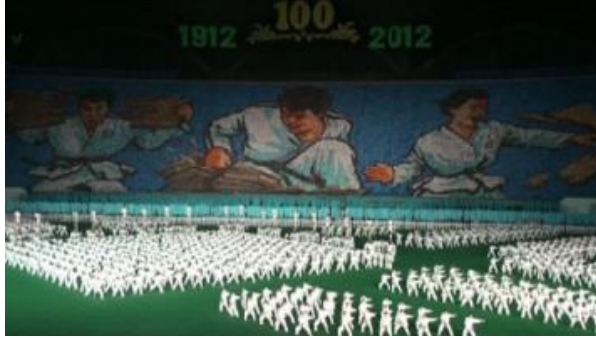
Taekwondo figürleri ve gösterisi ile hem spor dalı ön plana çıkarılmakta, hem de görselde yer alan kadın ve erkek figür ile cinsiyet eşitliği vurgulanmaktadır.