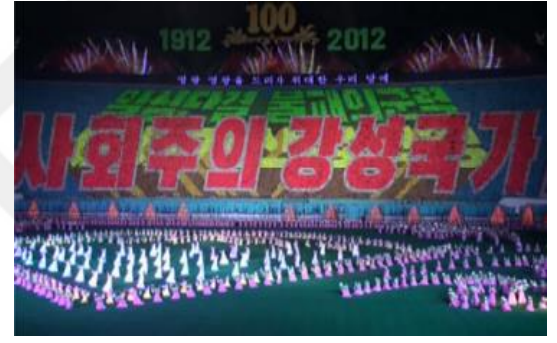
“Güçlü ve müreffeh sosyalist devlet.”