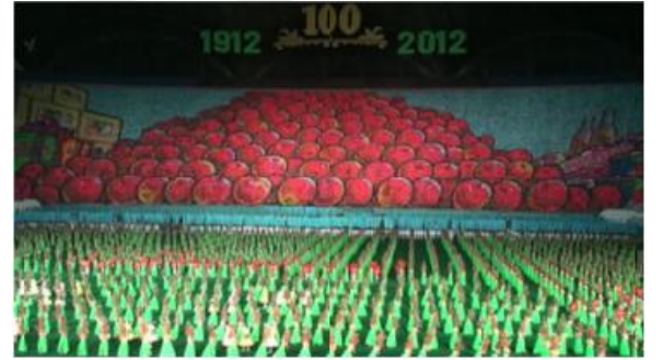
Ülkedeki elma ve elma ürünlerinin üretimi vurgulanmaktadır. Ülkedeki gıda eksikliği göz önüne alındığında, mahsul üretimi vurgulanmaya değer görülmektedir.