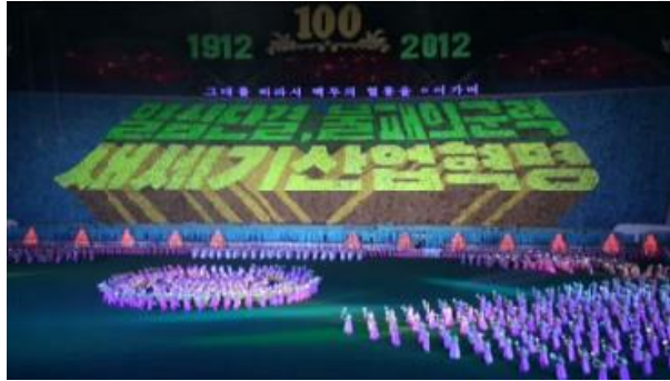
“Tek fikir birliği, yenilmez askeri güç, yeni yüzyılda endüstriyel devrim.”