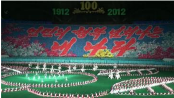
“İnsanların mutluluğuyla dolup taşan ülkem.”