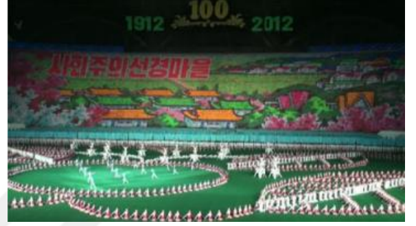
“Sosyalist peri köyü”