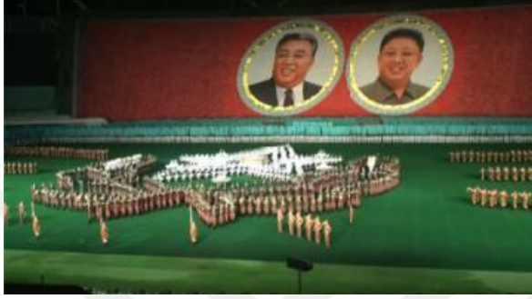
Solda Kim Il Sung, sağda Kim Jong Il.