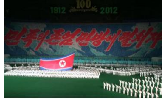
“Milletimizin asaletini tüm dünyaya duyuralım.”