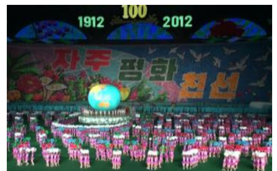
“Bağımsızlık, Barış, Dostluk”