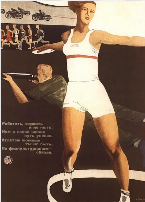
Alexander Daineka, 1930

“Belki şampiyon olamazsın, ama güzel bir beden formunda olmalısın.”