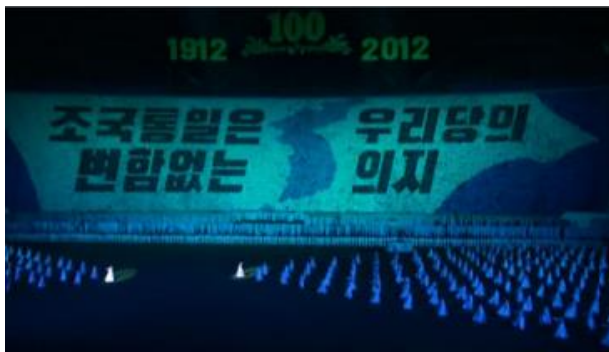
“Ulusal birleşme, partimizin asla değişmeyen arzudur.”