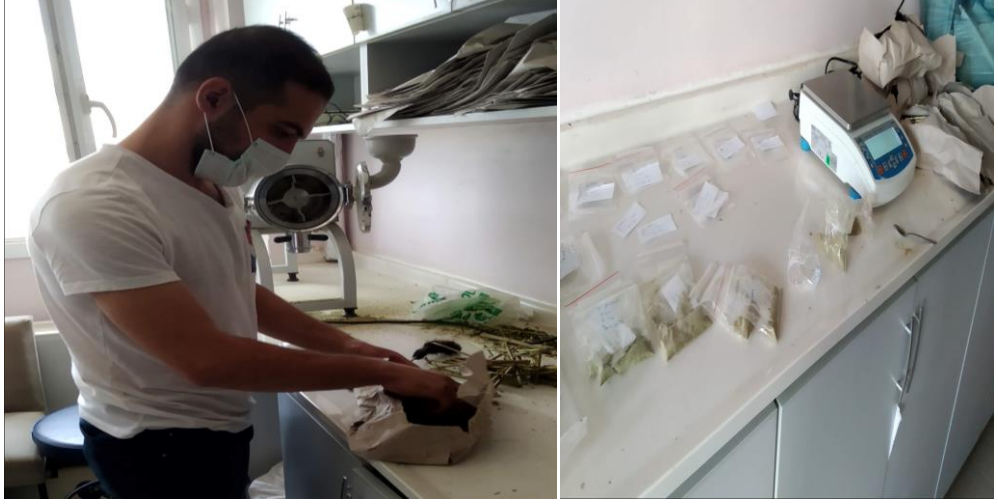
Şekil 11. Laboratuvardan görüntüler