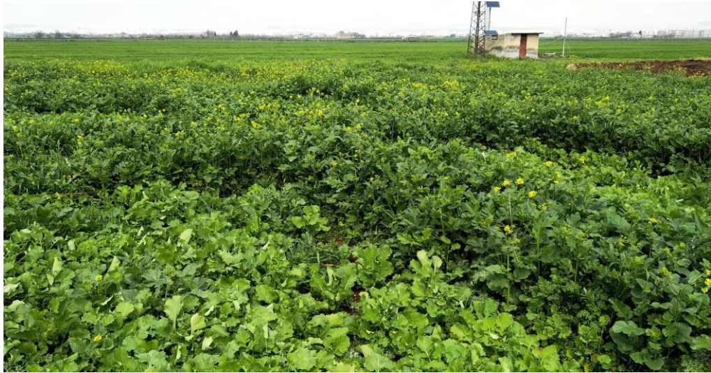
Şekil 3. Deneme alanından bir görünüm

Çizelge 2’de görüldüğü gibi denemenin yürütüldüğü dönemde, en düşük ortalama sıcaklık 6.1 °C ile Ocak ayında; en yüksek ortalama sıcaklık 25.2 °C ile Mayıs ayında görülmüştür. Yağış miktarlarına bakıldığında; bitkilerin çiçek ve bakla dönemleri olan Mart ve Nisan aylarında sırasıyla 156.7-97.4 mm yağış düşmesi sonucu bahar mevsimi az yağışlı olarak geçmiş, neticede bitkiler yeterli yağışı alamamışlardır.