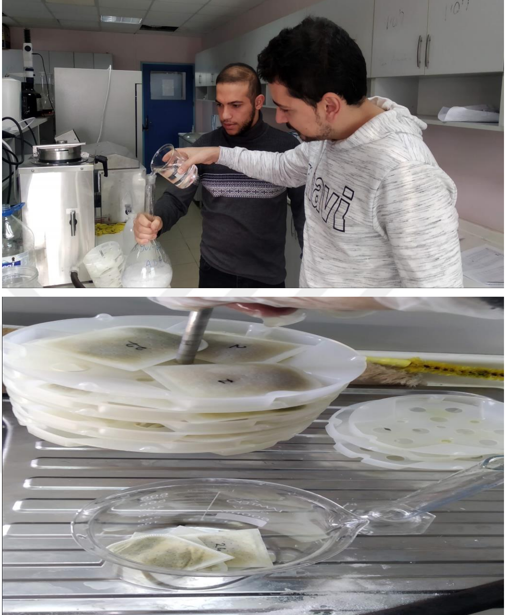
Şekil 13. Labaratuvarıda adf ve ndf analizleri