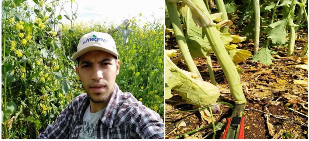
Şekil 8. Çalışma alanında hasat işlemleri