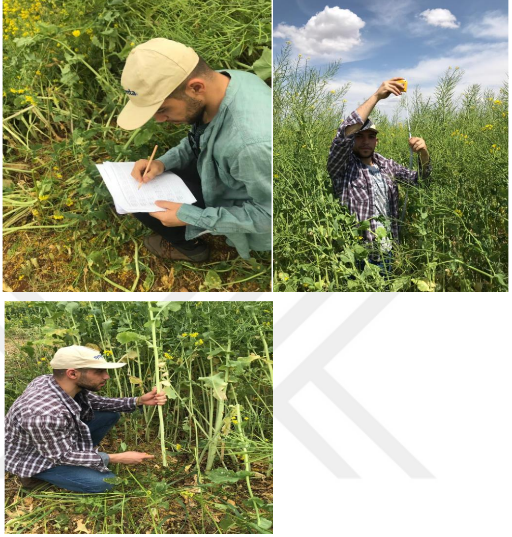
Şekil 10.Bitki boyu ölçüm işlemleri