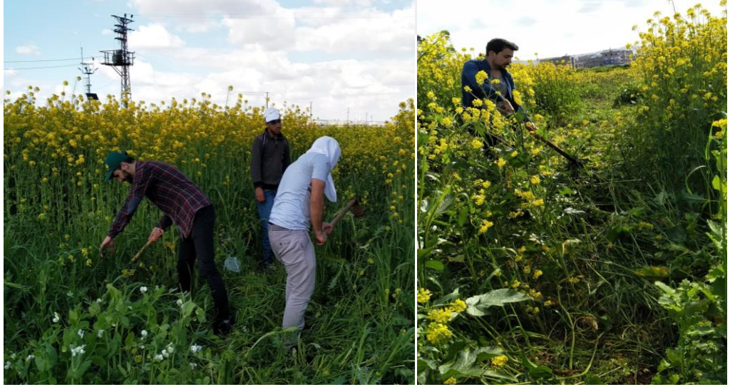
Şekil 7. Çalışma alanından görüntüler (yabancı ot temizliği)