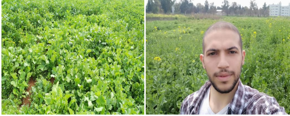
Şekil 4. Deneme alanından bir görünüm