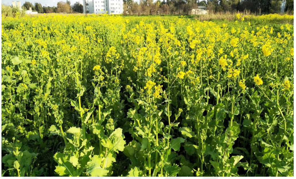
Şekil 6. Çalışma alanından görüntüler