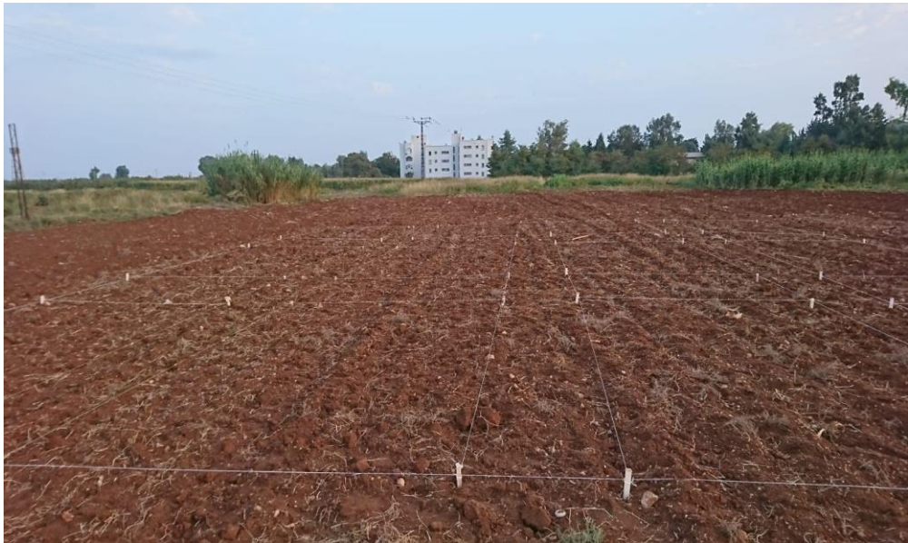
Şekil 2. Deneme alanından bir görünüm (parselizasyon)