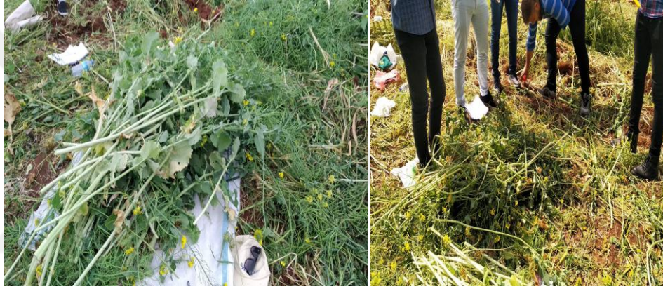
Şekil 9. Hasat sonrası tartım işlemleri