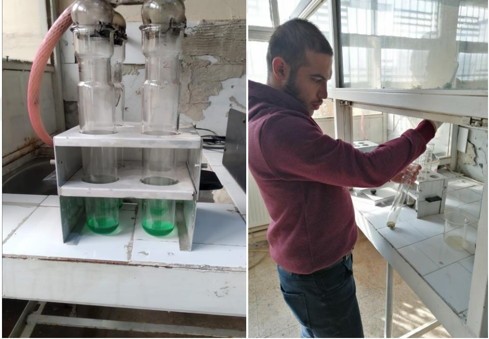
Şekil 12. Labaratuvarında protein analizi