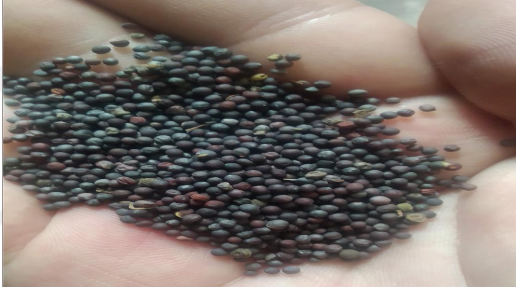
Şekil 1. Denememde kullandığım yem şalgamı tohumları

Araştırmada bitki materyali olarak Ekodoğa Toh. Zirai ve Tarımsal Ür. İmalat Ltd. Şti.'den temin edilen Hollanda orjinli Polybra tetraploid(cgn07172) çeşidi yem şalgamı kullanılmıştır.