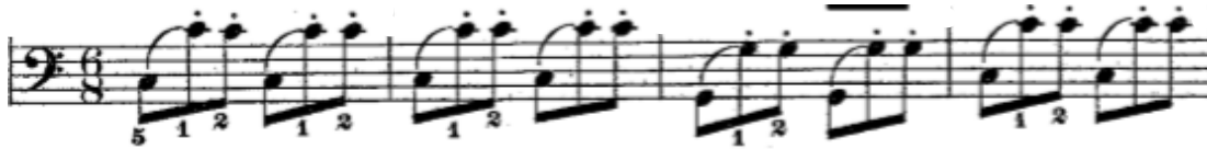
Şekil 25. 37. Etütte yer alan eşlik figürü sekizlik oktav seslerinin ölçü sayısı ile uyumlu olarak üçerli gruplar halinde yazılmasıyla oluşturulmuştur.