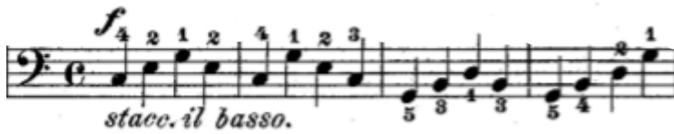
Şekil 20. 32. Etütte yer alan eşlik figürü ezginin armonik yapısına uyumlu akor seslerinin yatay şekilde yazılmasıyla oluşturulmuştur.