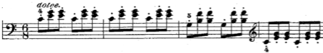
Şekil 26. 38. Etütte yer alan eşlik figürü 21. Etütte yer alan eşlik figürü ile benzerlik göstermektedir iki figür de bir tek ses ve iki çift sesin arka arkaya aşağıdaki gibi yazılmasıyla oluşturulmuştur. Fakat iki etüdün ölçü sayıları birbirinden farklıdır. Bu da benzer eşlik figürlerinin farklı ölçü sayılarına sahip ezgiler için uyarlanabileceğini göstermektedir.