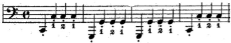
Şekil 21. 35. Etütte yer alan eşlik figürü ezginin armonik yapısına uyumlu oktav seslerin yukarıdaki gibi yazılmasıyla oluşturulmuştur.