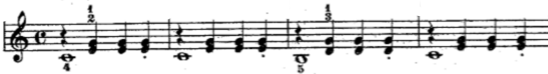
Şekil 15. 13. Etütte yer alan eşlik figürü basta birlik bir tek sesin tutması, üzerine dörtlük tek seslerin yukarıdaki gibi yerleştirilmesi ile oluşturulmuştur.