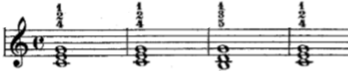
Şekil 13. 9. Etütte yer alan eşlik figürü ezginin armonik yapısına uygun birlik akorlar kullanılarak oluşturulmuştur.