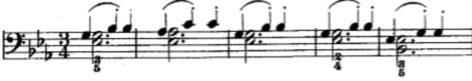
Şekil 11. 75. Etütte yer alan eşlik figürü basta noktalı ikilik bir çift sesin tutması, üzerine tek seslerin yukarıdaki gibi yerleştirilmesi ile oluşturulmuştur.

Czerny opus 599 etüt kitabında yer alan 4/4'lük eşlik figürleri