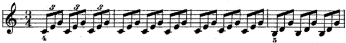
Şekil 10. 31. Etütte yer alan eşlik figürü ilgili dizinin akor seslerinin sekizlik üçlemeler şeklinde gruplanmasıyla oluşturulmuştur.