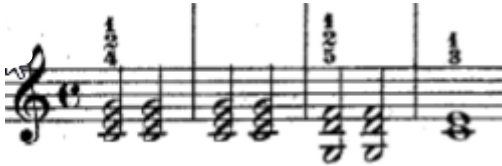
Şekil 14. 10. Etütte yer alan eşlik figürü ezginin armonik yapısına uygun ikilik ve birlik akorlar kullanılarak oluşturulmuştur.