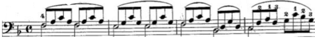
Şekil 23. 71. Etütte yer alan eşlik figürü basta akorun seslerinden birinin ikilik süre değeri tutulması üzerine akor seslerinin sekizlik olarak yerleştirilmeleriyle oluşturulmuştur.

Czerny opus 599 etüt kitabında yer alan 6/8'lik eşlik figürleri: