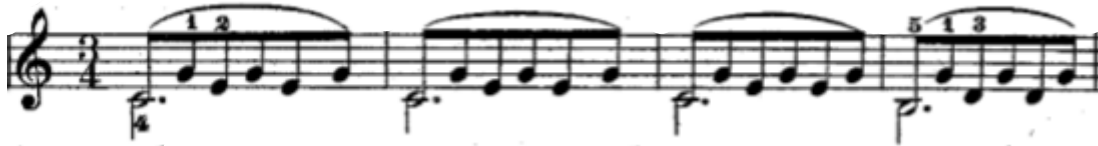
Şekil 9. 30. Etütte yer alan eşlik figürü basta bir tek sesin tutması, üzerine ilgili dizinin akor seslerinin yukarıdaki sıra ile yerleştirilmesi şeklinde oluşturulmuştur.