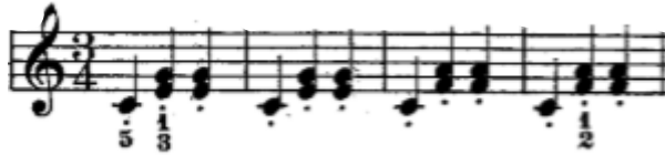
Şekil 8. 21. Etütte yer alan eşlik figürü bir tek ses ve iki çift sesin arka arkaya yukarıdaki gibi yazılmasıyla oluşturulmuştur.

Czerny opus 599 etüt kitabında yer alan 3/4'lük eşlik figürleri: