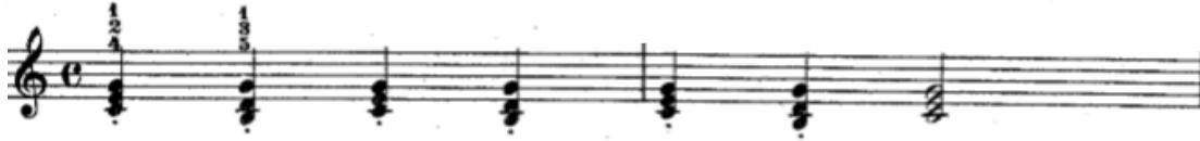
Şekil 17. 18. Etütte yer alan eşlik figürü dörtlük akorların ve ikilik bir akorun yukarıdaki gibi sıralanmasıyla oluşturulmuştur.