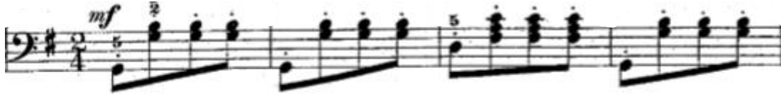
Şekil 6. 89. Etütte yer alan eşlik figürü bir bas ses ve bir oktav üzerinde yer alan üç çift sesin yan yana gelmesiyle oluşturulmuştur.