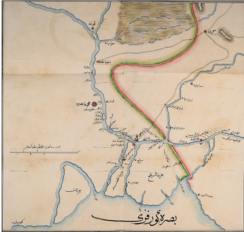
Harita-4 Basra Körfezi (BOA, HR.SYS, 96/19, Lef 2)