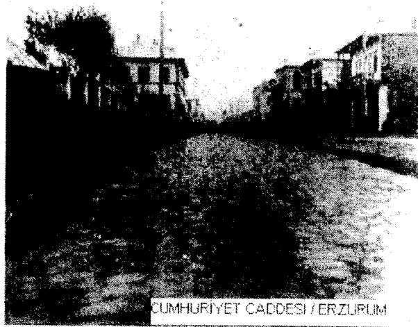
CUMHURİYET CADDESİ / ERZURUM