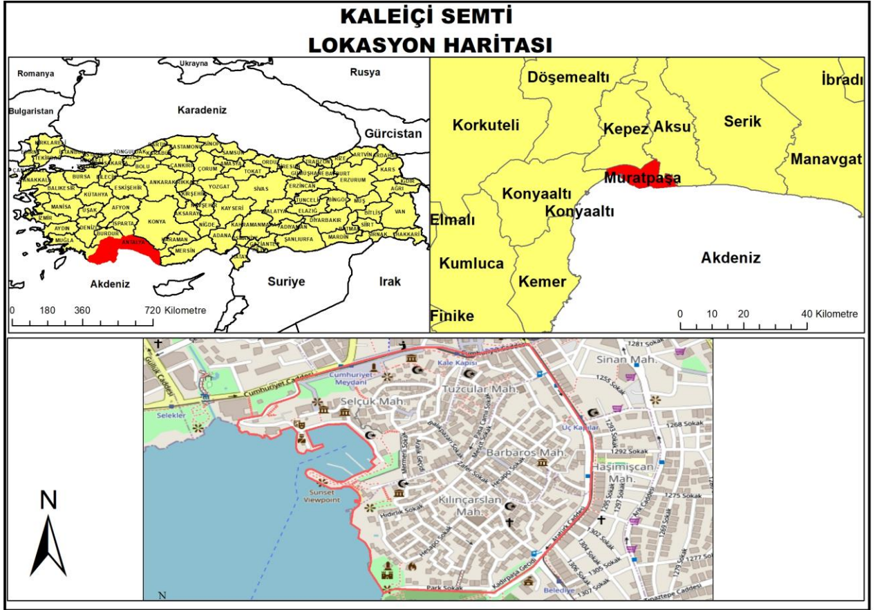
Harita 2.1. Kaleiçi Semtinin konum haritası

Araştırma alanımız olarak belirlediğimiz Kaleiçi Semtini Türkiye de Antalya İli Muratpaşa İlçesi sınırları içerisinde bulunmaktadır. Çalışma alanının özelliklerinden önce bulunduğu kentin doğal, tarihi ve beşerî özelliklerinden kısaca bahsetmek gerekmektedir.