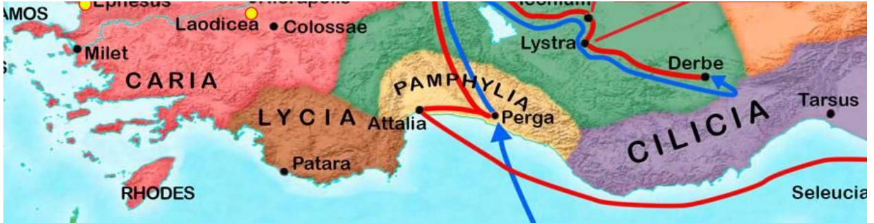
Harita 2.2. Attalia ve Perga Antik Kentlerini Gösteren Harita

“İbn Hakval'a göre, Antalya Kibyraioton Theması'nın komutanı olan ve Müslümanlara karşı operasyonlara çıkan donanma kumandanının sorumluluğundadır ve dini yönden aşırı holigan olan Antalya halkı Araplara karşı şiddetle savaşmaktadır. Ayrıca Antalya tüccarları Araplara karşı casusluk yaparak başkente bilgi aktarma merkezi konumundadır (Kurt, 2010:24).”