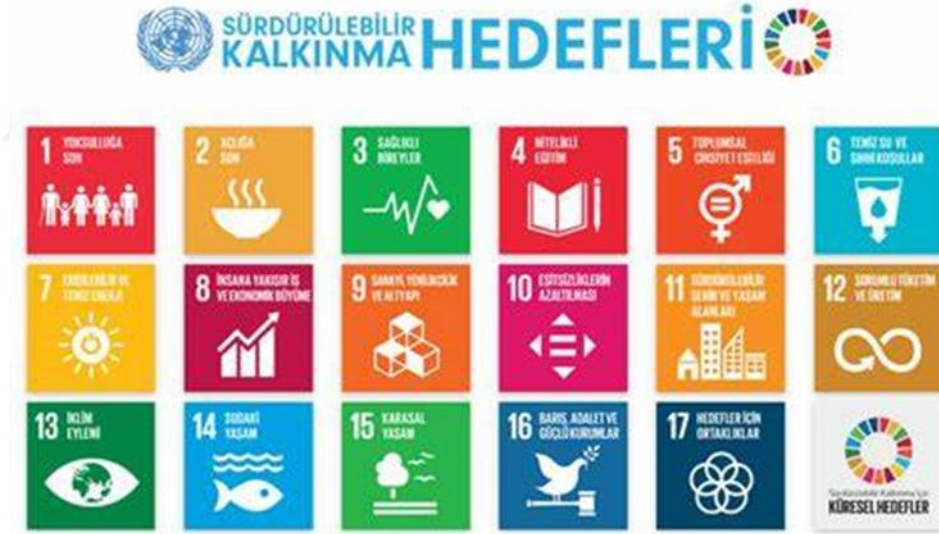
Şekil 2: Sürdürülebilir Kalkınma Amaçları" Sürdürülebilir Kalkınma Amaçları | Kampüste Ne Var." 23 May. 2022, https://www.kampustenevar.com/kategori-yasam-tarzi/surdurulebilir-kalkinma-amaclari

Ülkelerin çevre ile ilgili performanslarının yaşanan çevre sorunlarına çözüm üretmediği gerekçesi ile daha kapsayıcı çözüm önerileri ve önlemler alınması gerekçesi ile Türkiye'nin de olduğu 193 ülkenin imzası ile “2030 Sürdürülebilir Binyıl Kalkınma Hedefleri” olarak kabul edilen eylem çağrısı 17 ana başlıktan oluşmaktadır.