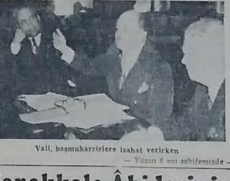
Vali, basınhabirlerine inşaat verirken

Gökay söze başlar: «Bu toplantıyı müdafaa için yapıyorum» dedi