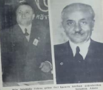
Adanadafecî bir uçak kazası...

Kazamın nedeni ileri geldiği henüz müddet değil. Devlet Hava Yolları Umum Müdürü ve bir tahlik heyeti kazaya mahalline hareket ettiler