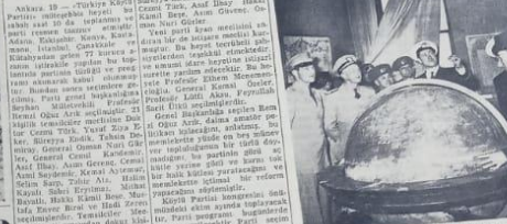
Amiral Carney din ayarları için birleşmiş devletler, Amerika temsilcisi olarak Ankara'ya geldi.