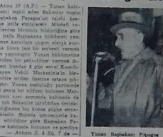
Yunan Başbakanı Papagos

Papagos kabineyi yeniden kurdu, bu değişikliğin Başbakanın prestijini daha ziyade yükselteceği ileri sürülüyor