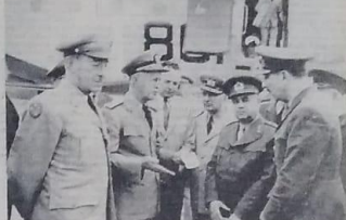
Amiral Carney ile Başbakan, Karayolları

Türkiye'ye yapılan yardımda hiç bir değişiklik mevzuubahs değil