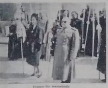
General Franco konuşuyor.

"Kızıl diktatoryaya zemin hazırlamamak için en muvafık yol, halka azami hürriyeti vermektir"