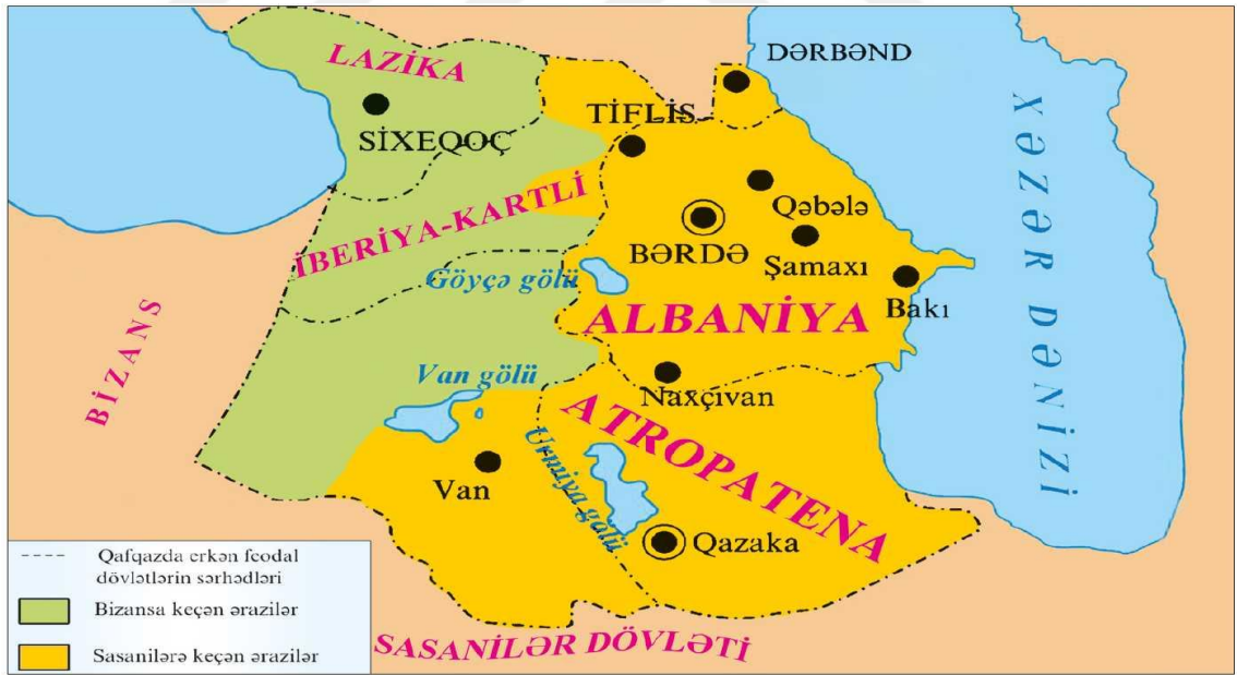
Qafqaz (IV–VII əsrlər)