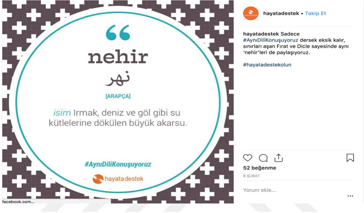
Şekil 5. Hayata Destek Derneği Savunuculuk Çalışmaları Yapmakta ve Bunu Web Sitelerinde Paylaşmaktadır.