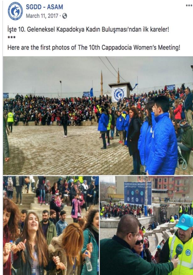
Şekil 1. ASAM Kapadokya Kadın Buluşmasının Facebook Sayfalarındaki Paylaşımı

gerektiğini ve bu sürecin nasıl işletileceği konusunda sosyal medyayı kullandıklarını söylemişlerdir. En çok takipçileri olan sosyal medya sitesi Facebook iken, bunu Instagram, Twitter ve LinkedIn izlemektedir. Ayrıca video paylaşımı yaptıkları Youtube kanalları ve web siteleri mevcuttur. Sosyal medya kullanarak yardım kampanyası da yapmışlardır. Küçük kitap ve görseller hazırlayarak sosyal medya hesaplarından paylaşımlarda bulunmuşlar, oyuncak ve kitap bağışı kampanyası yapmışlardır. Bu kampanyalarda özellikle konu çocuklar olduğunda büyük destek almışlardır. Buna ek olarak kışlık kıyafet yardımı da yapmışlar ve olumlu tepkiler almışlardır. Kuruluş diğer ülkelerdeki sivil toplum kuruluşlarını takip etmediğini, daha çok Türkiye'deki derneklere ve vakıflara baktıklarını belirtmiştir.