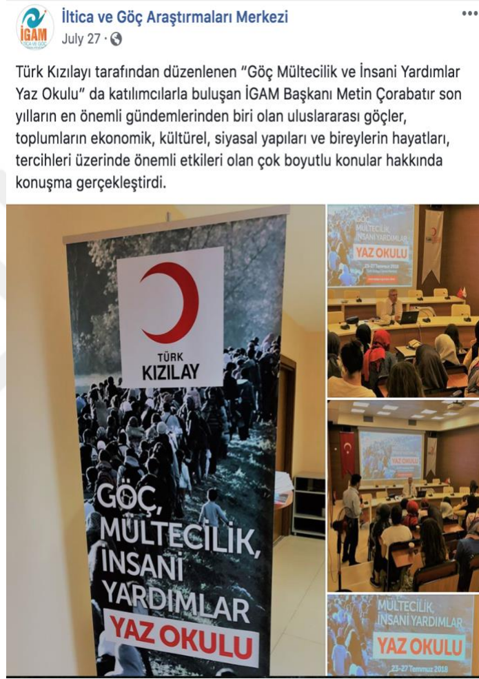
Şekil 2. İGAM'ın Katıldığı Etkinlikler Facebook Sayfalarından Duyurulmaktadır.

Hayata Destek Derneği sosyal medya hesaplarının aktif olduğunu belirtmiştir. Facebook, Instagram en çok kullanılan sosyal medya hesaplarıdır. Bunun yanında Twitter ve LinkedIn de kullanılmaktadır. Günde en az 2-3 paylaşım yapılmaktadır. Hem sahada neler yaptıklarını, nasıl bir dernek olduklarını anlatan paylaşımlar, hem de kaynak geliştirmek açısından yardımcı olabilecek, toplumun mentalitesine dokunabilecek savunuculuk çalışmaları yapmaktadırlar. Bunun yanında çeşitli uygulamalar yoluyla