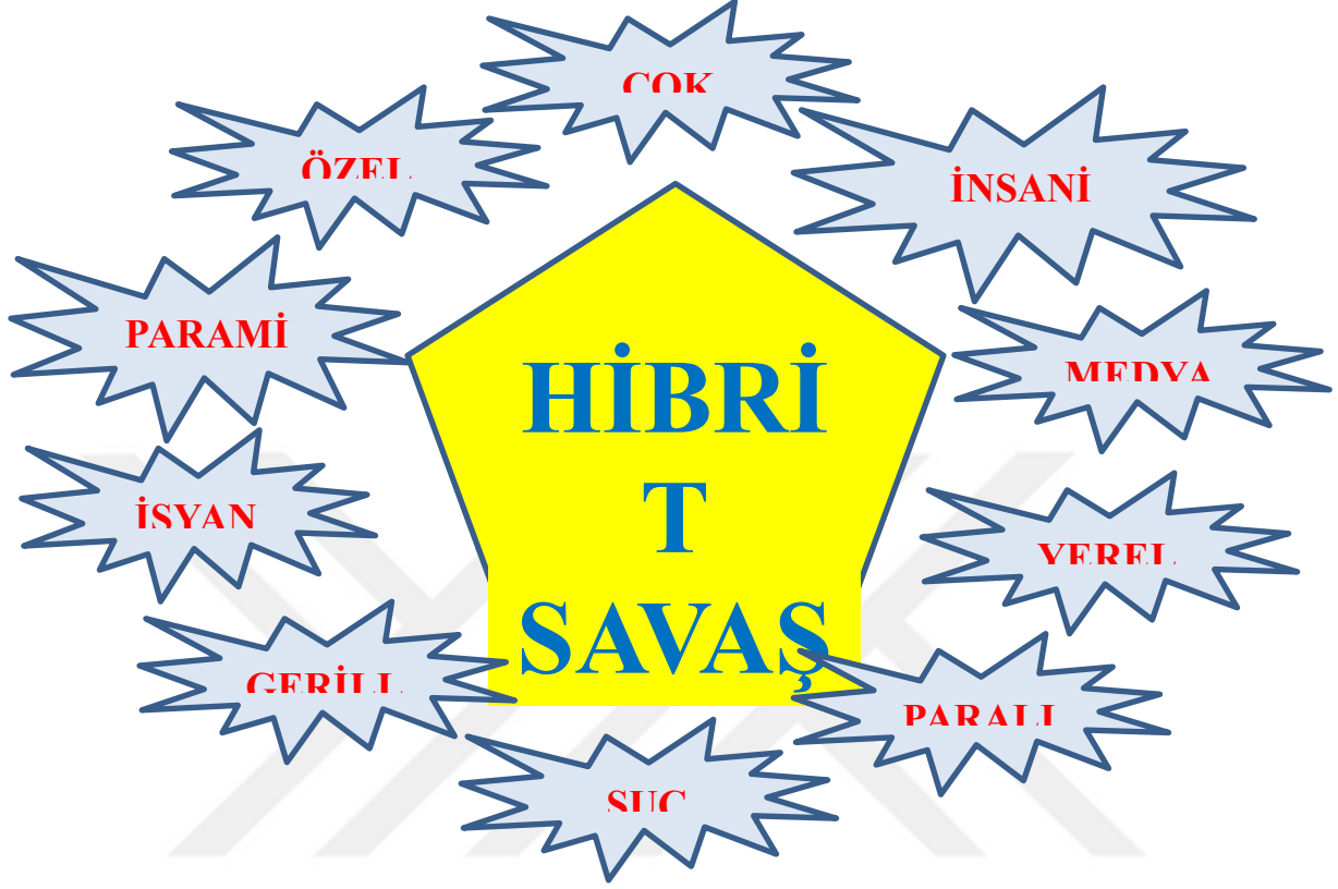
Şekil 2.1. Hibrit Tehditler ve Diğer Aktörler

paralı askerler gibi yapılanmalar, harekât ortamında askeri bir unsurun emir komutası altına girebilirler.