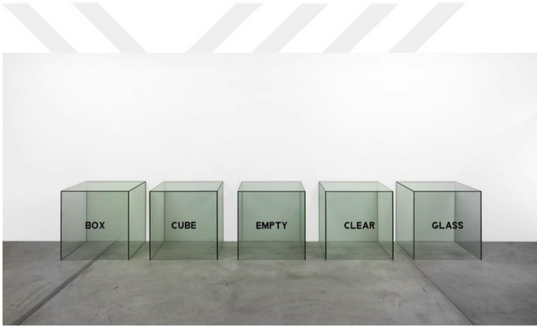
Grsel 3. Joseph Kosuth, Box, Cube, Empty, Clear, Glass, 1965

Bir nesne, kendi baŐına anlama sahip olamaz nk kendilik bilincine sahip deđildir. Sartre’ın da dediđi gibi nesne, bilince kendisini sunar ve izleyici (alımlayıcı, sanatı vb.) onunla etkileŐime girip iliŐki iinde olduđunda anlam ortaya ıkar. Bu anlamı sađlayan Őey, bakıŐın konumunun yer deđiŐtirmesiyle gelen nesnenin konumunun da yer deđiŐtirmesidir. Nesne var olan dzlemde, var olduđu haliyle kalmaya devam etmez gzn konumu dođrultusunda yer deđiŐtirir, Őekil alır, farklı bir boyut kazanır. Gz ile etkileŐime giren nesne kendi imgesini yaratır, bu anlamın kendi dođasında bulunan bir edimdir.