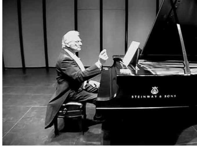
Görsel 6. John Cage's, 4'33, 1952

İmgenin görülen/görülme, varlık/yokluk diyalektiğini işaret etmesine John Cage'in 4'33 adlı performansı yine bir diğer örnek olarak da gösterilebilir. (Görsel 6) Bir piyano eseri olarak kurgulanan eser üç bölümden oluşur ve toplamda 4 dakika 33 saniye sürer. Ancak eser geleneksel besteleme yaklaşımının ötesinde dinleyicilerine farklı bir deneyim yaşatır. Notaların ve melodilerin yerine, sessizliği ve seyircinin seslerini bir enstrüman olarak kullanır. Ortam seslerini performansın parçası haline getirerek deneysel bir kompozisyon sunan Cage, sessizlik imgesini yani yokluk içinde olanı bir sanat formuna dönüştürür.