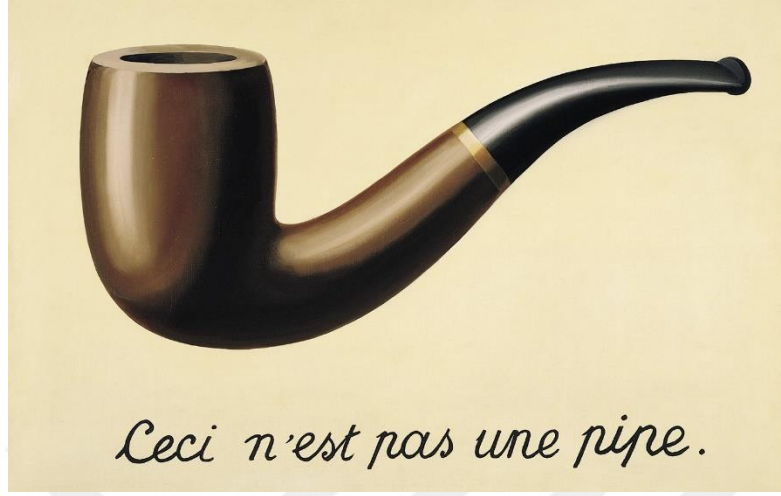
Görsel 5. Rene Magritte, Bu Bir Pipo Değildir, 1929

ve kopyadan fazlası olduğunu ve bu durumun sözel gösterge için geçerli olmadığını belirtir (Minor, 2020: 239). (Yurttaş, Karaca, 2022, s. 33).