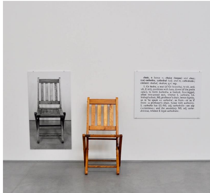
Görsel 7. Joseph Kosuth, Bir ve Üç Sandalye, 1965

İmgenin görülen/görülme, varlık/yokluk diyalektiğini işaret etmesine John Cage'in 4'33 adlı performansı yine bir diğer örnek olarak da gösterilebilir. (Görsel 6) Bir piyano eseri olarak kurgulanan eser üç bölümden oluşur ve toplamda 4 dakika 33 saniye sürer. Ancak eser geleneksel besteleme yaklaşımının ötesinde dinleyicilerine farklı bir deneyim yaşatır. Notaların ve melodilerin yerine, sessizliği ve seyircinin seslerini bir enstrüman olarak kullanır. Ortam seslerini performansın parçası haline getirerek deneysel bir kompozisyon sunan Cage, sessizlik imgesini yani yokluk içinde olanı bir sanat formuna dönüştürür.