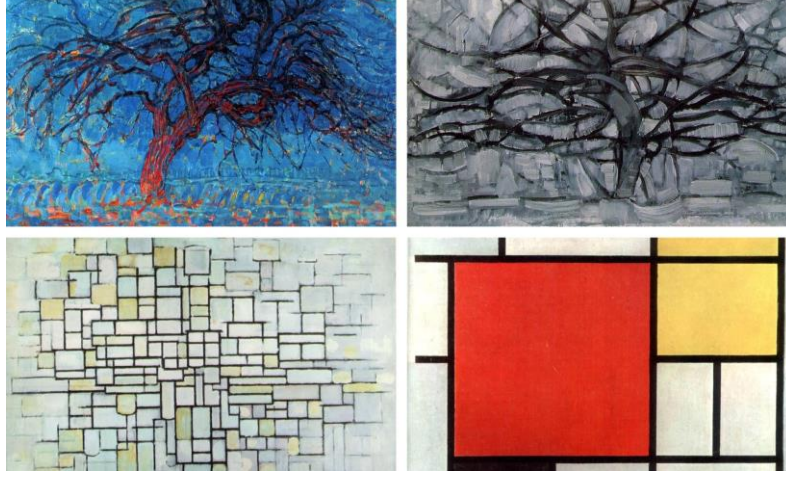
Görsel 1. Piet Mondrian, 1872-1944