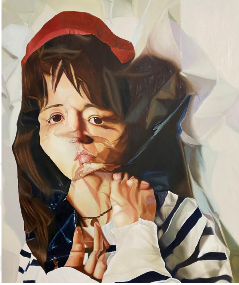
Görsel 10. Mizgin Müjde Görücü, İsimsiz, Tuval Üzerine Yağlı Boya, 150x120 cm, 2018

Benzer bir okumayı kırıştırılmış kağıt resmi üzerinden de yapmak mümkündür. Kesilen ağaç gibi kırıştırılan kağıt resmi de yıkım imgesi üzerinden kurgulanarak atıl nesne olma imajı çizer. Bu yıkım, ağaç için kağıt olma özelliği barındırırken, kırıştırılmış kağıt için ise sanat malzemesine dönüştürülmesi demektir. Bu çelişkinin yarattığı devinim ve dönüşüm her alanda kendini tekrar eden ve çağrıştırdığı şeyin zıttını da içinde barındıran ve yeniden yaratılan bir diyalektik imgeye dönüşür. (Görsel 9-10)