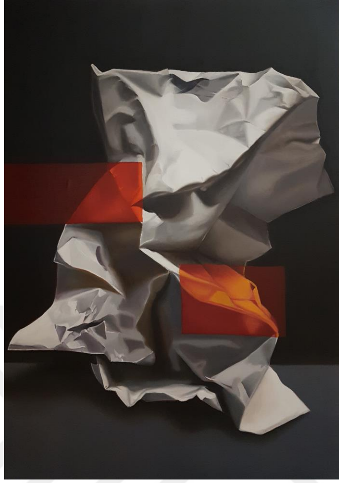
Görsel 4. Mizgin Müjde Görücü, İsimsiz, Tuval Üzerine Yağlı Boya, 100x70 cm, 2017

Bu ilişki, Görsel 4 de bulunan resim üzerinden, ağaç nesnesinin soyutlanarak kağıt imgesini yaratması üzerinden örneklendirilebilir. Birinci bölümde bahsedildiği üzere kağıt, gerek maddenin dönüşümü sonucu gerekse algılanma biçimi olarak nesnesi ile ilişki içerisinde kurgulanan bir imgeye işaret eder. Algılayan göz ve algılanan nesne arasında kurulan bağ sonucu oluşan imge, aynı zamanda nesnesine de göndermede bulunur. Pierce ise bunu gösterge sistemi olarak; soyutlamalar, nesnelere ve algılayan zihin şeklinde üçlü yapıları ayırır.