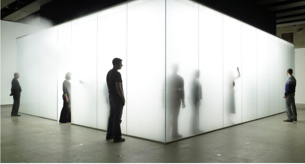
Görsel 13. Anthony Gormley, Blind Light, 2007

Gormley 2007 tarihli 'Blind Light' eserinde "Var oluşu belirleyen "gerçek" ile "hayal" ikilemini bir arada barındıracak unsurları da heykellerinde neredeyse eşit ağırlıklı kullanmıştır. Sanatçının izleyiciye mekansal bir deneyim sunduğu "Blind Light" isimli yapıtında ele aldığı duygu bir başka deyişle izleyicinin eserin bir parçası olma anında hissettirmeyi amaçladığı baskın duygu yalnızlıktır. Fakat salt yalnızlık duygusundan ziyade kalabalık içinde bireyin yalnız kalma halini yapıtın büyüklüğü ve kullandığı malzeme ile bir gerilim yaratarak izleyicilerin birbirinden haberdar olduğu fakat birbirini görmediği dolayısıyla bir farkında olma haline rağmen bedeni saran yalnızlık duygusundan bahsettiğini söyleyebiliriz. Sanatçının yapıtta kullandığı yoğun sis, yapıtın içinde izleyiciyi görme duygusundan kısmen mahrum bırakıyor. Bu mahrumiyet izleyicinin yön duygusunu kaybetmesiyle birlikte mekanı algılama biçiminde bir kırılma anı yaşanmasına neden oluyor.