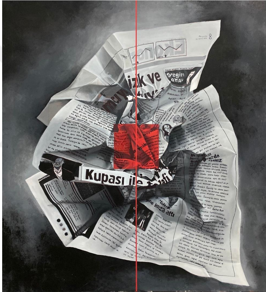
Görsel 2. Mizgin Müjde Görücü, İsimsiz, Tuval Üzerine Akrilik, 130x120 cm, 2017

Doğada var olan ağacın yine doğanın bir parçası olan insanın etkileşimi sonucu kesilip kağıda dönüşmesi, beraberinde ikili bir durum doğurur. Bu ikililik, ağaç nesnesinin yıkıma uğratılması ve kağıt formunun yaratılması ile başlar. Yaratılan yeni form, ağaçtan gelse de artık onun özelliklerini barındırmaz (meyve vermez, fotosentez yapmaz) ve başka bir kullanım alanı yaratır. Böylece madde, uygulanan kuvvet sonucu bir önceki formunu aşarak yeni bir işleyiş mekanizması geliştirir. Bu karşıt ikilik, insan doğa ilişkisinde olduğu kadar ağacın kesilme eylemi ile modern dünyanın matbaası arasında da bulunmaktadır (Görsel 2).