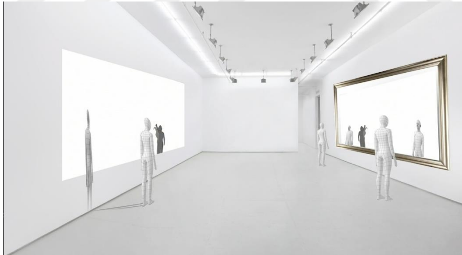
Görsel 15. Gölge, Video Eserin Sergilenme Biçimi