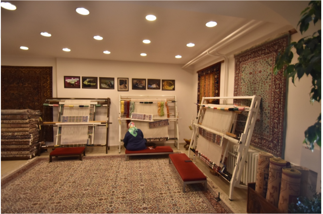
Fotoğraf 13. Bir halı mağazasında bulunan tezgah ve dokumacı

Halıların satıldığı dükkanlar çömlek atölyelerinde olduğu gibi sadece turistik ürünlerin pazarlandığı, turistin farklı birçok ürünü gördüğü, beğendiği ve aldığı yerler değildir. Bu mağazalar aynı zamanda ürünlerin malzeme, yapılış ve kültürel örneklerinin de tanıtıldığı dikkat çekici ürünlerin sergilendiği ve bir kısmında da dokumacıların el işlerinin yani “halının dokunmasını sahnelendiği” mekanlardır.