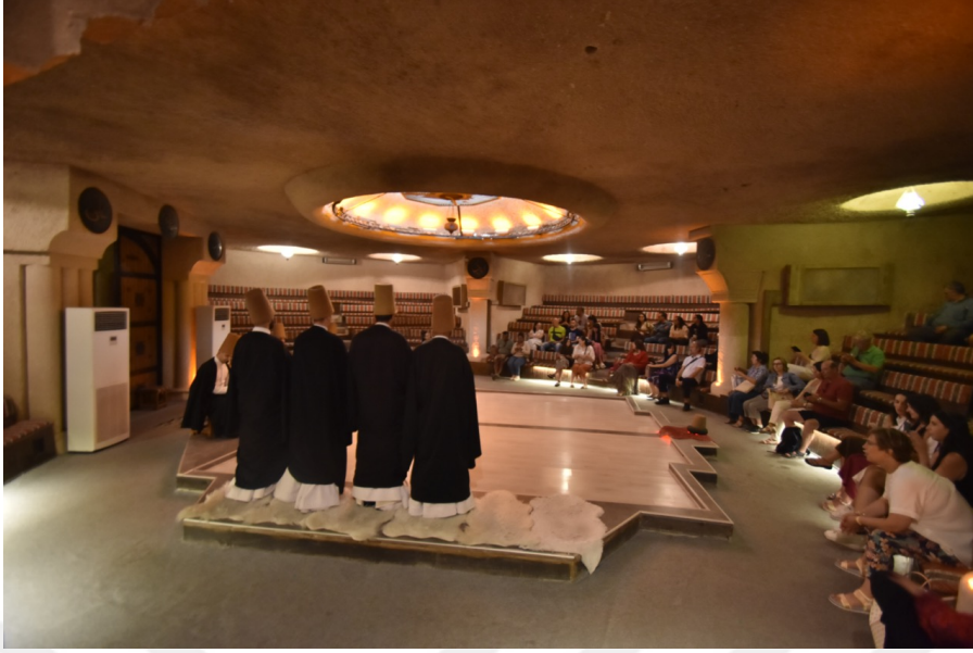
Fotoğraf 23. Sema töreni sonrasında turistlerin fotoğraf çekimi için müsaade edilme anı.

Alan çalışması ziyaret edilen ve kendilerinin ifadesiyle “Mevlevi Sema Seromonisi”ne katılım sağlanan Motif Kültür Merkezi’nin internet sayfasından Sema’nın uygulanışı hakkında aşağıdaki uzun alıntıyı yapmak yararlı olacaktır: