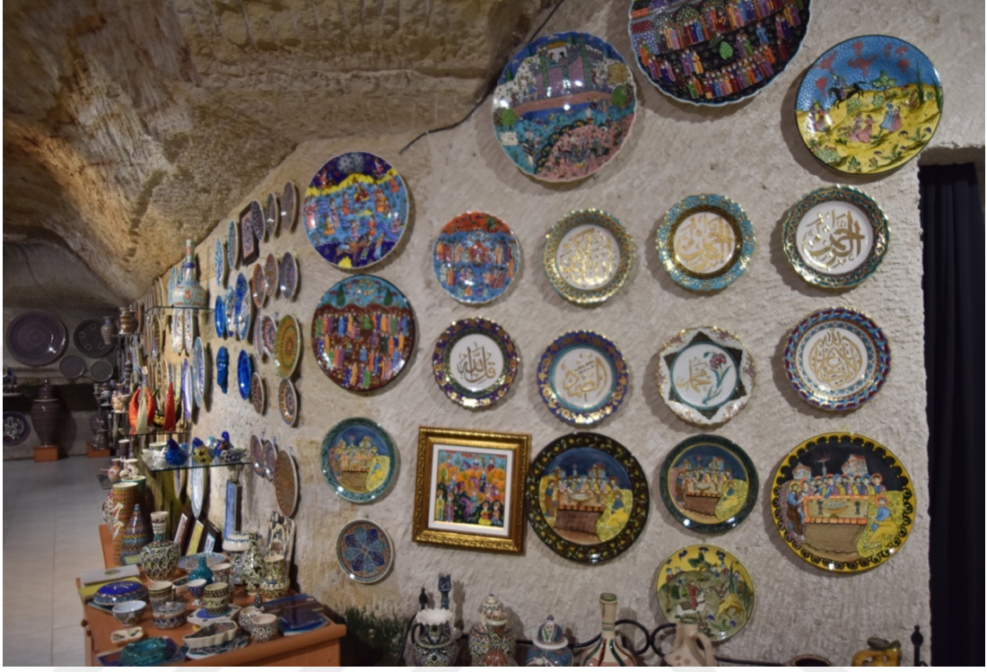
Fotoğraf 10. Geleneksel motifli ürünler

Satışta olan ürünlerin geleneksel, dinsel ve modern tasarımlar içermesi hitap edilen kitleyi çeşitlendirme ektedir ayrıca bu haliyle farklı gelir gruplarından bireylerin ulaşabileceği bir skala sunmaktadırlar.