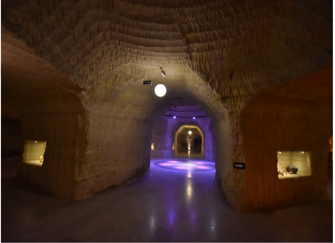
Fotoğraf 6. Güray Müze’de farklı etkinlikler için kullanılan orta alan.

kullanımını örnekleme ektedir ortamın mistik dokusu bu etkinliklere farklı bir doku vermektedir ki bu da müzenin resmi sitesinde altı çizilen bir unsurdur.