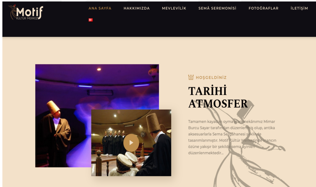
Fotoğraf 24. Motif Kültür Merkezi Sema Seramonisi Tanıtımı ( https://kapadokya-motif.com/tr/ana-sayfa/ )

Motif Kültür Merkezi’nde bu sıralamayla tören gerçekleşmekte ve turistlerin beğenisinin kazanılması ve akabinde çeşitli hediyelik eşyaların satılması beklenmektedir. Kapadokya Motif Kültür Merkezi internet sayfasında “inancın özüne yakışır bir şekilde sema ayinleri düzenlenmektedir...” şeklinde bir tanıtım yapmaktadır.