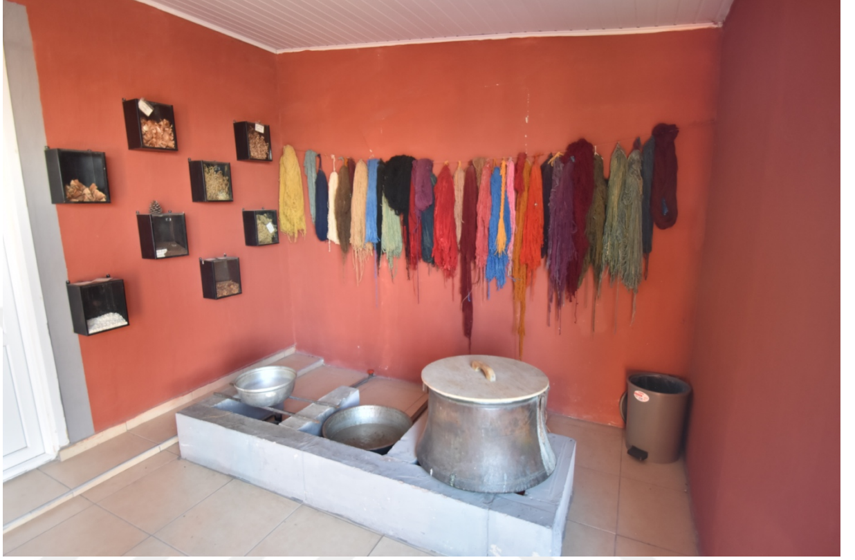
Fotoğraf 19. Halılarda kullanılan ipliklerin geleneksel yöntemlerle boyanmasında kullanılan malzemeler

verilen bilgiler arasındadır. Günümüzde bu şekilde boya üretimi çok yaygın olmayıp artık sentetik ürünlerin daha yaygın olarak kullanıldığı da turistlere aktarılmaktadır.