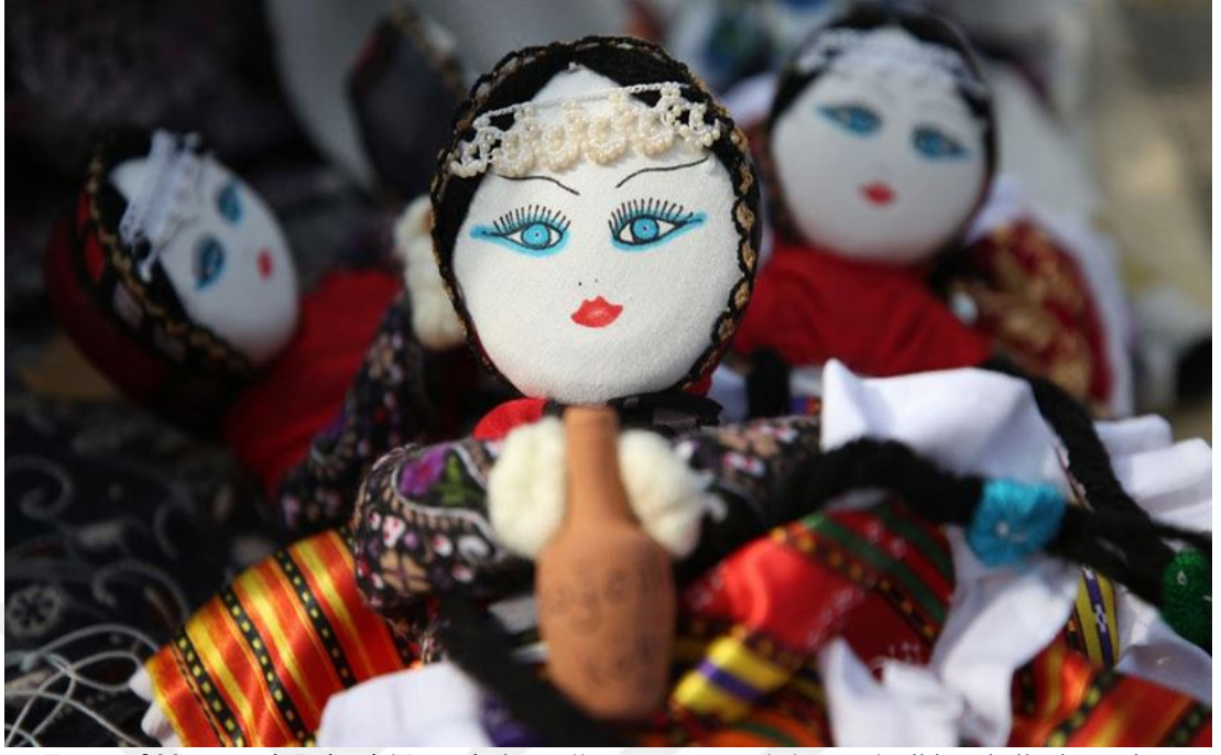
Fotoğraf 30. Soğanlı Bebeği