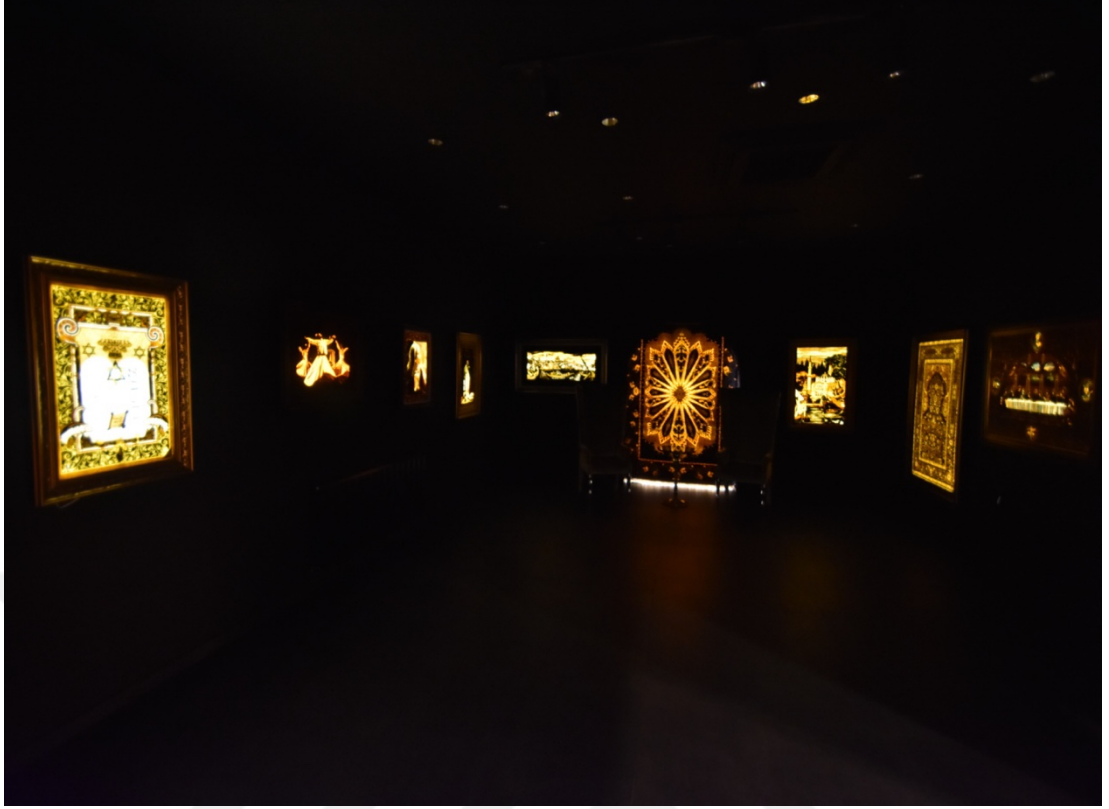
Fotoğraf 21. Yeni nesil bir halı sergileme odası

Bir başka mağazada ise eğitim konusu ön plana çıkmaktadır. Sadece gelen turist gruplarına tezgâh başında dokuma işini göstermek için değil, aynı zamanda yeni nesillere aktarım için Milli Eğitim Bakanlığı destekli kurslar düzenlenmekte, atölyelerde eğitim verilmektedir. Bu haliyle geleneksel bir ürünün değişen yaşam koşullarına bağlı olarak formel bir eğitimle aktarılması, kültürel ürünün sürekliliğini sağlaması açısından önemli gözükmektedir. Elbette burada da folklorik anlamda maddi kültür ürünleriyle ilgili olarak nesiller arası ve bağlam konusunda uyumsuzluk bulunsa da bilginin güncellenmesi, uygulamanın yeni şartlara uyarlanması ve maddi kültür öğelerinin anlam dünyasının yeniden yorumlanması devamlılık açısından önem arz etmektedir.