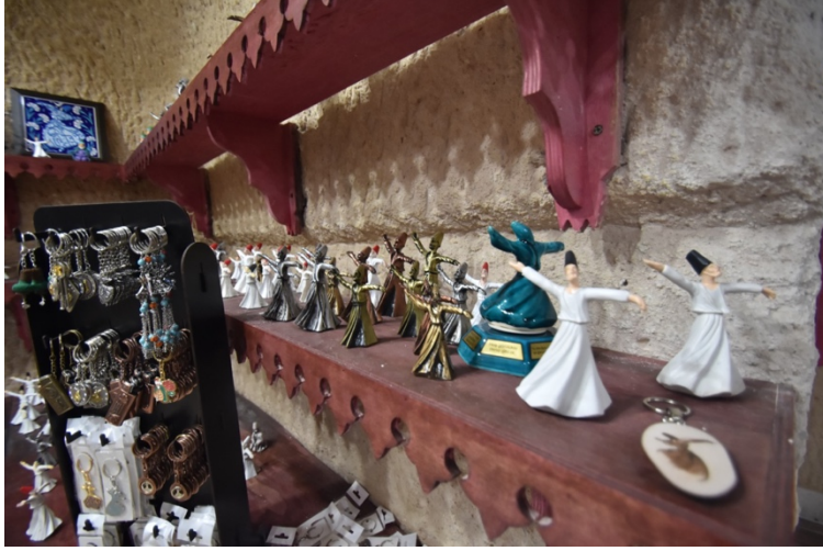
Fotoğraf 25. Sema gösterisi sonrasında ziyaretçilerin yönlendirildiği hediyelik eşya satış mağazası.