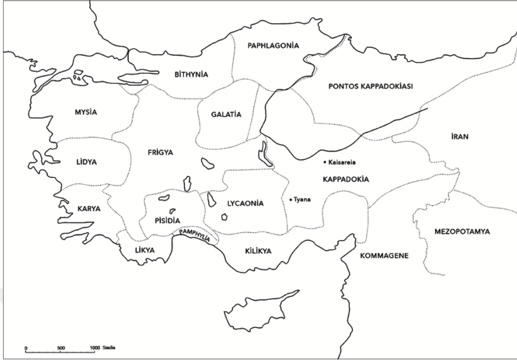
Roma döneminde Pontos Kappadokiası ve Kappadokia.

Harita 1. Antik Anadolu Haritası