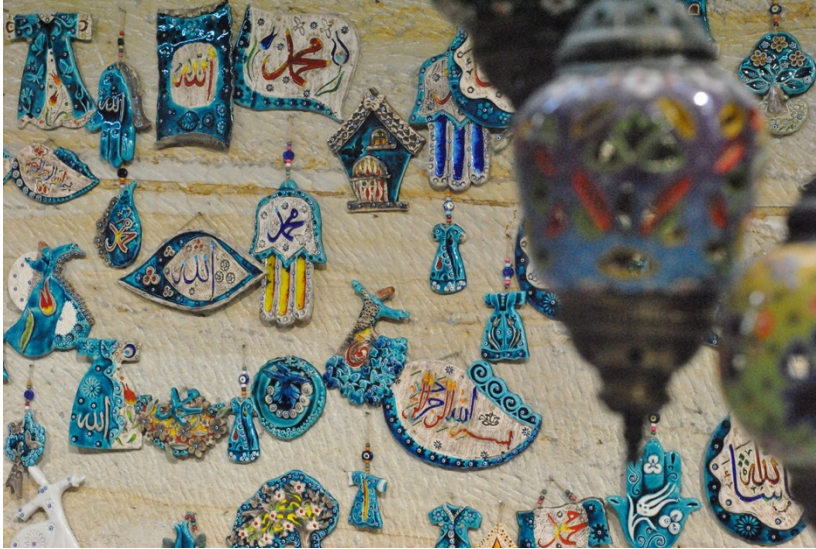
Fotoğraf 11. Geleneksel motifli ürünler

Kapadokya'nın pek çok yerinde satışa sunulan Hitit desenli ürünler çömlek ürünleri arasında dikkat çekmektedir. Özellikle Hitit şarap testisi farklı boyutlarda üretimleriyle bunlar arasında ön plandadır. Bu ürünün sürekliliği sorgulandığında geleneksel olarak