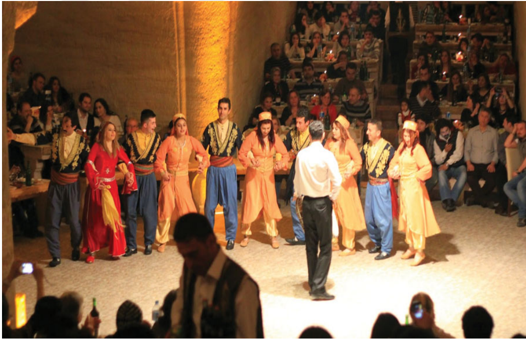
Fotoğraf 27. Türk Gecesi

Bir başka sahnelenen otantiklik konusu büyük mağara şeklinde tasarlanmış eğlence mekânlarında turistlere yönelik düzenlenen “Türk Gecesi” isimli eğlencedir. Bu eğlenceler bölgenin mağara evleriyle özdeş şekilde tasarlanmış ve turistlerin hala Kapadokya'da bulunduğunu hissettiren bir ortamda gerçekleştirilmektedir. Bir bakıma potpuri olarak isimlendirilebilecek bu gecelerde Türkiye'nin farklı bölgelerinden yemekler, müzikler, halk oyunları ve oryantal danslardan oluşan bir şov sunulmaktadır. Böylelikle ülke kültürü “tanıtılmaktadır”.