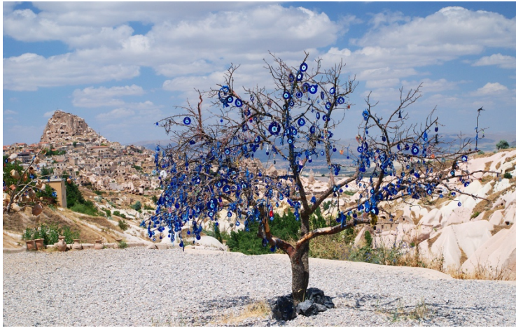
Fotoğraf 28. Gökboncuk asılı ağaç, (Kaynak: http://volajandasi.blogspot.com/2017/10/uchisar-guvercinlik-vadisi-kapadokya.html )