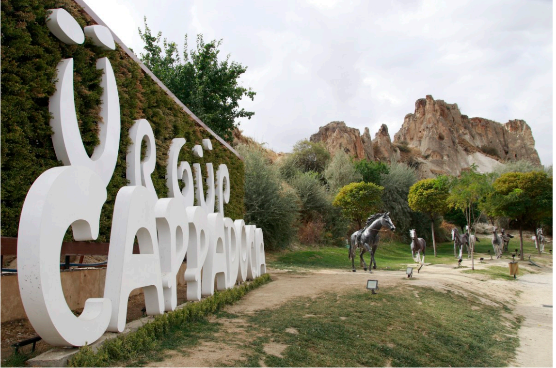
Fotoğraf 1. At heykelleri. https://www.urgup.bel.tr/proje/masal-kent-urgup-seyir-terasi-projesi#images-1

Yaygın kabule göre Kapadokya adı “Güzel atlar ülkesi” anlamına gelmektedir. Bu bilgi artık yerleşik ve sorgulanmaz şekilde yaygın bir kullanıma sahiptir. Hatta algı da bu yöndedir ki, “güzel atlar ülkesi” denildiğinde akla “Kapadokya” gelmektedir. Bu ifadenin kaynağı olarak Pers dili gösterilmektedir. Oysa Faruk Pekin, dilbilim araştırmalarının bu bilgiyi doğrulamadığını belirtir. Kelime kökeni itibariyle Katpatuka, Hepat/Khepat sözcüklerinden ya da Kızılırmak kolu olan Kapadoks (Delice Çayı) adından türemiş olabileceğini belirtir (Pekin, 2018: 22).