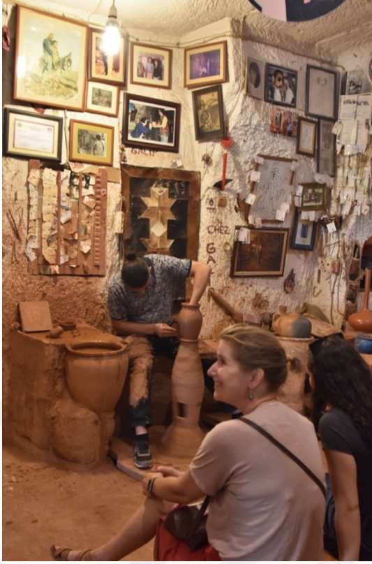
Fotoğraf 2. Turislere yönelik çömlek yapımı.