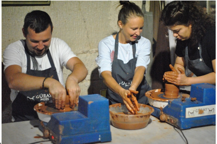
Fotoğraf 3. Çömlek yapımını deneyimleyen turistler.

Bu gösterilerde çömlek hakkında bilgi verilmekte, malzemesinden pişirilmesine üretim süreci aktarılmaktadır. Turist gruplara gösterilen yapım tekniği geleneksel ahşap aletlerle yapılmakta çömleğin otantikliği ve geleneksellik vurgulanmaktadır. Ancak artan üretim ve gelişen teknoloji ile yeni aletlerin ve fırınların kullanıldığı da belirtilmektedir. Örneğin geleneksel üretim tarzında kullanılan ve “ıptidai” olarak nitelenen (Koşay ve Ülkü, 1962) “kara fırın” kullanımı azalmıştır (Aslan, 2012). Bazı