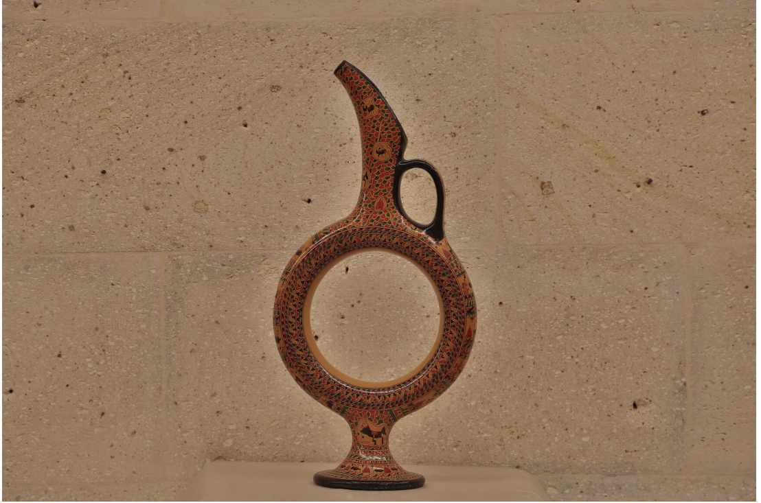
Fotoğraf 12. Hitit Şarap Testisi

kullanılmadığı orijinali Ankara Anadolu Medeniyetler Müzesi'nde bulunan eserden hareketle üretildiği, süslendiği ve sunulduğu bilinmektedir. Üzeri rapido tekniği ile süslenen Hitit güneş şarap testisi farklı renklerde, desenlerde, ebatlarda üretilmektedir. Üreticilerin ifadesine göre yoğun ilgi gören bu ürün gerek şarap servisi gerekse biblo olarak evde eşya ya da dekorasyon ürünü olarak kullanılmaktadır. Testi işçiliğine ve malzeme kalitesi göre değişen fiyatlara sahiptir. Birkaç yüz liradan başlayan testi fiyatı yüz bin lirayı aşan hale gelebilmektedir. Dolayısıyla ürünün her gelir grubundan insana hitap ettiği, yüksek fiyatlı olanların prestij gösterir bir mahiyete sahip olduğu söylenebilir.