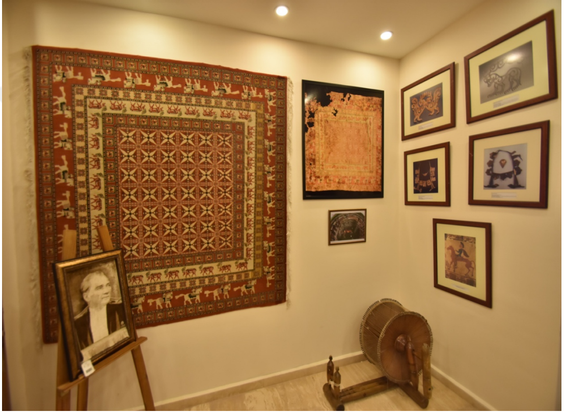
Fotoğraf 15. Pazırık Halısının Replikası, Çınar Halı.

anlamları olmakla birlikte, eli belinde, hayat ağacı, çift boynuz vb. gibi günümüzde bunların ayrıntılı tanıtımına girilmediği satış sorumluları tarafından belirtilmektedir. Gelen turist gruplarına ayrılan vaktin sınırlı olması yanında turist profilinin de çoğunlukla bu bilgilere talepkâr olmaması bu durumun sebepleri olarak gösterilmektedir. Ancak geçmişte halı gösterilen turistlerin daha entelektüel ve ilgili oldukları ve onlara bu konularda bilgiler aktardıkları yine satış uzmanları tarafından söylenmektedir.