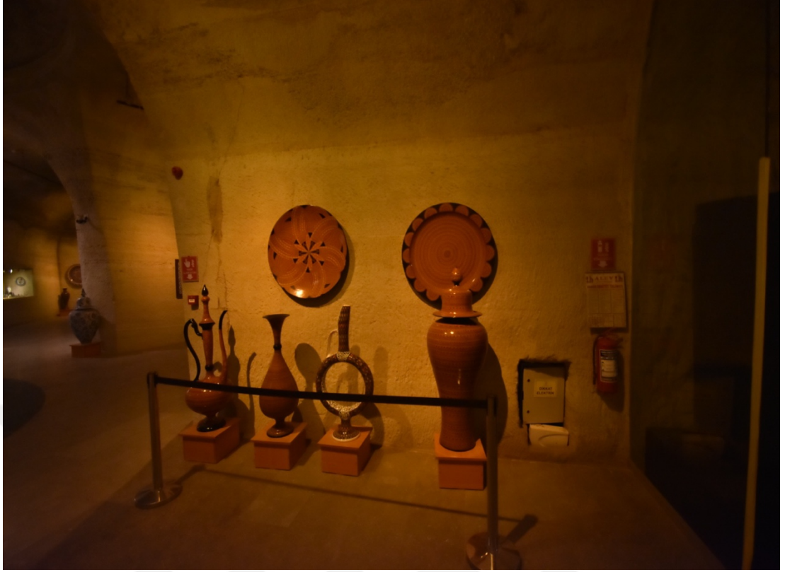
Fotoğraf 7. Güray Müze'den sergilenen eserler.