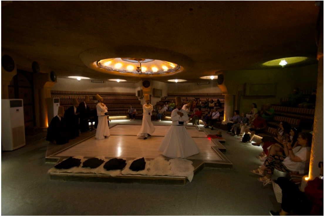
Fotoğraf 26. Sema töreni sonrasında turistlerin fotoğraf çekimi esnasında semazenler

Sonuç olarak artık kurumsal olarak mevcut olmayan bir tasavvuf tarikatının dinsel bir uygulamasının turizmin sahnelenen ögesi haline geldiğini, turizmde eğlencenin yanında bir mistisizm ortamının da dahil edildiği görülmektedir. Bir turist rehberinin ifadesine göre bölgeye gün geçtikçe fiziksel ve zihinsel/ruhsal iyileşmeyi amaçlayan yoga ve meditasyon kampları da artmaktadır. Görüşme gerçekleştirilen bir rehber bölgede yaptığı bir gezi esnasında Ortahisar'daki Hospital Manastırı'nda yabancıların yoğun olduğu bir meditasyon grubunun sema ettiklerine bu esnada ilahi söylediklerine