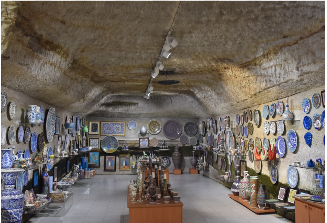
Fotoğraf 8. Güray Müze'ye bitişik bulunan mağaza.