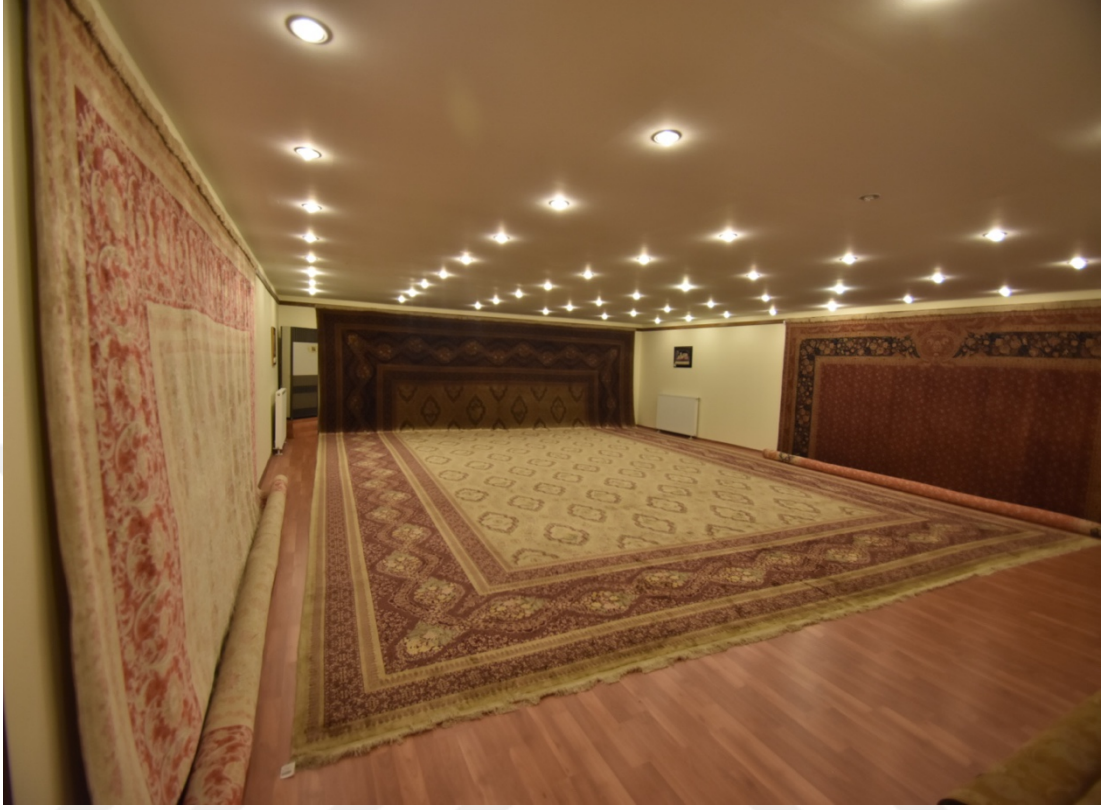
Fotoğraf 20. Dünya'nın en büyük 102 metre karelik ipek halısı.

halıcılık için önemli bir prestij kaynağı olduğu yetkililer tarafından ifade edilmektedir. Öyle ki bu halı bir gün boyunca İstanbul'da Dolmabahçe Sarayı'nda da sergilenmiştir.