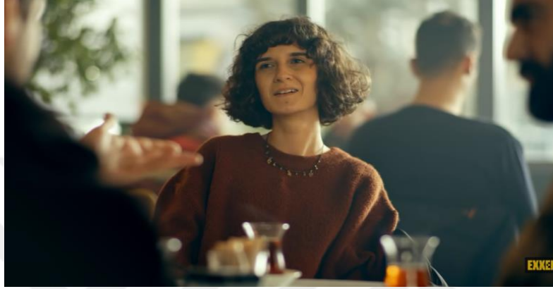
Görsel 1 “Gibi” dizisi

Şefik Bey: “Gözde; Saddam’ın bayan muhafızlarından biriydi.” Muhafızlık, toplum tarafından kadın ile bağdaştırılan bir meslek olmamasına rağmen bu sahnede genellemeler dışına çıktığı görülebilmektedir.