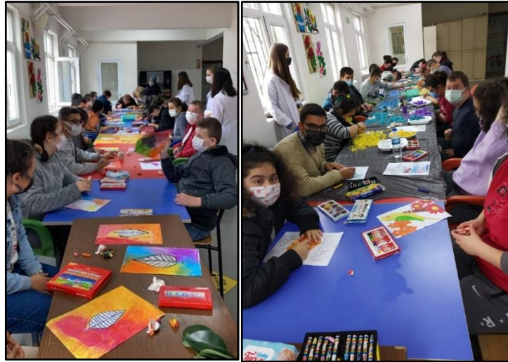
Resim 2. Görsel sanat etkinlikleri 2

Salderay (2008) “Türkiye’deki Zihin Engelliler İş Okullarında Görsel Sanatlar Dersinin Öğrencilerin Beceri, Davranış Ve Meslek Edinimindeki Katkısına Yönelik Öğretmen Görüşleri” adlı araştırmasında, Mayer (1999) “Yetkinlik Profili: Devlet Onaylı İş Eğitimcisi Devlet Onaylı İş Eğitimcisi” adlı araştırmasında, Polloway ve Patton (1997) yapmış oldukları “Özel İhtiyaçları Olan Öğretim için Stratejiler” araştırmalarında özel gereksinimli bireylerin kısıtlılık durumundan ve çevreden kaynaklı olan durumlar sebebiyle toplumla kaynaşmasında güçlük yaşadıklarını; bu güçlüklerin Görsel Sanatlar eğitimi ile aşılmasının mümkün olduğundan bahsetmişlerdir. Görsel Sanatlar eğitimi; bir eserin oluşum sürecinden sergilenme sürecine kadar geçen zamanda bu eserleri üreten bireylerin sosyalleşme becerilerinde gelişim gerçekleşmektedir. Görsel Sanatlar ile ortaya konan eserin sergilenme sürecinde, eseri gören kişilerin etkilenme durumları, eseri oluşturan kişilere karşı geliştirilen düşünceler de bireyleri etkilemektedir (Salderay, 2010). Görsel Sanatlar çalışmaları, özel gereksinimli bireylerin toplumla bütünleşme ve toplumun da bireylerle ilgili bilinç oluşturmalarını sağlamaktadır. Bu sebeple özel gereksinimli bireylerin sosyalleşmesinde Görsel Sanat etkinliklerinin katkısı önemlidir.