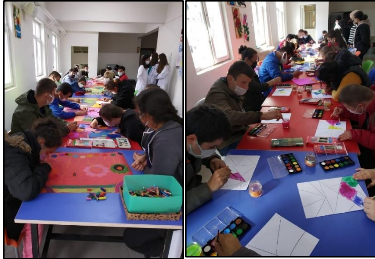
Resim 3. Görsel sanat etkinlikleri 3

Engelli birey nasıl bir özel duruma sahip olursa olsun, Görsel Sanatlar içerisindeki birçok yoldan biri ile ona başarı duygusu tattırılabilir. Engelli bir bireyin başarı duygusunu yaşayabilmesi için o işi tamamen kendisinin yapmasına gerek yoktur. İşin yapılış sürecinde, sürecin içerisine dâhil olması bile başarı duygusunu yaşamasında yeterli olabilmektedir. Çünkü bu bireylerin toplumsal kabul görebilmeleri için; başarı duygusuna normal gelişim gösteren bireylerden daha fazla ihtiyaç duyabilmektedirler (Erim & Caferoğlu, 2012, s. 338).