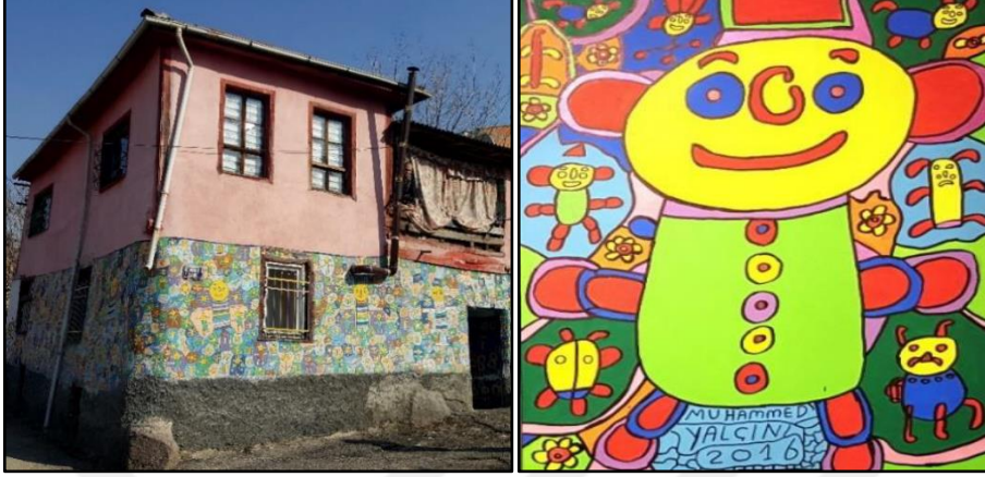
Resim 4. Özel eğitim etkinliği 5 (Laçınbay & Yılmaz, 2018)

gelişmekte, benlik kazanımı sağlanmakta, duygusal bir doyuma ulaşmaktadırlar. Hayal kurarak yaratıcılıklarını geliştirmeleri de mümkün olmaktadır (Geçen & Parsıl, 2020).