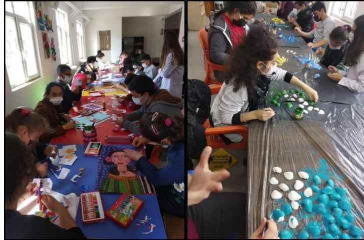
Resim 1. Görsel sanat etkinlikleri 1

Çocukluk çağında bireylerin kendilerini ifade edebilme ihtiyaçlarının karşılanması için sanat çok önemlidir. Kişiliğin önemli ölçüde gelişmesi çocukluk çağında gerçekleşmektedir. Çocuklar bu dönemde kendilerini ifade edemediğinde ileride bazı travmalar ortaya çıkabilmektedir. Çocuk için oyun anlamı taşıyan sanat, çocuğun eğitiminde etkilidir. Eğitimin çocuklar için neşeli hale gelmesinde oyunun, sanatın etkisi çok büyüktür. Çocuklar ellerine ilk aldıkları kalem ve diğer aletlerle ilk karalamalarını yapmaya başlamaktadır. Bu karalamalar zamanla değişerek gelişerek, özgün bir hal almaktadır. Çoğu zaman büyükleri bile imrendirecek seviyeye gelmektedir. Çocuklara göre bu eğlenceli bir oyundur. Bu oyun hiç kimsenin yönlendirmesine ihtiyaç duymadan çocuklarca sevilerek ve istenerek yapılmaktadır (Ayaydın, 2011). Görsel Sanatlar eğitimi bu sebeple oyun haline getirilerek bireylerin eğlenceli vakit geçirmelerini teşvik etmeli, aynı zamanda sosyalleşme süreçleri içinde önemli bir adım olmalıdır.