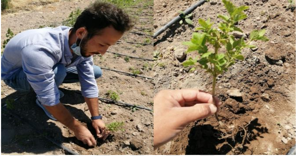
Şekil 2. Oğulotu fidelerinin dikim işleminden bir görünüm