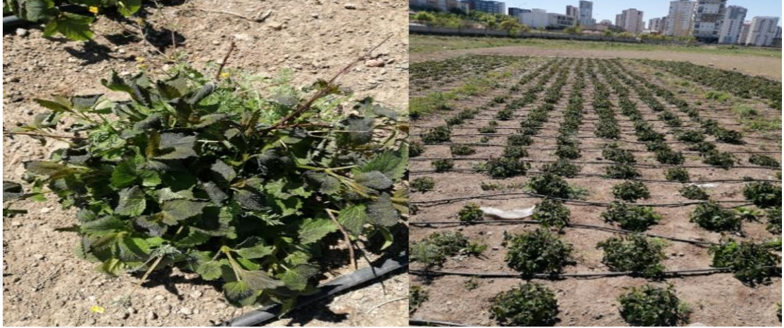
Şekil 5. Baharda soğuk zararına uğramış bitkilerin görünümü

önem seviyeleri ise Duncan Testi kullanılarak belirlenmiştir. Çalışmadaki istatistiki analizlerin yapılması amacıyla MSTAT-C paket programı kullanılmıştır [39].