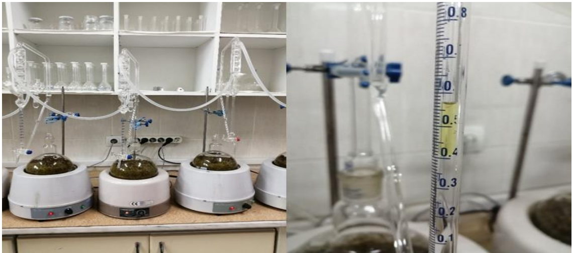
Şekil 7. Uçucu yağ analizinden bir görünüm