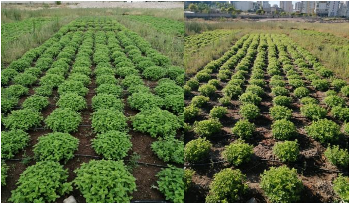
Şekil 4. Deneme alanından genel bir görünüm

Bitkiler kışı geçirdikten sonra 20.04.2021 tarihinde yabancı otlarla mücadele için ilk çapa yapılmış ve yine her parselde dekara 4 kg azot gelecek şekilde üst gübreleme (ÜRE formunda) uygulanmıştır. Bitkilerin toparlanması ve yeniden sürgün vermesini hızlandırmak amacıyla 1. biçimden sonra aynı şekilde son kez her parselde dekara 4 kg azot olacak şekilde üst gübreleme (ÜRE formunda) yapılmıştır. Her gübre uygulaması parsellerde sıra arasına uygulanmış ve çapa ile toprağa iyice karıştırılmıştır. Deneme alanı mayıs ayı ortasından itibaren haftada bir, temmuz ve ağustos aylarında ise haftada iki defa olacak şekilde damlama sulama ile sulanmıştır.