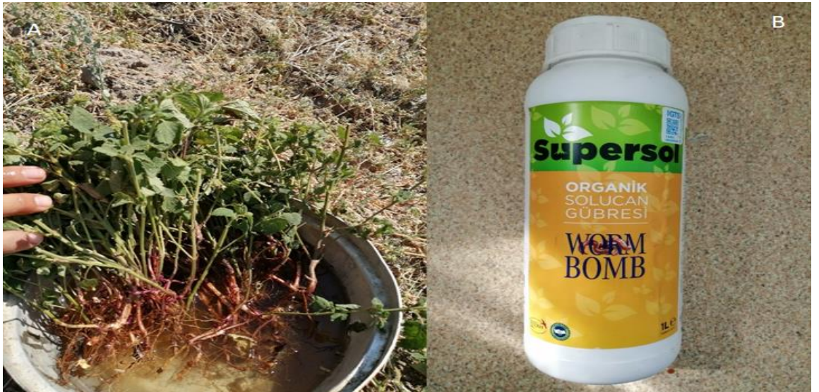
Şekil 1. Kullanılan oğulotu fideleri (A) ve organik solucan gübresinden (B) bir görünüm

Bu tez çalışması Erciyes Üniversitesi Tarımsal Araştırma ve Uygulama Merkezi (ERÜTAM)'nin deneme arazisinde kurulmuştur. Denemenin ilk tesis yılı 2020 yılı yazlık yetiştirme sezonunda kurulmuş olup, çalışmanın verileri 2021 yılı yazlık yetiştirme sezonundaki bitki biçimlerinden elde edilmiştir. Çalışmada kullanılan oğulotu fideleri tıbbi ve aromatik bitkiler tür bahçesinde bulunan oğulotu plantasyonundaki bitkilerden sağlanmıştır. Çalışmada organik gübre olarak sıvı formda solucan (vermikompost) gübresi (Supersol marka, WORM BOMB ürünü, organik madde %15, hümitik+fülvik asit %1.5, suda çözünür K 2 O % 1, EC 5 dS/m, pH 4.5-6.5) kullanılmıştır. Araştırmada kullanılan oğulotu bitkileri ve sıvı solucan gübresine ait bir görünüm Şekil 1'de gösterilmiştir.