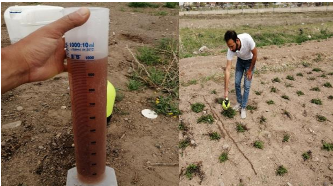
Şekil 3. Organik gübrenin uygulanmasına ait bir görünüm

Uygulama olarak kullanılan organik solucan gübresi sıvı formda, her bir parselde 1 litre su ile atılması gereken dozlarda (Kontrol, 0.8, 1.6 ve 2.4 L/da) çözdürülerek el pülverizatörü ile 29.04.2021 tarihinde bitkilerin 5 cm sağına ve soluna eşit bir şekilde uygulanmış ve çapalanarak toprağa karıştırılmıştır.