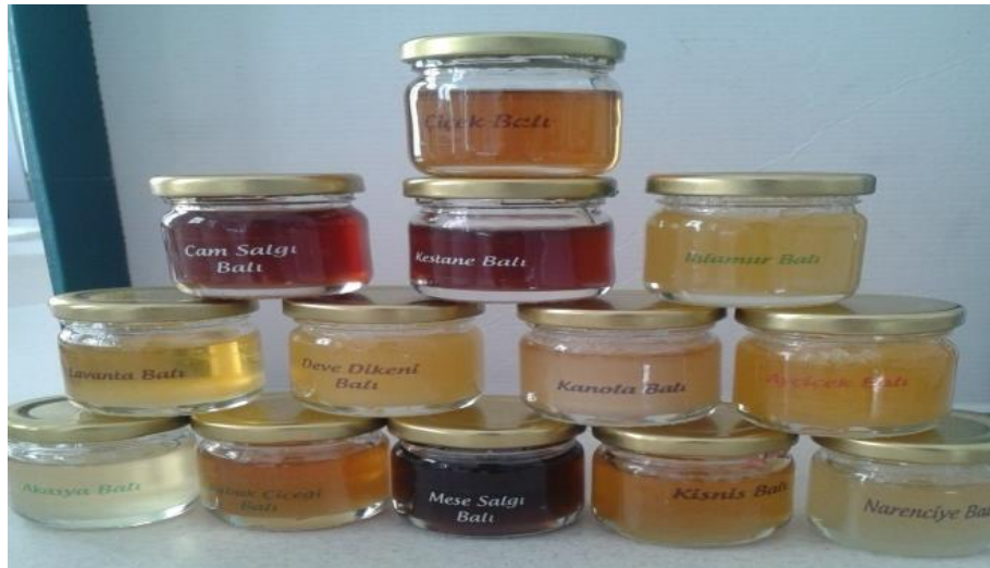
Şekil 2. Analizde kullanılan bal örnekleri

Bütün bal örnekleri karanlık ve serin ortamda muhafaza edilmiştir. Numunelerde yapılan tüm analizler, balların üretildiği yıl içerisinde gerçekleştirilmiştir.