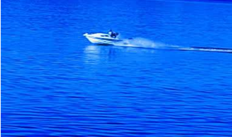
Resim 9: Hazar Gölü'nde jet-ski turlarından bir görüntü

Hazar Gölü'nde su sporlarının yapılabilmesi için çeşitli çalışmalar yapılmaktadır. Sivrice Su Sporları Adrenalin Merkezi'nde 2 yıl sürecek olan proje ile; parasailing, jet-ski turları, tüplü dalış, su kayağı, kano, su bisikleti vb. su sporları etkinlikleri yapılacaktır (44).