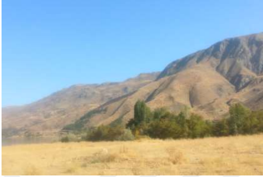
Resim 28: Hazar Baba Dađı dođa yürüyüşü parkurlarından bir örnek