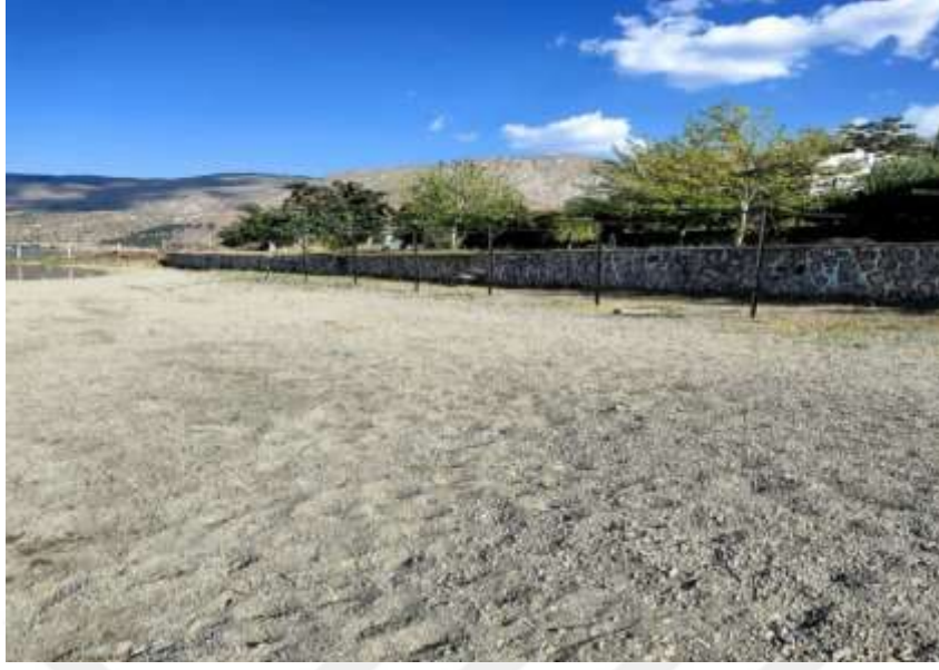
Resim 36: Hazar Gölü plaj voleybolu alanlarından bir örnek