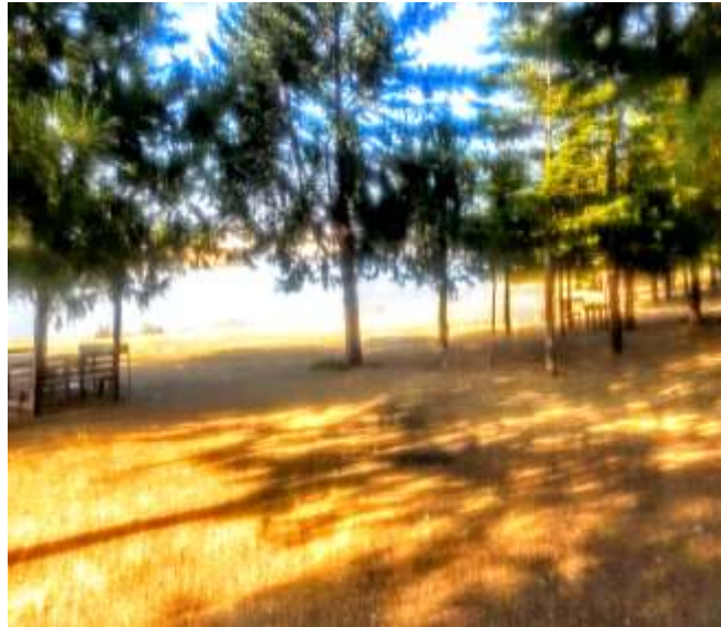
Resim 32: Hazar Su Sporları ve Motosiklet Kamp Merkezi

Sivrice ilçesinde bulunan Su Sporları ve Motosiklet Kamp Merkezi'nde her mevsim, motosiklet sporları yapmak isteyenlere hizmet verilmektedir. Tesiste çadır-kamp turizmi için uygun alanlar bulunmaktadır.