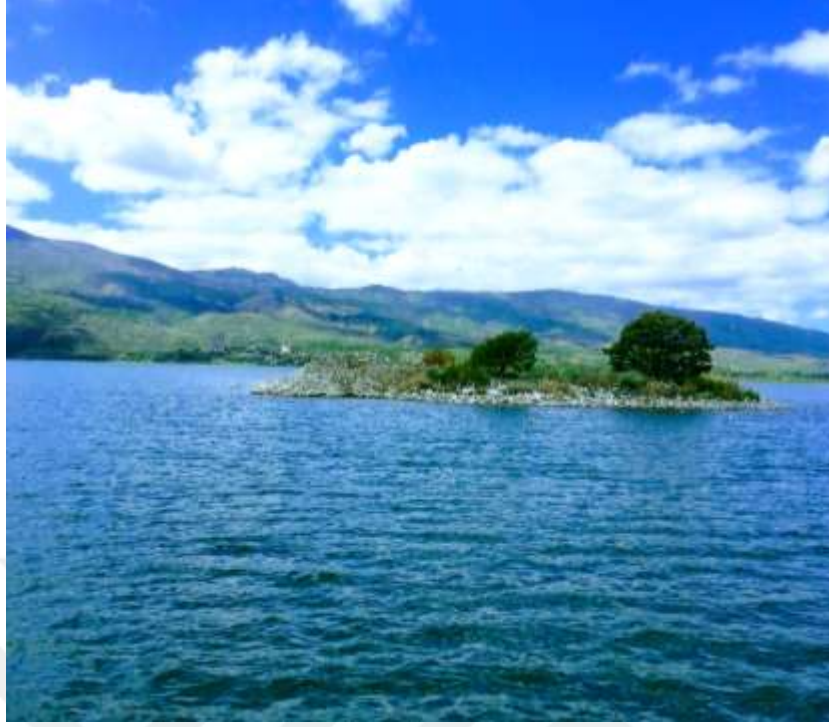
Resim 37: Fotoğrafçılık etkinliklerinin yapıldığı Hazar Gölü’nden bir örnek