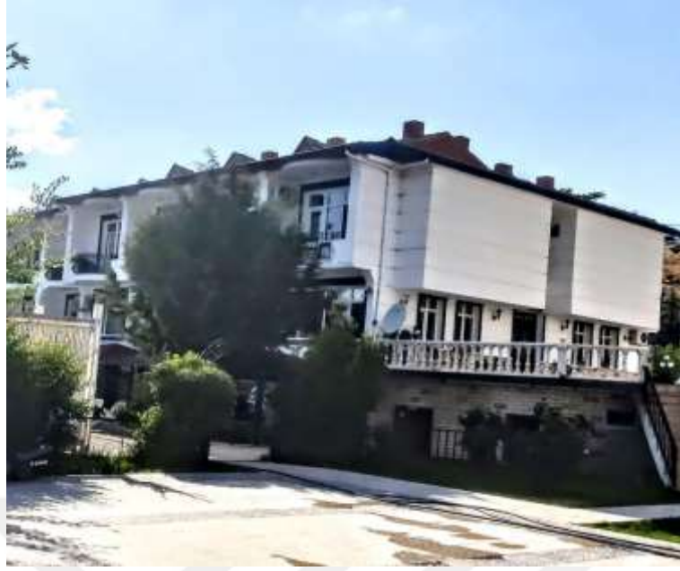
Resim 42: Sivrice’de bakanlık belgeli konaklama tesislerinden otel örneđi