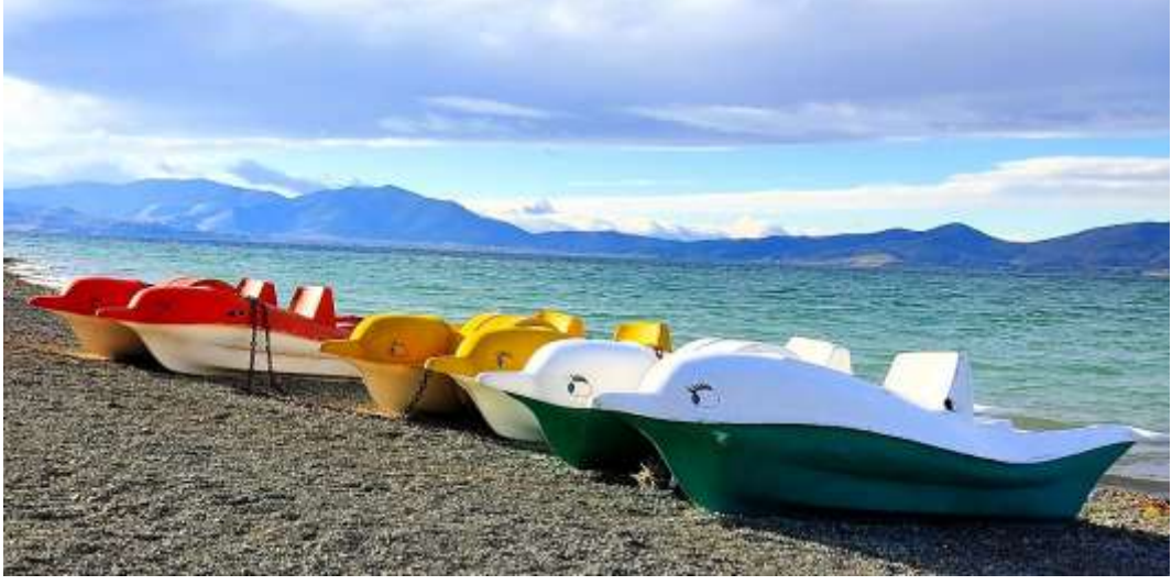
Resim 8: Su bisikletine Hazar Göl'ünden bir örnek