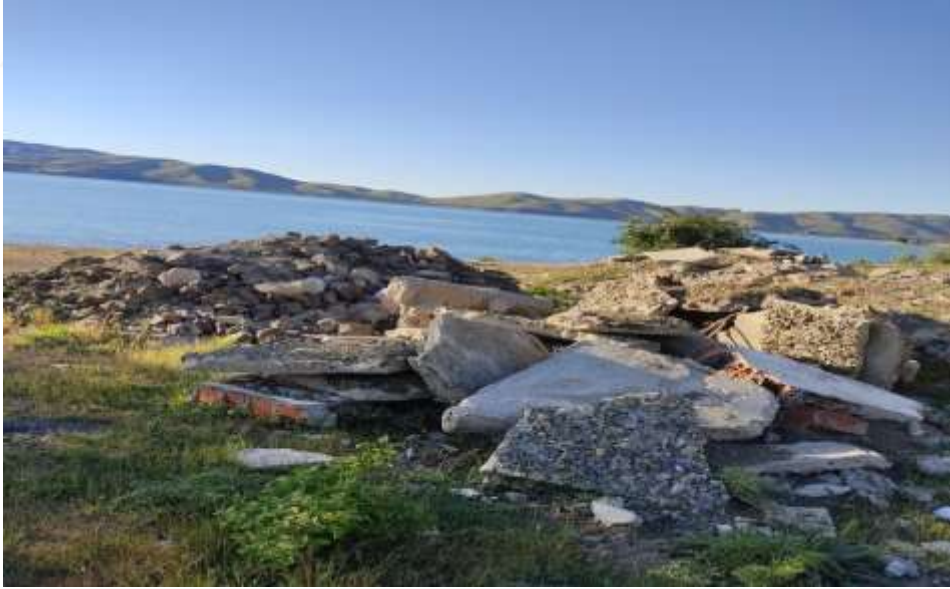
Resim13: Hazar Gölü kıyılarına dökülmüş hafriyat toprağı ve inşaat atıkları

Hazar Gölü'nü besleyen derelere dökülen çöpler, hafriyat toprağı, inşaat atıkları vb. Hazar Gölü'nün kirlenmesine yol açmıştır.