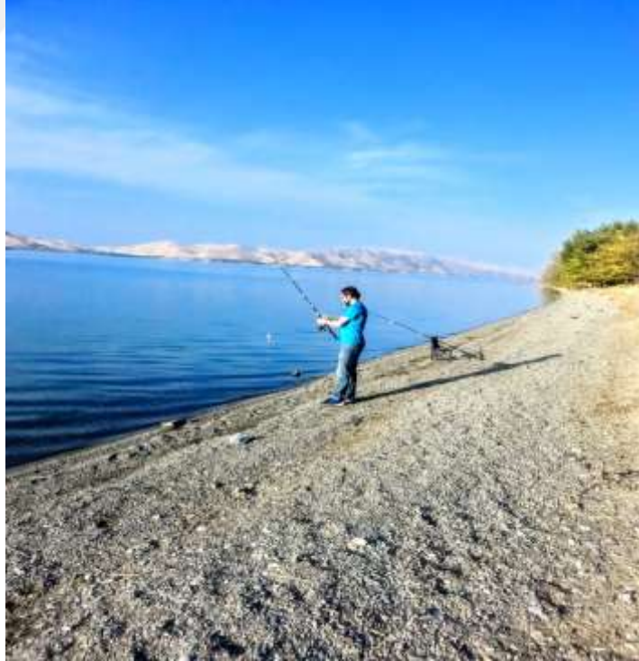
Resim 26: Hazar Gölü'nde olta balıkçılığı

Olta balıkçılığı amatör ve profesyonel av sporcuları tarafından sportif ve ihtiyacı karşılamak amaçlı yapılmaktadır. Olta balıkçılığı için Hazar Gölü ve ilçe sınırlarını belirleyen Fırat Nehri üzerinde kurulan Karakaya Baraj Gölü uygun alanlardır (52).