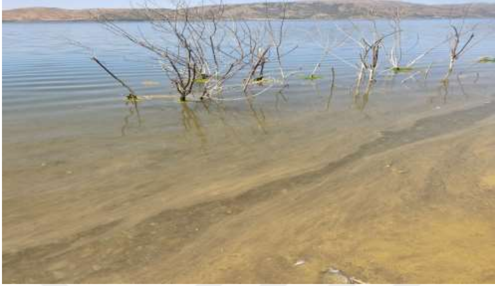
Resim 14: Hazar Gölü'nde çeşitli nedenlerle oluşmuş su kirliliği