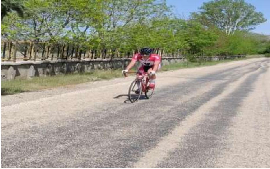
Resim 22: Sivrice’de bisiklet sporu parkurlarından bir rnek

Hazar Gl evresinde bisiklet sporu, amatr ve profesyonel sporcular tarafından yapılmaktadır. Gl evresinde sporcuların kamp yapabileceđi alanlar mevcuttur.