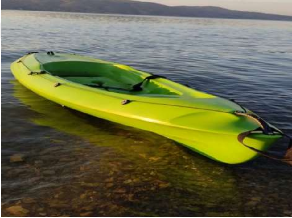
Resim 20: Hazar Gölü'nde kano görüntüsü

Hazar Gölü'nde kano sporu da yapılmaktadır. Sporcular göl çevresinde kano kiralarak veya kendi kanolarıyla spor yapabilme imkanı bulabilmektedir.2017 yılında GELDER tarafından düzenlenen festivalde kano turları yapılmıştır (42).