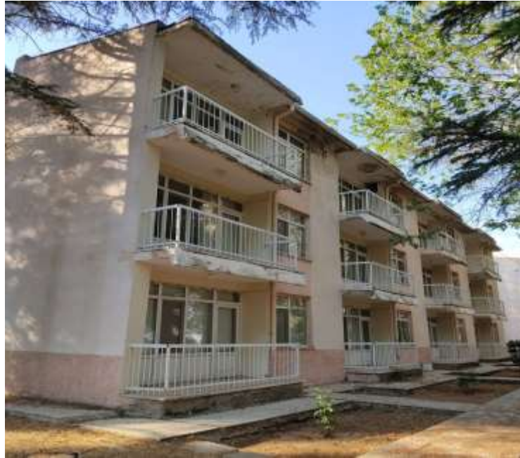
Resim 43: Kamu kurumlarına ait konaklama tesislerinden Sivrice’den bir örnek

Sivrice ilçesinde kamu kurumlarına ait konaklama tesisleri de bulunmaktadır (Tablo12).