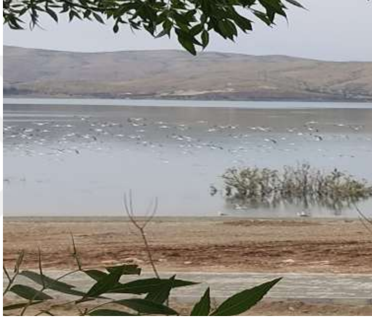
Resim 33: Hazar Gölü'nde konaklayan kuşlardan bir görüntü

İlçe, kuş gözlemleme sporu için elverişli alanlara sahiptir. Hazar Gölü'nün doğu ve batı kıyılarında bulunan sazlık alanlar birçok kuş türü için üreme, göç veya kışlama alanıdır. Göldeki adalarda Van Gölü Martısı ( Larus armenicus ) üremekle birlikte türün popülasyonunun büyüklüğü hakkında veri bulunmamaktadır.