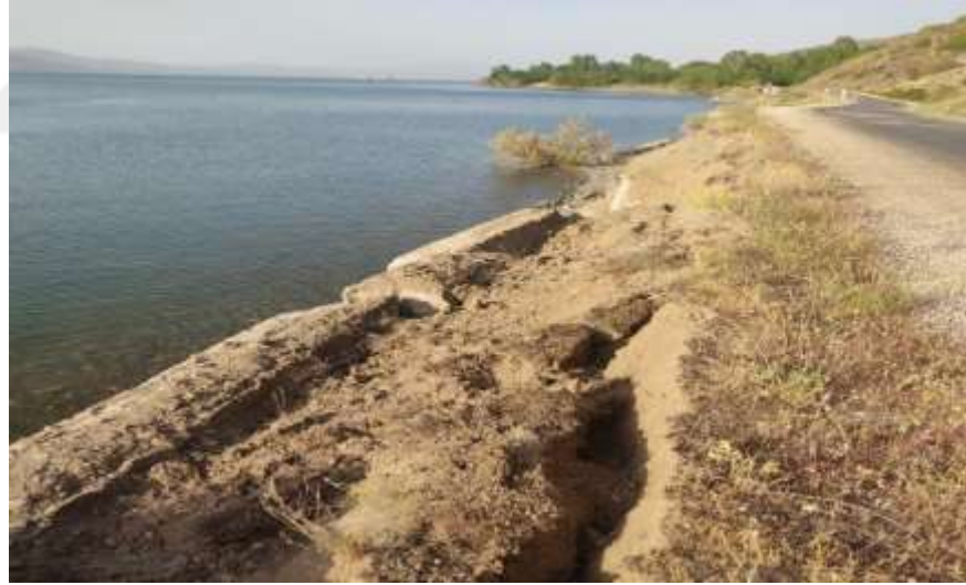
Resim11: Hazar Gölü'nde dalga aşındırması ve çökmeler sonucu oluşan su kirliliği

Göl suyunun rengine; gölü besleyen derelerin toprak aşınımı, dalgaların etkisi vb.etki etmektedir.