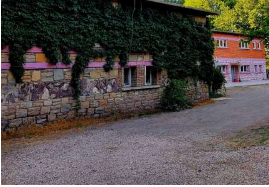
Resim 41: Mahalli idareler belgeli konaklama tesislerinden Sivrice'den bir örnek