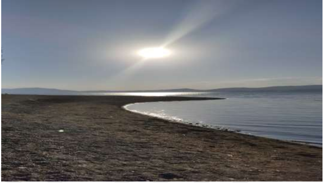
Resim18: Gölcük Tatil Köyü Plajı'ndan bir görüntü