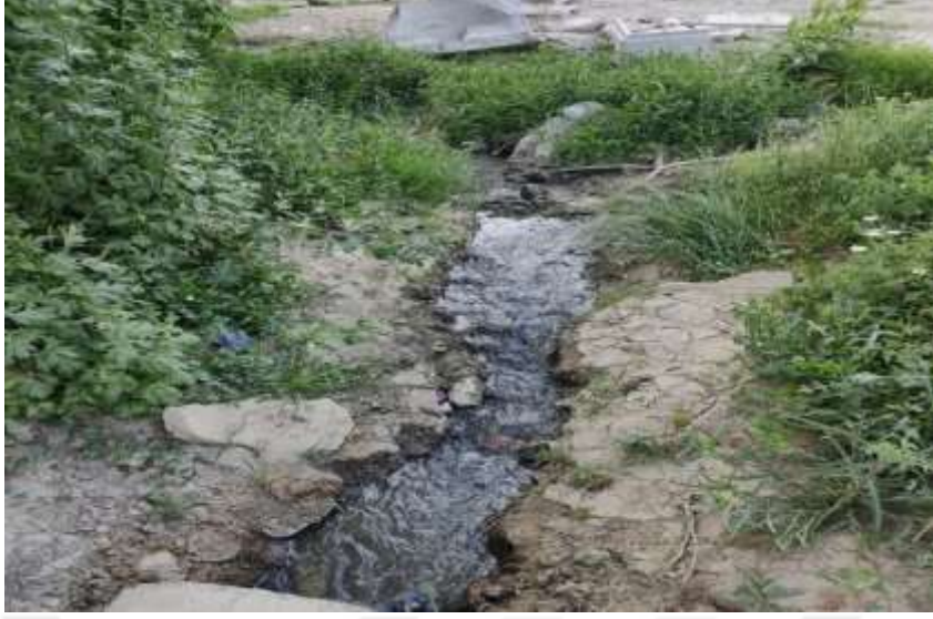
Resim12: Hazar Gölü'ne karışan kanalizasyon suları