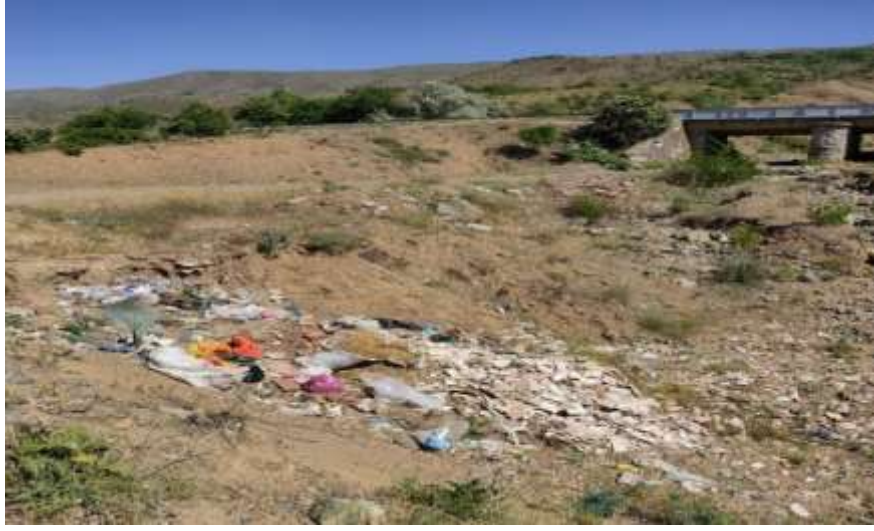
Resim 10: Hazar Gölü'nü besleyen dere yataklarına dökülen atıklar