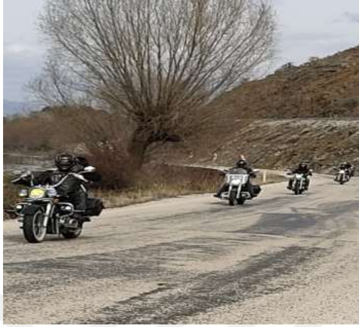
Resim 31: Motosiklet sporlarına Sivrice'den bir örnek