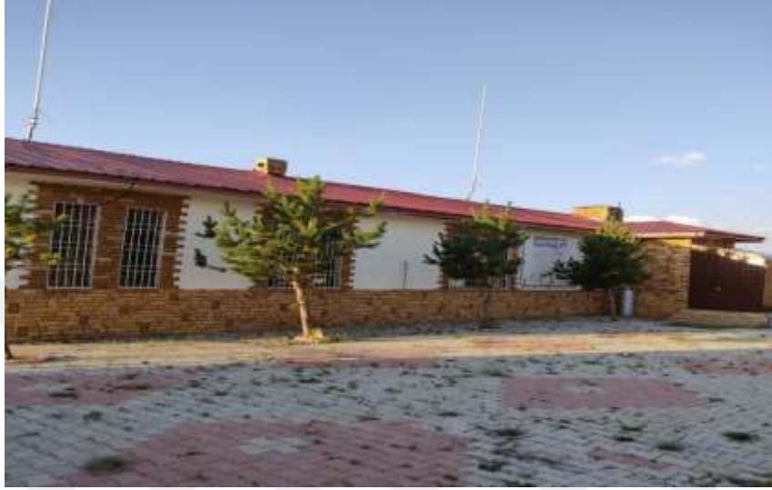
Resim 4: Hazar Baba Kayak Merkezi tesislerinden bir görüntü

kayak merkezi yol ayrımında hazır bekletilmektedir. Konaklama tesisi bulunmayan merkezde, Elazığ- Diyarbakır karayolunun ve aynı zamanda demiryolu hattının geçtiği Sivrice’de, Hazar Baba Dağı’na karayolu ile ulaşılabilir (40).