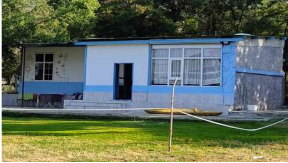
Resim 19: Hazar Gölü Su Sporları ve Adrenalin Merkezi tesislerinden bir görüntü

Hazar Gölü “Suya Bağlı Turizm” temalı EDEN 2010 yarışmasında ise finale kalmıştır (13).