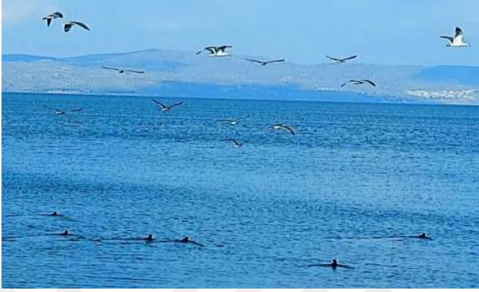
Resim 34: Hazar Gölü kuş gözlem alanlarından