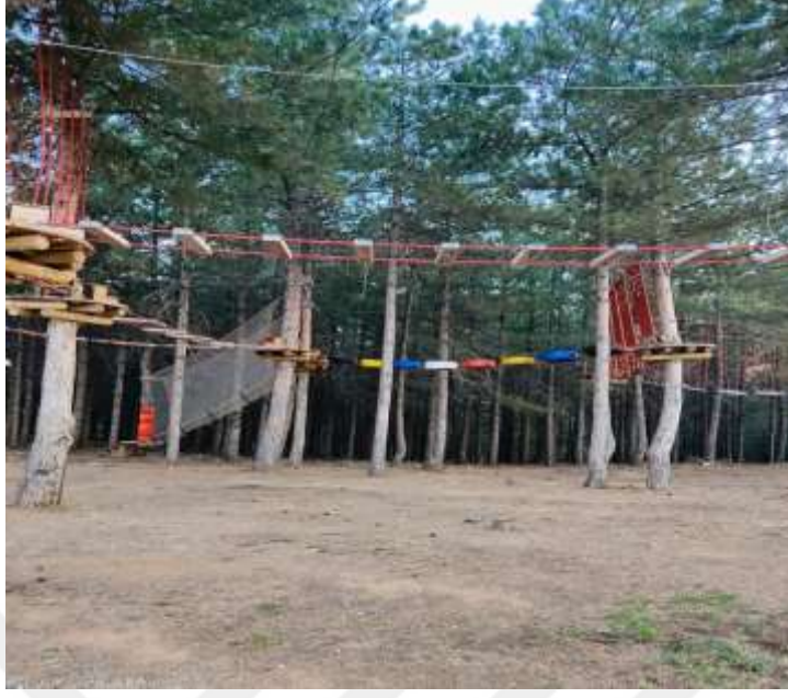
Resim 35: Hazar Baba Macera Parkı ip parkuru görüntüsü