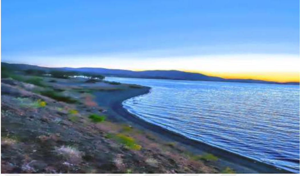
Resim 16: Sivrice Belediyesi Halk Plajı'ndan bir görüntü