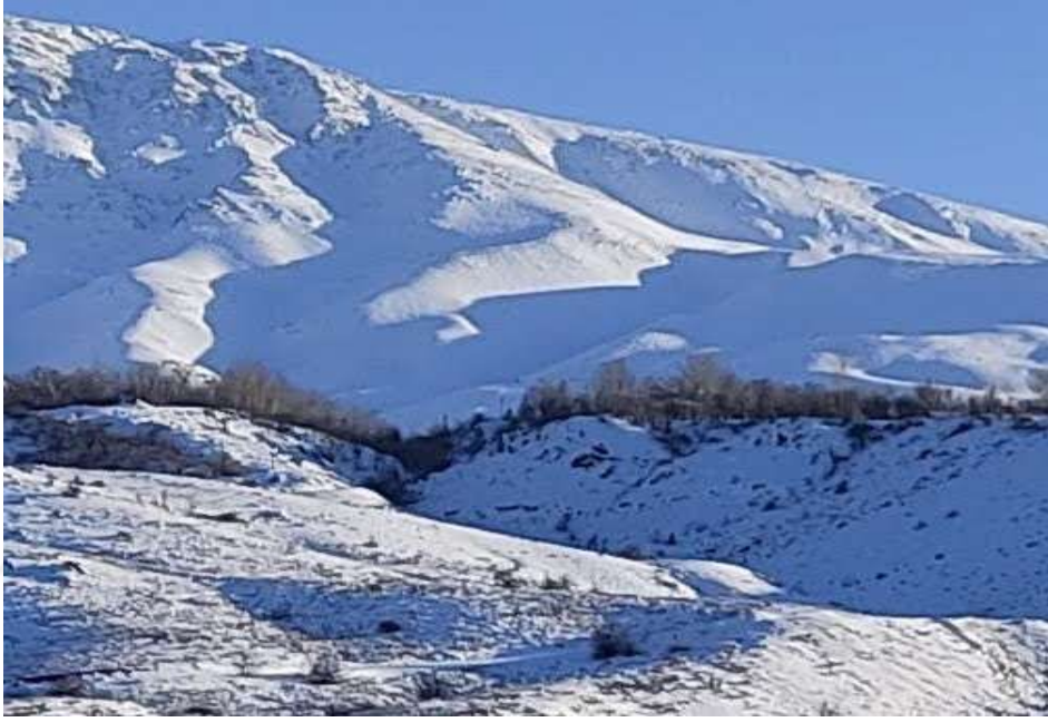
Resim 3: Hazar Baba Kayak Merkezi'nin bulunduğu bölgeden bir görüntü

yer almaktadır. Kayak sporuna elverişli pisti, telesiyeci ve yeme içme imkanları ile hizmet vermektedir. Aralık- mart döneminde kayakseverlere 1.100 m uzunluğundaki telesiyeci ve diğer mekanik tesisleri ile hizmet sunan kayak merkezi, Sivrice ilçesine 6 km mesafede olup kayak merkezine ulaşım 5 km'lik asfalt yol ile sağlanmaktadır (39).