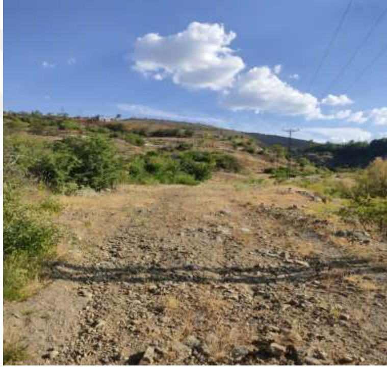
Resim 25: Hazar Baba Dağı MTB Bisiklet Yarışması parkurlarından bir görüntü

İlçede, 2017 yılında düzenlenen Hazar Baba Dağı MTB Bisiklet Yarışması'na 40 erkek sporcu 13 kadın sporcu olmak üzere toplam 53 yarışmacı, amatör bisiklet yarışmasına ise toplamda 40 sporcu katılmış ve yarışma tamamlanmıştır. Festivalin ikinci günü Hazar Gölü çevresinde tam tur yol bisikleti yarışı yapılmıştır. Yarışmaya 53 erkek, 14 kadın toplam 67 sporcu katılmış olup yarışma başarılı bir şekilde tamamlanmıştır (42).