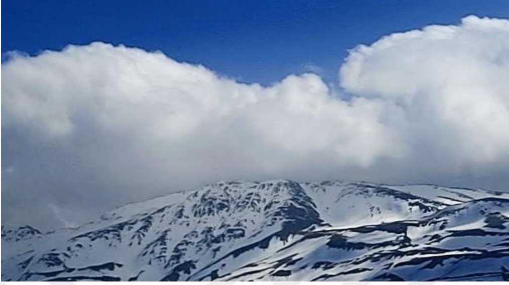
Resim 30: Hazar Baba Dağı'ndan bir görüntü