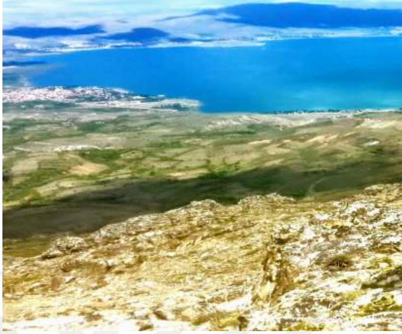
Resim 29: Hazar Baba Dağı Dağ-Doğa Yürüyüşü zirve noktasından bir görüntü