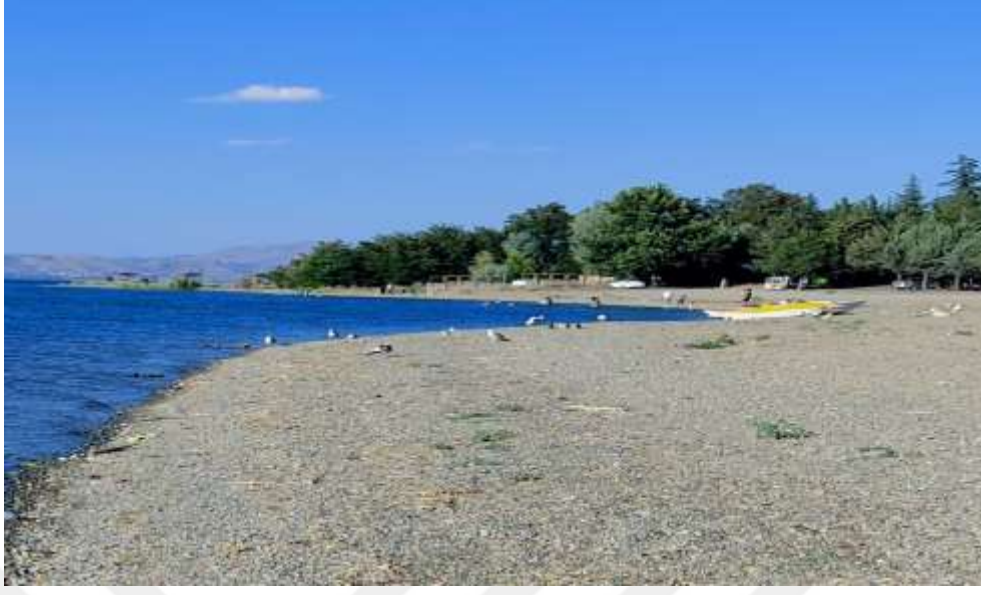
Resim17: Hazar Gölü Su Sporları ve Motosiklet Merkezi Plajı'ndan bir görüntü