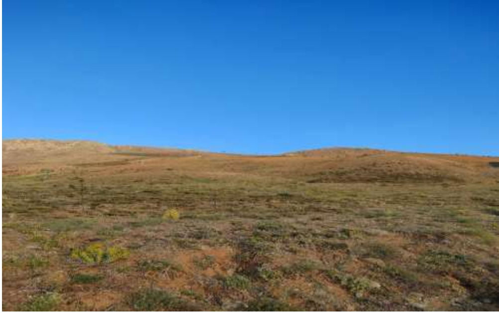
Resim 27: Geleneksel Hazar Baba Dağ-Doğa Yürüyüşü parkurlarından bir görüntü

Hazar Baba Dağı, dağ-doğa yürüyüşlerine uygun bir yapıya sahiptir. Her yıl mayıs ayının ikinci haftasında Hazar Baba Dağı'nda dağ-doğa yürüyüşü gerçekleştirilmektedir (53).