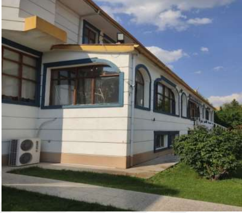
Resim 44: Sivrice’de hizmet sunan yiyecek-iecek iřletmesinden bir grnt