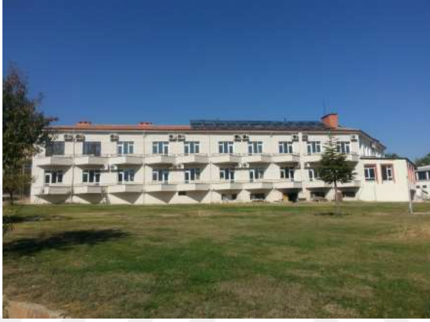
Resim 40: Sivrice’de bulunan konaklama tesislerinden bir görüntü

sürekli yaşadıkları yerlere geri dönerler (54). İnsanların yapmış oldukları bu yer değiştirme faaliyetlerinde konaklama tesisleri büyük önem taşımaktadır.