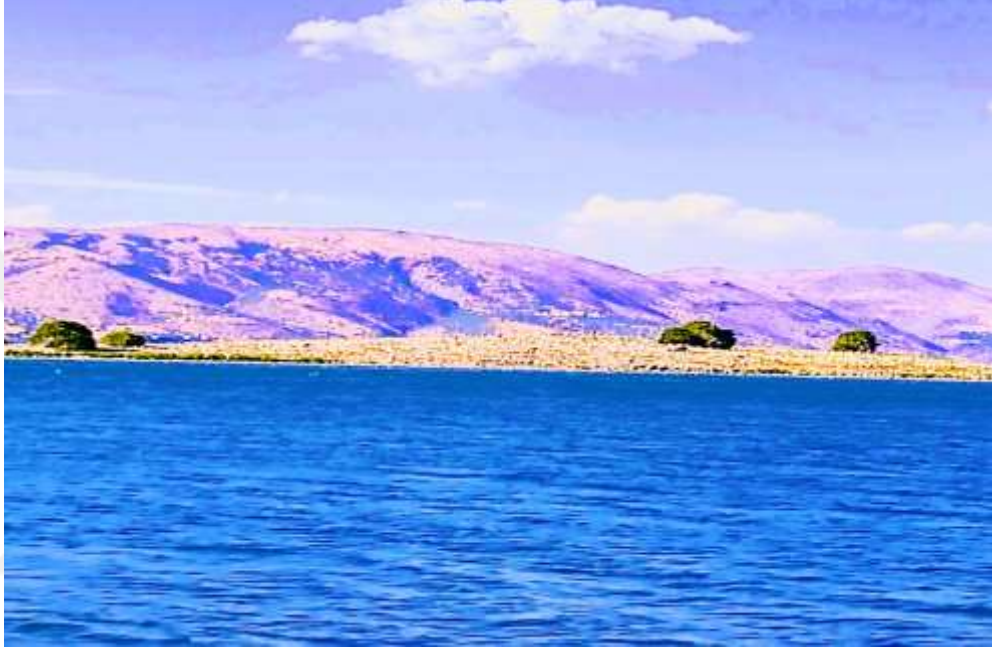
Resim 21: Çevresinde kültürel mirası barındıran Kuş Cenneti Adası

Hazar Gölü'nde; arkeolojik kültür varlıklarını incelemek ve görüntü almak için gölün güneyinde bulunan Kilise Adası'nda (Batık Kent) su altı dalışlar yapılmaktadır (34).