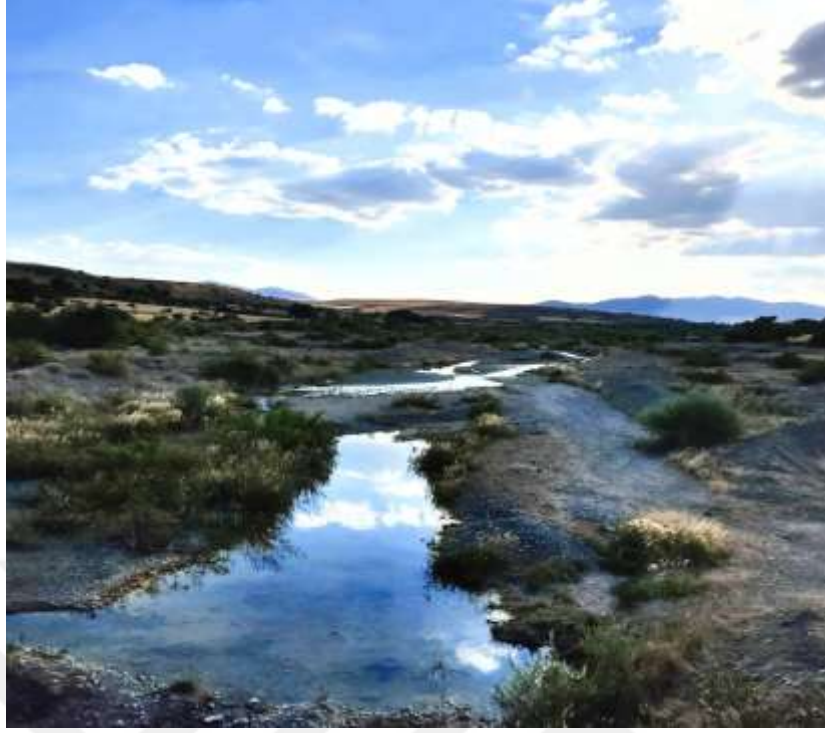
Resim 39: Çayda Çıra oyununun doğduğu Haringit Çayı'ndan bir görüntü