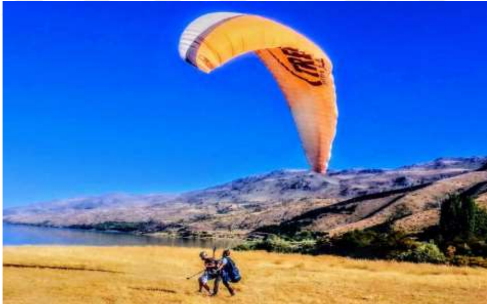
Resim 6: Yamaç paraşütü tandem uçuşlarından Sivrice’den bir görüntü

Yamaç paraşütü ile tekli ve tandem uçuşları yapılmaktadır. GELDER tarafından düzenlenen Uluslararası Yamaç Paraşütü ve Bisiklet Festivali’nde yerli ve yabancı ziyaretçiler, profesyonel pilotlar eşliğinde tandem uçuşu gerçekleştirmişlerdir (42).