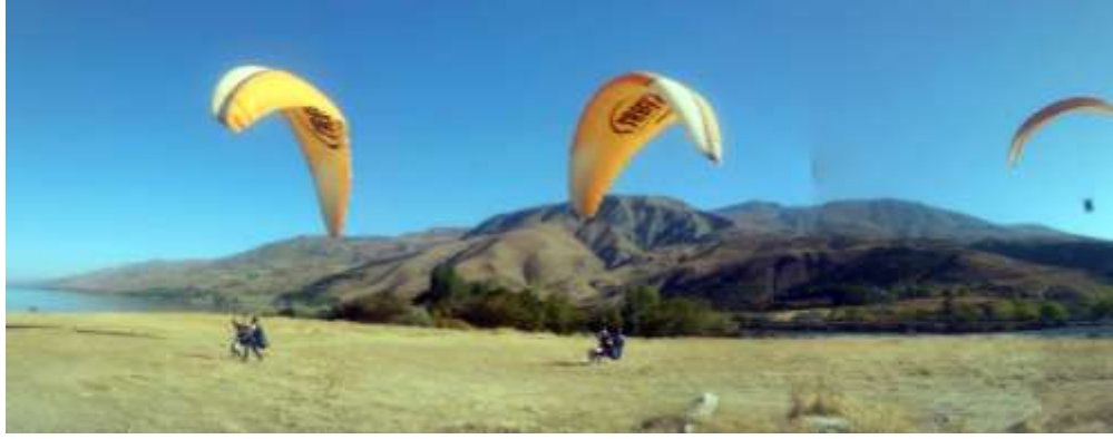
Resim 5: Sivrice’de yamaç paraşütü