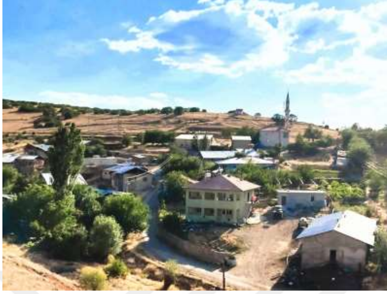
Resim 38: Sivrice Mollaali köyünden bir görüntü