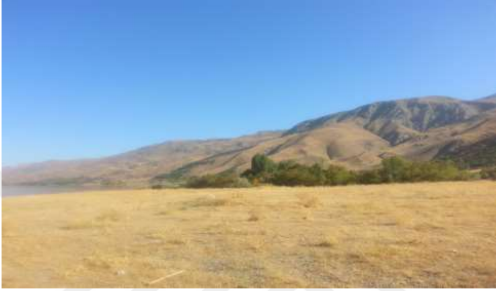
Resim 7: Hava sporları iniş pistine Sivrice'den bir örnek

Yamaç paraşütü, uygun hava koşullarında her mevsim yapılabilen bir spor olduğundan, spor turizmini yılın on iki ayına yayabilmesine imkan sağlamaktadır.