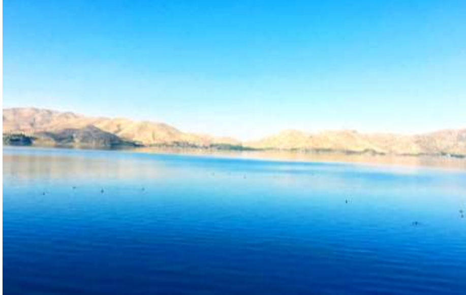
Resim 2. Hazar Gölü

Buna göre; ilçenin % 91,51'i okuryazar, %7,87'si okuma yazma bilmeyen, %0,62'si ise bilinmeyenlerden oluşmuştur.