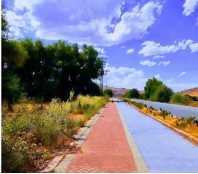
Resim 23: Bisiklet ve yürüyüş yoluna Sivrice'den bir örnek