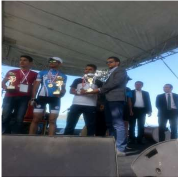
Resim 24: Sivrice Bisiklet Yarışması ödül töreni (2017)

Hazar Gölü çevresinde ve ilçe merkezindeki dağ yolunda çeşitli yarışmalar yapılmaktadır.