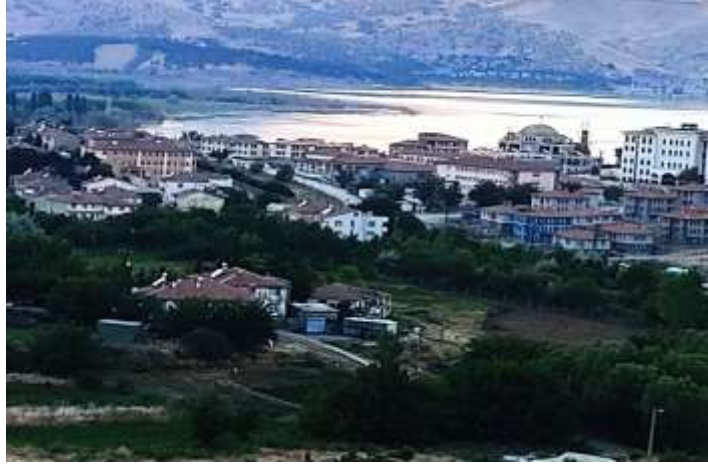
Resim 1: Sivrice ilçesi görüntüsü