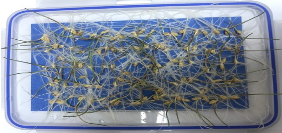
Şekil 3.6. Svevo buğdayının nem, sıcaklık ve ışık koşullarında çimlendirilmesi

Tohumların çimlenme analizi: Elekten geçirilmiş numuneleri hazırlanan ortamlarda istenilen nem, sıcaklık ve ışık koşullarında çimlendirilip (Şekil 7) % değerleri hesaplanmıştır. Bu analizler 100 danede 4 tekerrürlü ortalama alınmıştır.