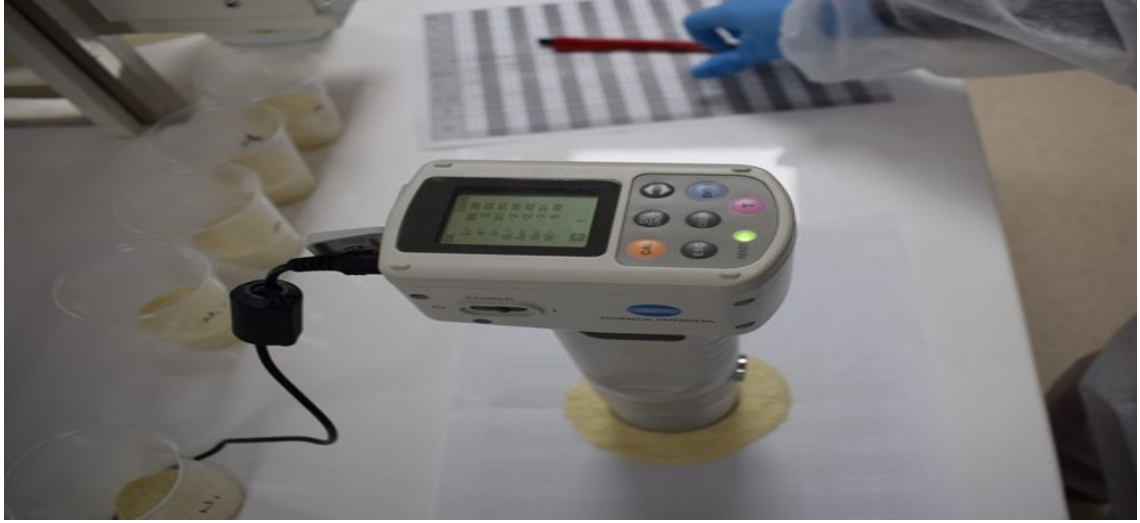
Şekil 3.5. Svevo buğdayının irmik renk tayini

Tohumların çimlenme analizi: Elekten geçirilmiş numuneleri hazırlanan ortamlarda istenilen nem, sıcaklık ve ışık koşullarında çimlendirilip (Şekil 7) % değerleri hesaplanmıştır. Bu analizler 100 danede 4 tekerrürlü ortalama alınmıştır.