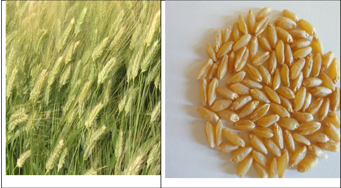
Şekil 3.1. Deneme kullanılan çeşide ait görseller

Bu çalışmada genetik materyal olarak ülkemizde yazlık dilimde yaygın olarak yetiştirilen Svevo makarnalık buğday çeşidi kullanılmış buğdayın bazı özellikleri Çizelge 3.1'de verilmiştir. İtalya orijinli makarnalık bir çeşit olan Svevo ( Triticum durum Desf.) 2001 yılında Tasaco Tarım tarafından tescil edilmiştir. Deneme için buğday sertifikalı tohumu bu firmadan temin edilmiştir. Başak yapısı (Şekil 1) kılçıklı, başak rengi beyaz, kılçık rengi beyaz, açık kahve renklidir. Dane dökmez ve harman olma kabiliyeti iyidir. Danesi uzun elips şeklinde, Koyu Sarı rengindedir (Şekil 2). Yüksek kalitede makarna yapımına elverişli, makarna sanayisinin gözdesidir. "Alternatif" gelişme tabiatlıdır. En önemli özelliği Erkenci olmasıdır. Svevo'nun kardeşlenmesi yüksektir. Yatmaya toleranslı ve destek sulamaya elverişlidir. Dekara atılacak tohumluk miktarı, mibzer ile ekimde 22-24 kg/da önerilir. Fazla tohum kullanıldığında kardeşlerindeki başakların boyu kısalmır.