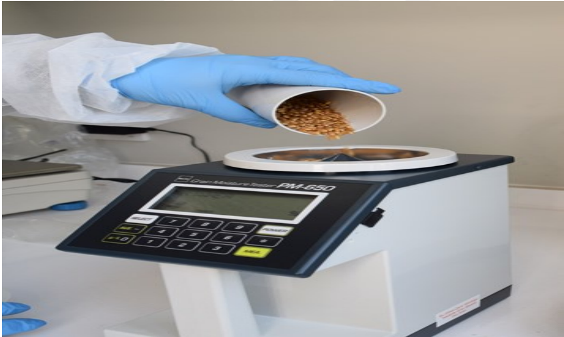
Şekil 3.2. Svevo buğdayının hektolitre ağırlığının belirlenmesi

Hektolitre Ağırlığı (kg/l): Her parselden alınan buğday örneklerinden, Kett-PM 650 marka-model cihaz ile 1 litrelik hektolitre aleti (Şekil 3.2.) kullanılarak 4 paralel olarak kg cinsinden hektolitre ağırlığı ve (%) olarak dane nemi ölçülmüştür (Uluöz 1965).