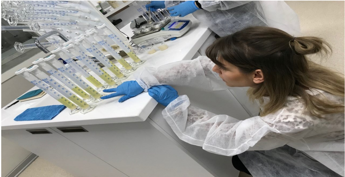
Şekil 3.4. Sedimentasyon tayini aşaması

Sedimentasyon değeri (ml): Sedimentasyon tayini (Şekil 3.4.) ICC-Standart No:116/1 metoduna göre (ICC, 2002) belirlenmiştir (TS EN ISO 5529 No'lu Standart).