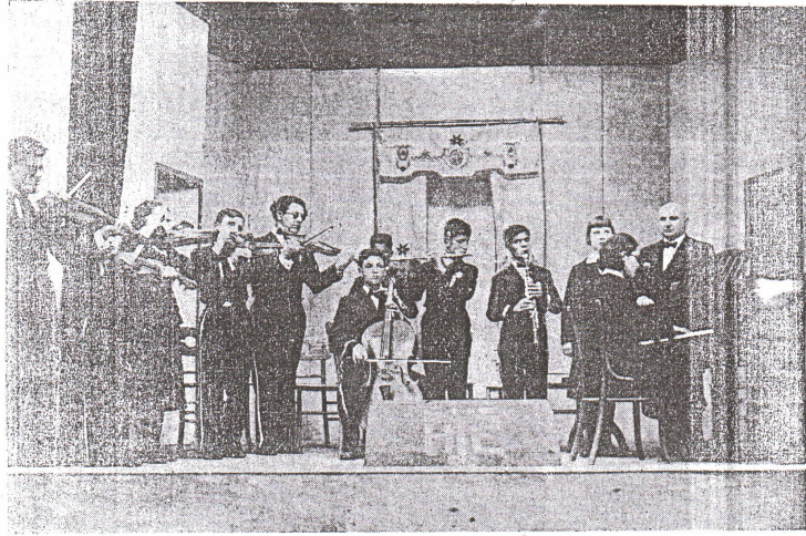
Sağır Dilsiz ve Körler Enstitüsü Orkestrası