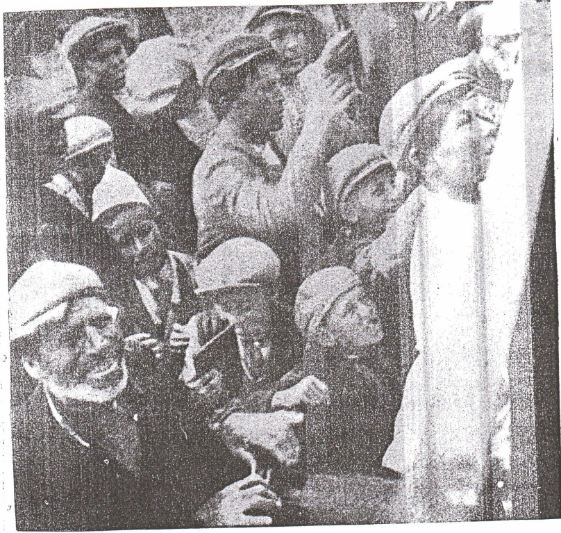
KİTAP İÇİN ORTA ANADOLU KÖYLÜSÜNÜN UZANAN ELLERİ VE GÜLEN YÜZLERİ

" Bu enstantane, 1933 yılında seyyar terbiye sergisinin Ankara - Samsun arasındaki küçük istasyonlardan birisinde halk okuma kitapları dağıtılırken çekilmiştir. "