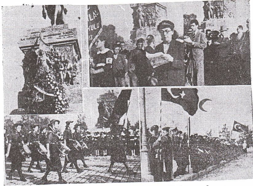
Kızılay haftası münasebetile gençliğin tezahurâtı