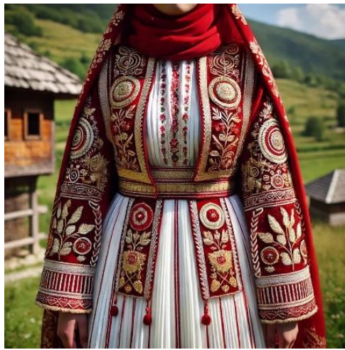
Şekil 12. Şehirli kosova gelinliği 25

Kosova'daki gelinlikler, tarihsel süreç içerisinde toplumsal ve kültürel değişimlere paralel olarak farklılıklar göstermiştir. 19. yüzyılın sonlarına doğru gelinlikler, köy ve şehir arasında farklılaşırken, şehirlerde batı etkilerinin artmasıyla birlikte farklar giderek daha belirgin hale gelmiştir. Geleneksel gelinlikler, yerel kumaşlardan yapılır, boyalı ipliklerle motifler işlenirdi. Gelinlik üstüne giyilen işlemeli kısa ceketler ve başörtüleri gibi unsurlar, gelinliklerin temel parçalarıydı. Ancak batı modasının etkisi, 19. yüzyılın sonlarından itibaren gelinliklerin tasarımını değiştirmeye başlamıştır. Özellikle şehirlerde, batıdan gelen yeni düğün kültürleri ve moda akımları nedeniyle geleneksel süsleme ve tasarımlarımdan uzaklaşmıştır. Kosova'daki şehirli gelinlerin tercihi, batı kültüründen ilham alınarak beyaz gelinlik olmuş ve bu renk, temizlik, saflık, yeni bir başlangıç olarak sembolize edilmiştir.