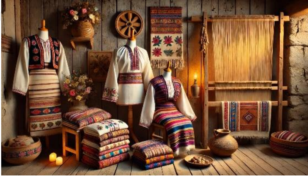
Şekil 14. Kosova'nın geleneksel pamuklu ürünleri 28

Şekil 14 te; Hasi ve Dukagjini bölgelerine özgü pamuklu kıyafetlerin görsel bir sunumunu yapmaktadır. Görselde Hasi'nin pastel tonları ve doğal motifleri, Dukagjini'nin ise canlı renkleri ve karmaşık geometrik desenleriyle harmanlanmıştır. Arka planda ise geleneksel bir dokuma tezgâhı ve diğer el işi detayları dikkat çekmektedir.