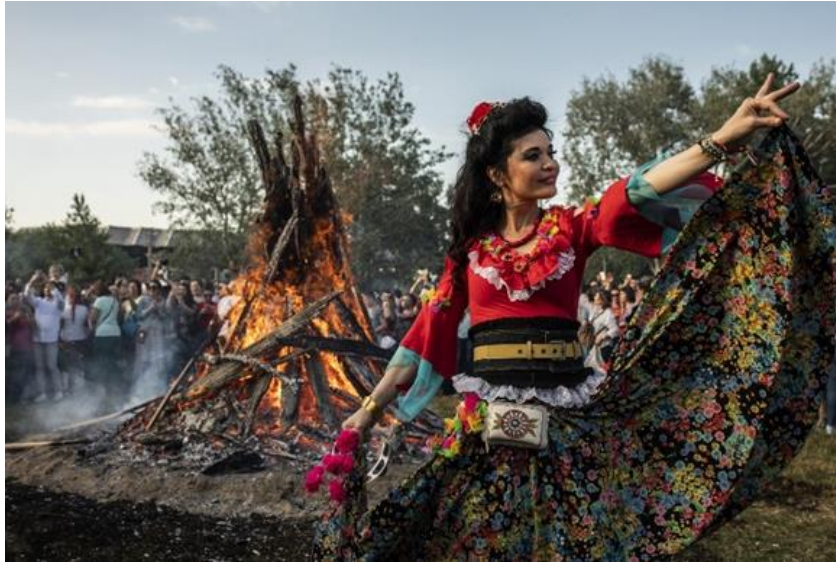
Şekil 26. Hıdırellez giysisi 52

Duren Festivali (Hıdırellez) de Goran topluluğunda, baharın gelişi ve yazın başlangıcını simgeler. Festivalde gençler, geleneksel kıyafetlerle daireler oluşturup dans eder, doğada çiçek ve bitki toplama gibi ritüeller gerçekleştirilir. Duren Festivali, baharın gelişini kutlayan özel bir etkinlik olduğu için Goran topluluğu bu festivalde geleneksel kıyafetlerini giyerek kültürel kimliklerini sergilemektedirler. Festivale katılan kadınlar, el yapımı Goran topluluğunun geleneksel kıyafetlerini giymektedirler. Kadınlar, genellikle ipek, keten ya da yün gibi doğal kumaşlardan yapılan işlemeli bluzlar ve desenli etekler tercih ederler. Başlarına, el işi çiçek motifleriyle süslenmiş örtüler ya da taçlar takarlar. Bel kısmında dokuma kemerler, ayaklarında ise el örgüsü yün çoraplar ve işlemeli deri ayakkabılar bulunur. Erkekler ise beyaz ya da açık renk gömleklerin üzerine koyu renkli yelekler veya ceketler giyer, başlarına fötr şapka veya bere takarlar. Bol kesimli pantolonlar ve deri çizmeler, erkek kıyafetlerini tamamlar. 51