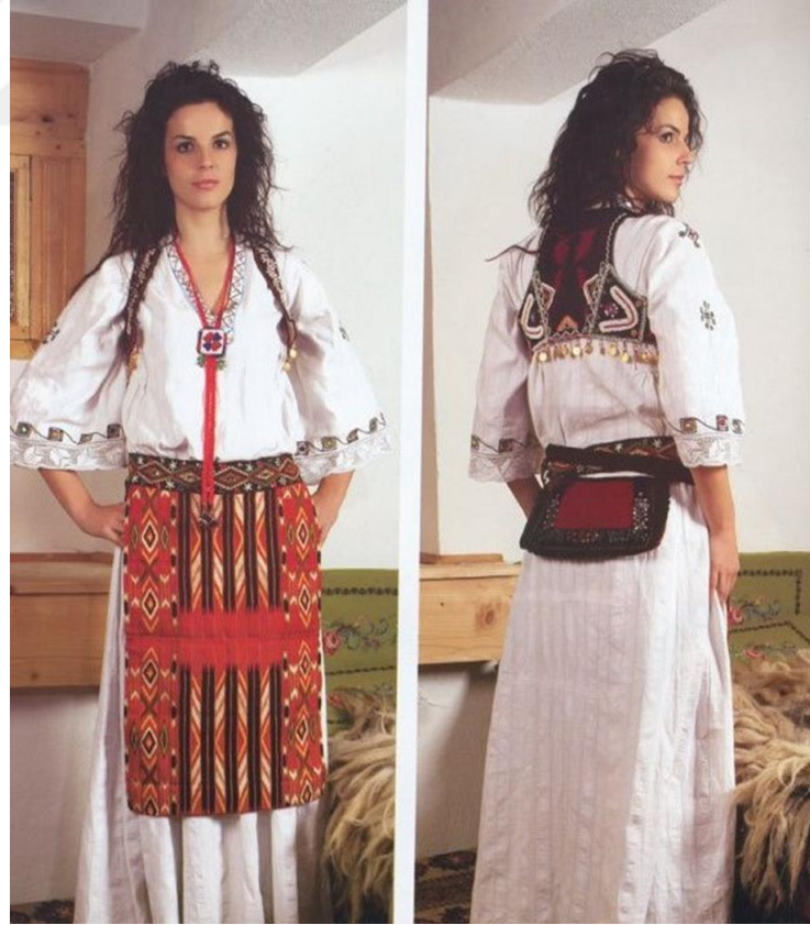
Şekil 3. Fistan ve çitollu 10

Fistan, düğünler ve özel kutlamalar gibi toplumsal etkinliklerdeki önemli yeriyile kültürel mirasın bir parçasıyken, çitollu daha günlük ve fonksiyonel bir giysi olarak yaşamın içinde yer almaktadır. Kumaş seçimleri, yerel üretim ve işçilikle şekillenen bu giysiler, geleneksel el sanatlarının korunmasına ve kadınların toplumdaki rollerinin vurgulanmasına katkıda bulunmaktadır. 9