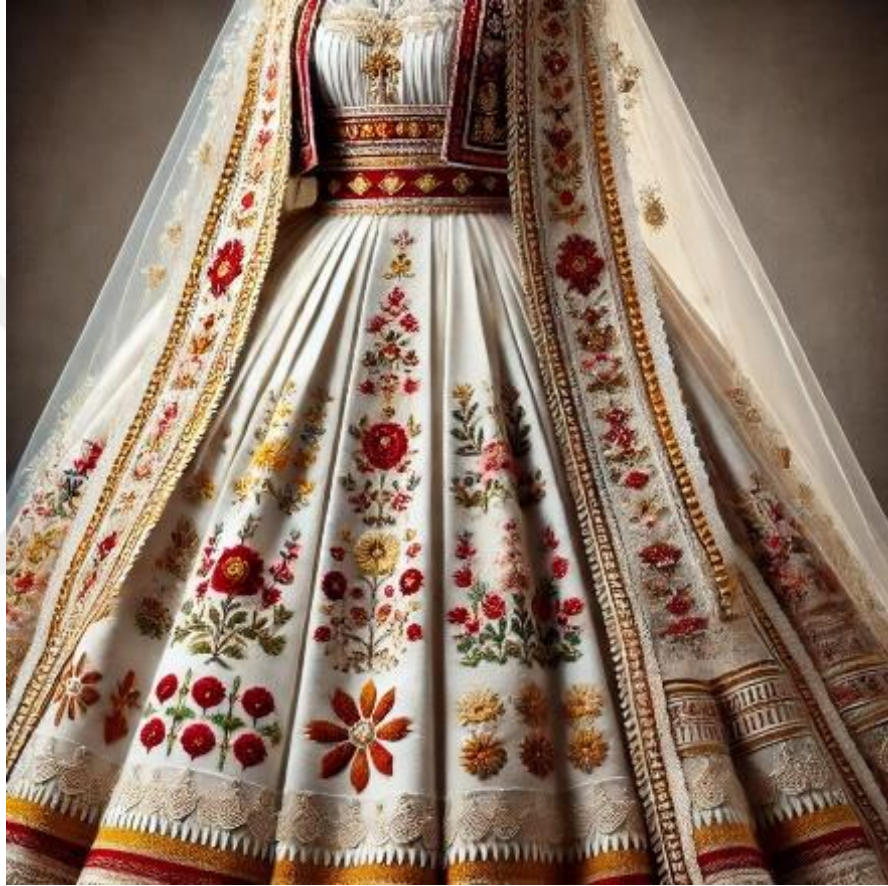
Şekil 8. Goran ve Boşnak köylerinde tercih edilen geleneksel gelinlik 18

Şekil 8 de renkli ipliklerle işlenmiş çiçek motifler içeren geleneksel gelinlik gösterilmektedir. İşlemelerin çokluğu ve renkliliği dikkat çekmektedir.