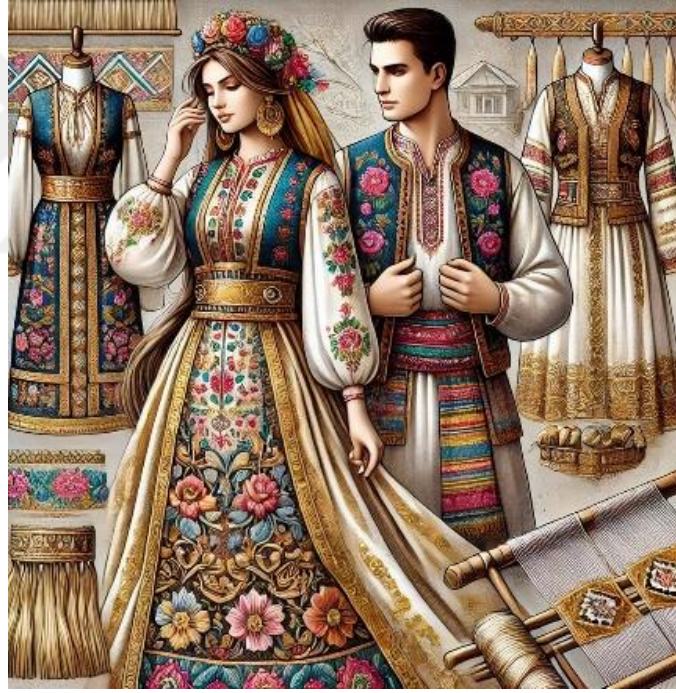
Şekil 15. Kosova'nın Geleneksel Kıyafetleri ve İpek Kumaş Kullanımı

Günümüzde geleneksel Kosova kıyafetlerinde, modernleşme ile birlikte azalmış olsa da, özel günlerde hala ipek kıyafetlerin kullanıldığı görülmektedir. Özellikle düğünlerde ve halk danslarında kullanılan geleneksel kıyafetlerde ipek, hem tarihi bir miras hem de kültürel bir sembol olarak varlığını sürdürmektedir. Kosova’da ipeğin statü göstergesi olarak kullanımı, Osmanlı İmparatorluğu’nun diğer bölgelerindeki uygulamalarla paralellik göstermektedir. Ancak, Kosova'nın kültürel dokusunda farklı etnik grupların etkisiyle ipeğin kullanımı ve anlamı, bölgesel farklılıklar taşımaktadır. Örneğin: Arnavut kökenli geleneksel giysilerde ipek, daha çok parlak ve gösterişli renklerle öne çıkar. Türk etkisinde ise daha zarif ve desenli ipek kumaşlar tercih edilmiştir.