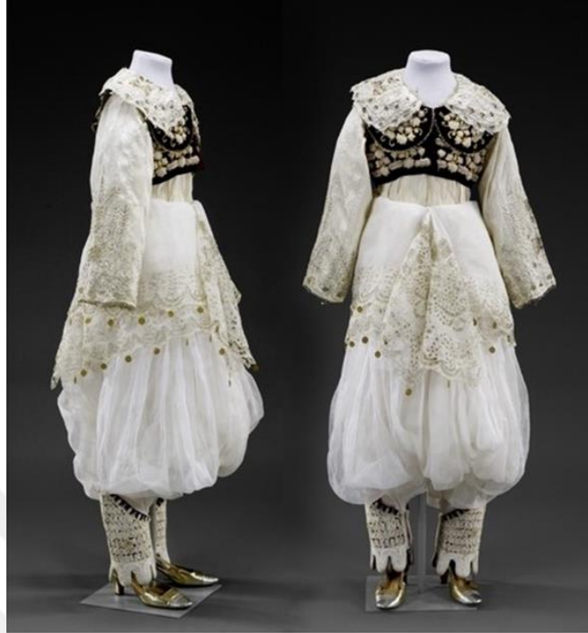
Şekil 4. Alman Müzesinde Yer Alan Dimija Geleneksel Kıyafeti 11