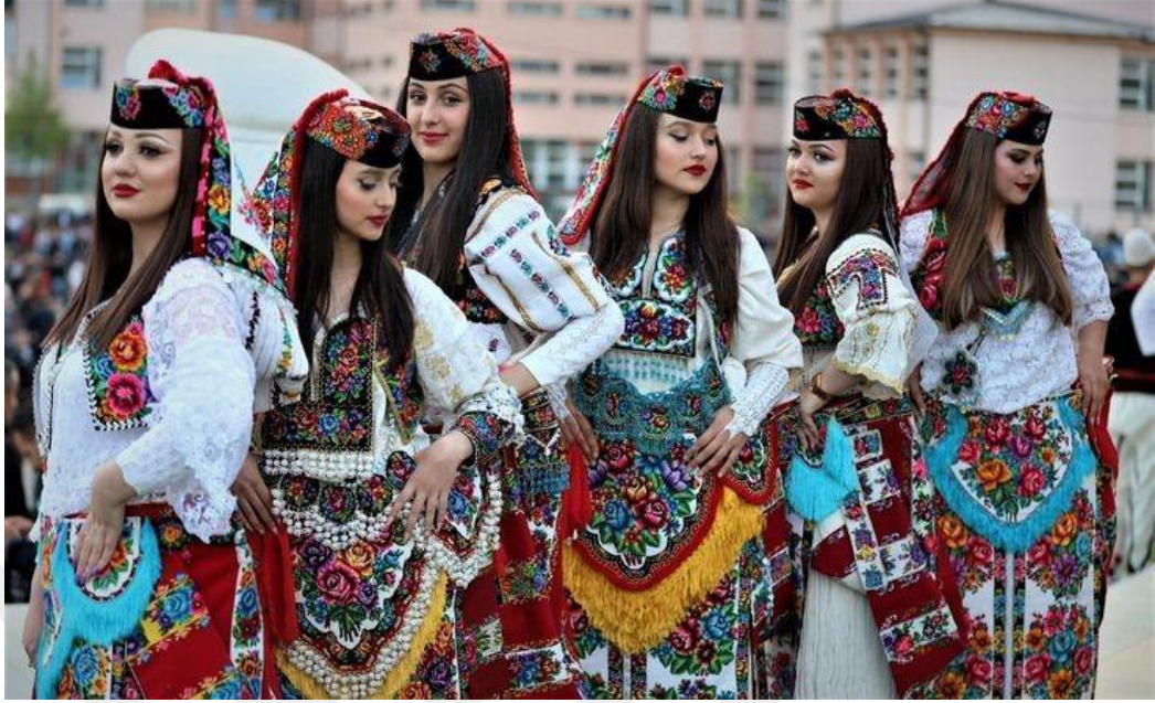
Şekil 22. Has bölgesinden Arnavut kadınlar ve yöresel giysileri 43