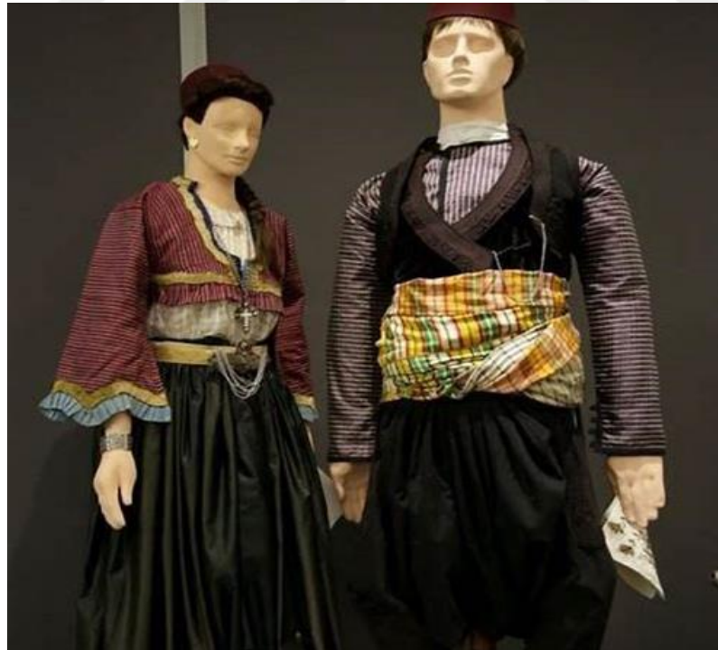
Şekil 5. Kosova'nın geleneksel kırsal giyimi; Tırq 13

Kosova'nın çeşitli köylerinde, farklı stil ve desenlerde tırq üretimleri yapılmaktadır. Bu durumda, her bölgenin giyim kültürünün özgünlüğünü ve yerel el işçiliğinin zenginliğini göstermektedir. 12