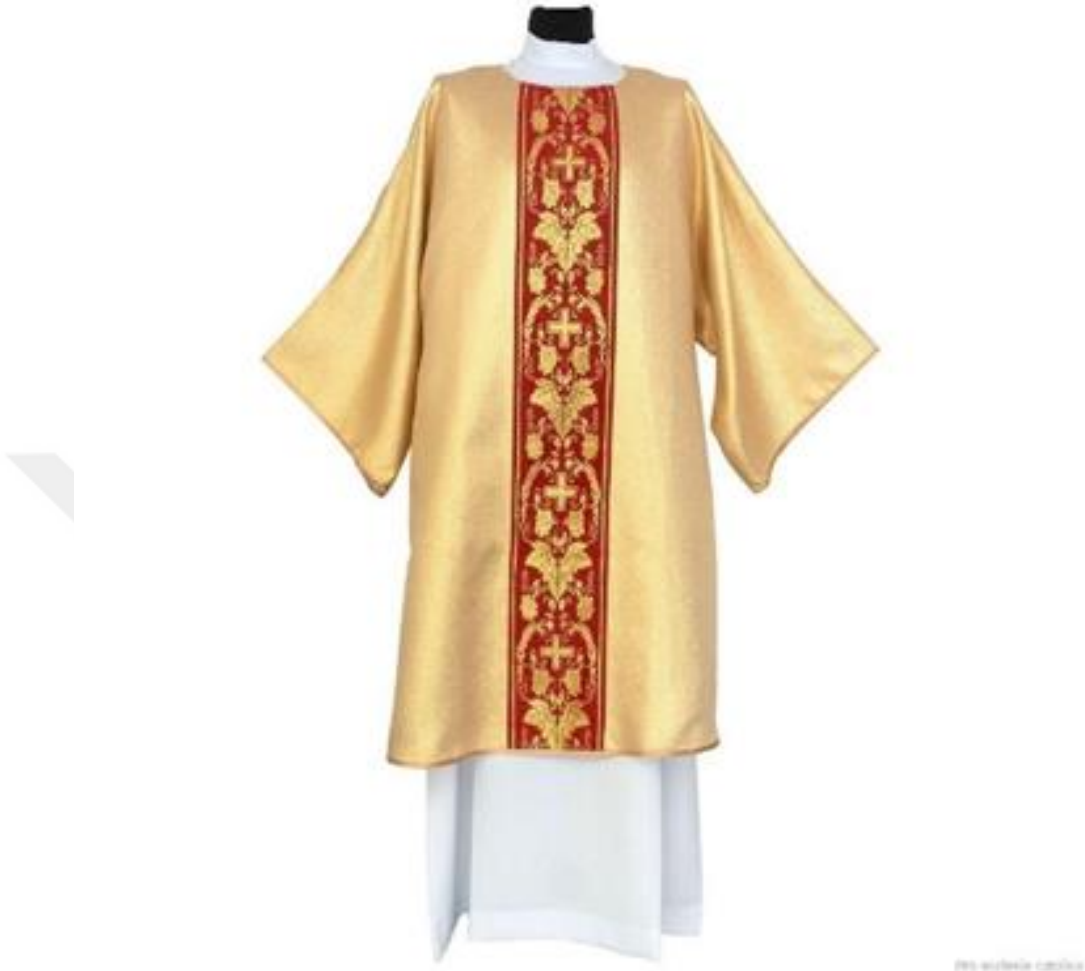
Şekil 21. Dalmatika 42

Arnavut halk giyimleri, kadınlar ve erkekler için farklı parçalar ve unsurlar içeren geniş bir mozaikten oluşur. Bu giyimler, zamanla, mevsimlere, ailelerin duygusal durumlarına (düğün, ölüm, kutlamalar vb.), dini ve ulusal bayramlara göre değişir. Ayrıca, farklı etnografik bölgelere göre de çeşitlenir. Ancak, dini inançlara dayalı farklılıklar neredeyse yoktur ve özellikle erkeklerin dini giyimleri arasında belirgin bir fark bulunmaz. Kadınlar arasında, özellikle Hasi bölgesinde, Katolik inancına sahip Zymi köylerindeki kadınlar, İslam inancına sahip Zymi köylerindeki kadınlardan farklı giyinirler.