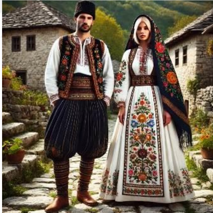
Şekil 25. Geleneksel Sırp giysileri 50

Goranların kıyafetleri, kültürel unsurlar açısından Opoja, Luma ve Tetova gibi bölgelerle ortak özellikler taşımaktadır. Bu benzerlik, Goran kıyafetlerinin Arnavut kültüründen öğeler barındırdığını göstermektedir. Özellikle kıyafetlerin şekil ve içerik bakımından bu bölgelerle aynı olması, Goran kıyafetlerinin kültürel bir etkileşim sonucu oluştuğunu düşündürmektedir. Kosova'daki Gora bölgesinde yaşayan Goran topluluğu, Slav kökenli bir etnik grup olarak tanınır ve kültürel miraslarının korunması konusunda önemli bir mücadele vermektedir. Goranlar, kendi dillerini (Nashinski) ve kültürel kimliklerini, özellikle geleneksel etkinlikler ve ritüellerle yaşatmaya çalışmaktadırlar. Ancak bu kimlik zaman içinde Bulgarlar, Makedonlar ve Sırlar gibi diğer gruplar tarafından asimile edilmeye çalışılmıştır. 49