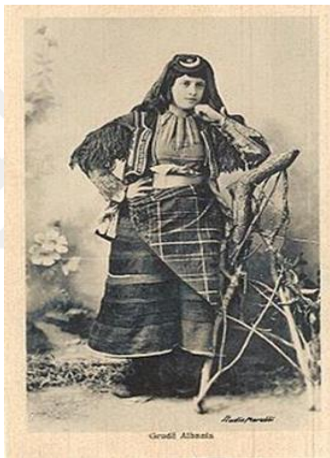
Şekil 20. 19. Yüzyıldan kalma Pietro Marubi fotoğrafında Xhubleta giyen Grudë'li kadın 40

Yeni bir hayatın başlangıcını simgeleyen bu kıyafetler, gelinin sosyal statüsünü ve ailesinin itibarını ifade etmektedir. Arnavut kadınlarının sadeleşmiş yas giysileri bile bir mesaj taşımaktadır. Süslü giysi parçalarının ters giyilmesi ya da abartısız bir örtü, hüznün sessiz bir ifadesidir. Yas giysilerindeki sadeleşme, kıyafetin anlamını ve derinliğini asla kaybettirmez, aksine, hüznüle yoğrulmuş bir asalet sunmaktadır. 39