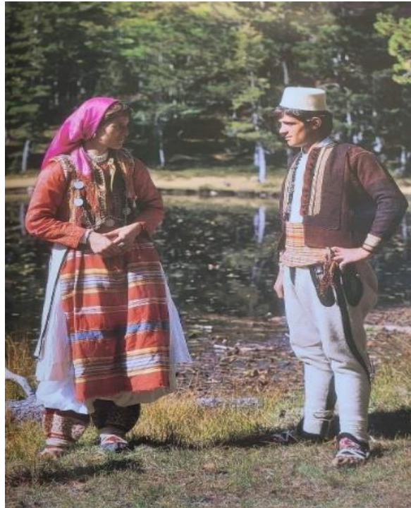
Şekil 11. Şehir estetiğine sahip kosova'nın geleneksel giyimleri 23

Erkeklerin şehirde en kullandığı geleneksel giysi kombini, gömlek, beyaz şalvar ve kısa ceket den oluşmuştur. Özellikle şalvarlar, hem rahatlık hem de şıklığı bir arada sunar, genellikle yün veya ipek karışımı kumaşlardan dokunmuştur. Giysiler, başa giyilen başlık, fes ve kasket gibi aksesuarlarla tamamlanırken, ayaklarda deri ayakkabılar yer almıştır.