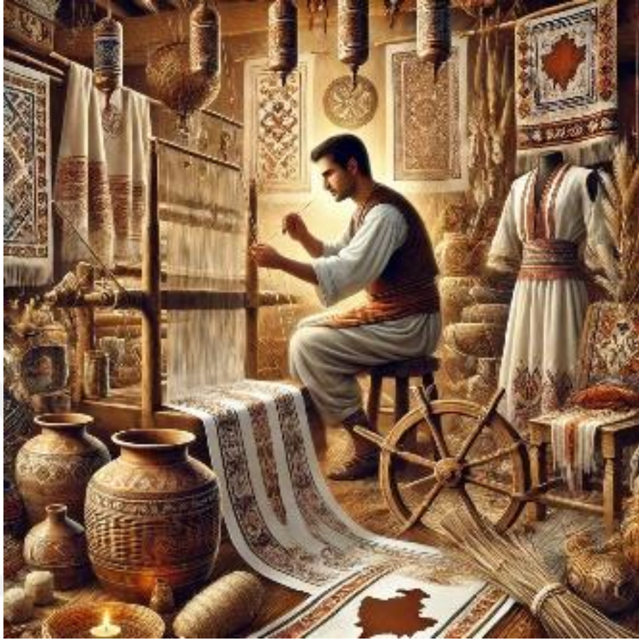
Şekil 18. Geleneksel el dokuma süreci ve ketenden olma ürünler. 35