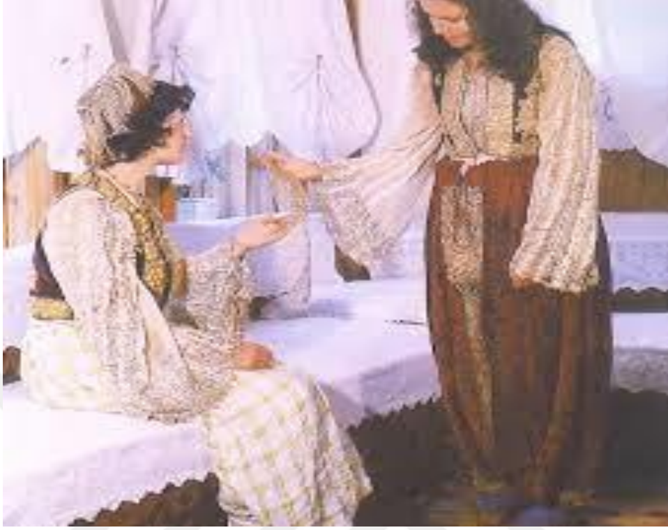
Şekil 9. XIX.'da kasabalarda sık görülen kadın giyimleri 20

Şehirli kadınların giysileri, geleneksel gajtan ve dantel süslemeleri ile geleneksel dünyanın zarif hatlarını modern şehir hayatına taşımaktadır. Şehir giysilerindeki ince işçilik ve motifler, yüzyılların birikimini ve kültürel çeşitliliği yansıtmaktadır. Şehirli Kosova kadınlarının elbiselerindeki motifler de birer kültür mirasıdır. Özellikle çiçek desenleri, halkın geçmişten gelen bağlılıklarını ve doğaya olan derin sevgisini yansıtmaktadır. Bu desenler, eteklerden yakalara, başörtülerinden kemerlere kadar her alanda kullanılmaktaydı.