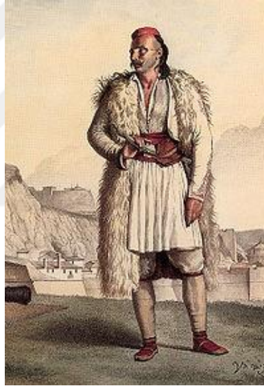
Şekil 19. Louis Dupré imzalı Fustanella giyen bir Souliote savaşçısı. 37

Uzun gömlekler ve tirq gibi detaylar ise, hem Orta Çağ'dan miras kalan etkileri hem de Doğu ve Bizans esintilerini barındırır. Savaşçı bir ruhu çağrıştıran süslemelerle bezenmiş gümüş takılar, Arnavut erkeğinin zarafeti kadar cesaretini de gözler önüne sermektedir. Süslenen her yelek, her xhamadan, günlük yaşamın zarafetine dokunan ince bir detay olarak bilinmektedir. 36 Çocuklar için olan modellerde, siyah ya da kırmızı yünden yapılan ponponlarla süslemeler kullanılmıştır.