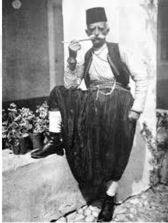
Şekil 16. Podgur bölgesine ait yöresel yünlü kıyafetler 31

Bu süreç, geleneksel zanaatkarlık bilgisini koruma ve sonraki nesillere aktarma çabalarının bir parçasıdır.