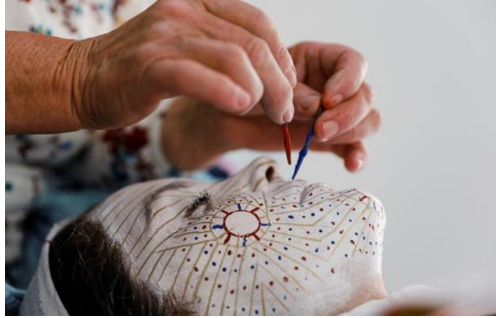
Şekil 23. Geleneksel gelin makyajı 46

Gelin, tören sırasında baştan ayağa geleneksel Boşnak kıyafetleriyle süslenir. Yüzü beyaz bir boya ile kaplanır ve altın, kırmızı, mavi gibi renklerle desenler eklenir (şekil 23). Bu yüz boyamaları sadece estetik bir görünüm yaratmakla kalmaz, aynı zamanda mutluluk, sevgi, uyum ve bereket gibi değerleri sembolize etmektedir. Yüz boyama ritüeli, pagan dönemden kalma eski bir gelenektir. Gelin bu süre boyunca gözlerini açamaz, konuşamaz veya bir şey yiyip içemez. Tören sırasında canlı müzik (genelde davullar) eşliğinde dans edilir. Bu müzikler, düğünün hem eğlenceli hem de ritüelistik yönünü ortaya koymaktadır.