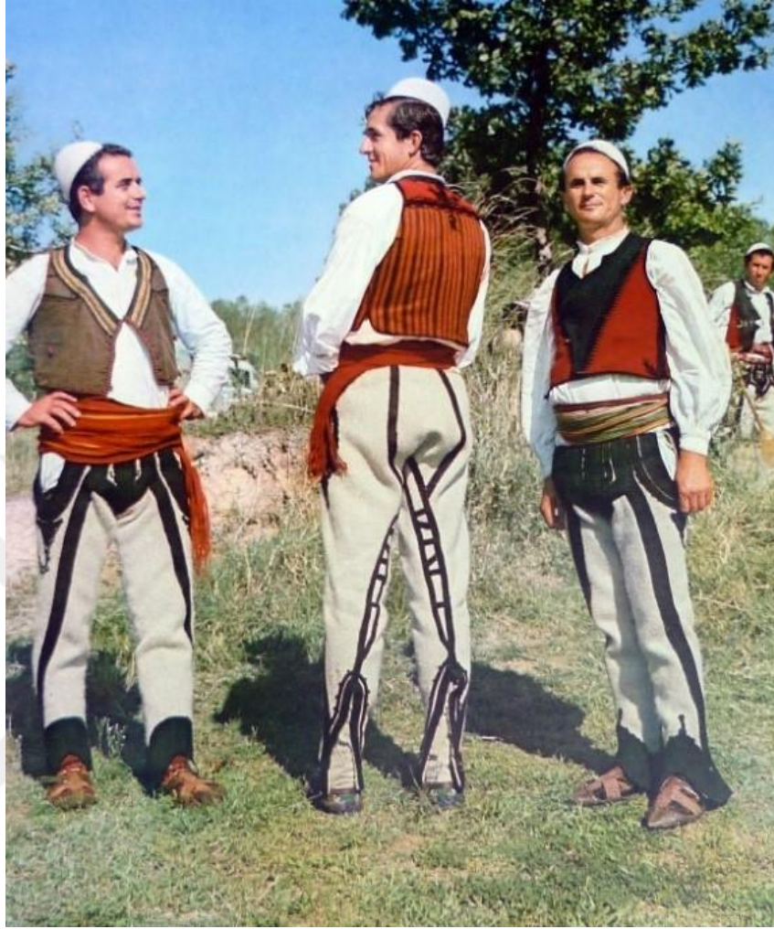
Şekil 6. Xhamadan ve mintan 15

Japanxhe, uzun bir pelerin görünümündedir. Özellikle soğuk kış günlerinde, bir koruyucu katman olarak tercih edilmektedir.