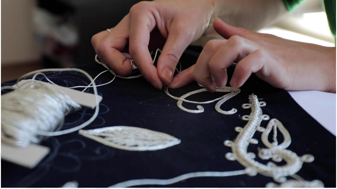
Şekil 27. Geleneksel giysi olan Dimija'nın nakış işlemesi 55