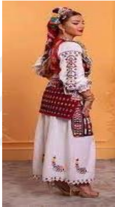
Şekil 2. Kadın giyim kömbe ve etekli 8

beyaz ve siyah gibi renklerin kültürel sembolizmi de bu giysinin tasarımında kendini göstermektedir. Kırmızı hayatı ve enerjiyi, beyaz saflığı, siyah ise olgunluğu sembolize etmektedir. Yerel dokuma tezgâhlarında hazırlanan bu giysiler, bir zanaatkârlık ürünüdür. Gündelik hayatta olduğu kadar düğün, bayram gibi kutlamalarda da yer bulan mbështjellakë, Kosova'nın kırsal yaşamındaki kadınların kimliğini ve kültürel bağlılığını temsil etmektedir. 7