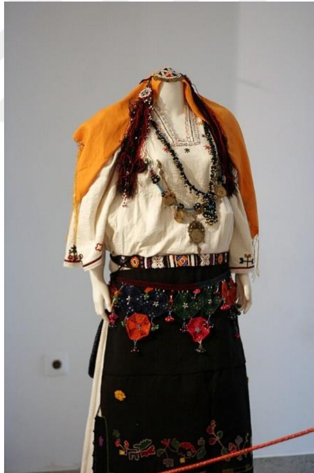
Şekil 17. Kosova'nın geleneksel yün iplikle işlenmiş kıyafetler (Kadın) 33

Sonuç olarak, yünlü kumaşlar Kosova'nın geleneksel kıyafetlerinde yalnızca bir malzeme değil, halkın yaşam tarzını, tarihini ve kültürel değerlerini yansıtan bir sembol olmuştur. Bu kumaşların bölgesel farkları ve kültürel anlamları, Kosova'nın zengin tekstil geleneğini ortaya koymaktadır. 32