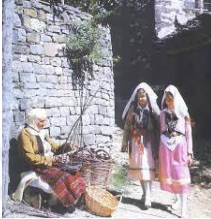
Şekil 10. Kosova'nın eski şehir sokaklarında kadın giyimi 22

Kosova'nın şehirlerinde 19. yüzyıl boyunca kadın giyimi, geleneksel dokularla harmanlanmış yenilikçi bir stilin izleri görülürken, zamanla geleneksel kumaşlar yerini yavaşça yabancı dokumalara bırakmıştır.