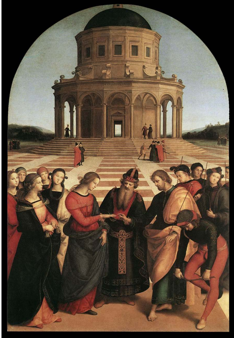
Resim 3.1.2.a.b. .... Raphaello Meryemin Evlenmesi