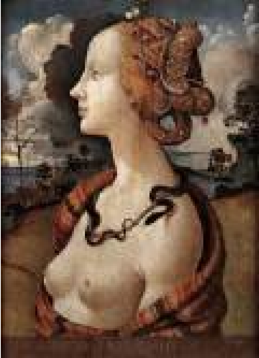
Resim 4.3.5.a. .... Piero diCosimo Simone Vespucci'nin Portresi, 1480 Panel üzerine yağlıboya , 57x 42 cm. Musée Condé, Chantilly