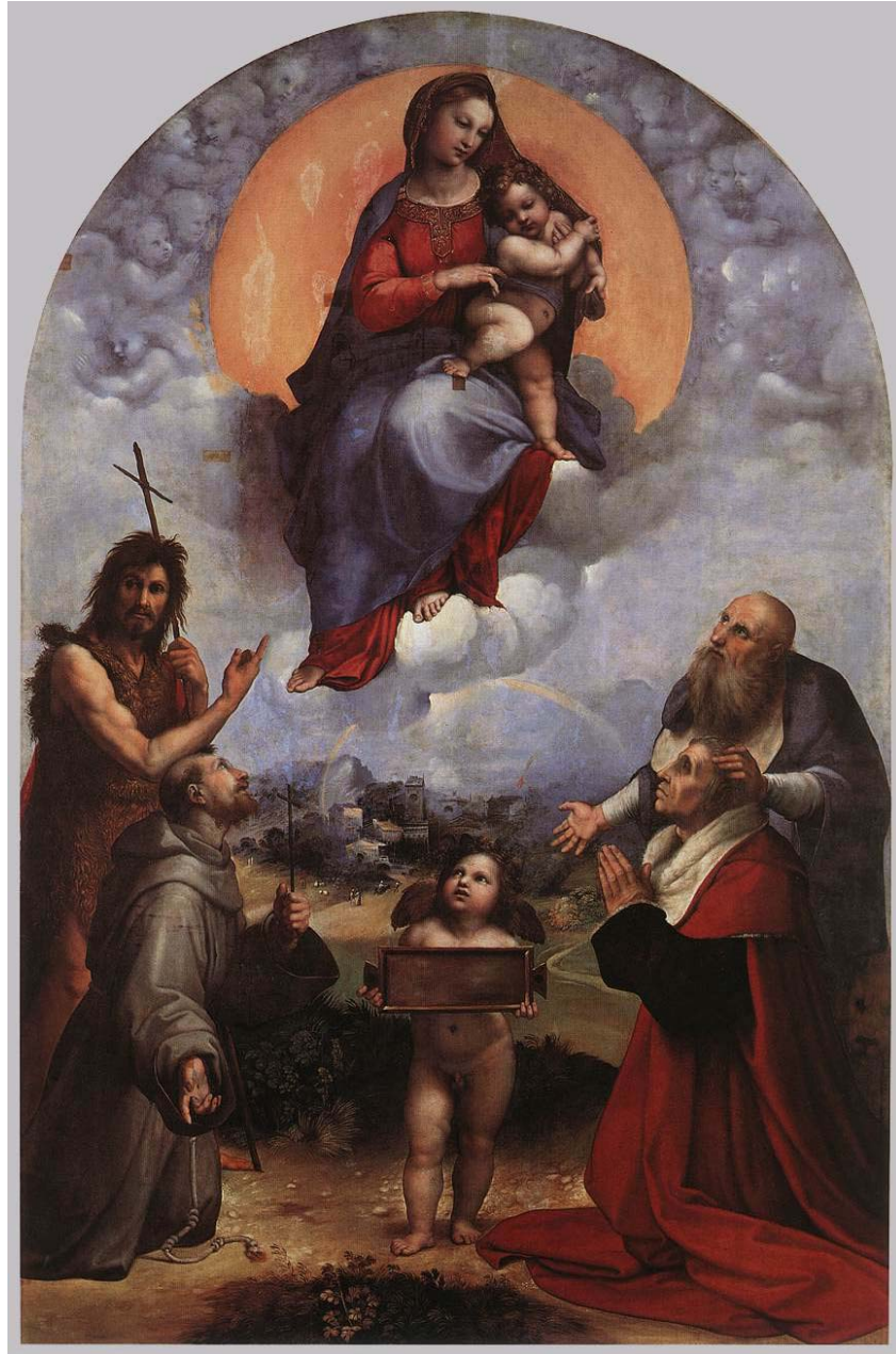
Resim 3.3.1.a. .... Raphaello Madonna di Foligno, 1512 Tual üzerine yağlıboya 320x 194 cm Rome, Pinacoteca Vaticana