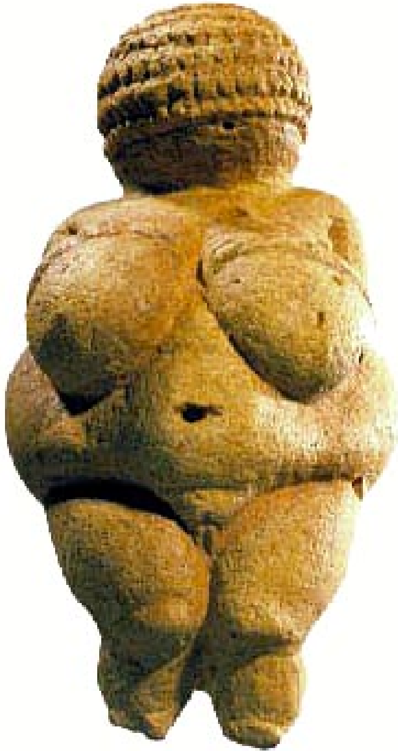
Resim 2.1.a. Willendorf Venüsü