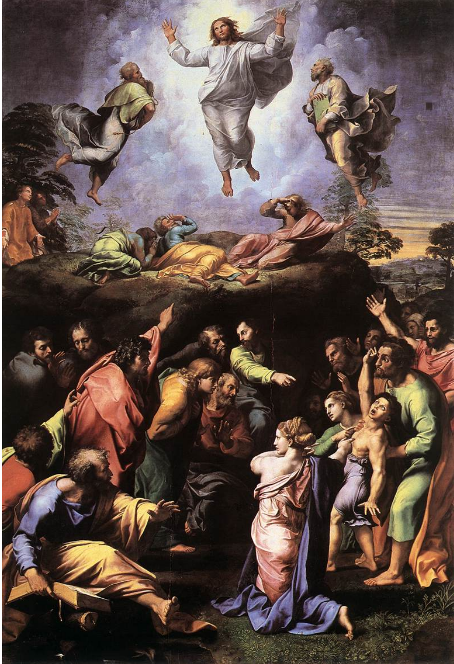
Resim 3.1.3.a..... Raffaello The Transfiguration, 1517–1520 Tual üzerine yağlıboya, 405x 278 cm Pinacoteca Vaticana

'Bakire Meryem'in ölümü' (1486–1490) resminde sanatçı Meryem'i bulutların üzerinde İsa ona kucak açarken gösterir.