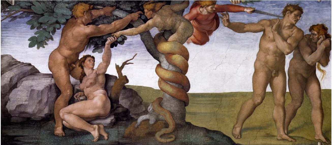
Resim 3.1.1.a. .... Michelangelo Adem ve Havva'nın cennetten kovuluşu 1509-1510 Fresco, 208x 270 cm. Sistine Chapel, Vatican

Bu süreç Neoplatoncu baktığımızda iyiye doğru giden yolun ilk adımındır. Kötü; bize gelişme ve değişme imkânı sunduğu için iyinin yavanlığından ve kandırıcılığından daha iyidir.