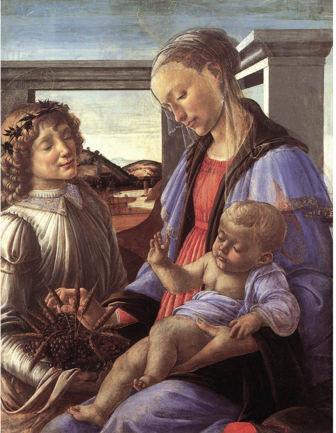
Resim 3.1.2.a.a. .... Botticelli Meryem ve Çocuk İsa bir mekle, 1470 Ahşap üzerine tempera, 85x 64,5 cm Boston (MA), İsabella Stewart Gardner Museum