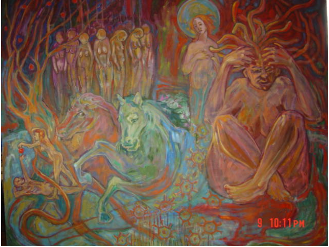
Resim 5.1.c. 'isimsiz' 150x140 cm Tual üzerine yağlıboya