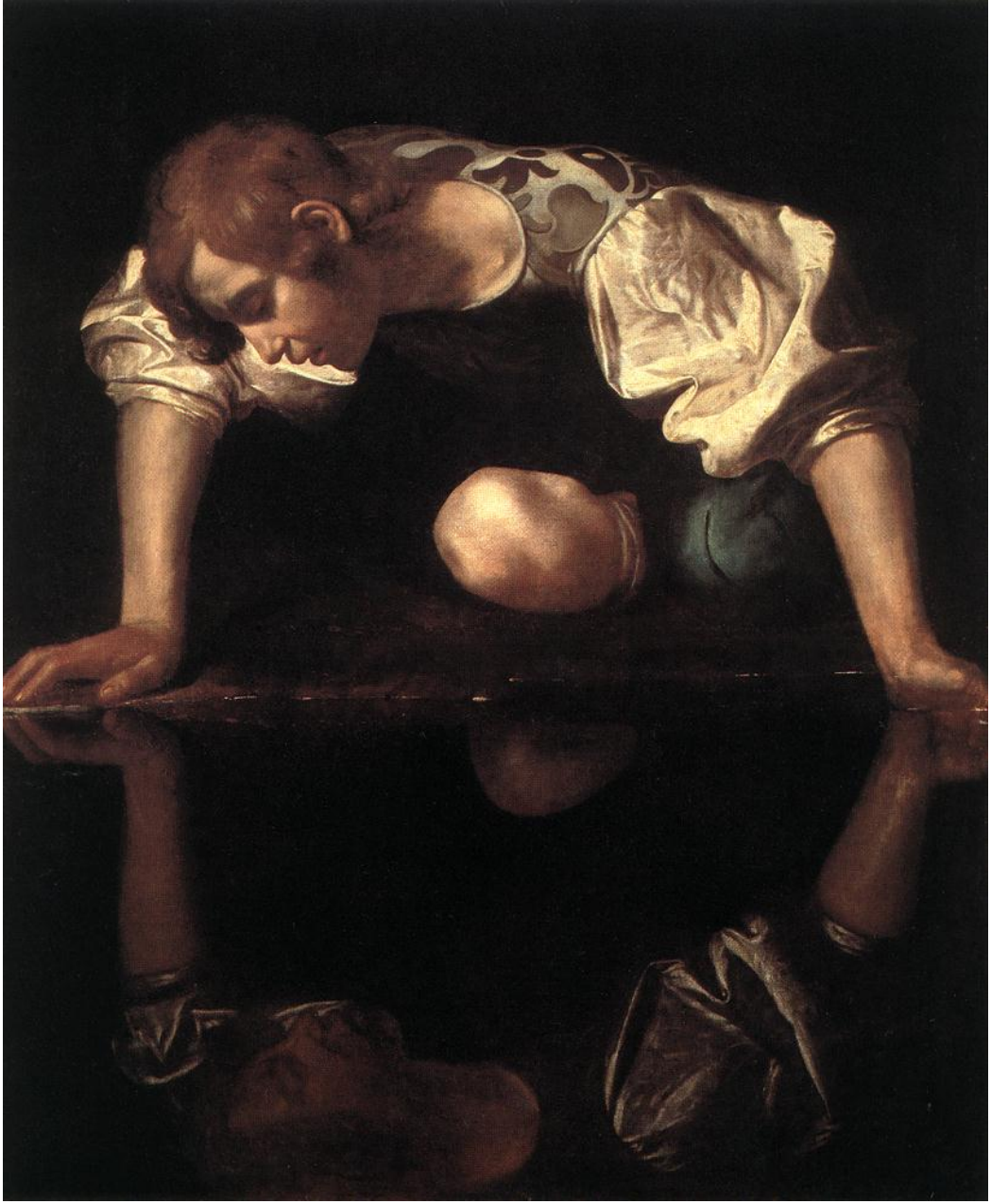
Resim 3.2.a.a. .... Caravaggio Narcissus, 1598-1599 Tual üzerine yağlıboya, 122x 92 cm Rome, Galleria Nazionale d'Arte Antica, Pallazzo Corsini