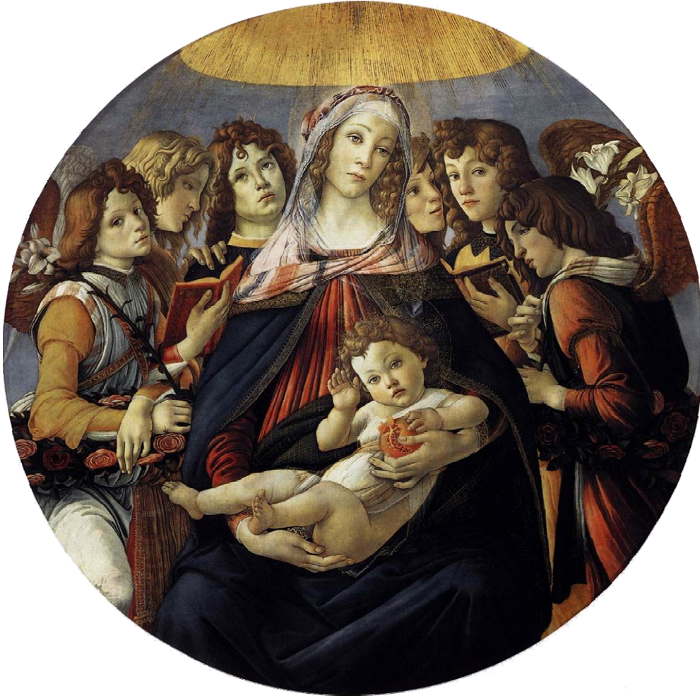
Resim 4.6.2.a. .... Botticelli Meryem ve Çocuk İsa altı Melekle, 1485 Ahşap üzerine tempera, 143,5 cm çap Florence, Galleria degli Uffizi

Kteis'ten doğuş, yumurtanın deniz bağlantılı görüşüne yakın olduğu kabul edilmektedir.