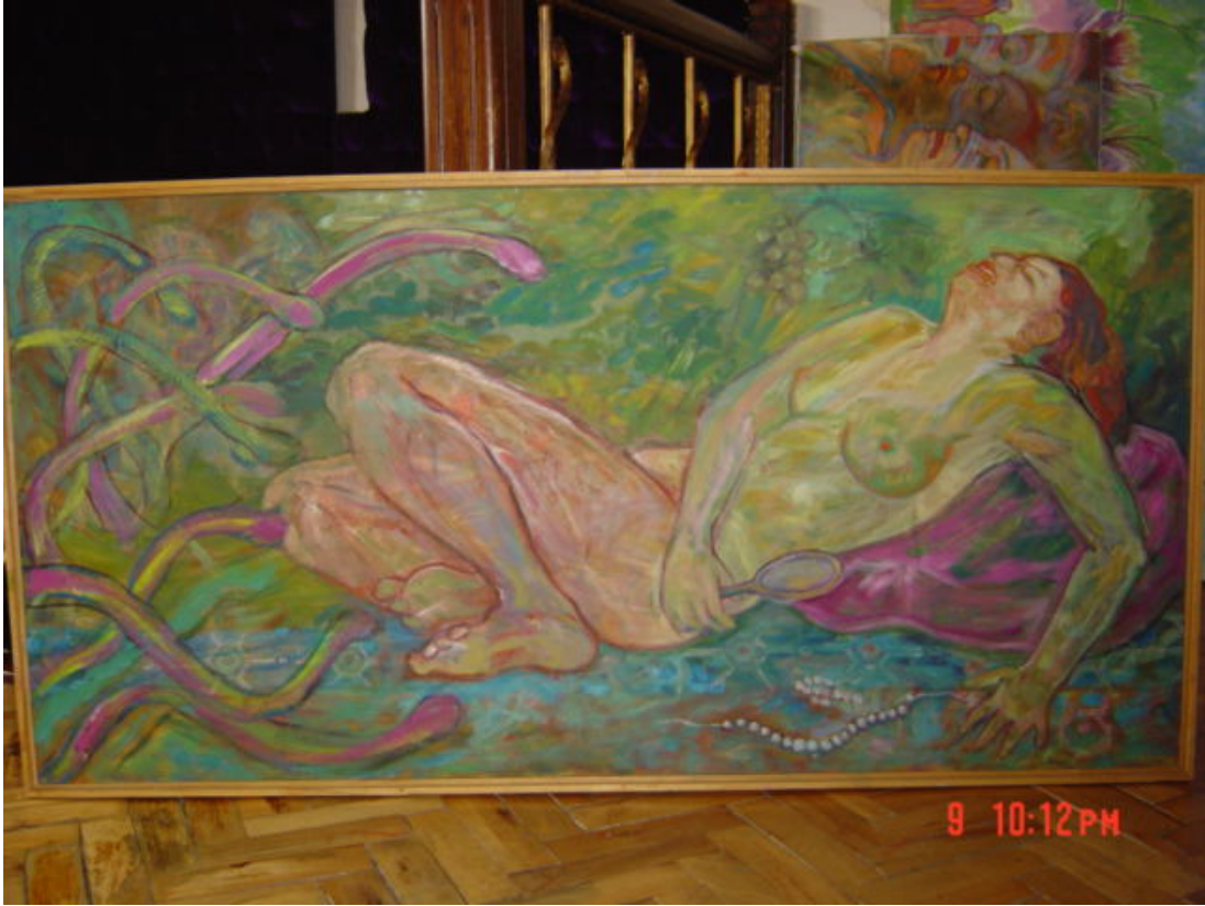
Resim 5.1.b İsimsiz 60x100 cm