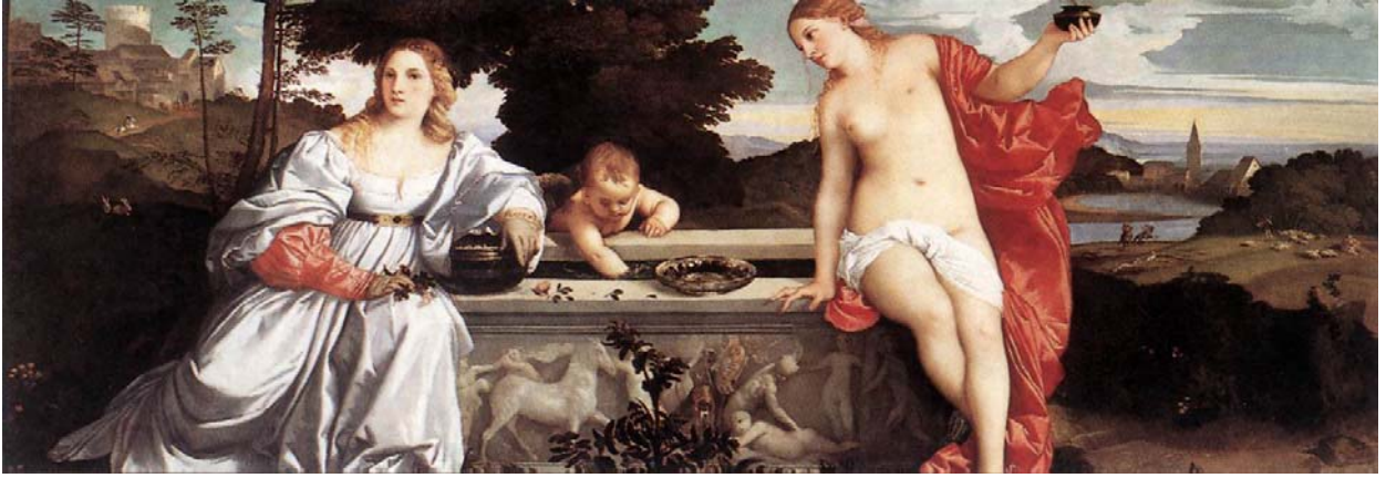
Resim 4.2.1.a. .... Tiziano Kutsal ve Dünyevi Aşk Galleria Borgese, Rome

Botticelli'nin Afrodit'i Bahar Alegorisi'nde arkasında yarım ay biçiminde bir çerçeve ile adeta hale oluşturduğu formu bu sefer de Raphael'in başka bir Meryem çalışmasında görüyoruz. Meryem kucığında bebek İsa ile gökyüzünde büyük bir sarı hale ortasında oturmaktadır. Burada Meryem adeta eski kült Tanrıçaları gibi gökyüzünde bir tahtta oturur gibi resmedilmiştir