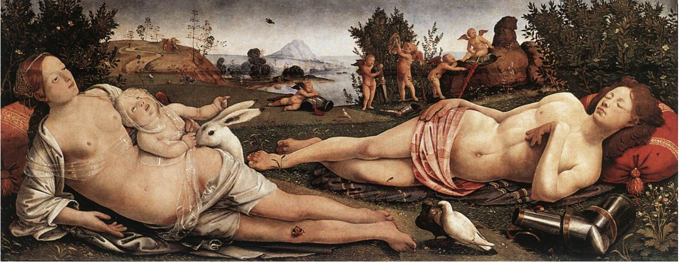
Resim 3.1.2.c. .... Piero di Cosimo Venus ve Mars, 1498 Ahşap üzerine yağlıboya, 72x 182 cm London, National Gallery

Parmenides'in şiirinde Tanrıça Ticke ve onun karşıt imgesi isimsiz tanrıça ile birlikte ana tanrıçanın yeni yansıyan iki yönlülüğü açığa çıkar. Ticke'nin kendisi mükemmel adalettir, arı varlıktır, bir tek o arı düşünceye açılır.. Arı varlıkta oluş olmadığı için, yani oluş varlık olmadığı için, Ticke bunu dışlar ve acımasızca var olmayanın yanına atar. Oluş için kaygılanan isimsiz tanrıça, kişiselleştirilmiş istikrarsızlıktır. Göğe yükseliş, bir zamanlar toprak ananın tahttan indirilişiyle başlayan aklın maddeden koparılışının hiyeroglifidir ve dişil olanın iki tipidir. Ekhidna'nın güzel yüzlü genç kız tarafı ya da tanrıça Ticke; diğer tarafı da yerde sürünen yılan bedeni yada doğanın isimsiz tanrıçası. Bir yanda logosa tümüyle itaat eden evcilleştirilmiş yan bir yanda da pençesine düşülmemesi gereken logos düşmanı güç. Afrodit'in oğlu Hermafrodit, kadın göğüslü uzun sakallı bir delikanlı idi. Sakallı kadın Androjen ise Helenlik öncesi bir kabilenin ataerkilliğe geçişte yargı erkini korumak isteyen ana kraliçesidir.