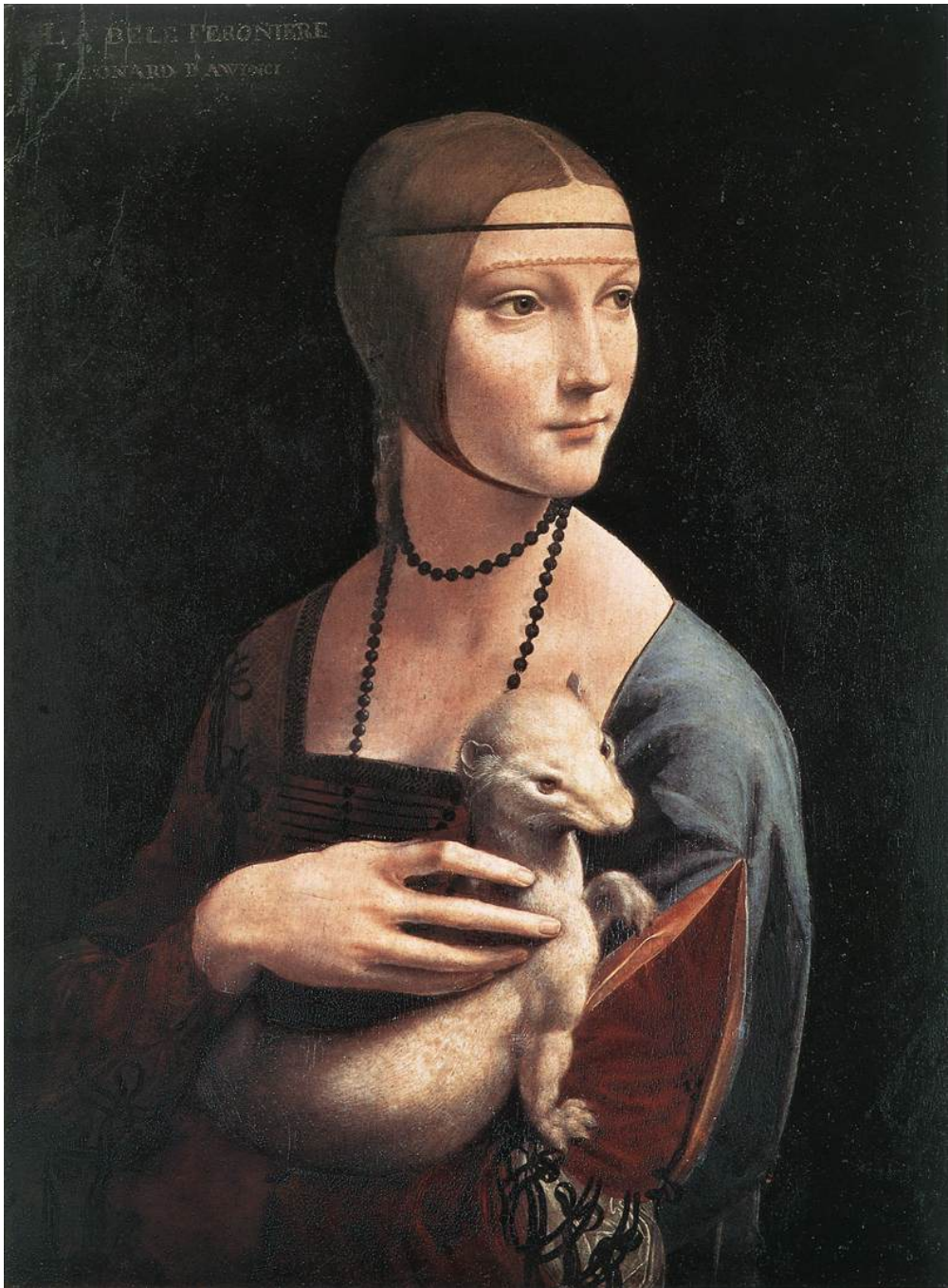
Resim 4.3.a. .... Leonardo da Vinci Cecilia Gallerani (Erminli Kadın) 1490 dolayları Ahşap üzerine yağlıboya 54,5x 40,3 cm. Czartorychi Muzeum, Krakov