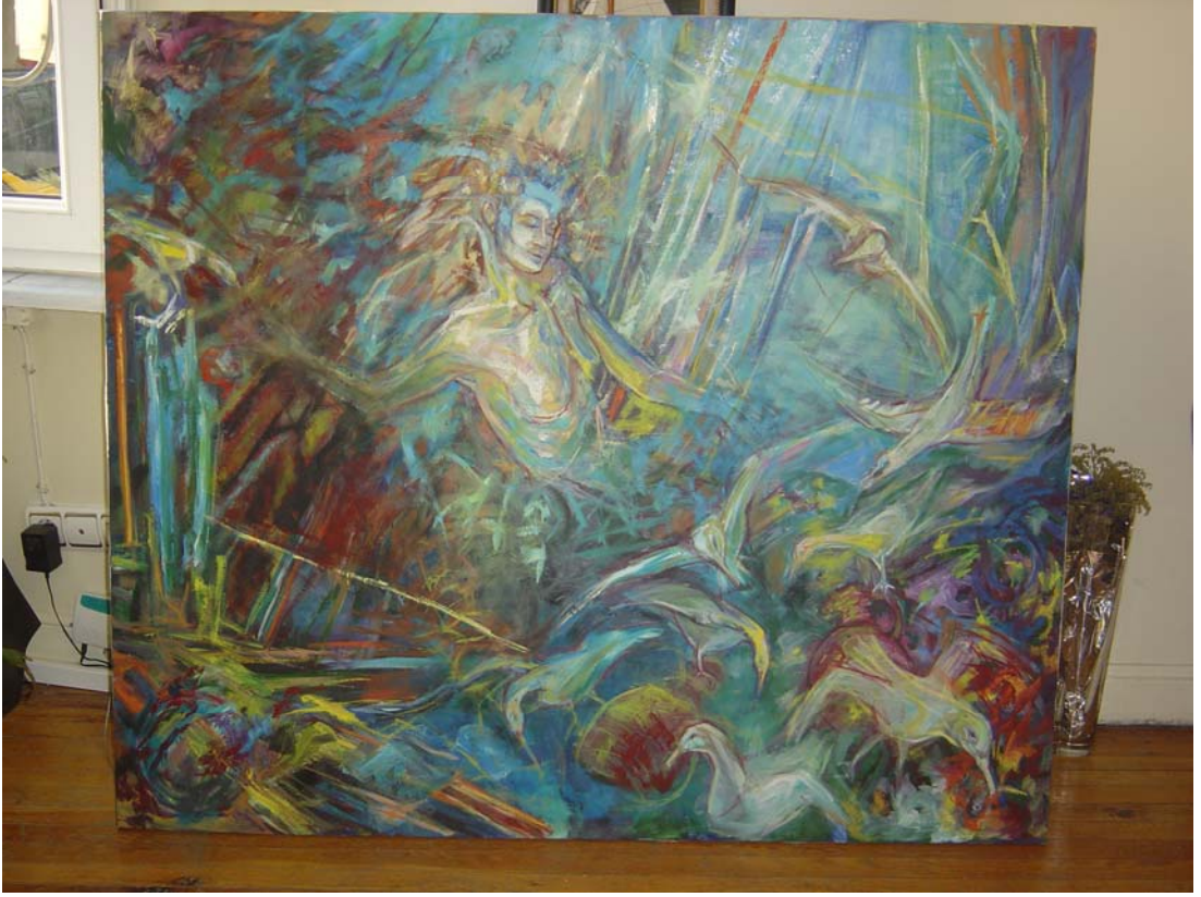
Resim 5.1.d. 'isimsiz' 150x140 cm Tual üzerine yağıboya