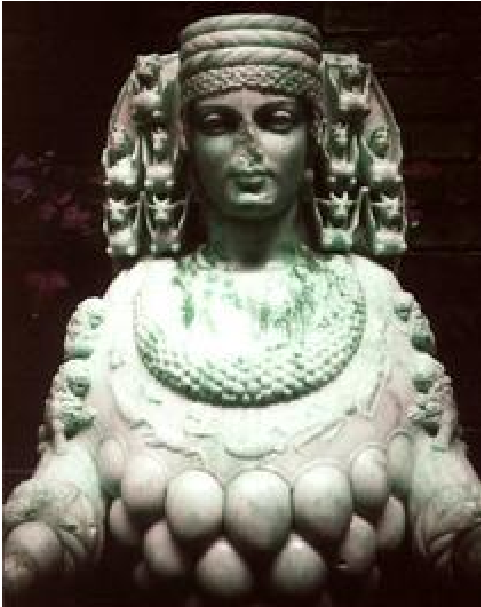
Resim 4.1.1.a. .... Tanrıça Kibele

ulaşılınca çıktı ortaya. Mesih ile bu figür kalça kısmından birleşmiş geriye doğru eşit biçimde yaslanmaları sonucu da aralarında ki boşlukta şekil olarak; kadın rahminin de sembolü olan aynı zamanda Hıristiyanlıkta kutsal kâse sembolü olan ters V oluşuyordu. İki figürü çizgisel bir kompozisyon olarak algılasak ise M harfi göze çarpıyordu. Tüm bunlar olası bir sembol oyunudur. Ama zaten kilise ile inanç düzeyinde anlaşmamış olan Leonardo'nun aldığı kilise siparişlerinde bile kendini ifade etmenin yolunu Rönesans anlayışına uygun bir biçimde sergilediğini biliyoruz.