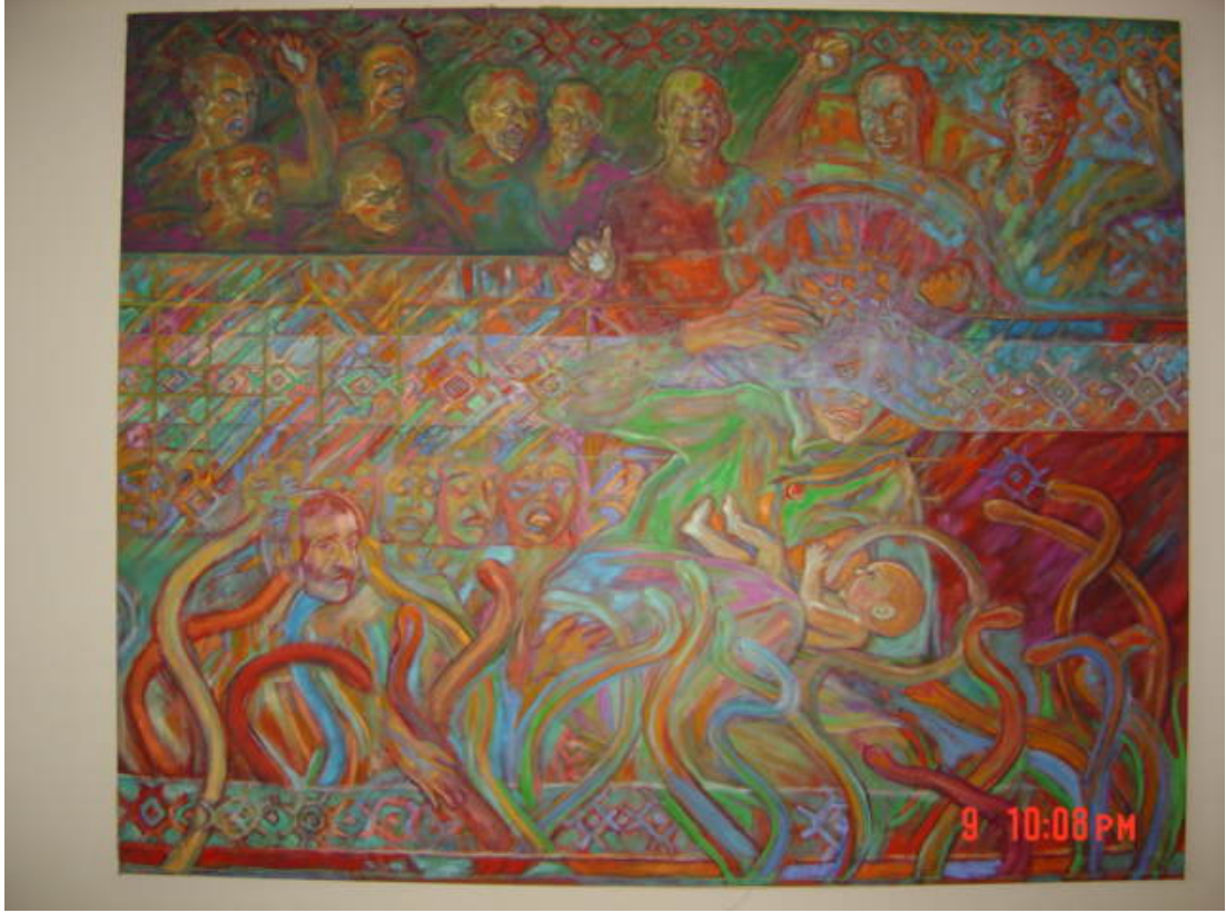
Resim 5.1.a. 'recm edilen kadın' 150x140 cm Tual üzerine yağlıboya

kullandığı işaret eden eli ile vaftizci Yahya çalışmasında yalın fon içerisinde dikkat çeken ve sol üst köşeyi işaret eden eline hem gönderme hem de onun karşıtıdır.