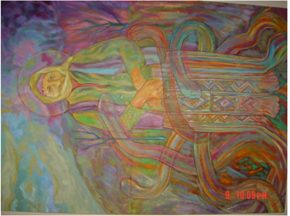
Resim 5.1.e. 'isimsiz' 70x100 cm Tual üzerine yağıboya