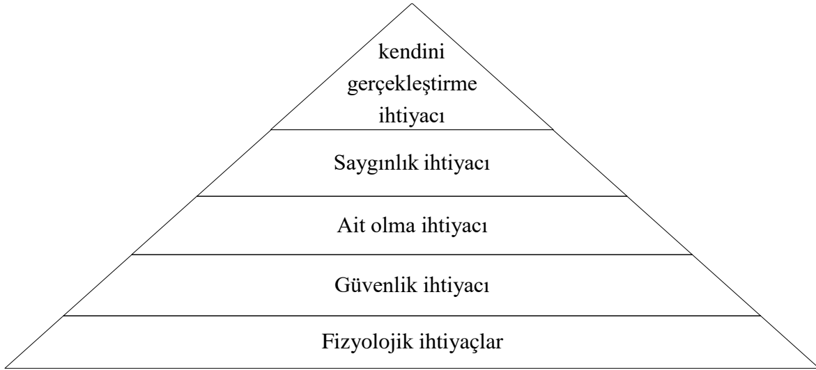
Şekil 2.1. Maslow'un İhtiyaçlar Hiyerarşisi