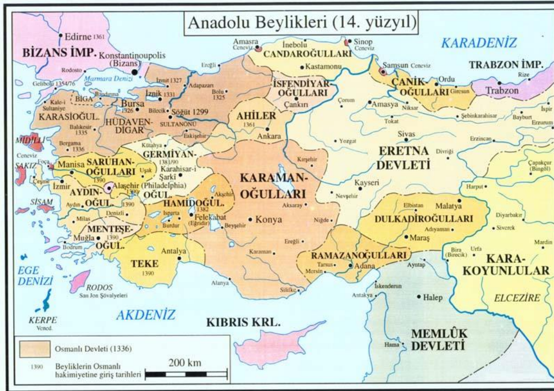
Harita 2. İlhanlıların Yıkılmasının Ardından Anadolu