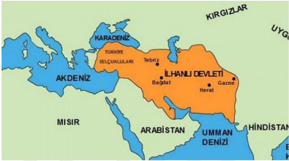
Harita 1. İlhanlı Devleti'nin Yayıldığı Coğrafya