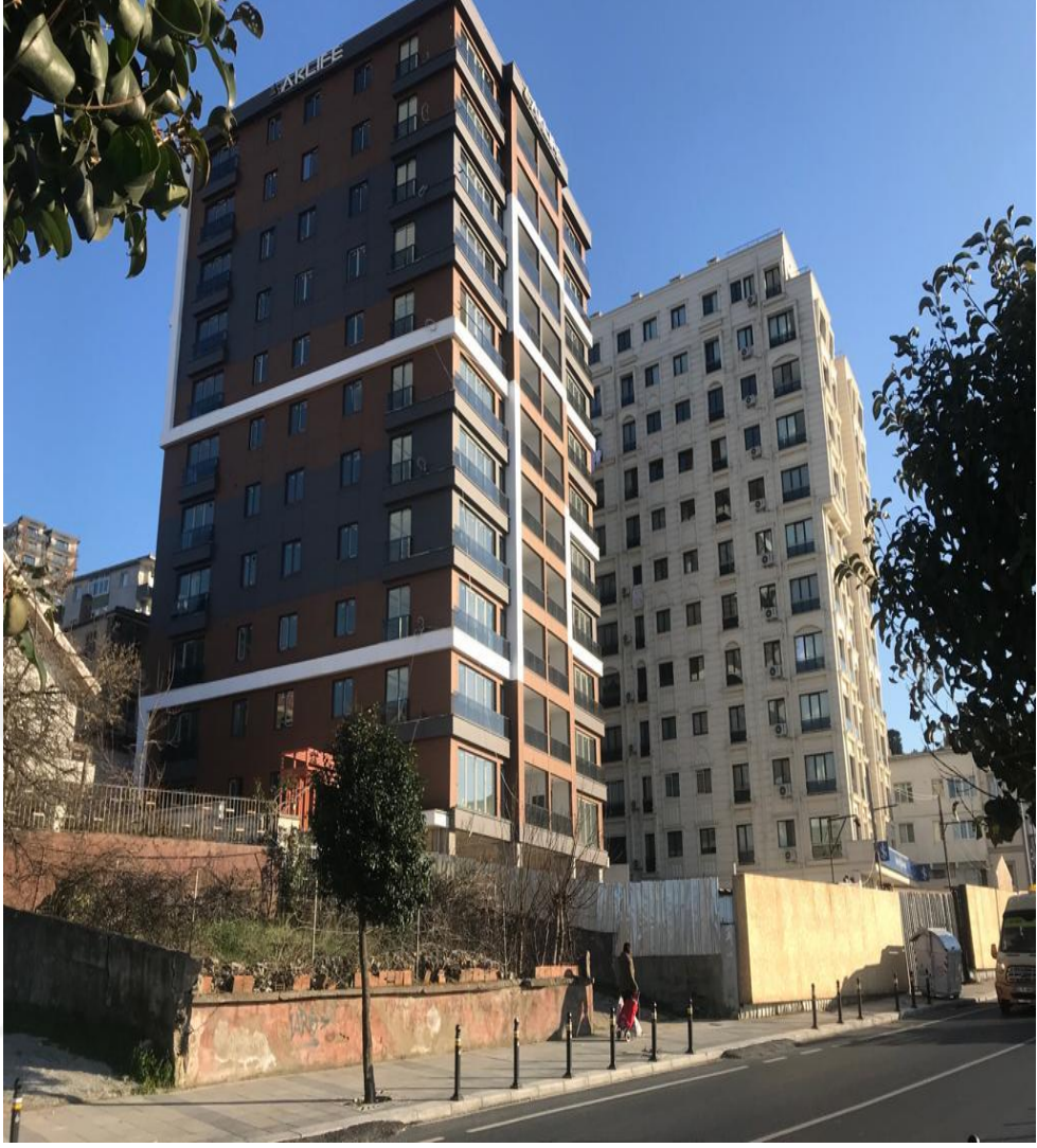
Şekil 4.20: Kanarya Mahallesiindeki Kentsel Dönüşümle Yapılan Yeni Yapı Örneği (Tez yazarı tarafından oluşturulmuştur (2019))