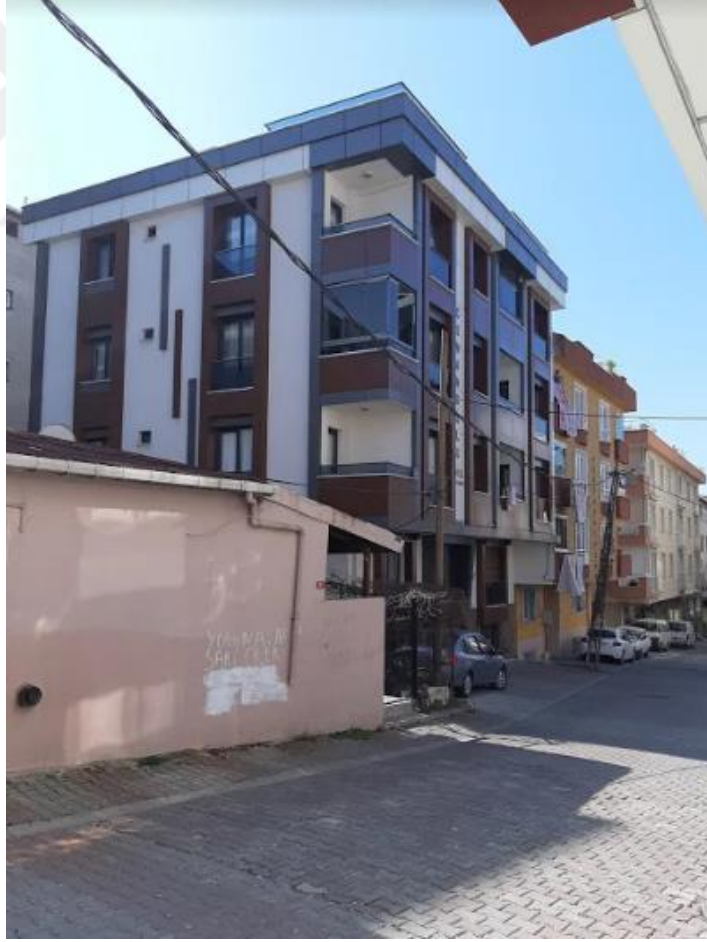
Şekil 4.16: Kanarya Mahallesiindeki Kentsel Dönüşümle Yapılan Yeni Yapı Örneği (Tez yazarı tarafından oluşturulmuştur (2019))