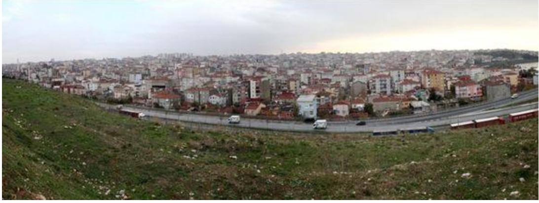
Şekil 4.8: Kanarya Mahallesi Evlerin Genel Görünümü