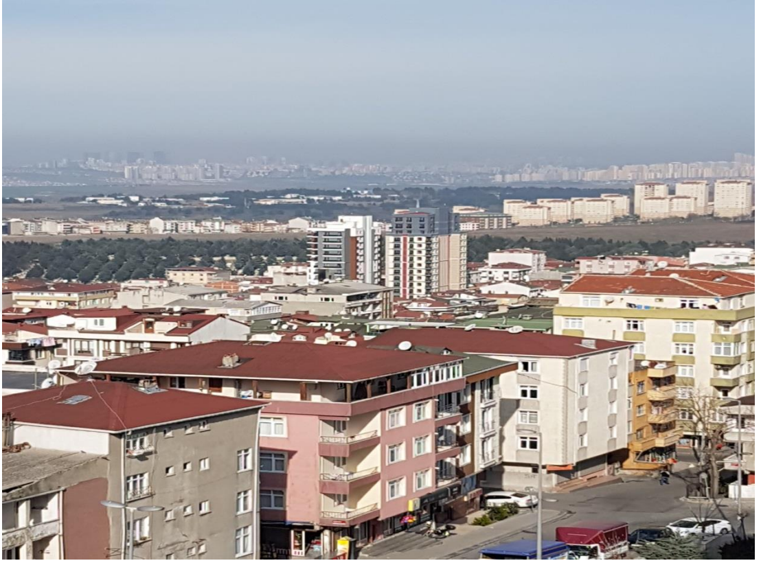
Şekil 4.23: Kanarya Mahallesiindeki Kentsel Dönüşümle Yapılan Yeni Yapı Örneği (Tez yazarı tarafından oluşturulmuştur (2019))

Aşağıdaki resimlerden de yapılan ada bazlı yüksek binaların mahalle içerisinde nasıl görüldüğü uzaktan bakış açısıyla görülebilmektedir.