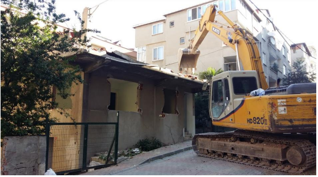
Şekil 4.12: Kentsel Dönüşüm Kapsamında İşlem Gören Eski Bina Örneği (Tez yazarı tarafından oluşturulmuştur (2019))