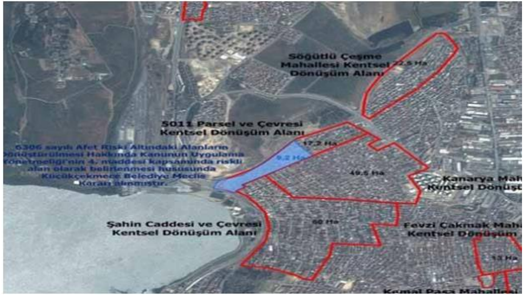
Şekil 4.4: Kanarya Mahallesi Kentsel Dönüşüm Alanları