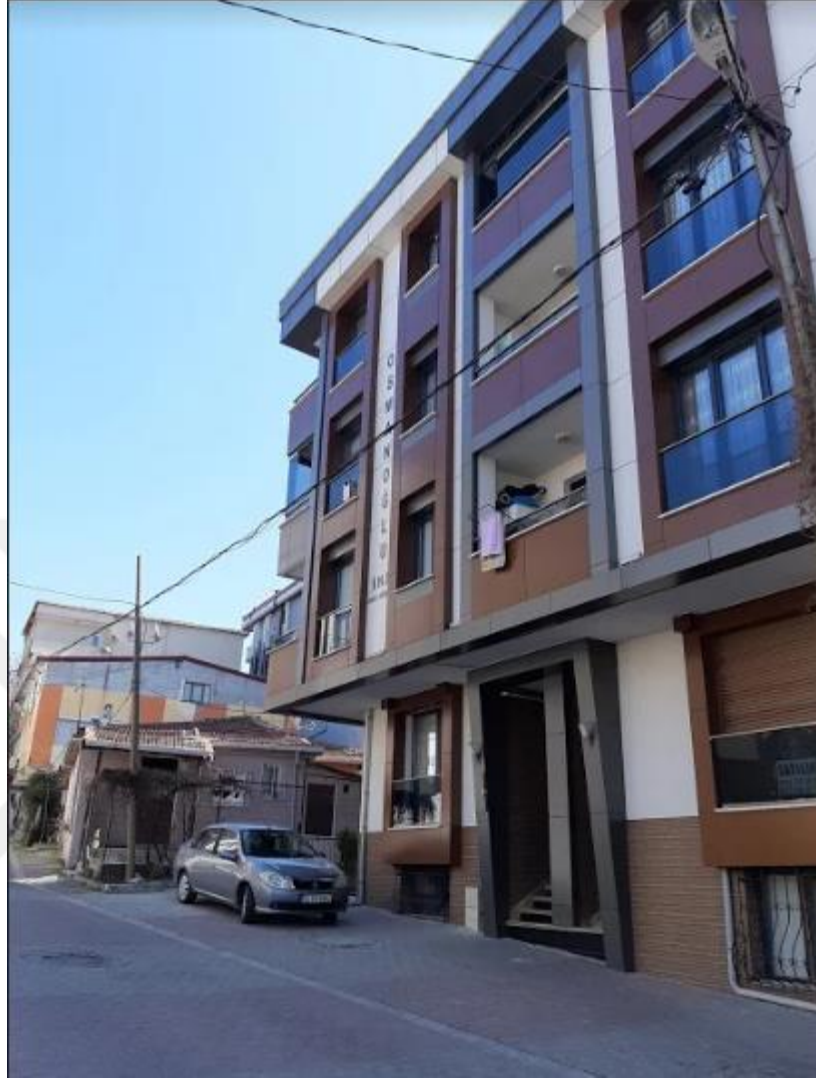
Şekil 4.17: Kanarya Mahallesiindeki Kentsel Dönüşümle Yapılan Yeni Yapı Örneği (Tez yazarı tarafından oluşturulmuştur (2019))

Yukarıdaki resimlerde görülen uygulamalar üzerinde tek katlı müstakil yapı bulunan parsellerde gerçekleşmiş eski yapı yıkılmış yerine 10 dairesi modern bir bina yapılmıştır. Yerinde dönüşüm olarak adlandırılan bu tür kentsel dönüşüm uygulamaları kanarya mahallesiindeki kentsel dönüşüm uygulamalarının büyük çoğunluğunu oluşturmaktadır. Bu tür dönüşüm ile kentsel dönüşümden beklenen yapı kalitesi sağlanmaktadır ancak otopark, yeşil alan, oyun parkı gibi hiçbir sosyal donatıya sahip olmadığı için beklenen sosyal dönüşüm ve refah artışı bu tür uygulamalarda sağlanamamaktadır. Bu şekilde yapılan kentsel dönüşüm uygulamaları çarpık kentleşmenin gelecek nesillere aktarılmasına sebep olabileceği gibi ileride bu alanların tekrar komple dönüşüme girmesi ihtiyacı