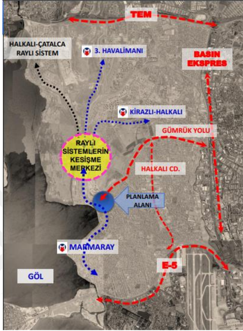
Şekil 4.6: Proje Kapsamında Hedeflenen Ulaşım Yolları

İstanbul Küçükçekmece Belediyesi, söz konusu riskli alanın 2 paftalık 1/5000 ölçekli nazım imar planı ve 3 paftalık 1/1000 ölçekli uygulama imar planını hazırlanmıştır. Planlama alanının yüzde 40'ı Ticaret-Konut Alanı olarak, yüzde 9'u İlkokul, yüzde 3'ü Cami, yüzde 4'ü Kapalı Spor Tesisi ve yüzde 12'si Park Alanı olarak görülmektedir. Konutlar zemin+12 kat olarak planlanmıştır. İmar planına göre "Riskli alan" ilan edilen bölgenin göl tarafına park ve cami, gümrük tarafına ise okul ve park yapılacaktır. Konut ve kapalı spor salonu ise bu iki bölümün arasında kalacaktır (EK – 1, EK – 2).