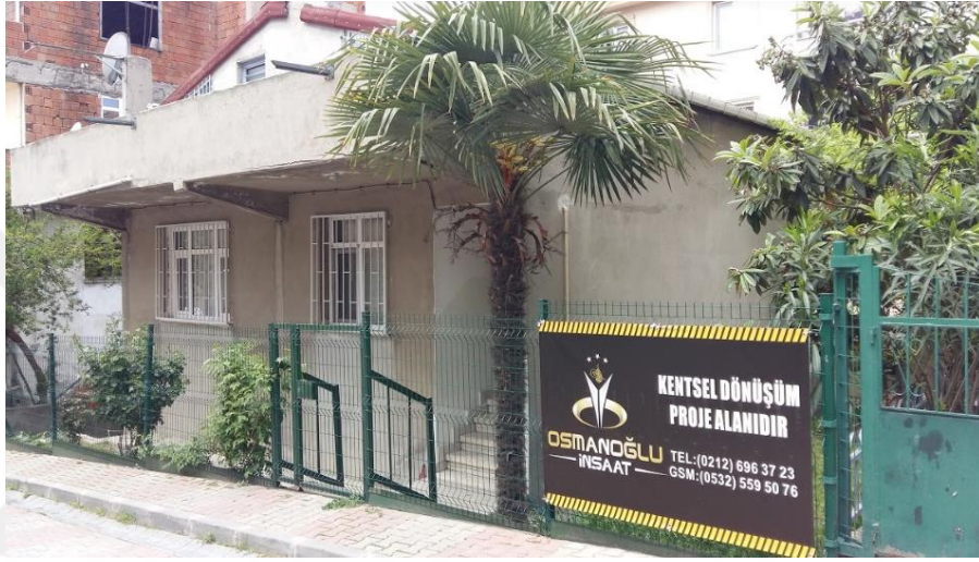
Şekil 4.11: Kanarya Mahallesindeki Eski Konut Stoğu Örneği (Tez yazarı tarafından oluşturulmuştur (2019))

Kanarya mahallesinde kentsel dönüşüm uygulaması yapılan bölgelerin ortak özellikleri; mevcut konut stoğunun oldukça eski olması, bahsi geçen alanlarda köhne bir görüntü sergileyen sanayi sitelerinin ve fabrikaların bulunması, sokak ve caddelerin ihtiyaca cevap veremeyecek nitelikte dar olması ve sosyal donatı gereksiniminin oldukça yüksek olmasına rağmen neredeyse bu tür yapılara ve alanlara hiç rastlanılamamasıdır.