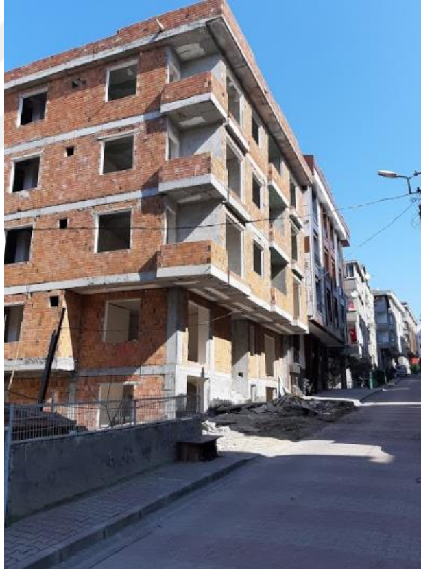
Şekil 4.13: Kentsel Dönüşüm Kapsamındaki Bir Binanın Yapım Aşamasındaki Görüntüsü (Tez yazarı tarafından oluşturulmuştur (2019))