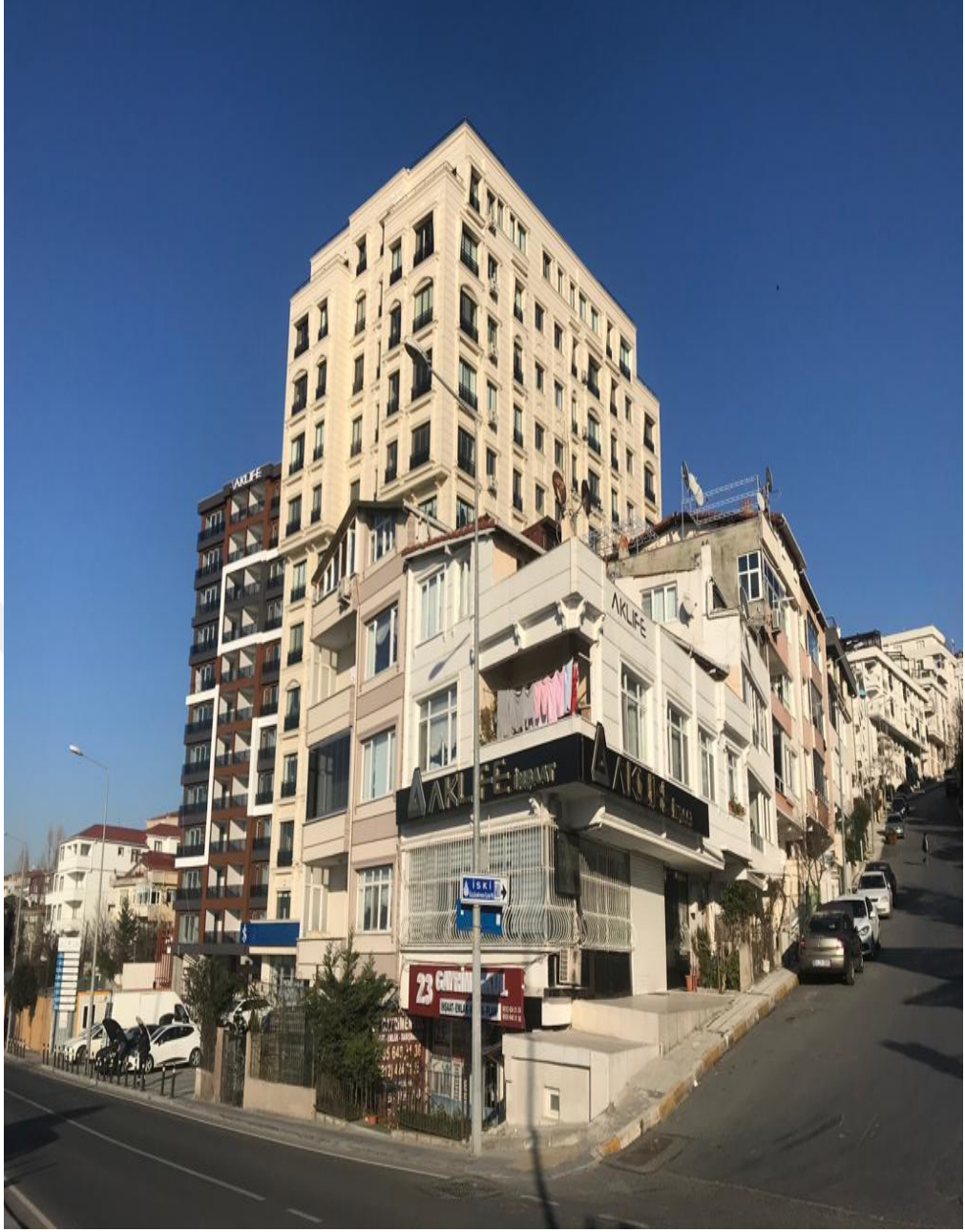
Şekil 4.22: Kanarya Mahallesiindeki Kentsel Dönüşümle Yapılan Yeni Yapı Örneği