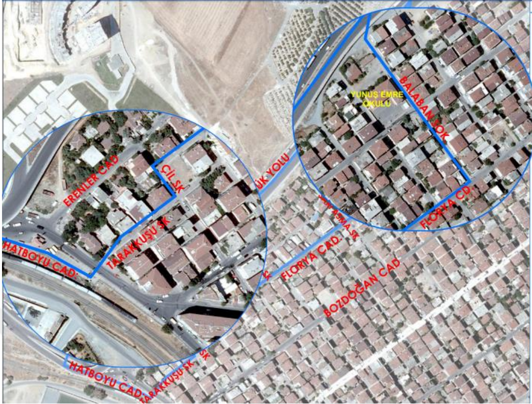
Şekil 4.10: Riskli Alan Sınırına Giren Cadde Ve Sokaklar