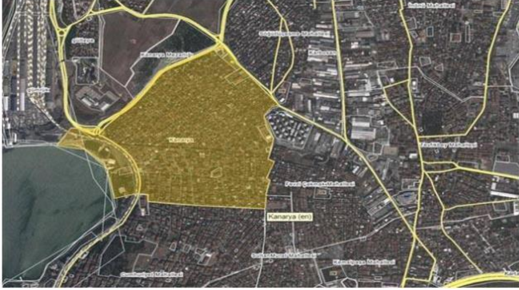
Şekil 4.5: Kanarya Mahallesi Fiziksel Görünüm