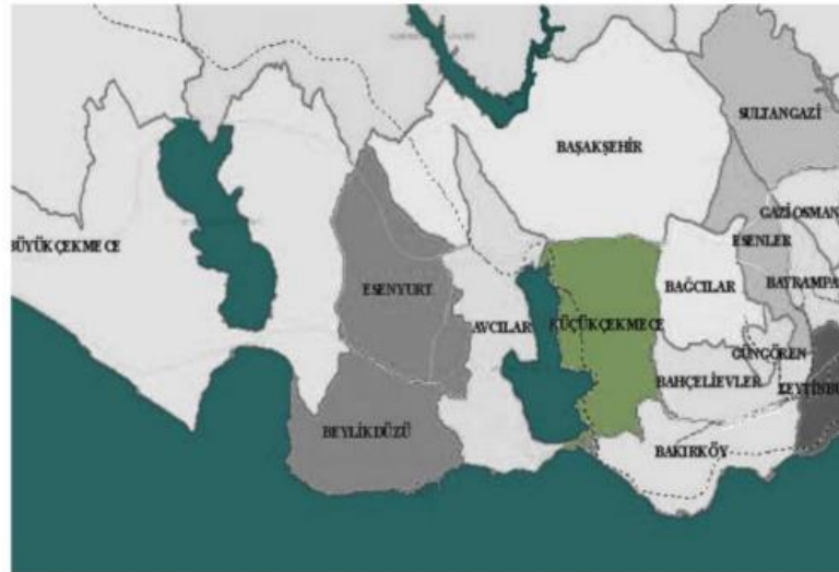
Şekil 4.1: Küçükçekmece Coğrafi Konumu

İstanbul'un batı kısmında yer alan Küçükçekmece, doğuda D-100 TEM bağlantı (basın Express yolu) yolundan batıda aynı zamanda ilçeye de adını veren Küçükçekmece Gölü kıyısına kadar uzanmaktadır. Güney sınırını Marmara Denizi, kuzey sınırını ise TEM (E80) otoyolu oluşturmaktadır. Küçükçekmece ilçesi; Bakırköy, Bahçelievler, Bağcılar, Başakşehir ve Avcılar ilçeleri ile komşudur. İlçenin yüzölçümü 37,75 km 2 olup 47,33 km çevre uzunluğuna sahiptir. Küçükçekmece aynı zamanda Gebze'den Halkalı'ya kesintisiz şehiriçi ulaşım sağlayan ve aynı zamanda Avrupa'ya uzanan demiryolu ağı üzerindedir. Atatürk Havaalanına uzaklığı ise 2 km'dir. 2018 yılı verilerine dayalı nüfus sayımına göre ilçe nüfusu 770.317'dir (Küçükçekmece Belediye Başkanlığı, 2018).