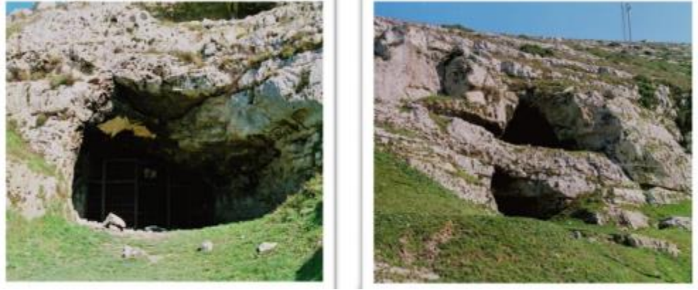
Şekil 4.3: Yarımburgaz Mağarası (Yılmaz, 2010)

İstanbul ve yakın çevresinde ilk yaşam izlerinin Küçükçekmece civarında görüldüğü ve bu belirtilerin geçmişinin binlerce yıla dayandığı bilinmektedir. “Yarımburgaz Mağarası, Küçükçekmece Gölü ve çevresinde yapılan arkeolojik kazılarda ortaya çıkan bulgular, Küçükçekmece’ye Paleolitik dönemde yerleşildiğini ve buraya yerleşen insanların balıkçılık, avcılık ve tarımla uğraştıklarını ortaya koymaktadır.” (Şahin, 2010: 16).