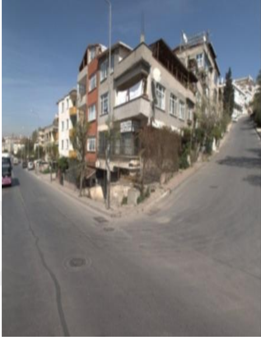
Şekil 4.21: Kanarya Mahallesiindeki Kentsel Dönüşümle Yapılacak Olan Alann Eski Görüntüsü