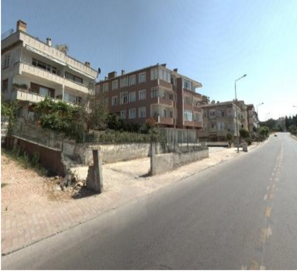
Şekil 4.19: Kanarya Mahallesindeki Eski Konut Stoğu Örneği (Tez yazarı tarafından oluşturulmuştur (2017))

derinleşmesine sebep olabileceğini söyleyebiliriz. Söz konusu alanda köşe parseldeki eski binalarla anlaşma sağlanamadığı için projeye dahil edilememiştir, belediyenin de arsa sahiplerini zorlayıcı veya yönlendirici bir çalışması olmadığı için bu şekilde kalmış ve kentsel dönüşümden beklenen amaç ve fayda sağlanamamıştır.