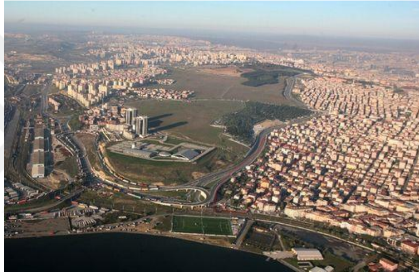
Şekil 4.9: Proje Kapsamındaki Planlama Alanının Görüntüsü

Proje kapsamındaki genel hükümler ek-1’de belirtilmiştir.