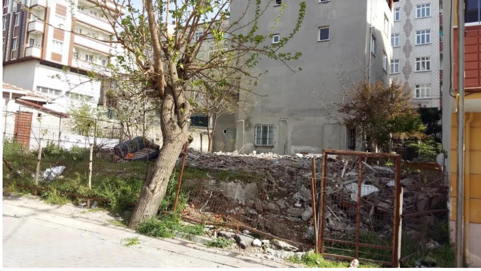
Şekil 4.15: Kanarya Mahallesiindeki Kentsel Dönüşüm Kapsamında Yıkılmış Eski Yapı Örneği (Tez yazarı tarafından oluşturulmuştur (2019))