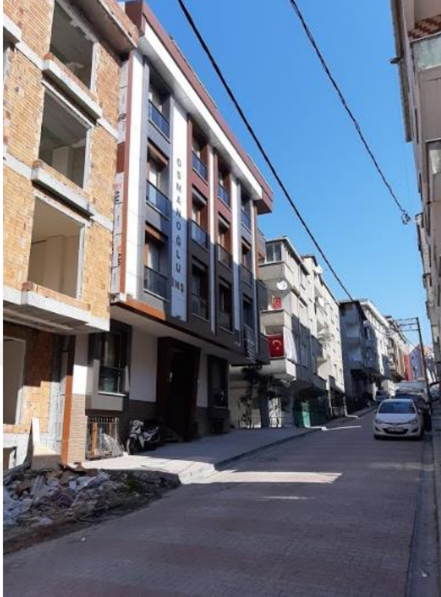
Şekil 4.14: Kanarya Mahallesiindeki Kentsel Dönüşümle Yapılan Yeni Yapı Örneği (Tez yazarı tarafından oluşturulmuştur (2019))