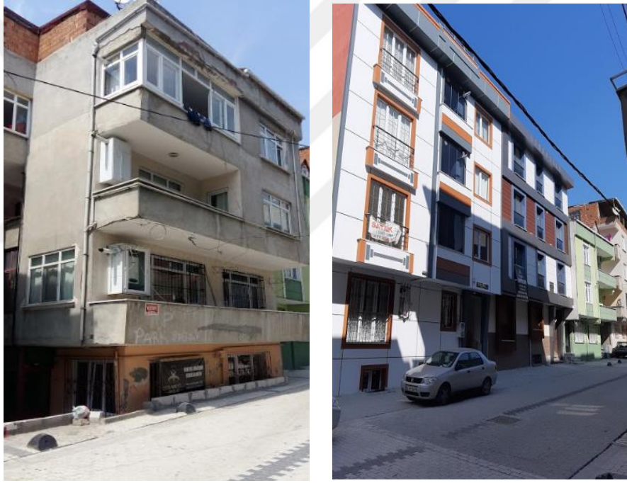
Şekil 4.18: Kanarya Mahallesi'ndeki Kentsel Dönüşümle Yenilenmiş Olan Parselin Eski ve Yeni Görüntüsü (Tez yazarı tarafından oluşturulmuştur (2019))

Alttaki resim 478 ada, 26 pafta da uygulanan kentsel dönüşüm uygulamasına aittir, 96 metrekare bağımsız tek arsada yapılan bu dönüşüm uygulaması da yukarı bahsedilen yerinde dönüşüme çarpıcı bir örnektir. Eskiden 4 daire olan bina yenilenmiş ve yerine yine 4 daire olan bir bina yapılmıştır.